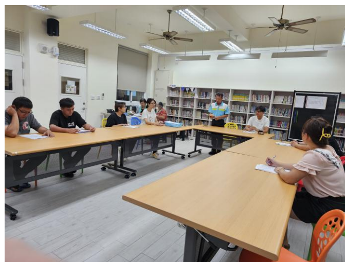
說明:每學期初邀請社區家長協力健促推動