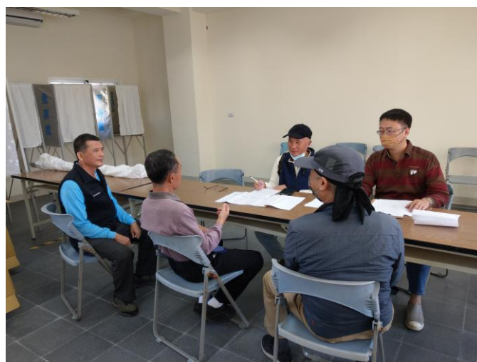
說明:運動設施邀請里長針對里民需求提出建議