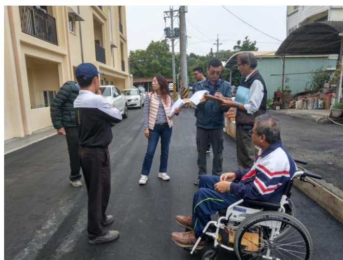
說明:平權設施邀請社區里民檢視是否符合需求