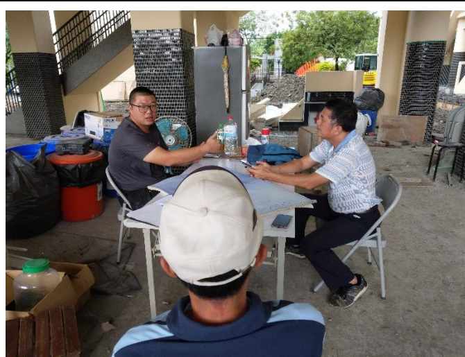
說明:球場重建邀請里長針對里民需求提出建議