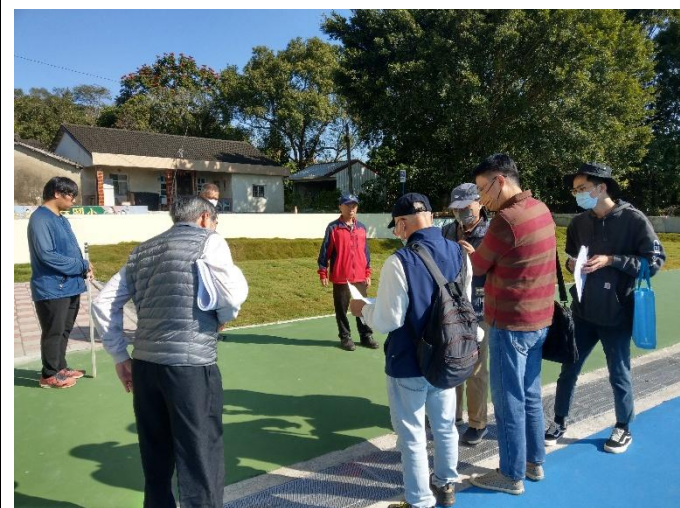
說明:運動設施邀請里長針對里民需求提出建議