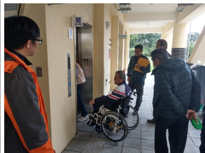
說明:平權設施邀請社區里民檢視是否符合需求