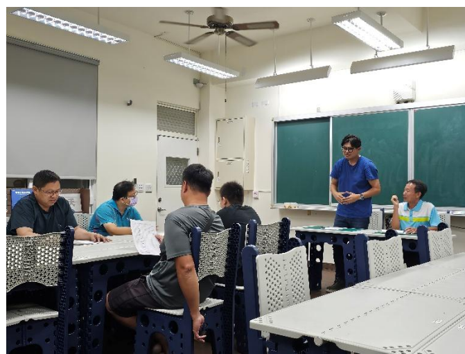
說明:每學期初邀請社區家長協力健促推動