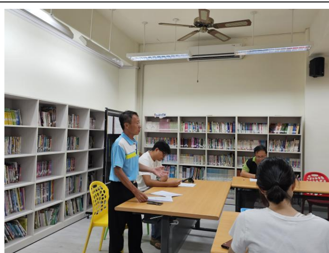
說明:每學期初邀請社區家長協力健促推動