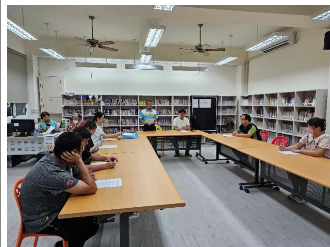
說明:每學期初邀請社區家長協力健促推動