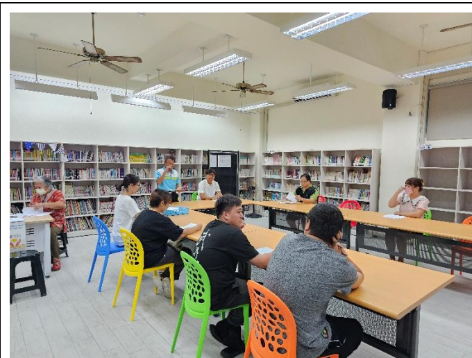
說明:每學期初邀請社區家長協力健促推動