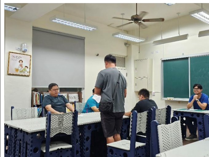
說明:每學期初邀請社區家長協力健促推動