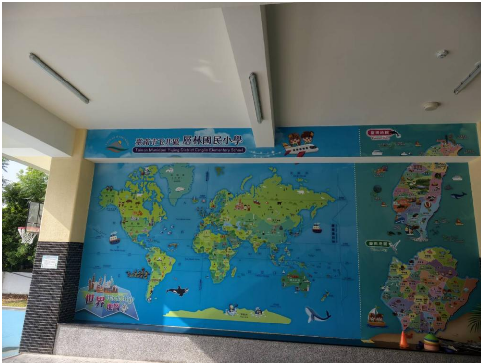
說明：樂活廣場牆面美化布置