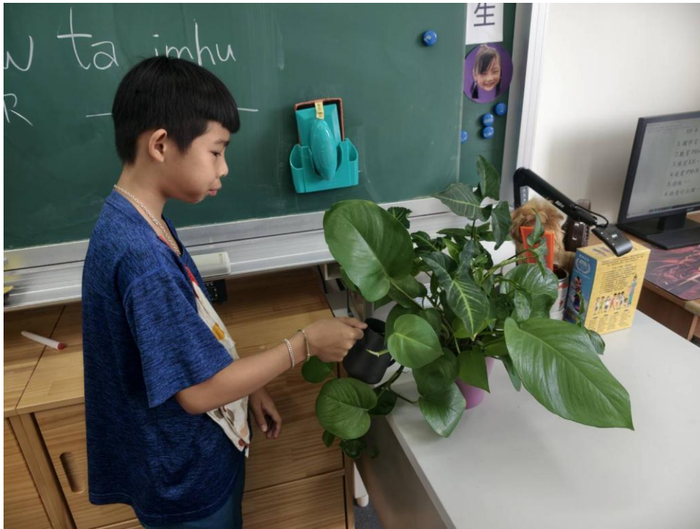
說明：教室內種植植栽與綠美化