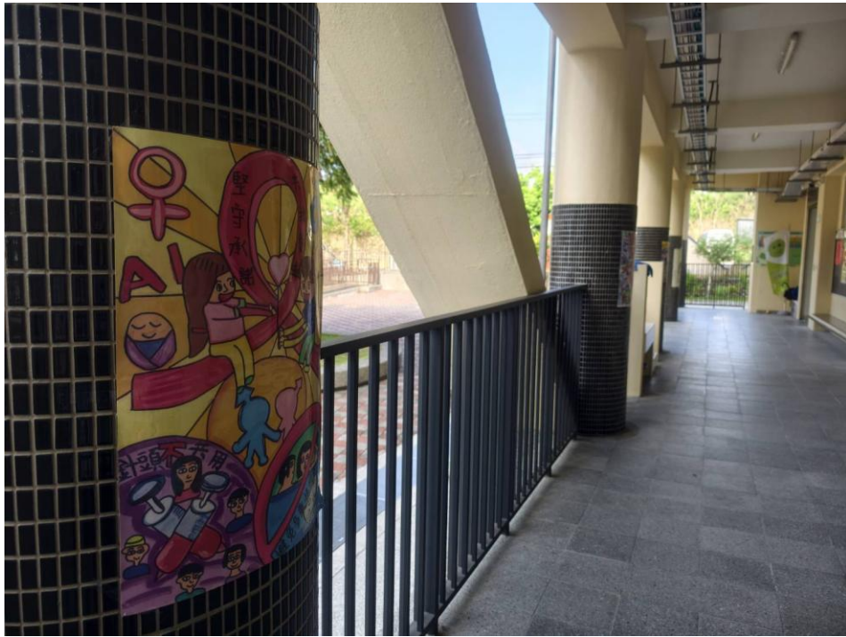
說明：走廊牆面海報美化布置