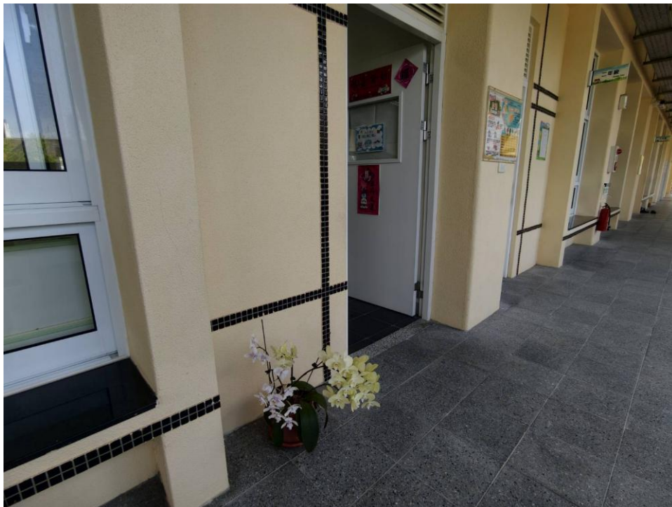
說明：教室外種植花卉與綠美化