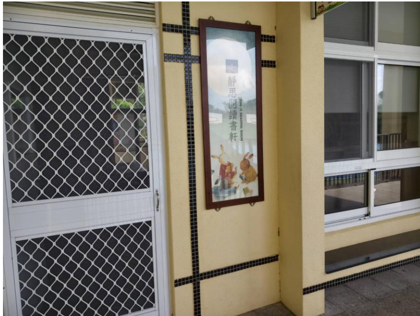
圖-建立良好的溫馨氛圍