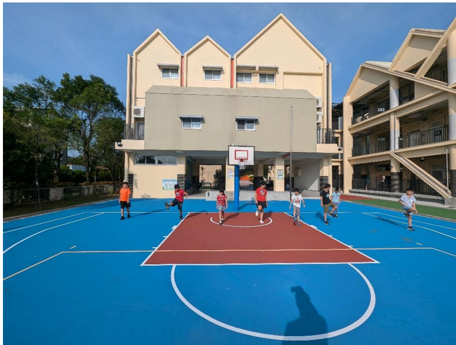
說明：新建籃球場，提供學生良好運動環境