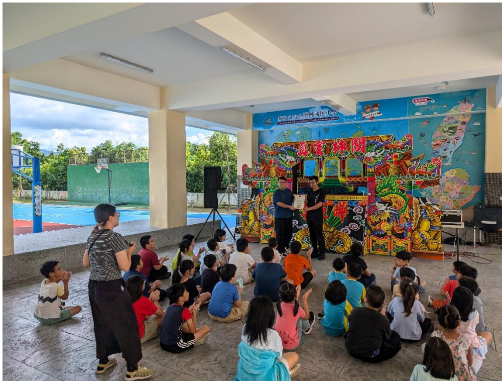
說明：布袋戲戲劇演出活動