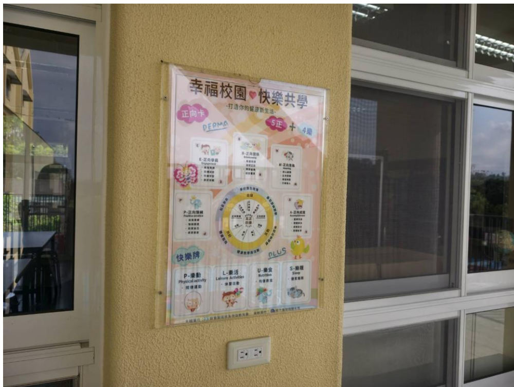
說明：教室外牆面宣導海報與美化