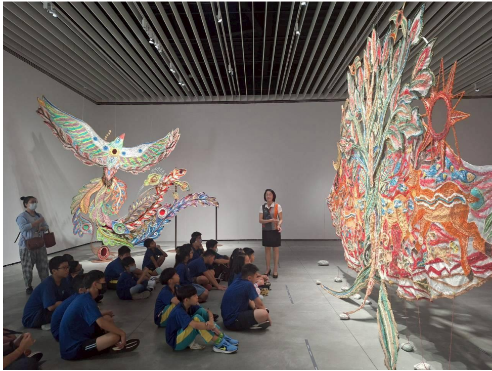
說明：至美術館進行參訪與戶外教育活動