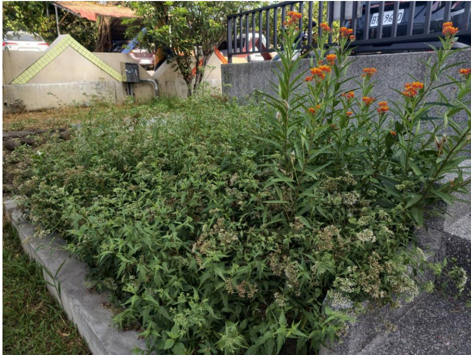
說明：招蜂引蝶蜜源植物種植