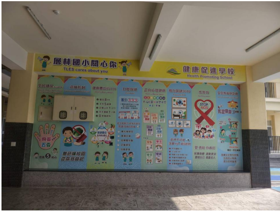
說明：樂活廣場健康促進牆面布置