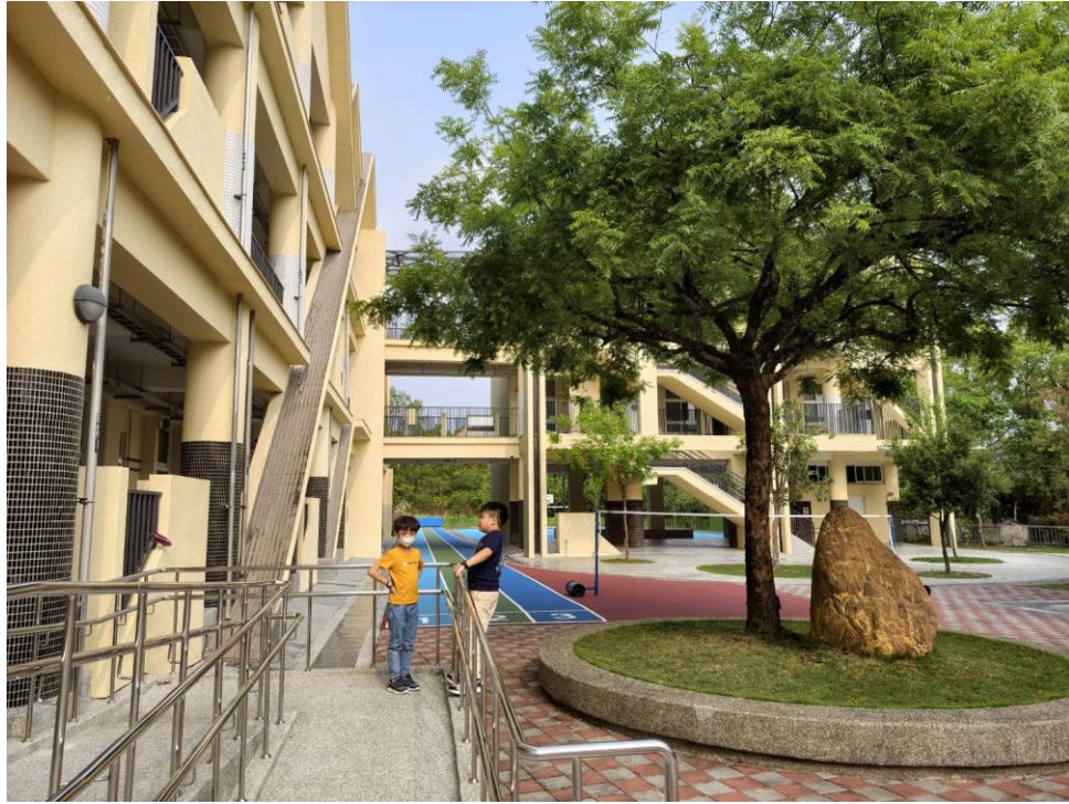
說明：新建校舍提供優質學習環境