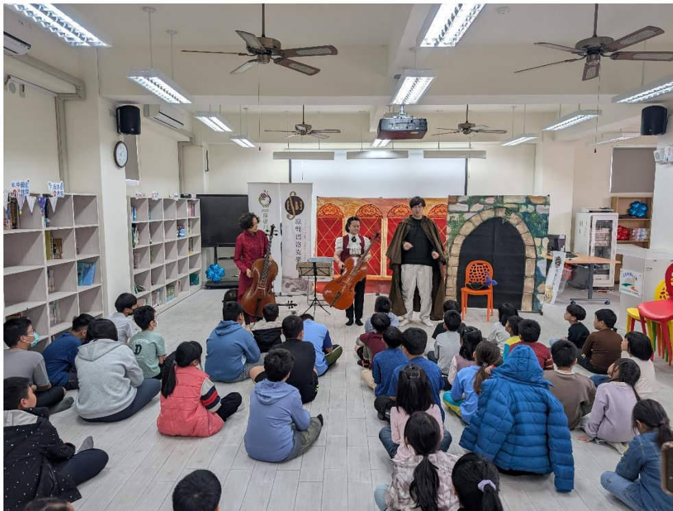
說明：原聲巴洛克樂團進行音樂與戲劇演出