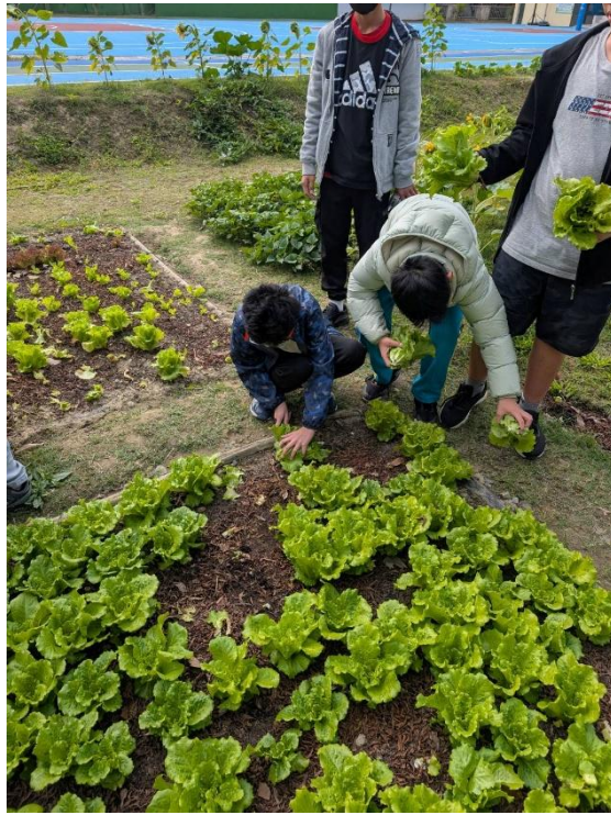
說明：校園農園裡的小小農夫，體驗自然的美好