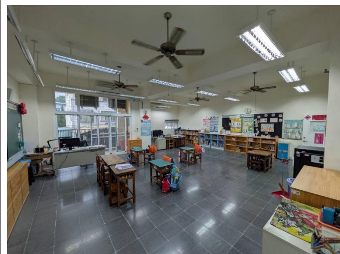
說明: 下課時間，教室空無一人