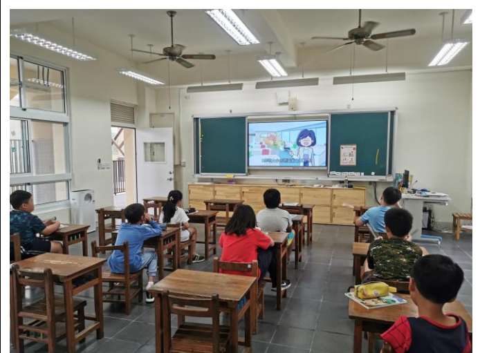
說明：全校執行餐前五分鐘飲食教育