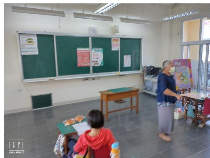
說明:校護入班宣導健促觀念