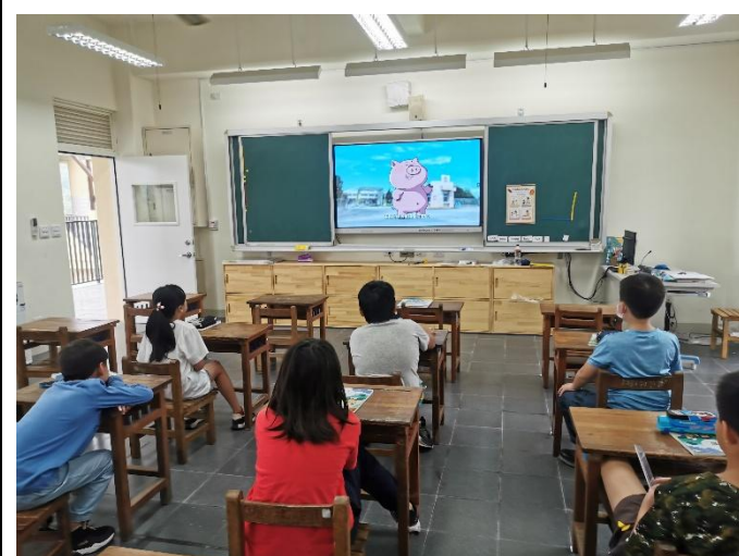
說明：全校執行餐前五分鐘飲食教育