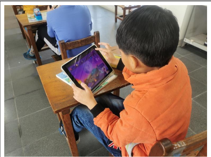
說明：鼓勵學生參加餐前五分鐘測驗