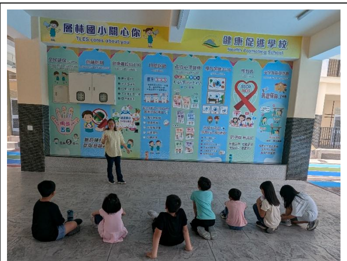
說明：健康課程邀請營養師宣導健促觀念