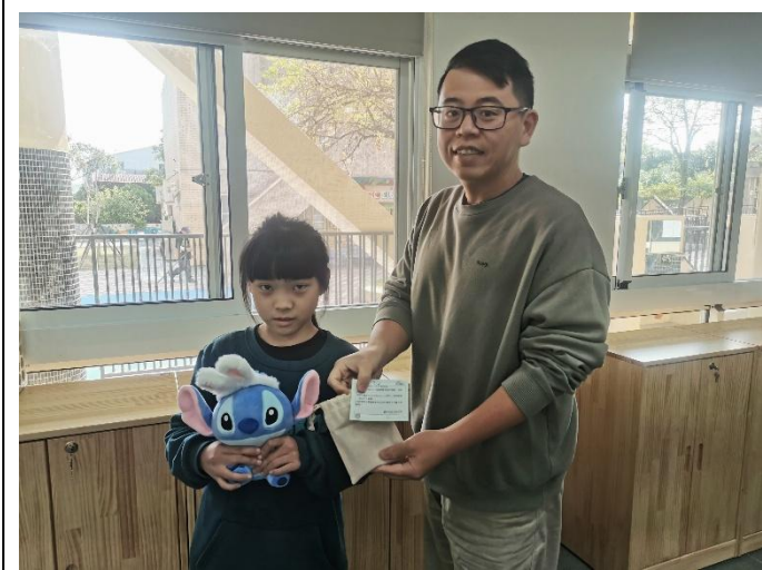
說明：頒發禮品給參加五分鐘測驗獲獎學生