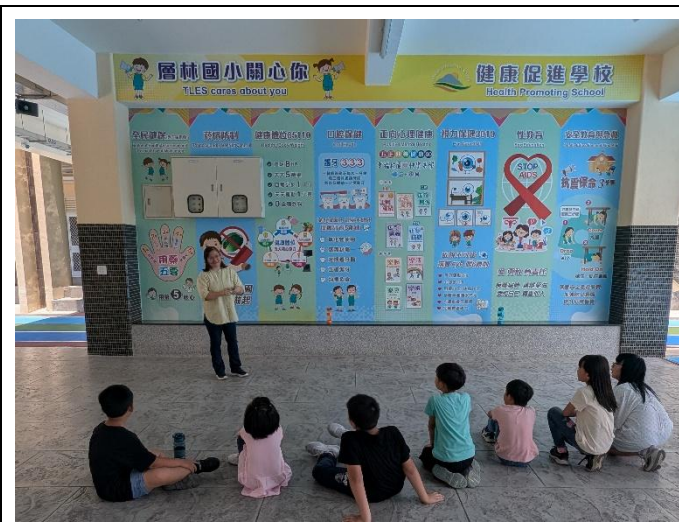
說明：健康課程邀請營養師宣導健促觀念