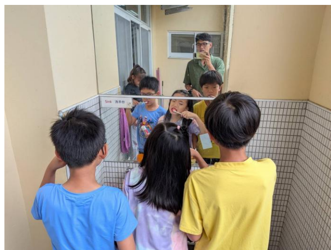
說明:教師指導學生確實潔牙