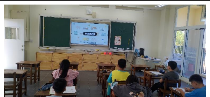
說明：全校執行餐前五分鐘飲食教育