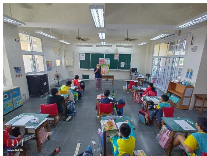
說明: 校護入班宣導健促觀念