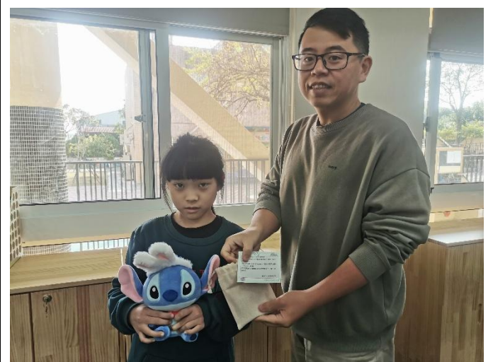
說明：頒發禮品給參加五分鐘測驗獲獎學生