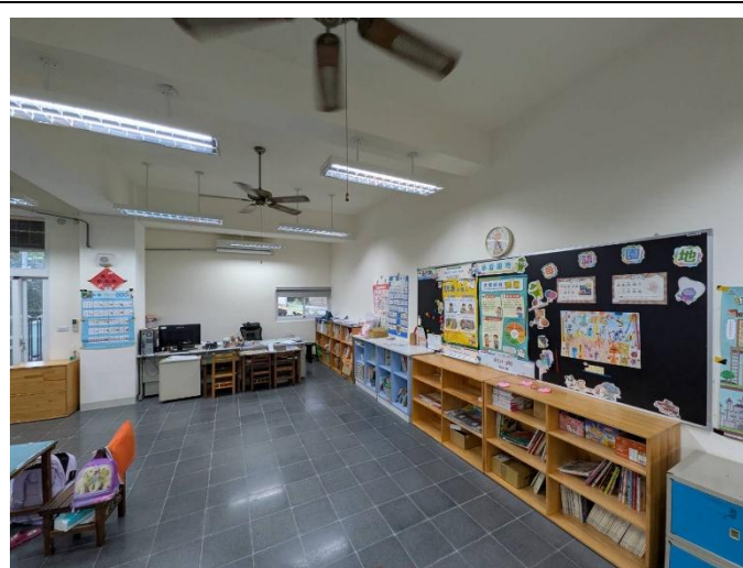
說明:下課時間，教室空無一人