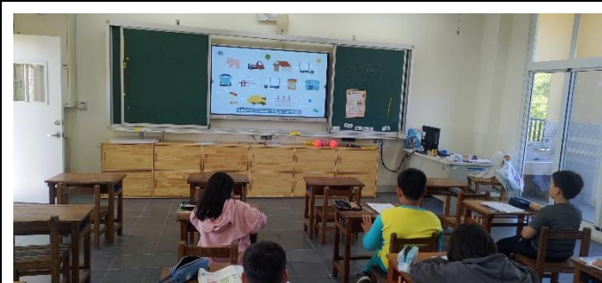
說明：全校執行餐前五分鐘飲食教育