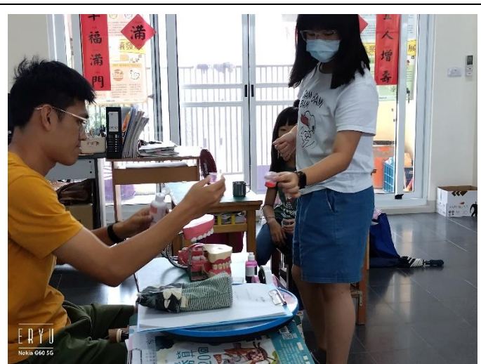
說明：運用牙菌斑顯示劑檢視學生在家潔牙成效