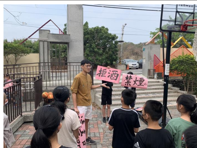
說明：學生擔任健康推廣大使協助宣導