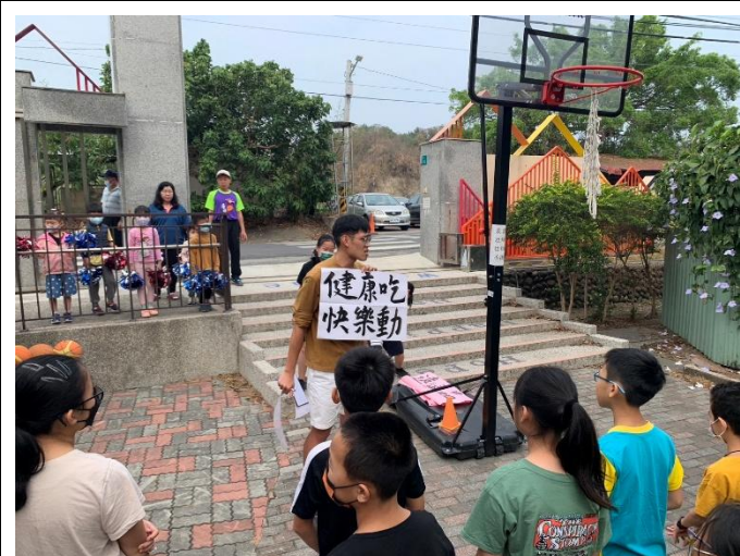
說明：學生擔任健康推廣大使協助宣導