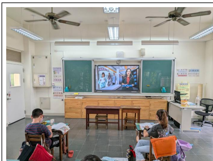
說明：教師透過影片引導學生了解學生倡議精神