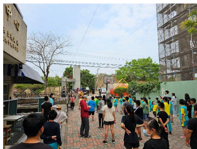
說明：健康推廣大使帶全校師生進行運動