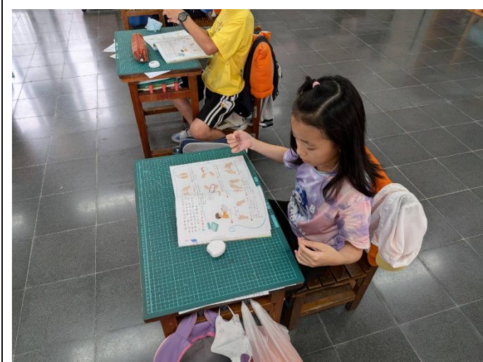
說明:校內潔牙小尖兵選拔，選手學習操作牙線