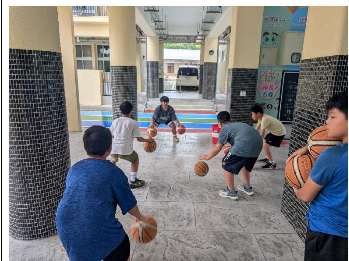
說明:高年級學生擔任倡議角色指導學弟運動技巧