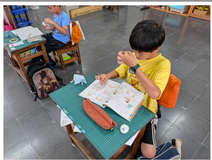
說明:校內潔牙小尖兵選拔，選手學習操作牙線