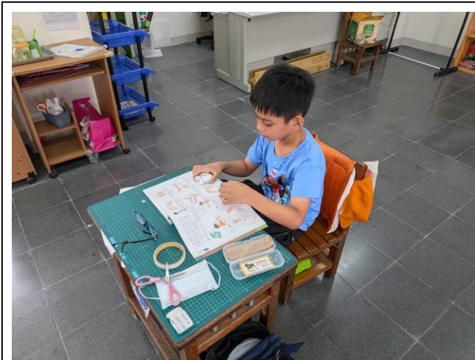
說明:校內潔牙小尖兵選拔，選手學習操作牙線