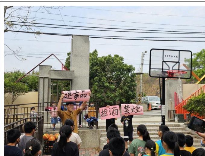
說明：學生擔任健康推廣大使協助宣導