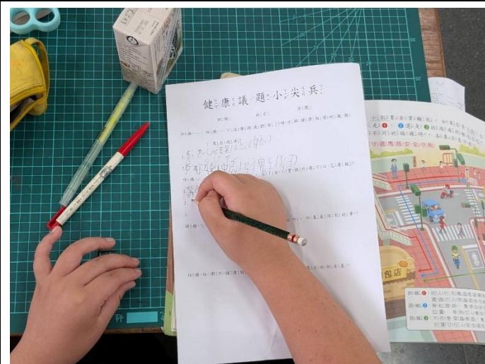
說明：教師運用學習單引導學生思考