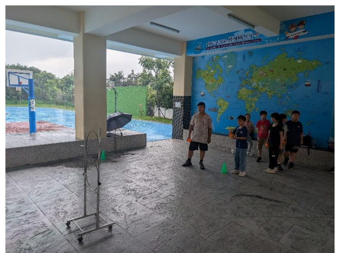
說明:高年級學生擔任倡議角色指導學弟運動技巧