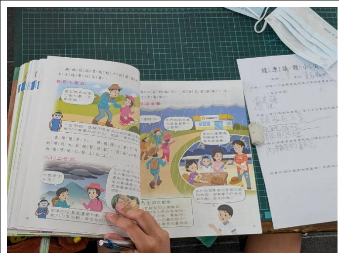
說明：結合健康課程實踐學生倡議