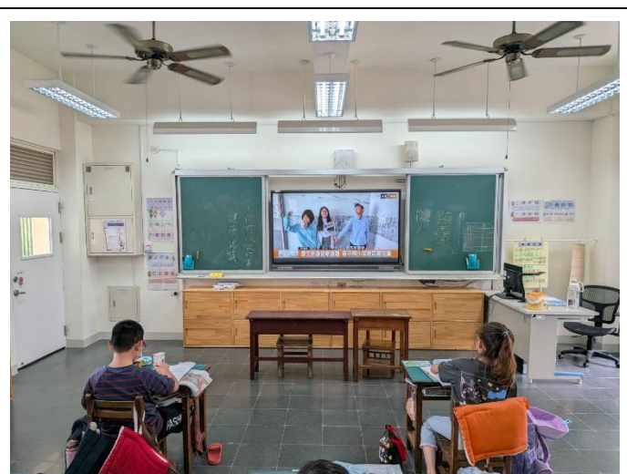
說明：透過觀摩他校學生倡議影片學習運用