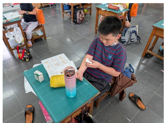
說明:校內潔牙小尖兵選拔，選手學習操作牙線