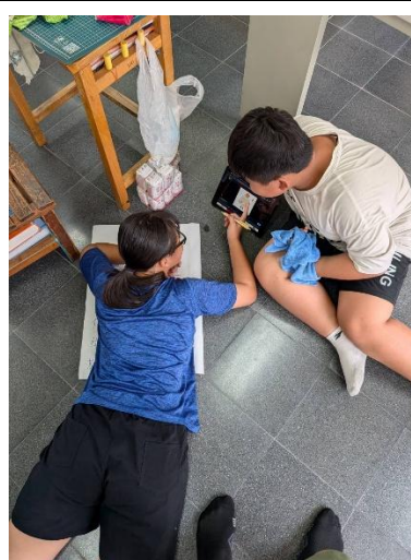
說明：學生製作海報實踐學生倡議