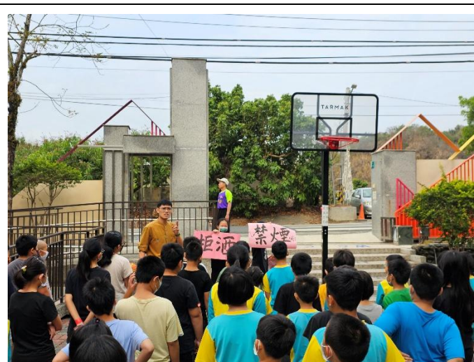
說明：學生擔任健康推廣大使協助宣導