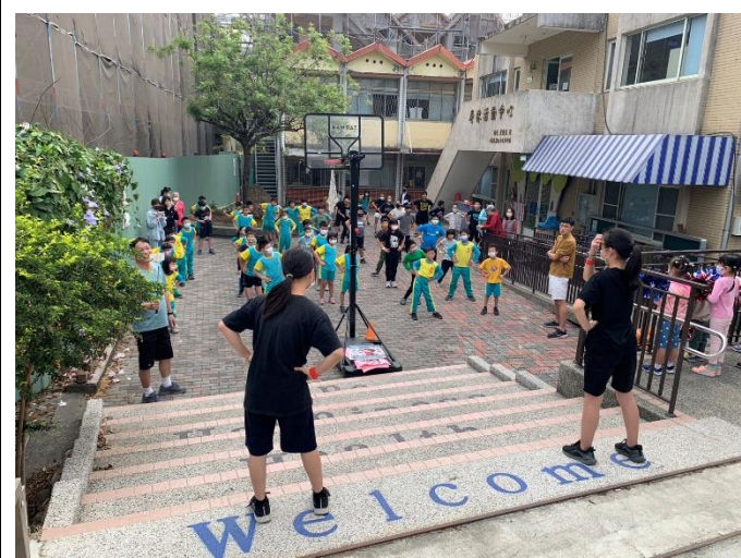
說明：學生擔任倡議角色，推廣運動習慣