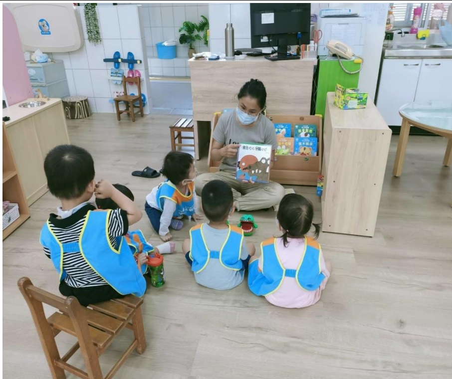
老師透過繪本故事，教導幼童口腔保健的重要性