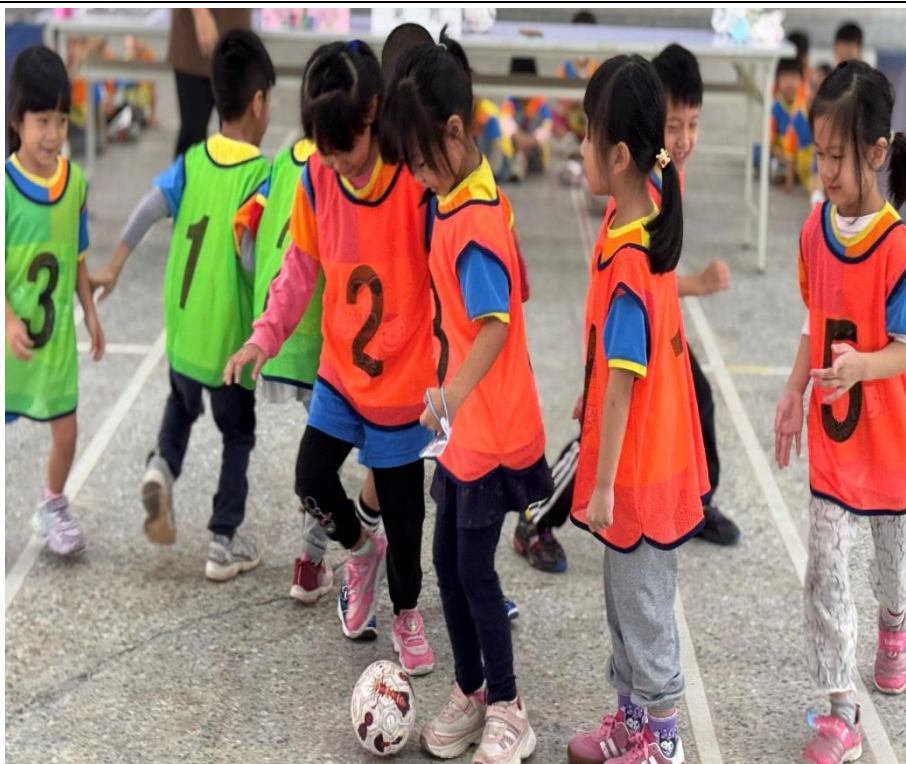
幼兒園班級足球友誼賽-大肌肉伸展運動