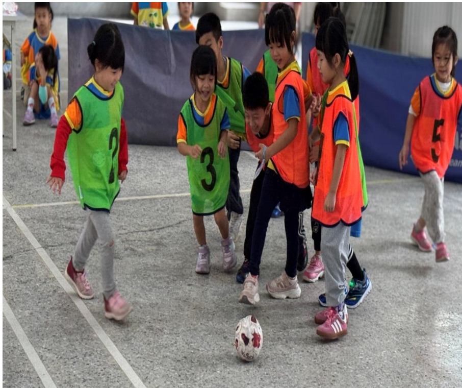
幼兒園班級足球友誼賽-幼童玩得不亦樂乎