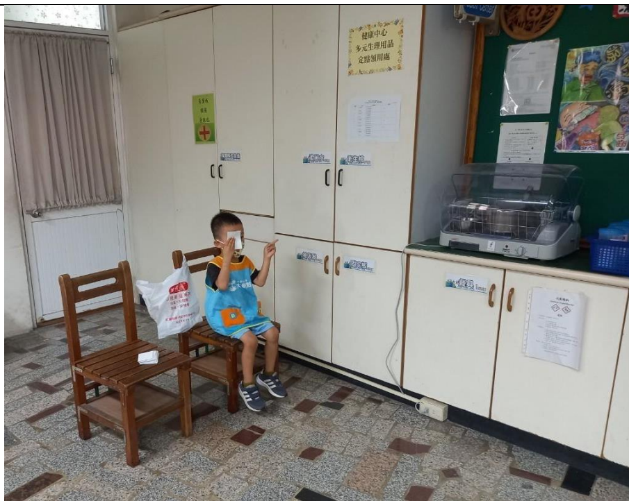
每學期開學之際進行視力檢查