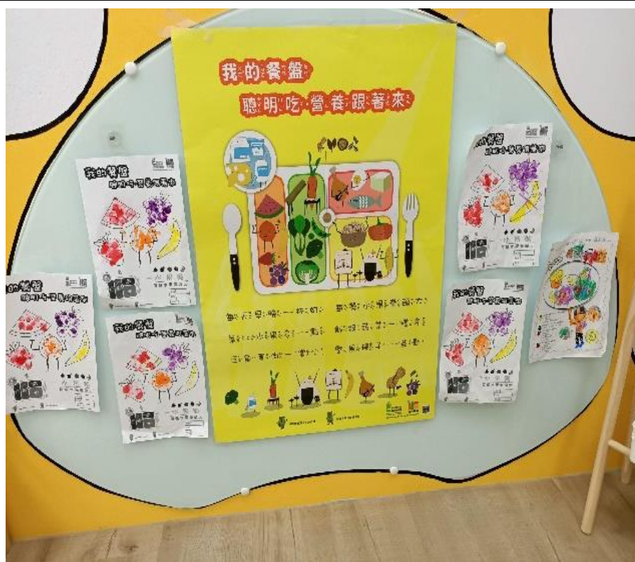
教室情境布置-健康飲食海報介紹