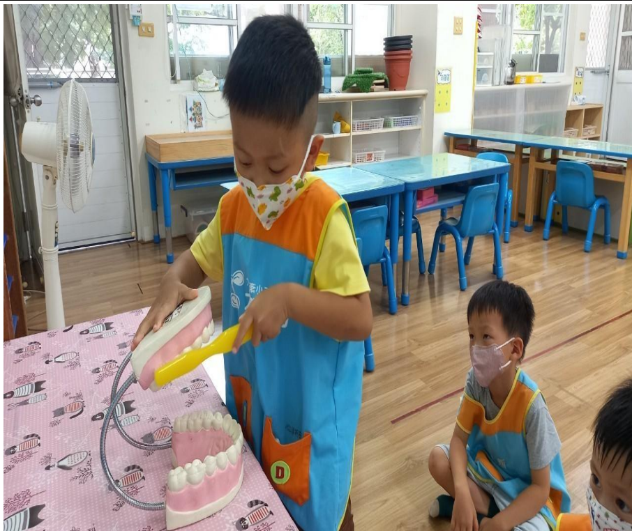
小朋友回覆示範刷牙的方式