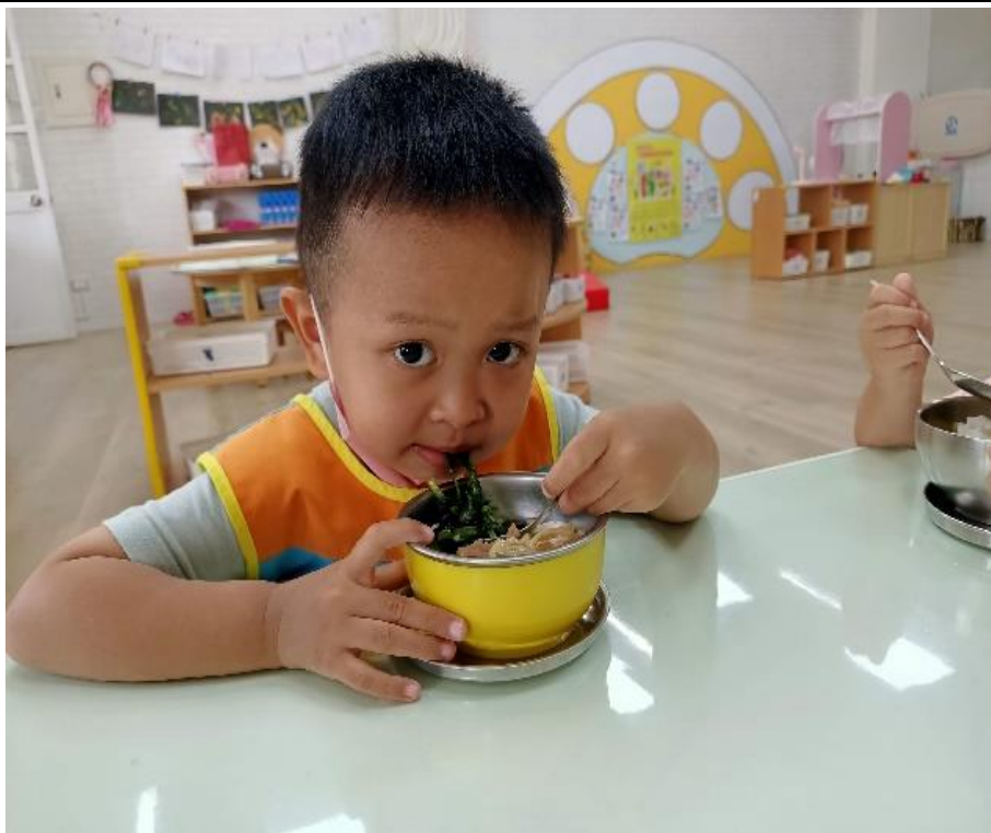
多吃青菜才會健康喔!