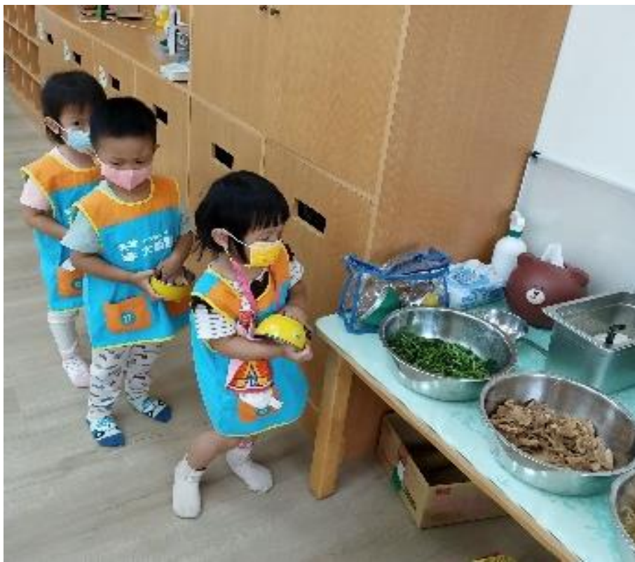
用餐禮儀-要配戴口罩拿取食物喔!