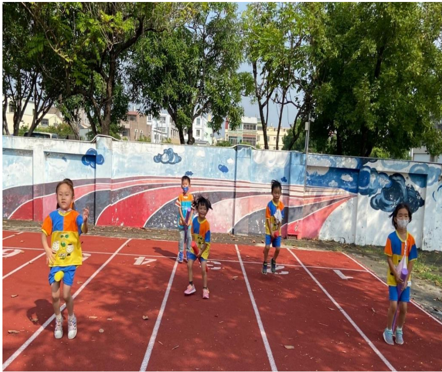
大肌肉運動開始囉~