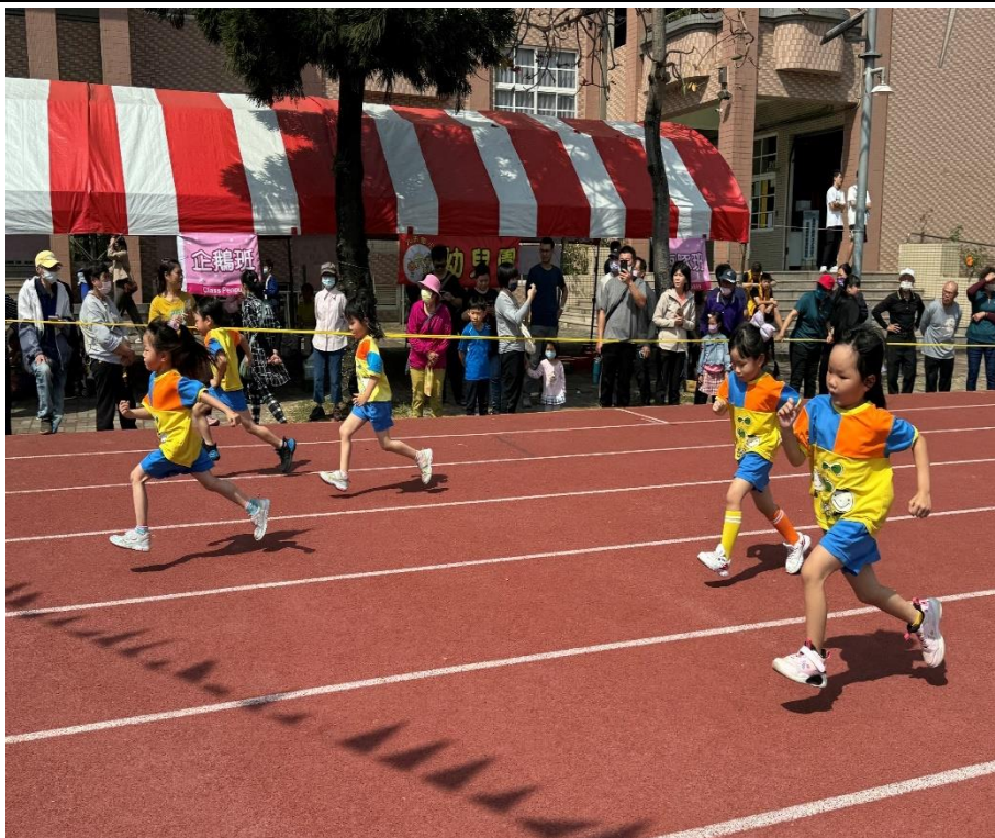
校慶運動會-幼兒園的全班跑活動