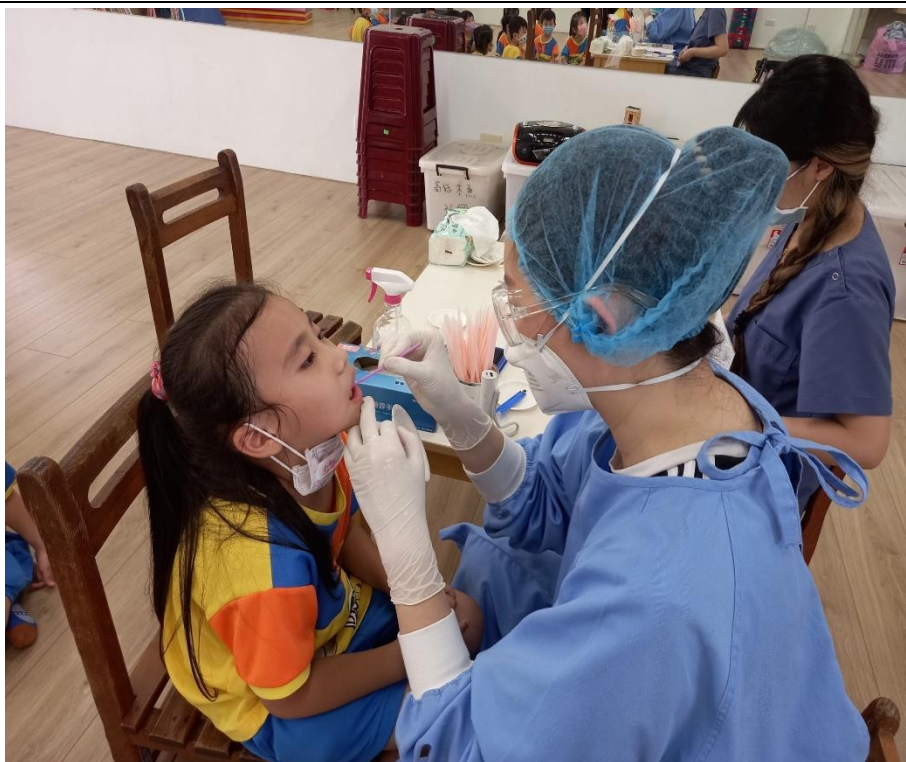
牙科診所醫師到校進行幼童塗氟服務