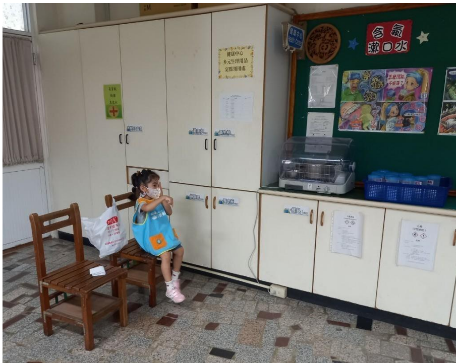
每學期開學之際進行視力檢查