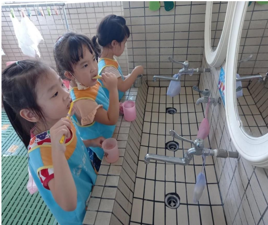
餐後大家一起來刷牙~