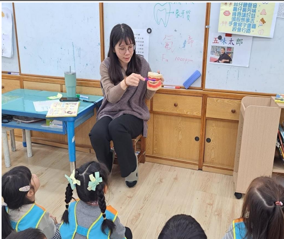
老師示範教學-正確的刷牙方法