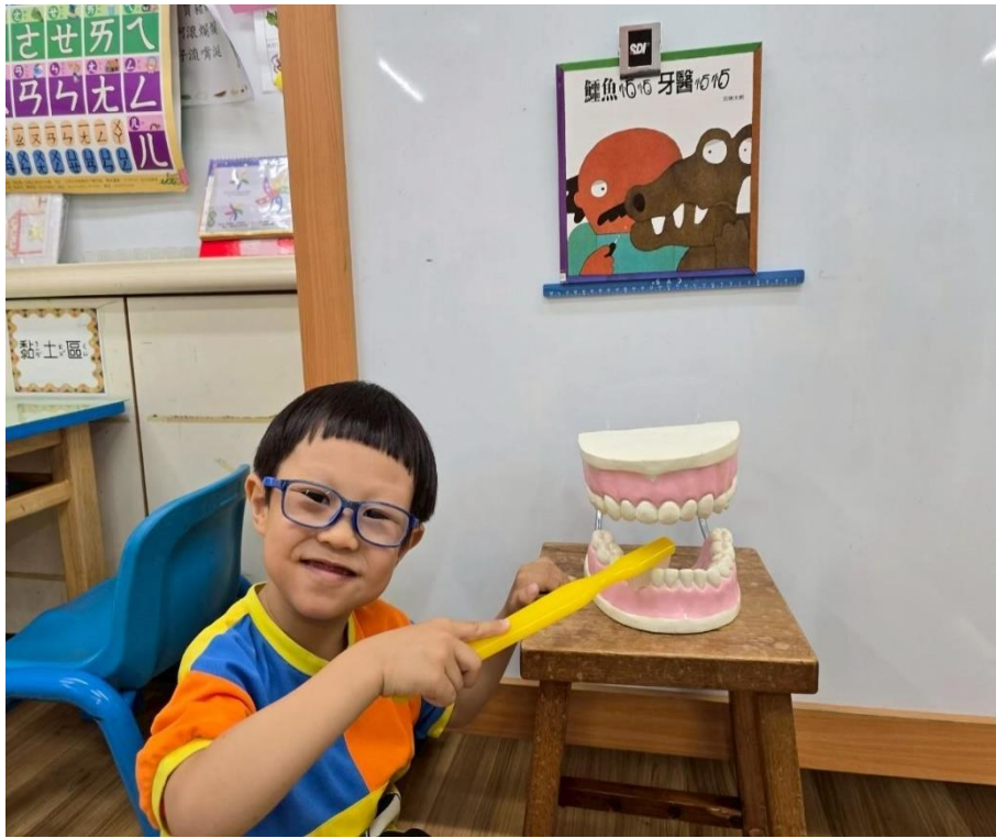
小朋友回覆示範刷牙的方式