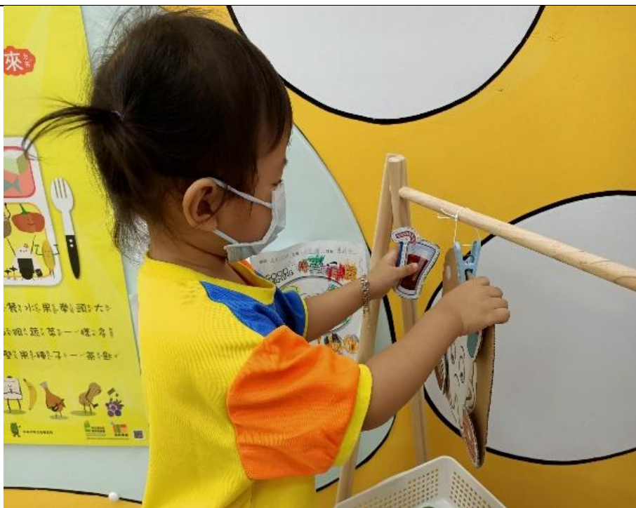
認識會蛀牙的食物