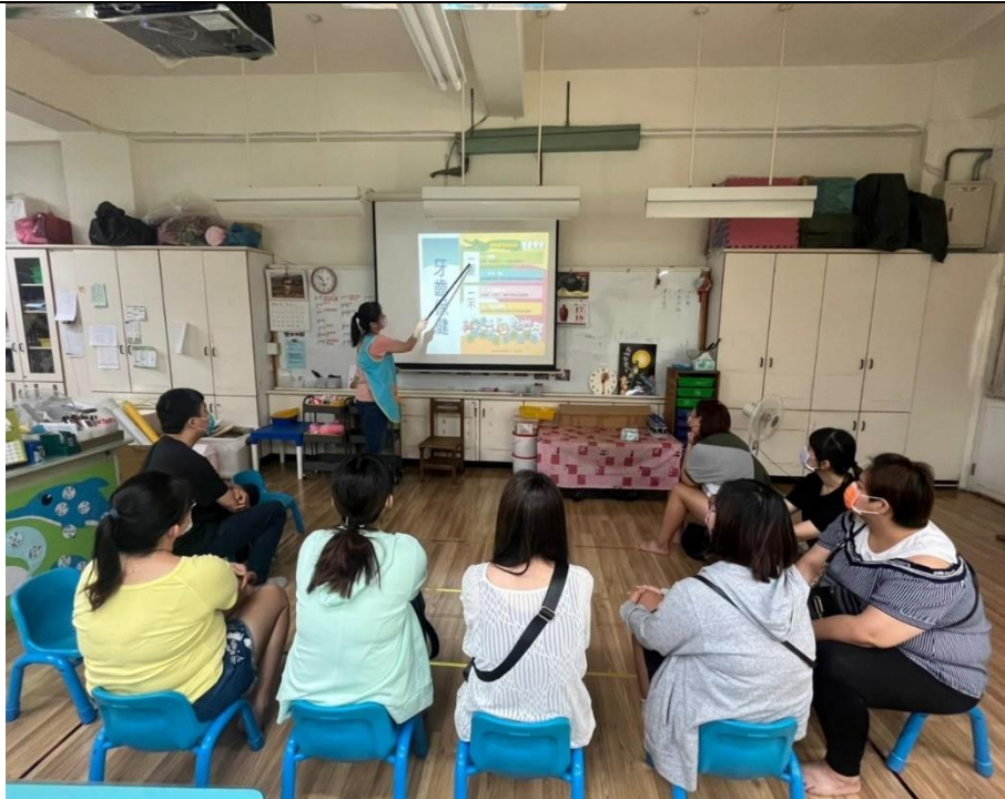
家長座談會-口腔保健宣導