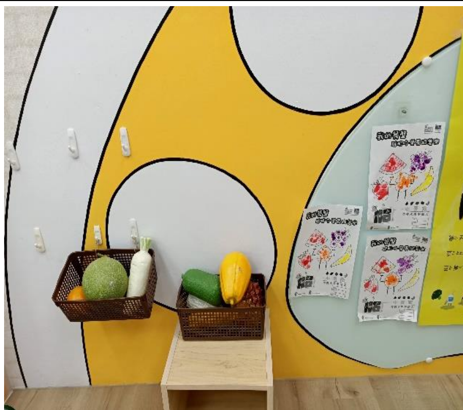
教室情境布置-動動手認識健康的食物