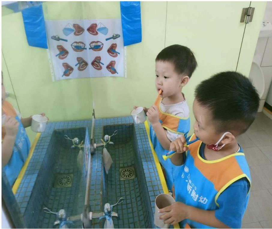
從小刷好牙 一起護健康