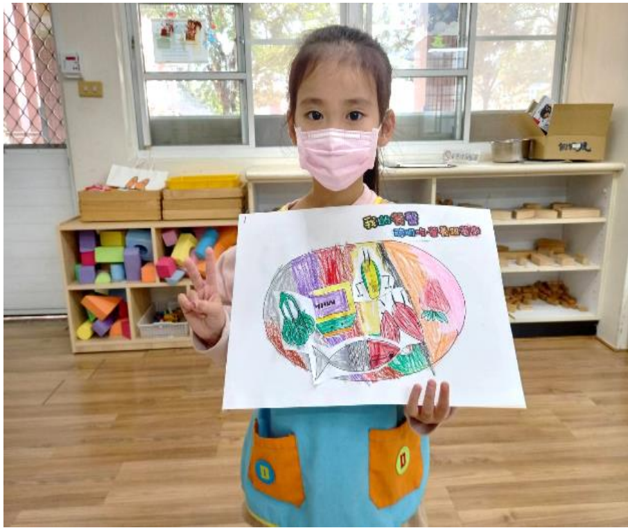
我的健康餐盤設計完成囉!