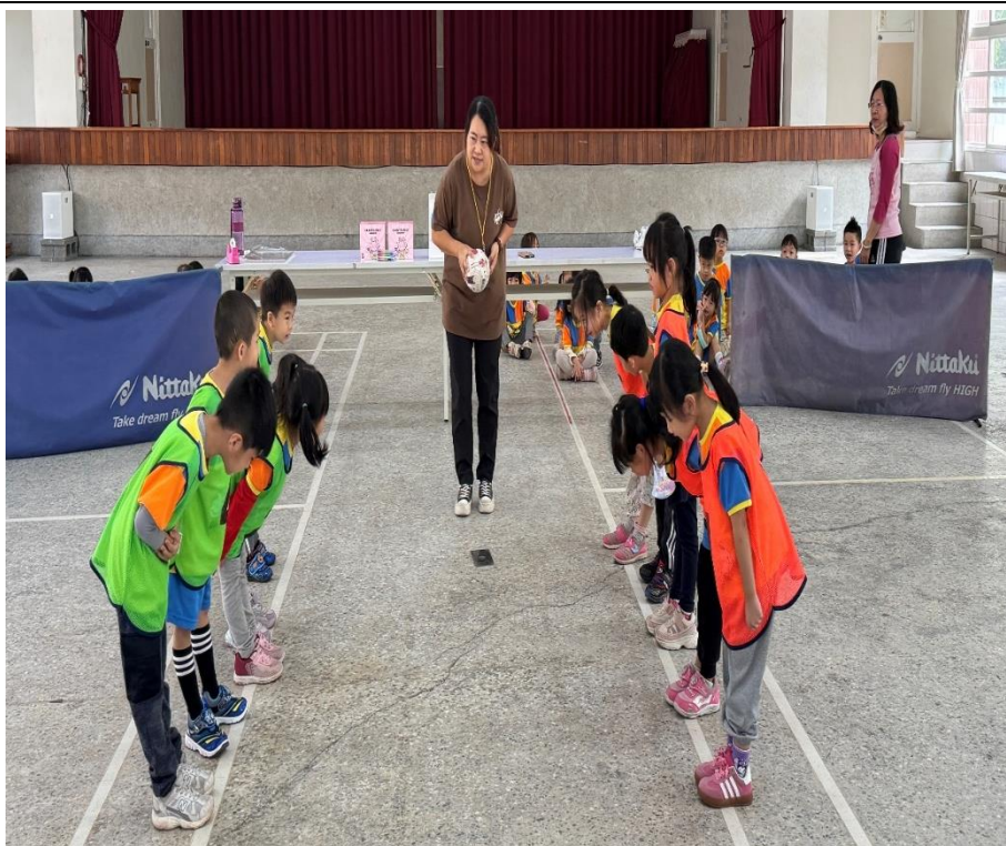
幼兒園班級足球友誼賽-先禮後兵