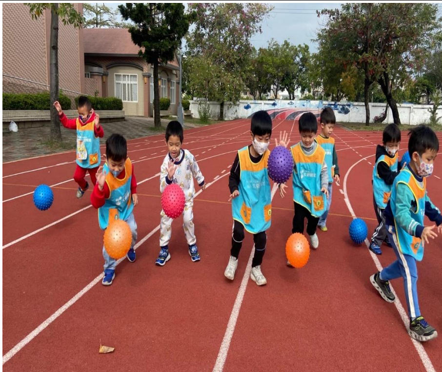
透過運球動作，兼顧趣味與運動