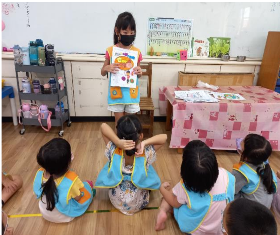
分享我的健康餐盤學習單