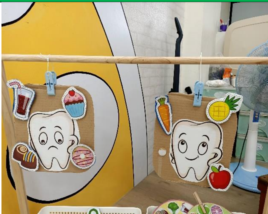
教室情境佈置-不健康的食物會蛀牙喔!