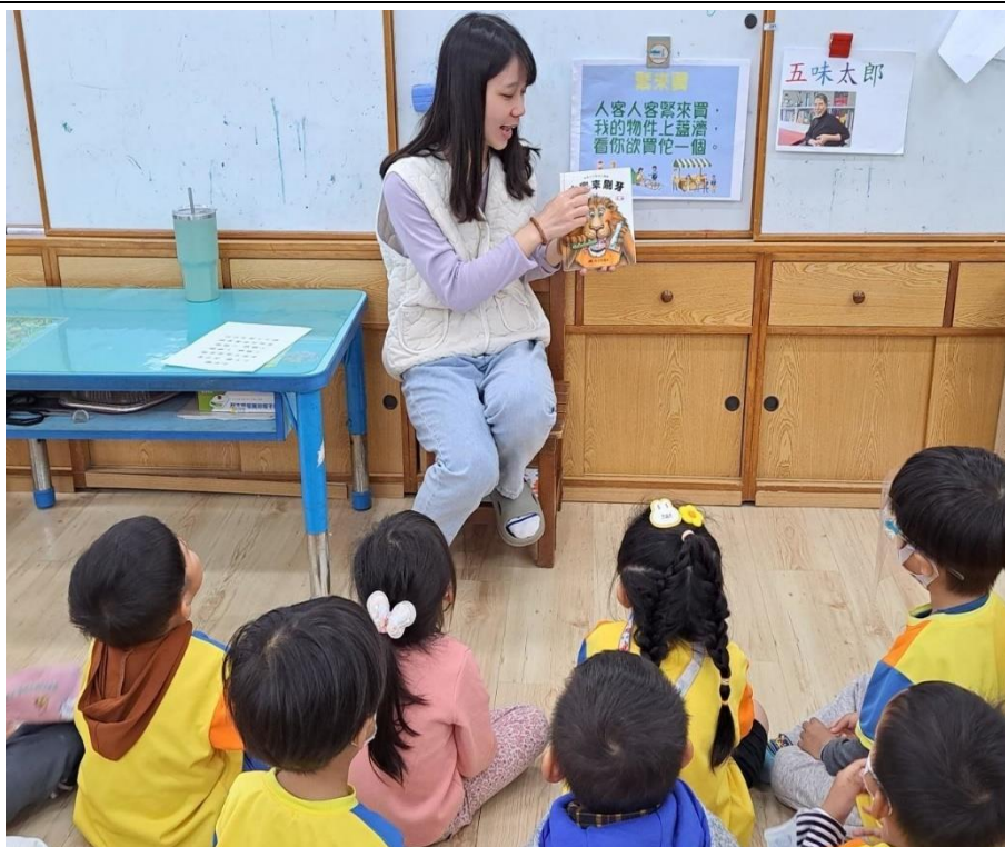
老師透過繪本故事，教導幼童刷牙的重要性