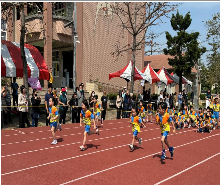
校慶運動會-幼兒園的全班跑活動