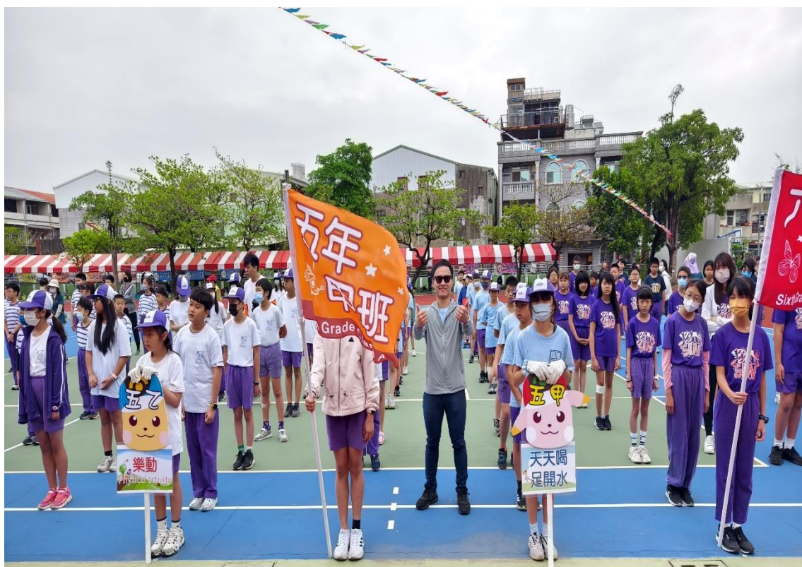
校慶運動會-全體師生共同響應並倡導-『五正四樂』