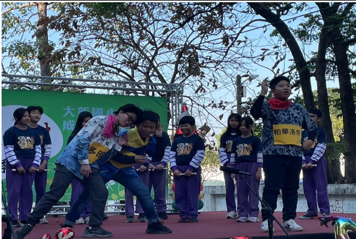
舉辦雨豆樹音樂祭-班級音樂劇的精湛演出