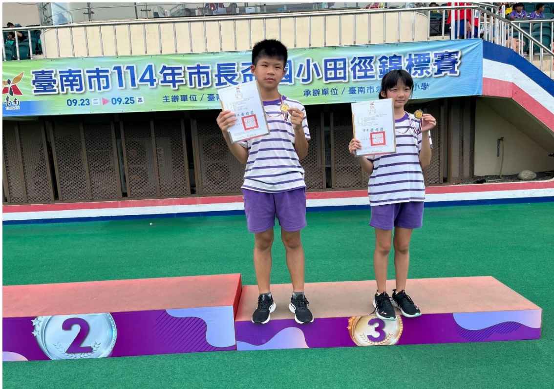
田徑隊選手獲得佳績