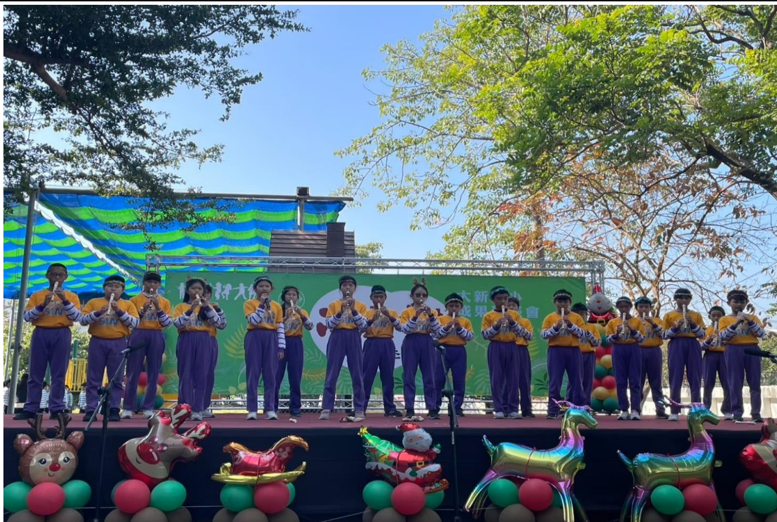
舉辦雨豆樹音樂祭-班級直笛的精彩演出