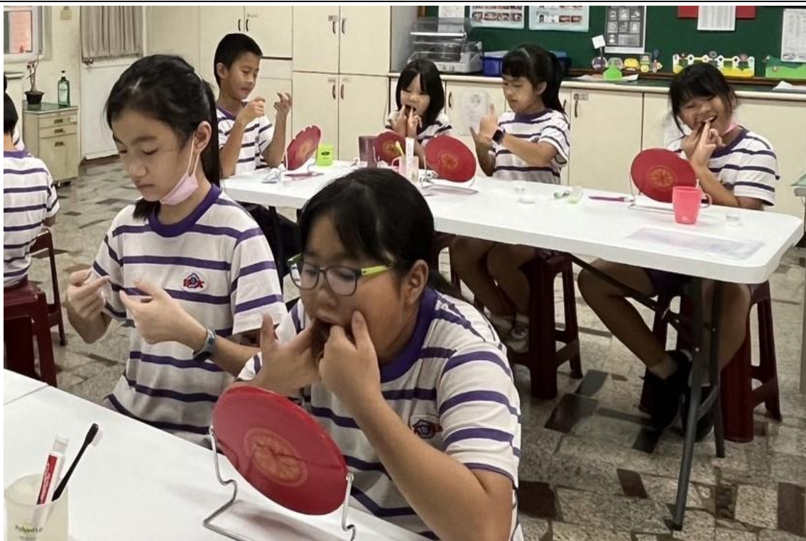
各班潔牙小天使-牙線使用實務操作練習