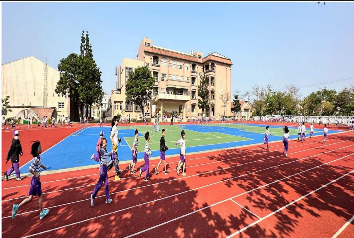
鼓勵教職員工多運動-朝會後大家一起慢跑健走