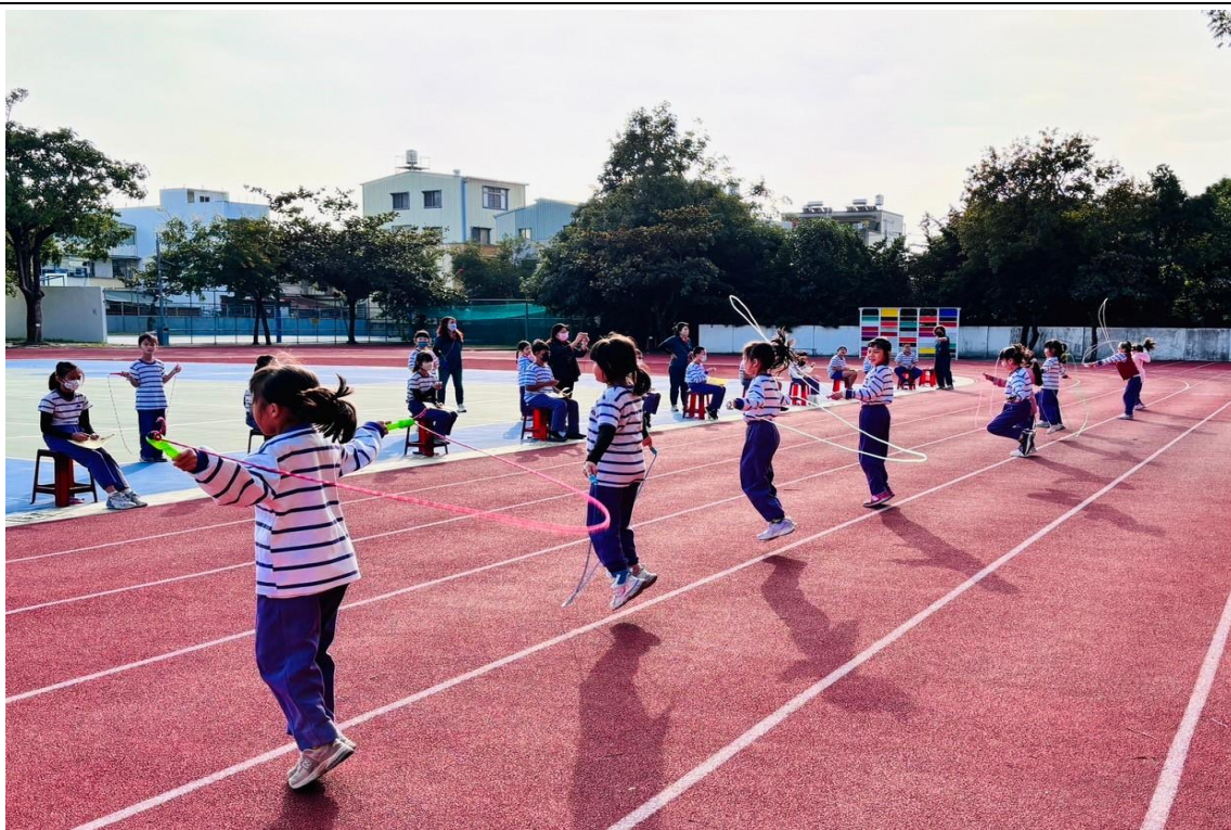
1-3 年級舉辦個人跳繩計次競賽