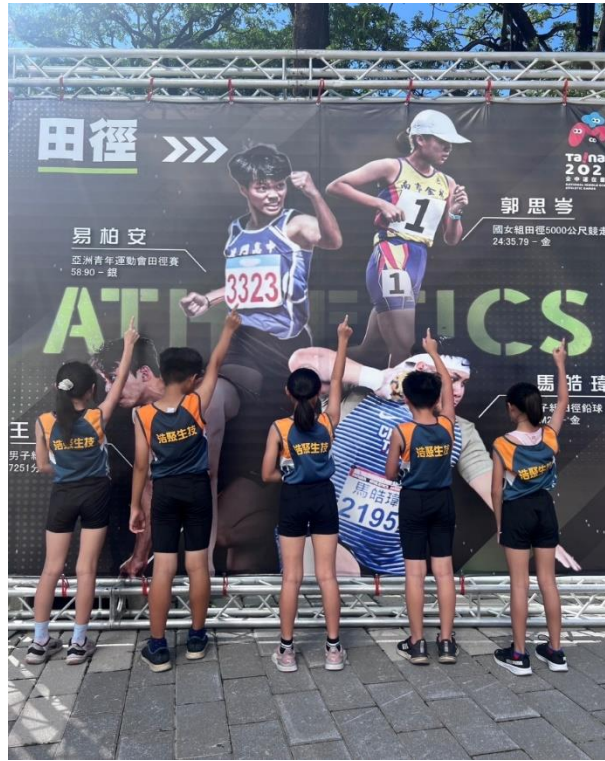
田徑隊參加 114 年國小田徑錦標賽