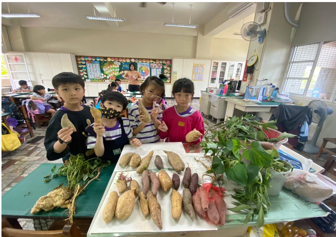
辦理大新小食農--採收各式種類的番薯