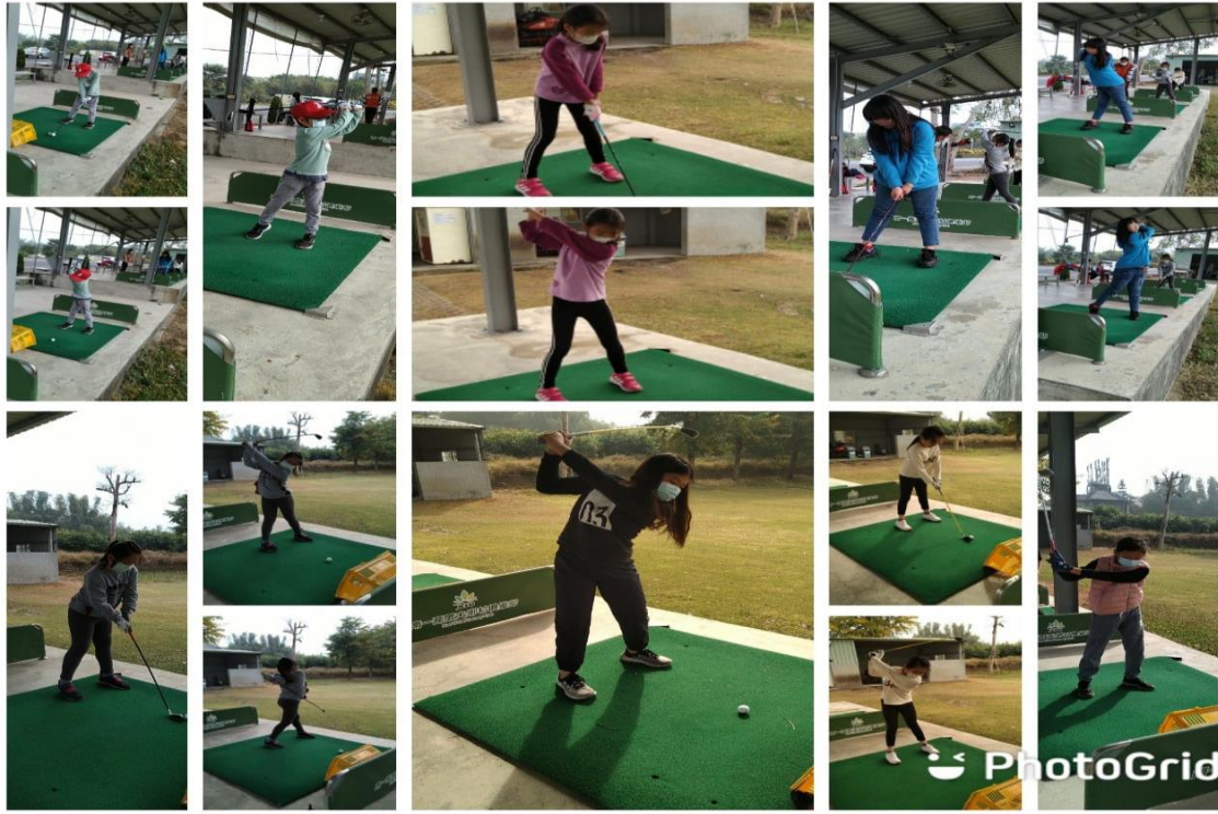
高爾夫球社團於校外球場練習