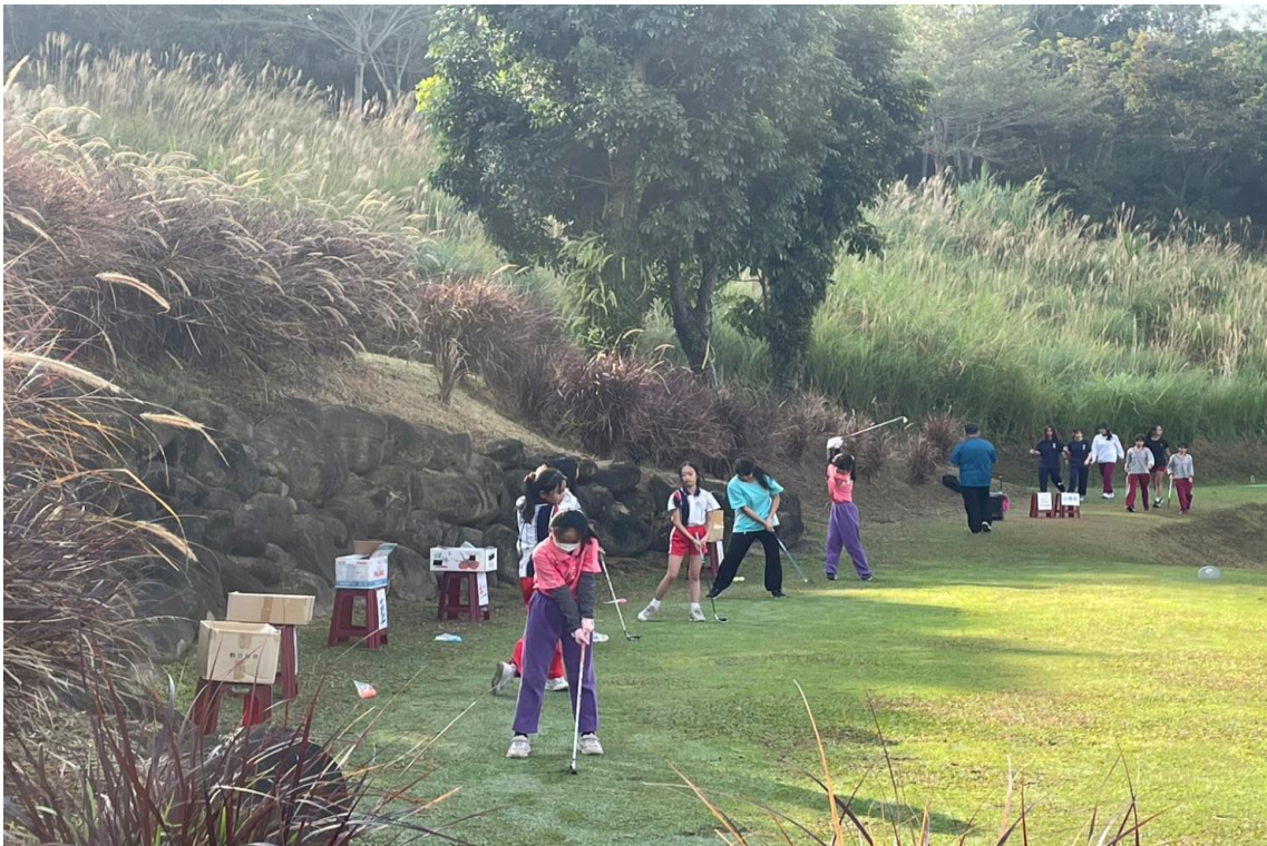
高爾夫球社團比賽實況