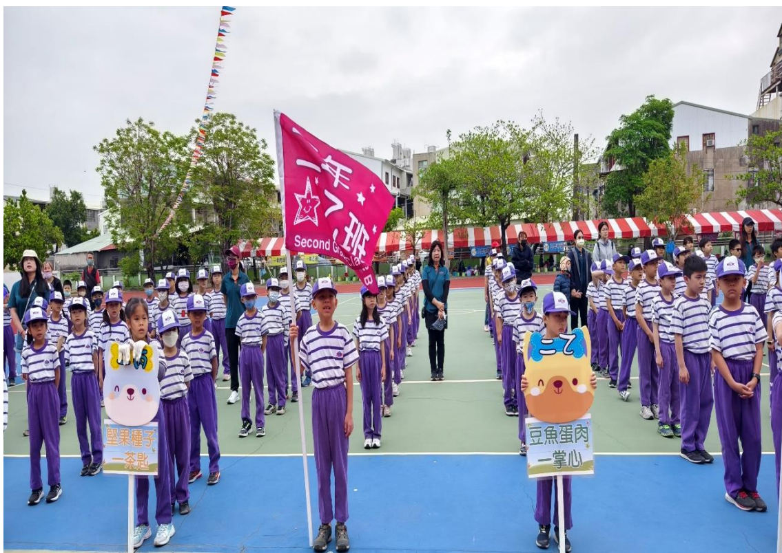
校慶運動會-全體師生共同響應並倡導-健康守則天天『85110』