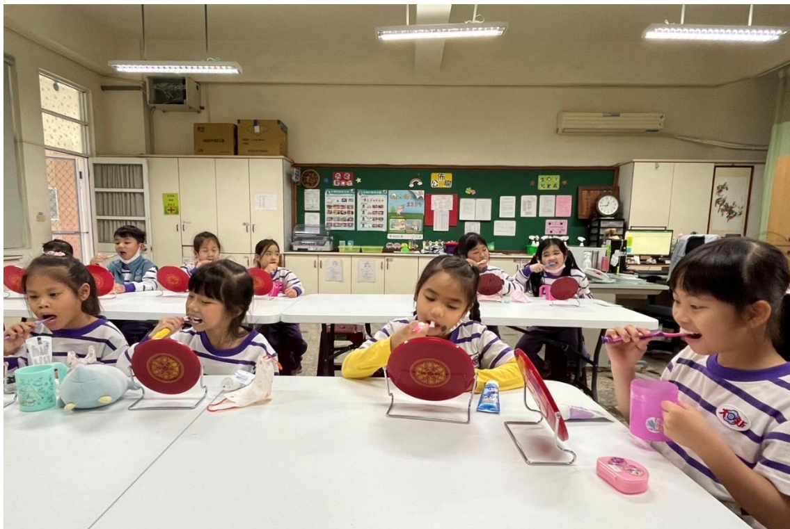
各班潔牙小天使-潔牙實務操作練習