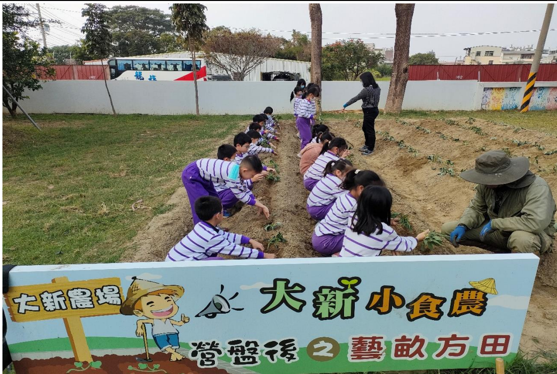
大新農場-藝畝方田插秧樂