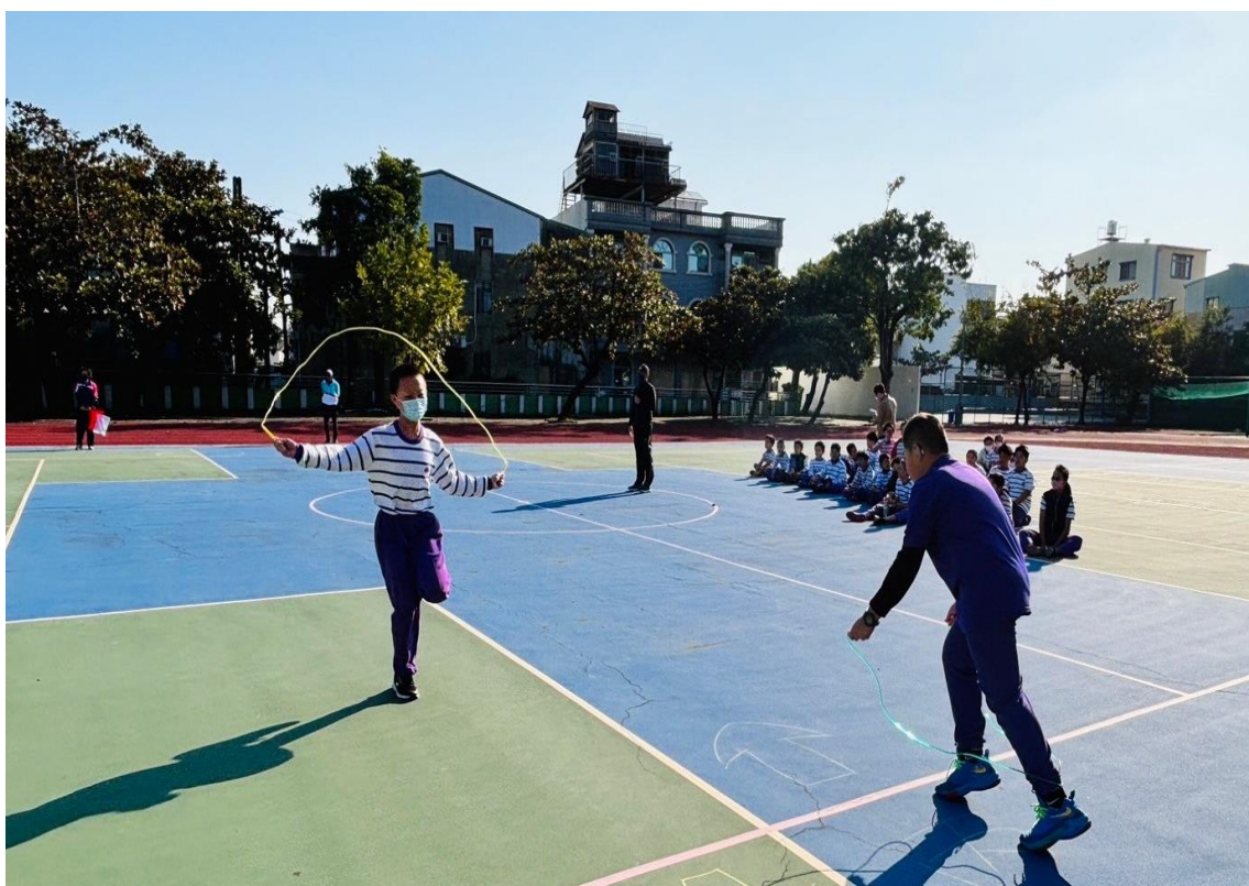
4-6 年級舉辦班際跳繩接力競賽