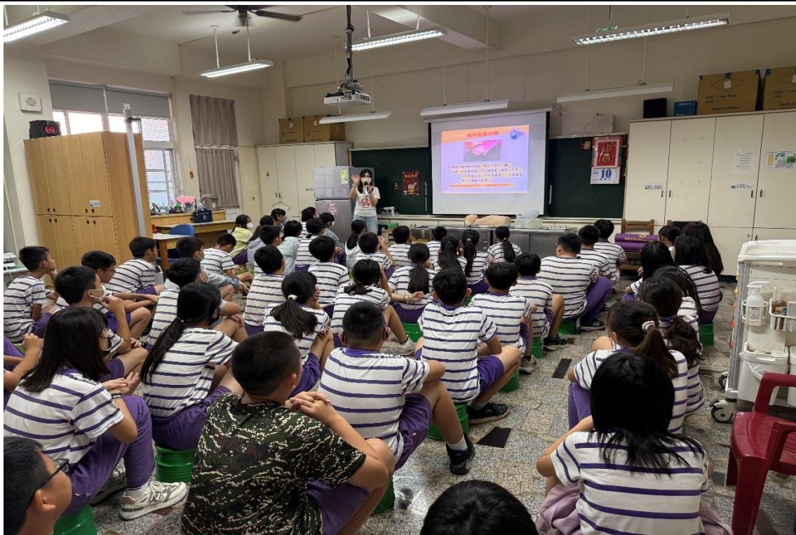
訓練課程-「心肺復甦術 CPR」