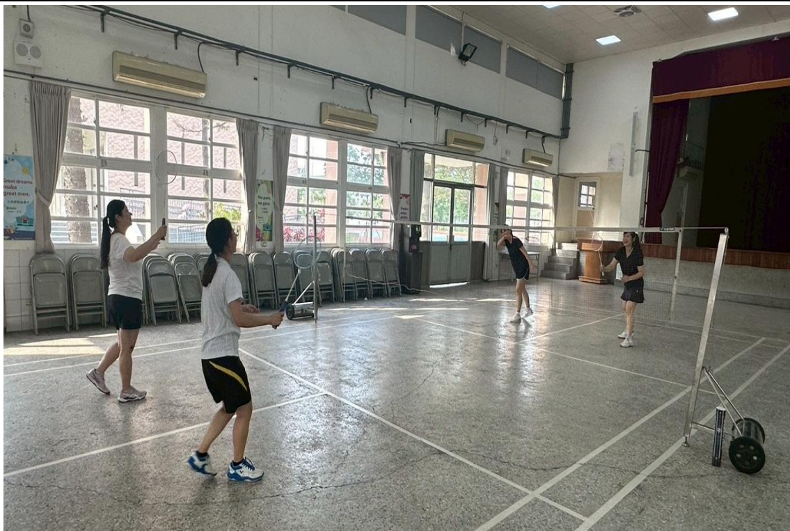
開辦教職員工運動社團-每週一、四下班後一起打羽球