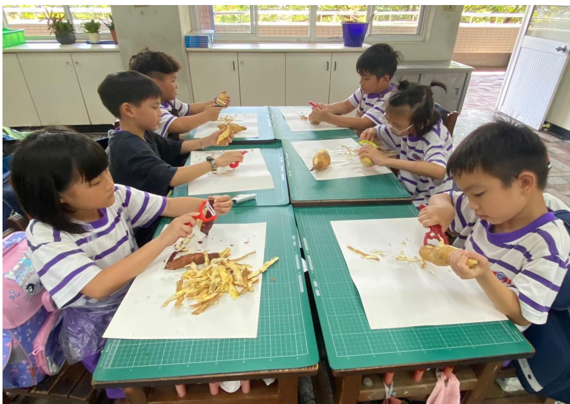
辦理大新小食農-分工合作幫番薯削皮