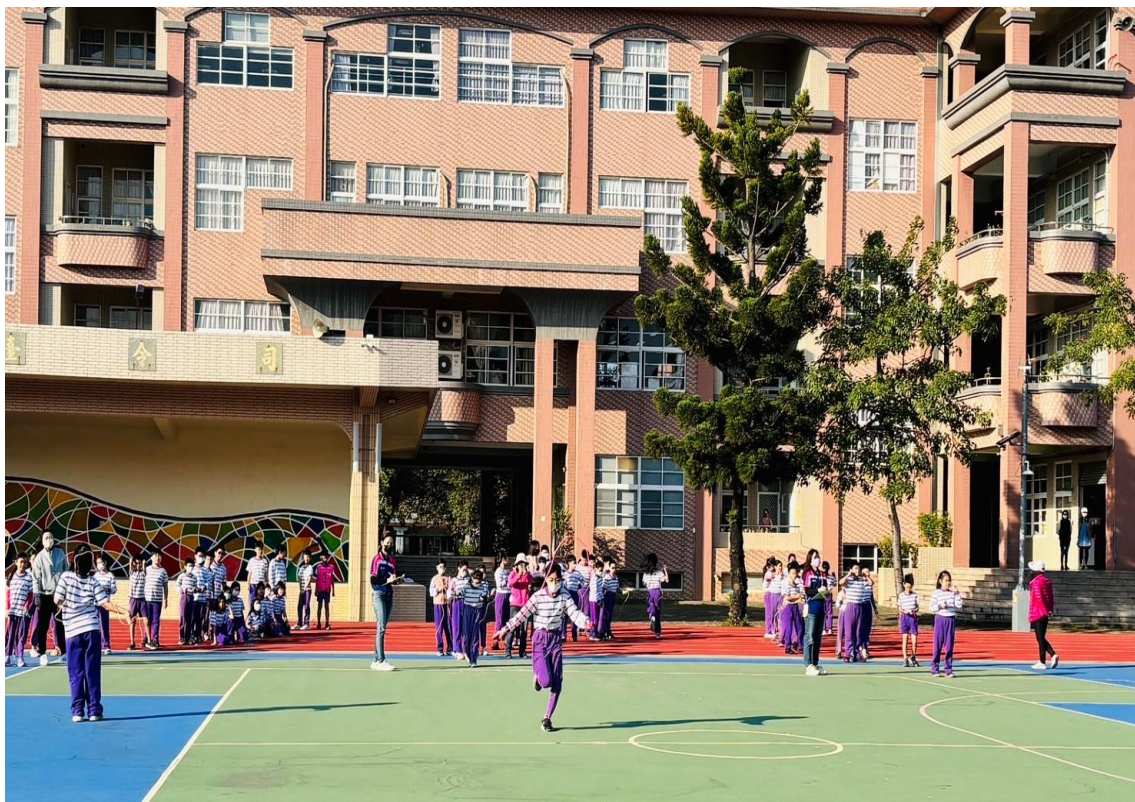
4-6 年級舉辦班際跳繩接力競賽