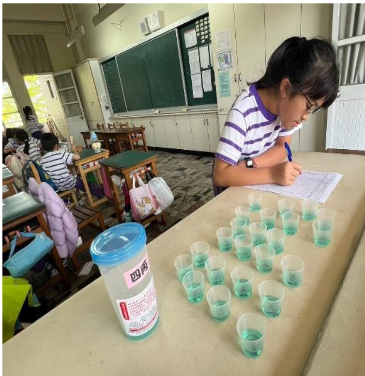
潔牙小天使落實班級每週使用含氟漱口水，維護口腔健康