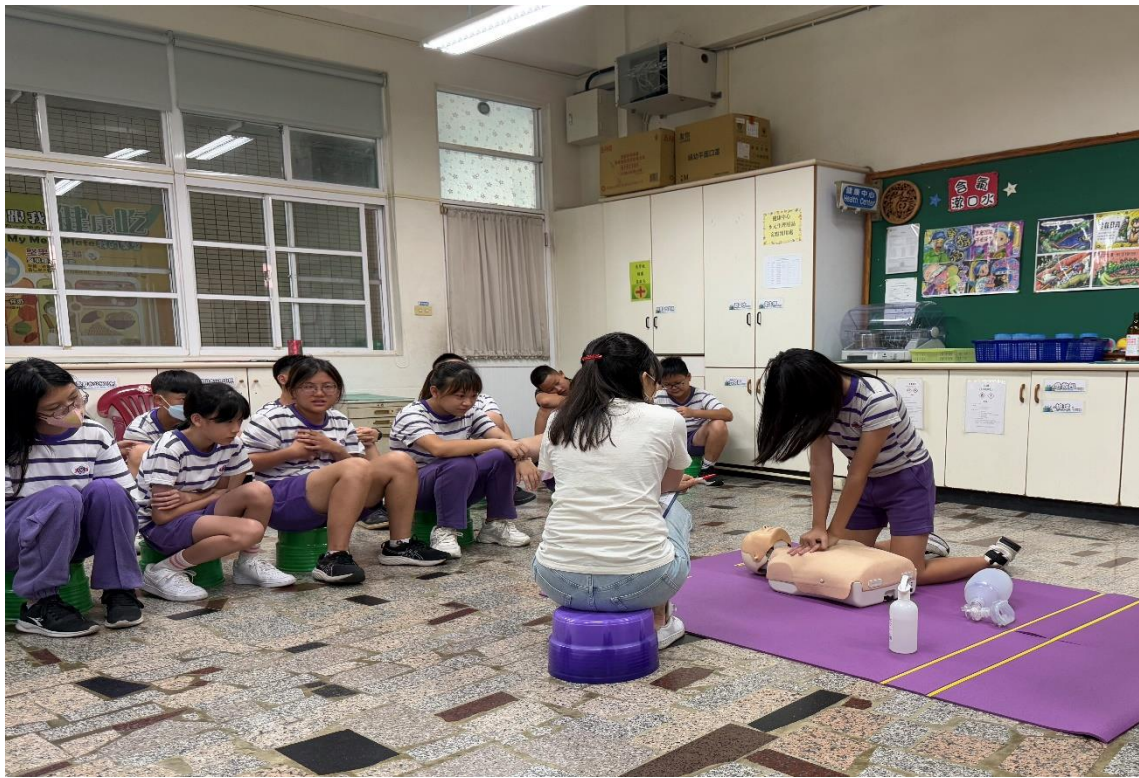
學生實務操作測驗-「心肺復甦術 CPR」