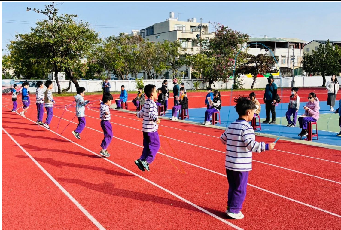
1-3 年級舉辦個人跳繩計次競賽