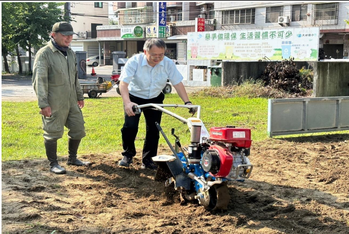
大新農場-校長開墾地瓜田