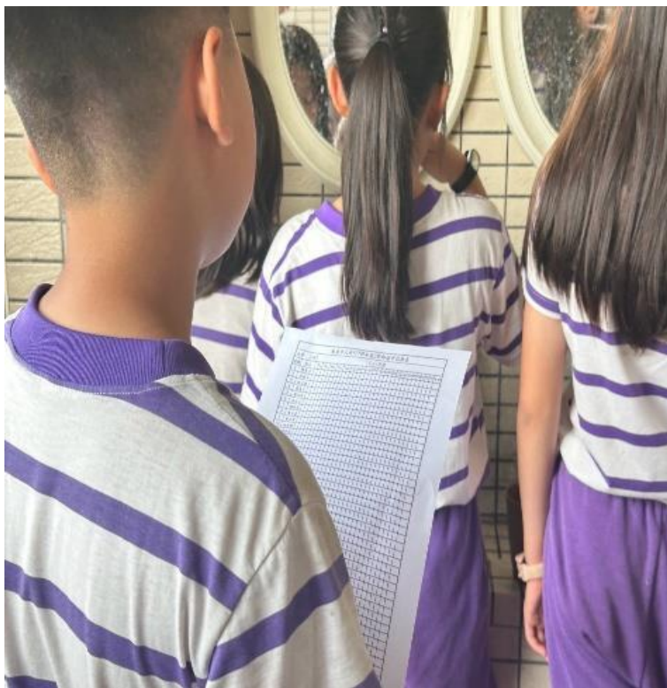
潔牙小天使每日督導同學確實完成餐後潔牙