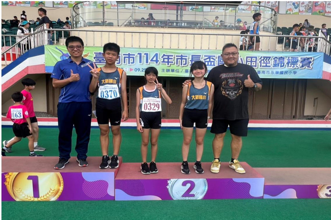
田徑隊參加 114 年市長盃國小田徑錦標賽