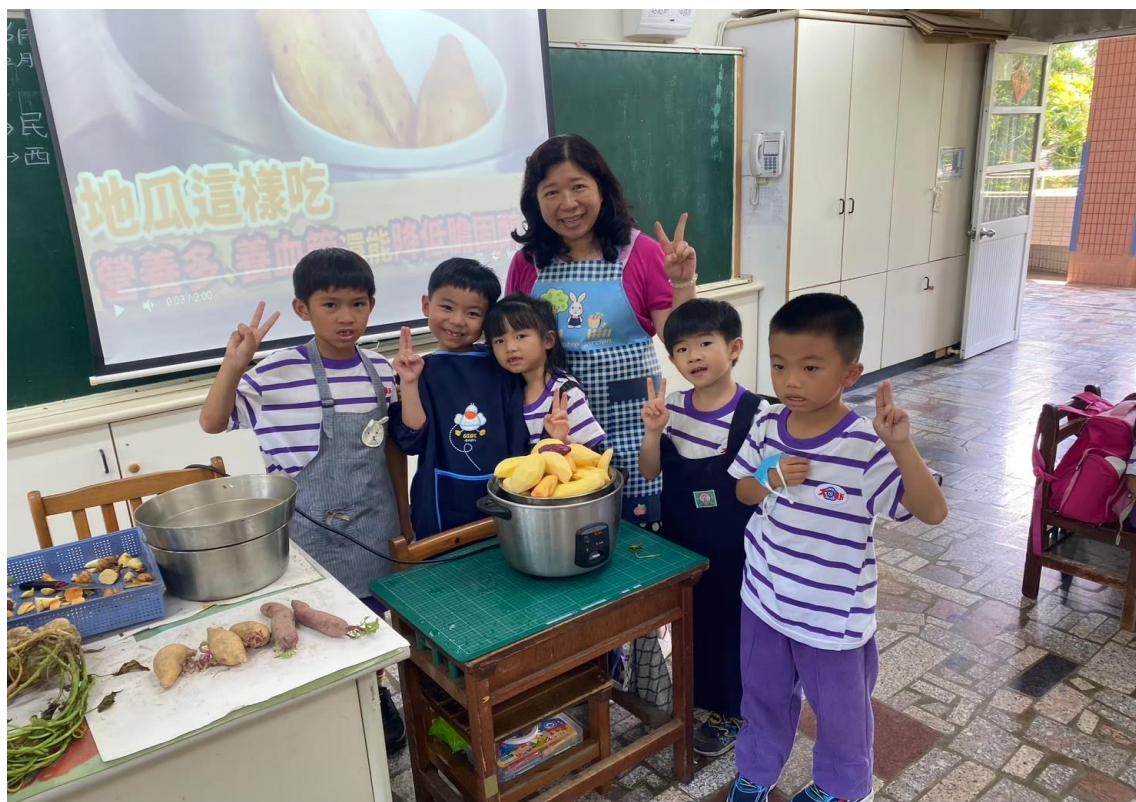
辦理大新小食農-地瓜蒸有趣