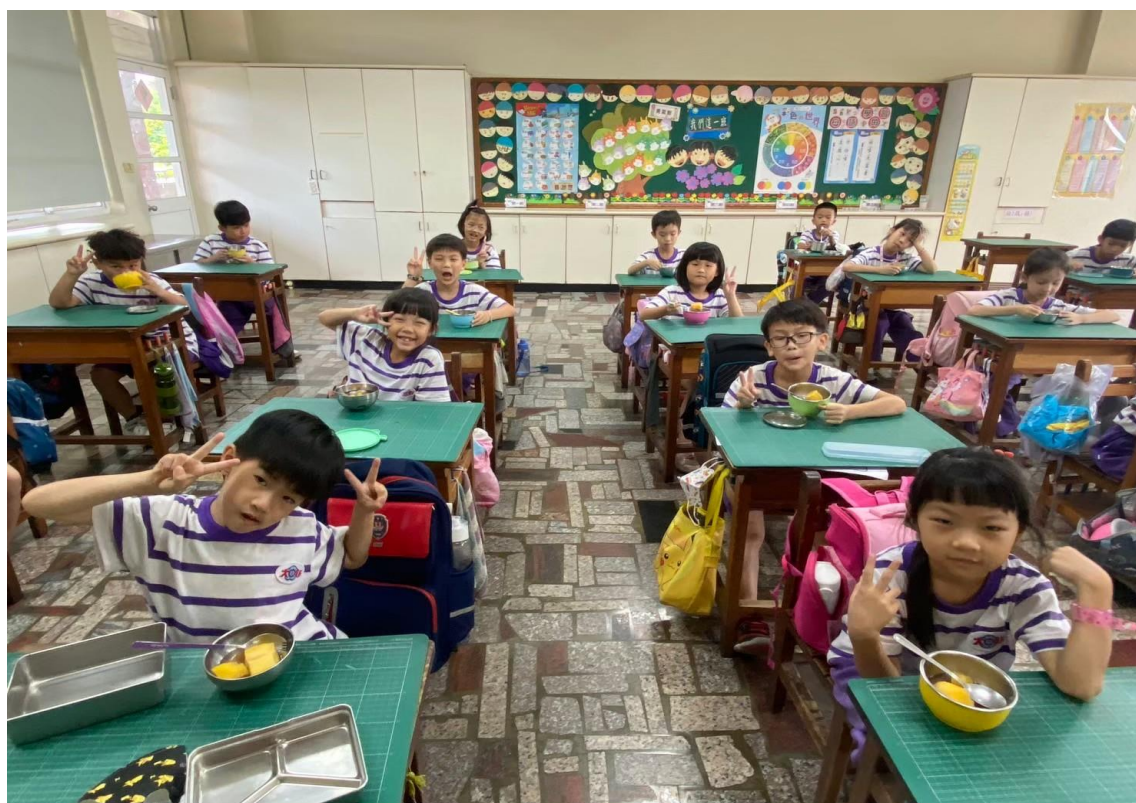
辦理大新小食農-享用美味又營養的蒸番薯