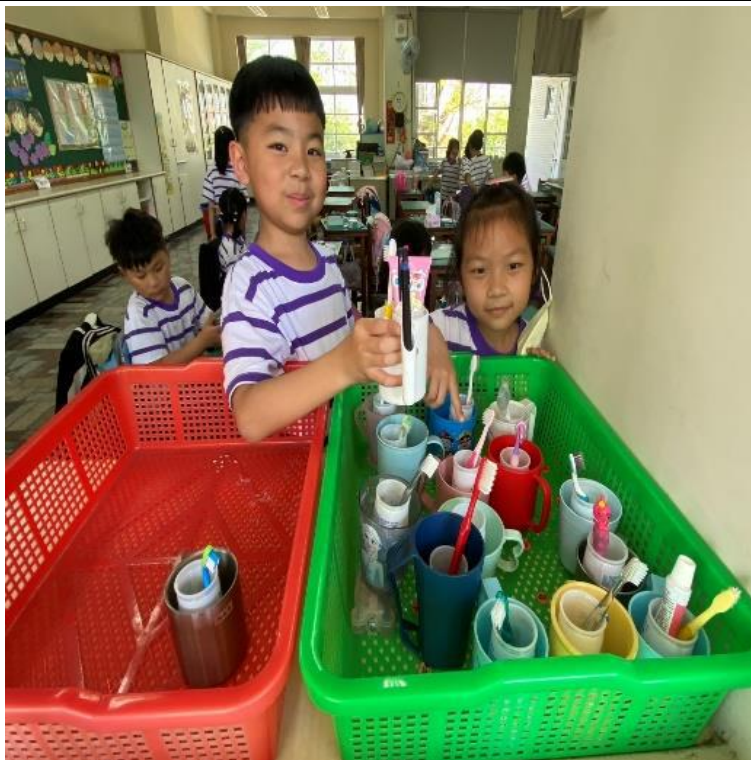
潔牙小天使每日協助整理班級刷牙用具