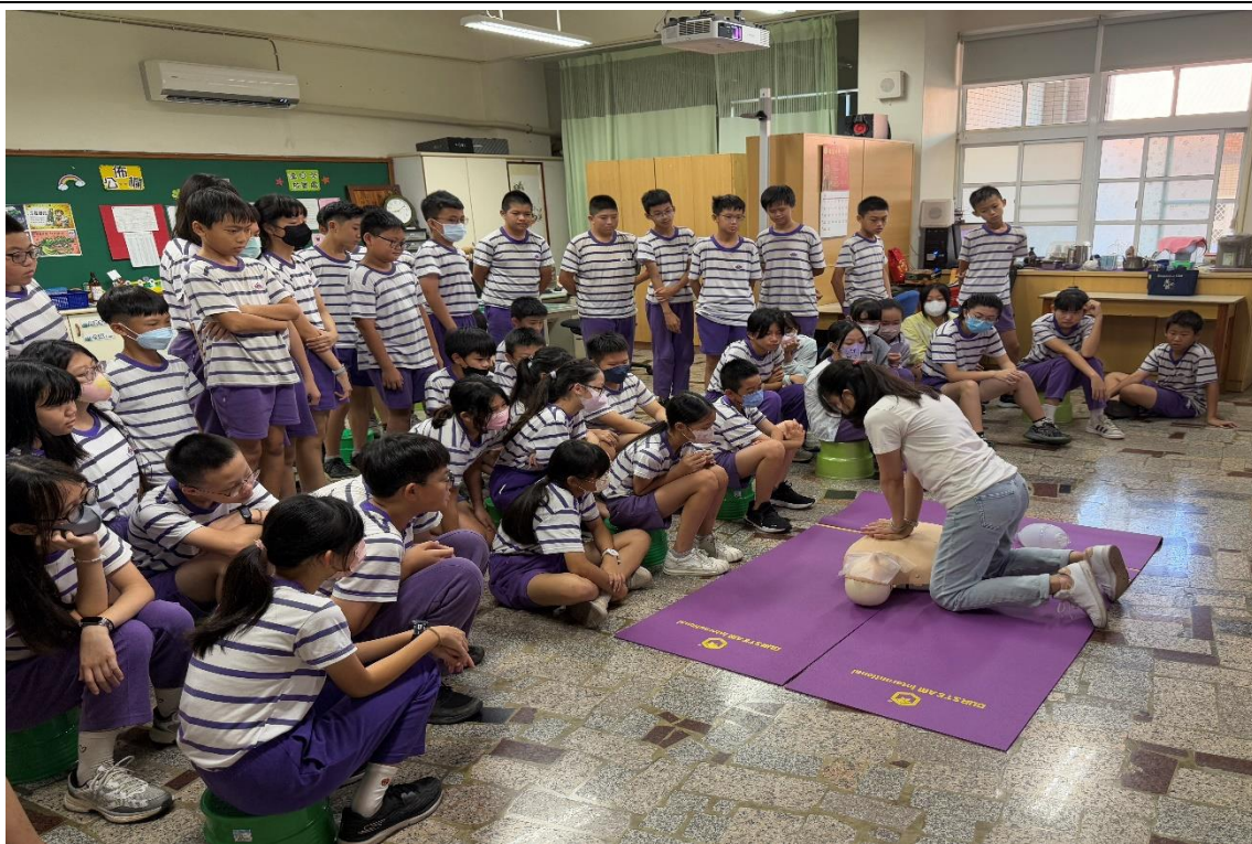
示範操作-「心肺復甦術 CPR」