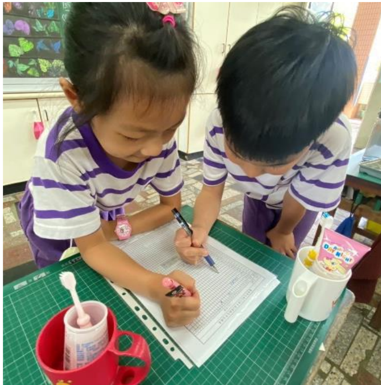
潔牙小天使每日填寫班級潔牙紀錄表，並於月底交回健康中心