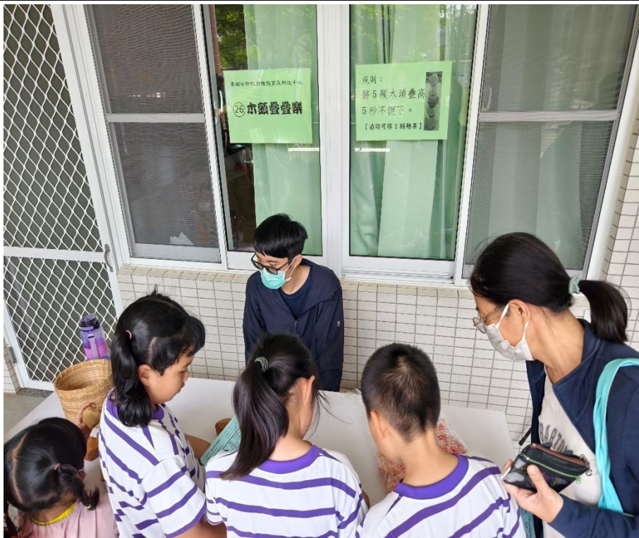
家長與學生一同參與「木頭疊疊樂」闖關活動