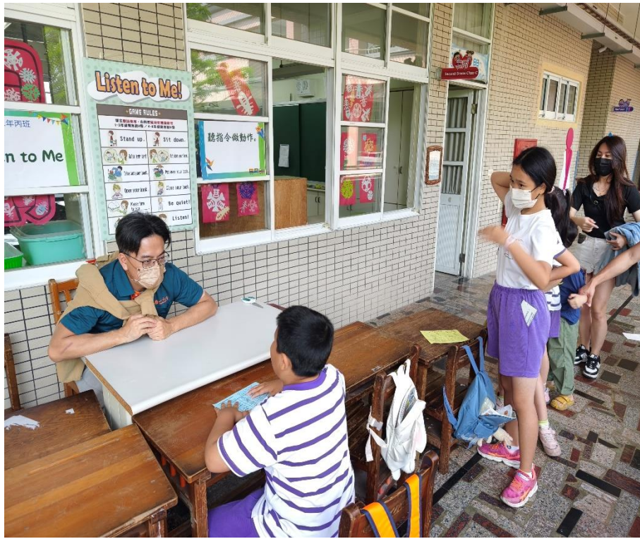
家長與學生一同參與「Listen to Me!」闖關活動