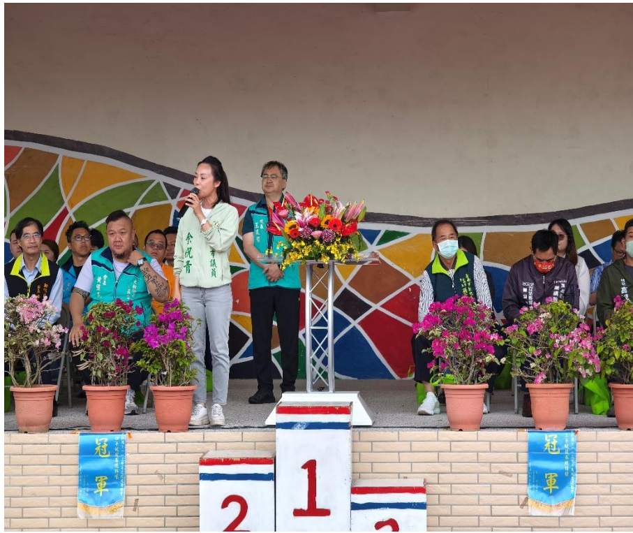
地方首長、議員、里長、社區人士與家長們共同參與校慶運動會