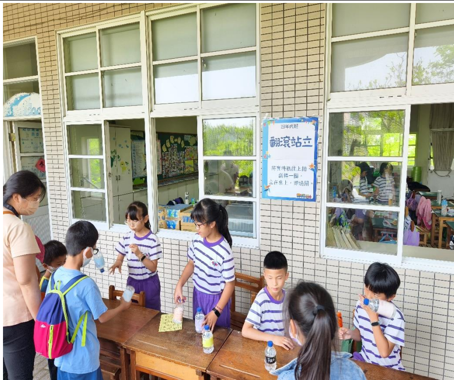
家長與學生一同參與「翻滾站立」闖關活動