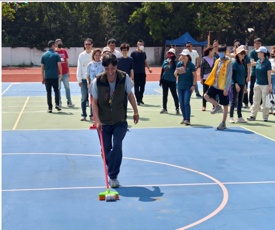
家長們熱烈參與趣味競賽：【防治登革熱-巡倒清刷】