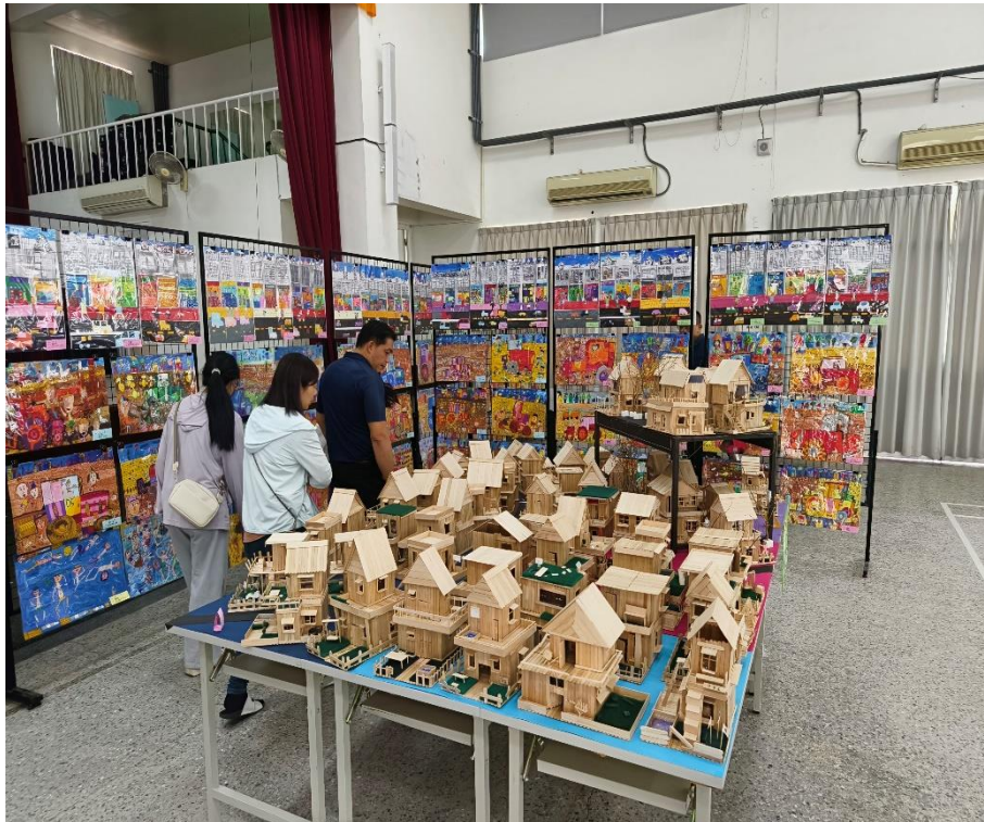
社區人士家長共同欣賞學生藝文特展美術作品