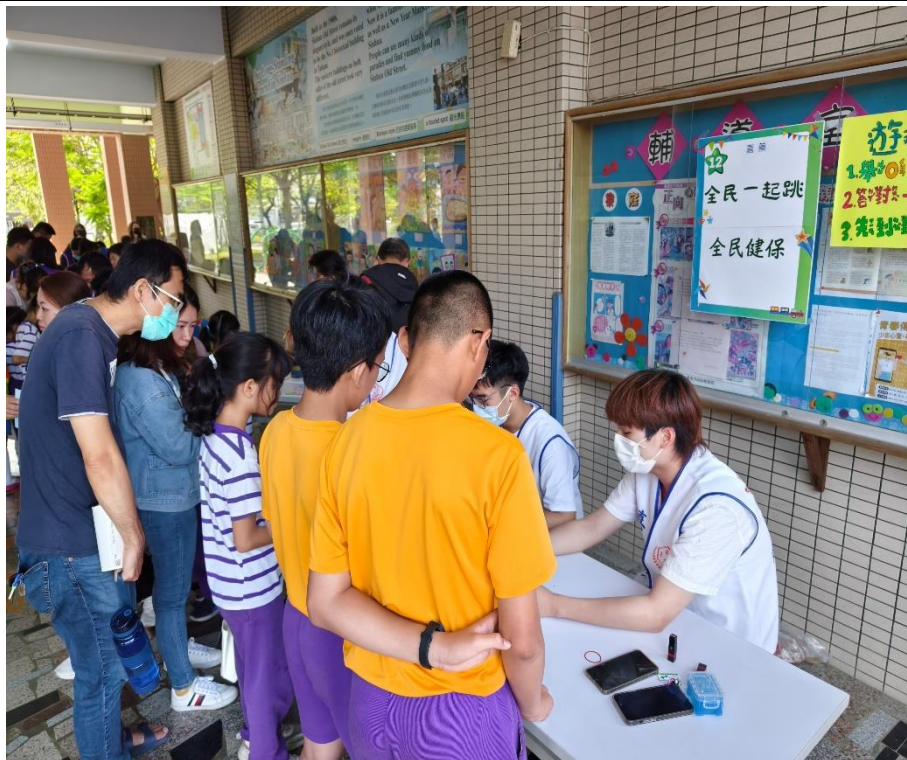
家長與學生一同參與「全民健保」闖關活動