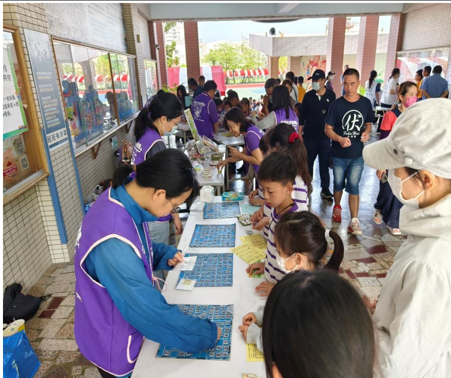
家長與學生一同參與「獨樂變共樂」闖關活動