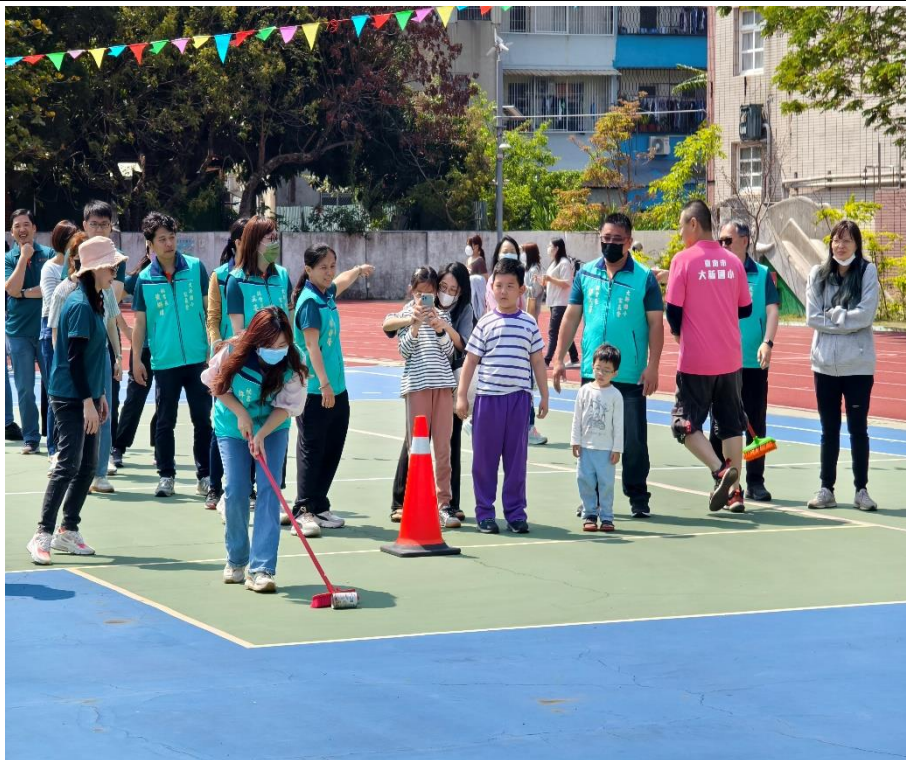
家長們熱烈參與趣味競賽：【防治登革熱-巡倒清刷】