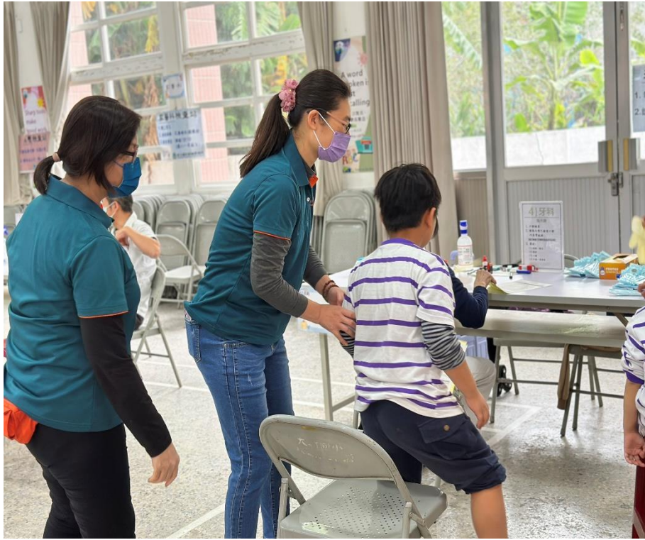
家長志工協助學生等候牙科檢查