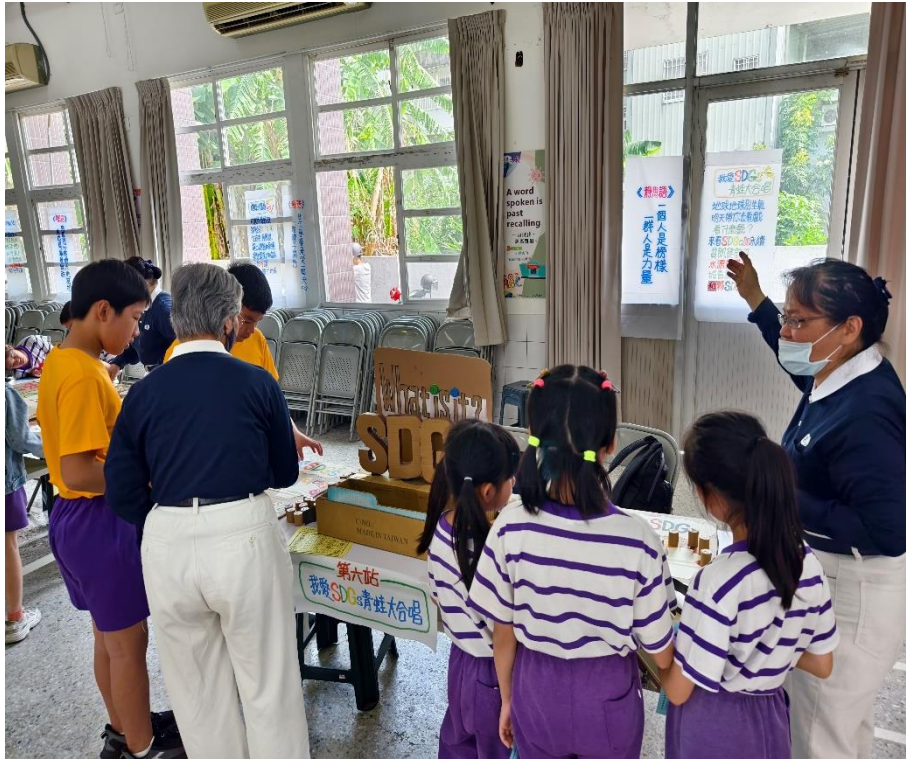
社區人士家長共同參與環保愛地球闖關活動