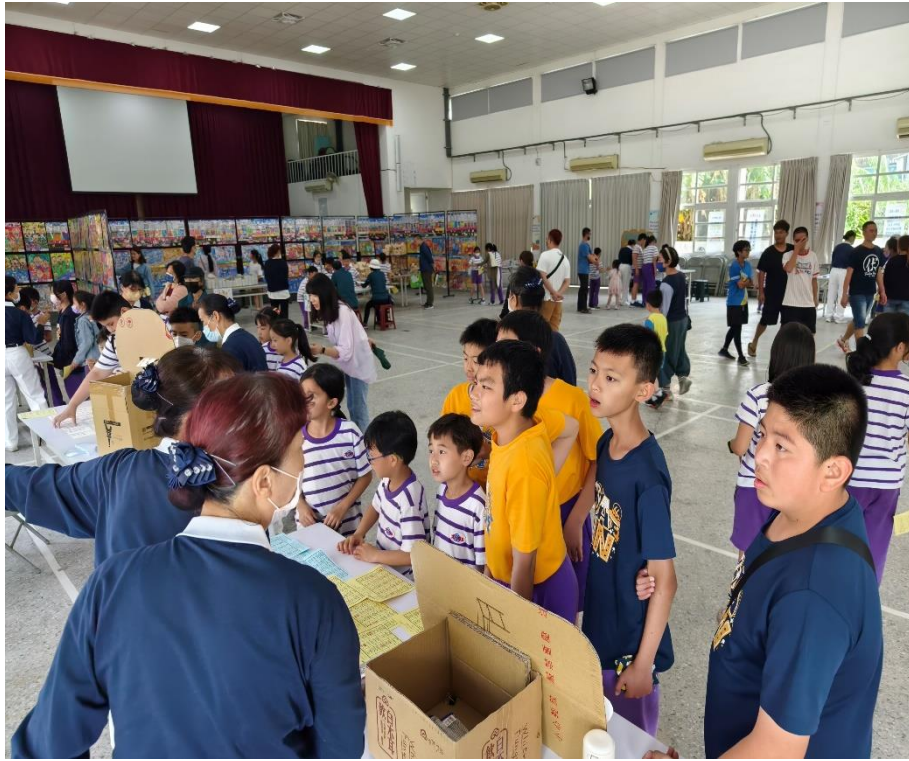
社區人士家長共同參與環保愛地球闖關活動