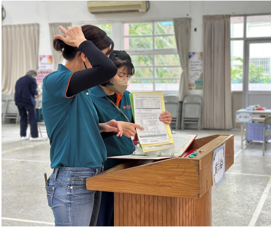
家長志工於前站確認檢查相關資料