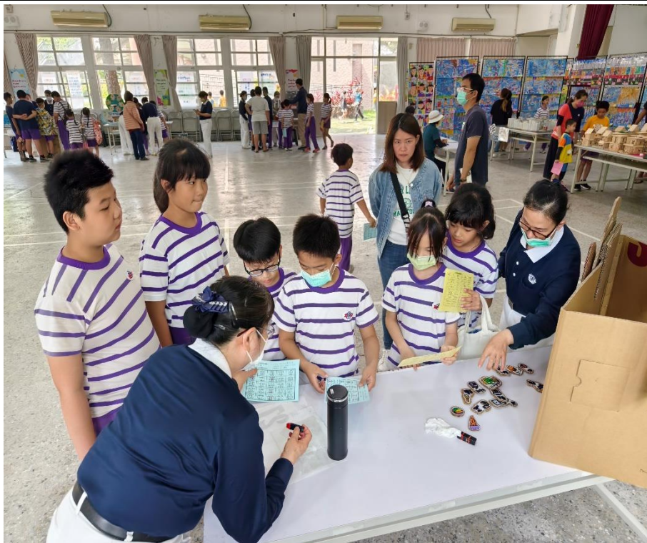
社區人士家長共同參與環保愛地球闖關活動