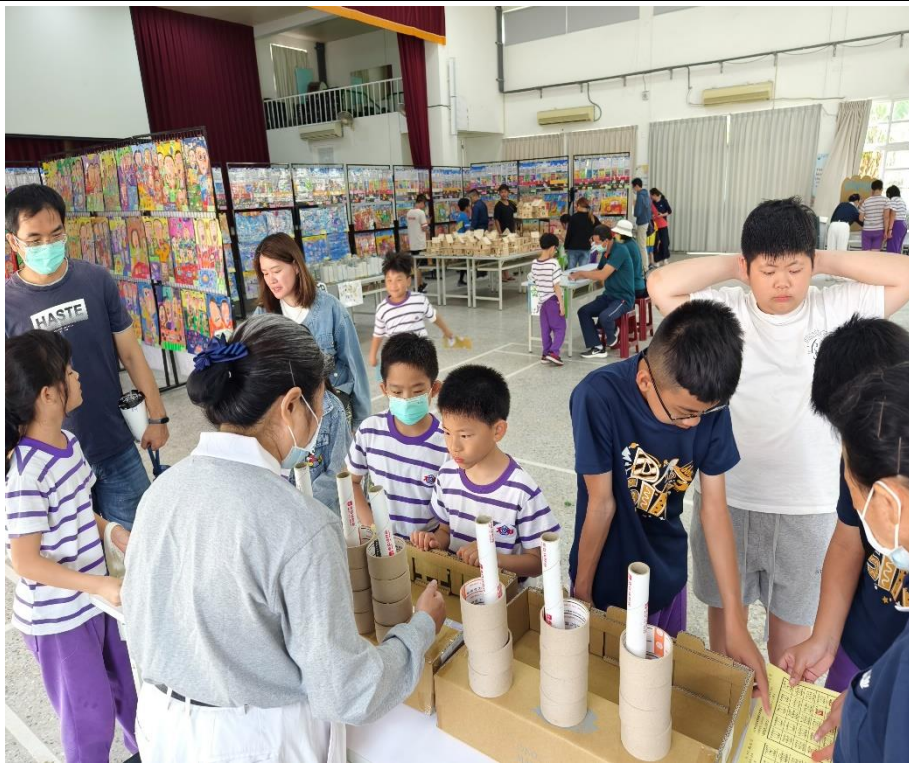
社區人士家長共同參與環保愛地球闖關活動