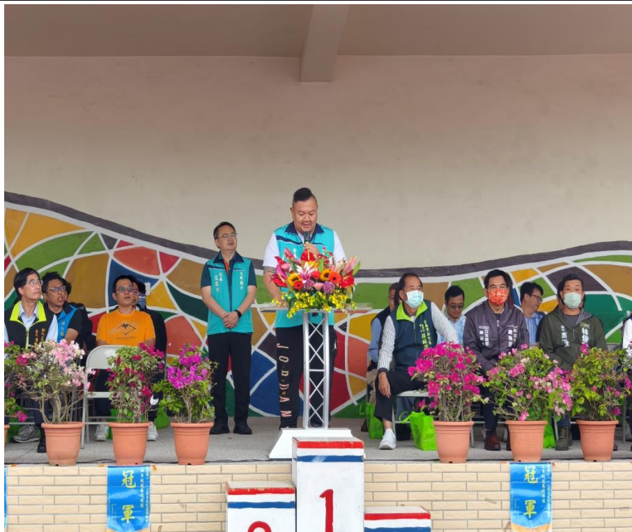
地方首長、議員、里長、社區人士與家長們共同參與校慶運動會