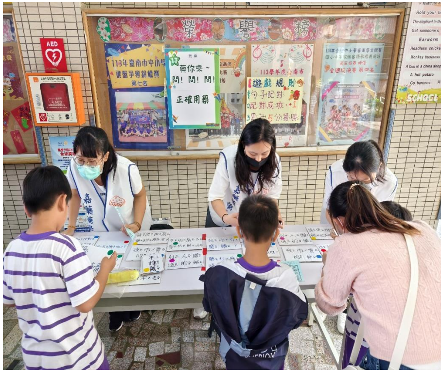
家長與學生一同參與「正確用藥」闖關活動