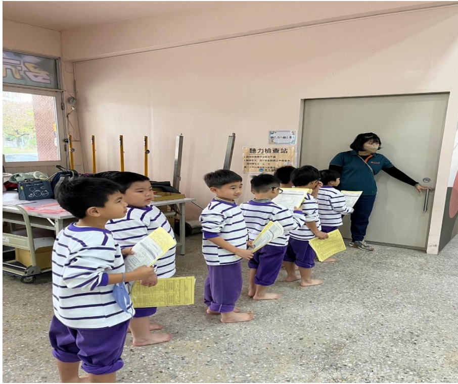
家長志工協助學生聽力檢查工作