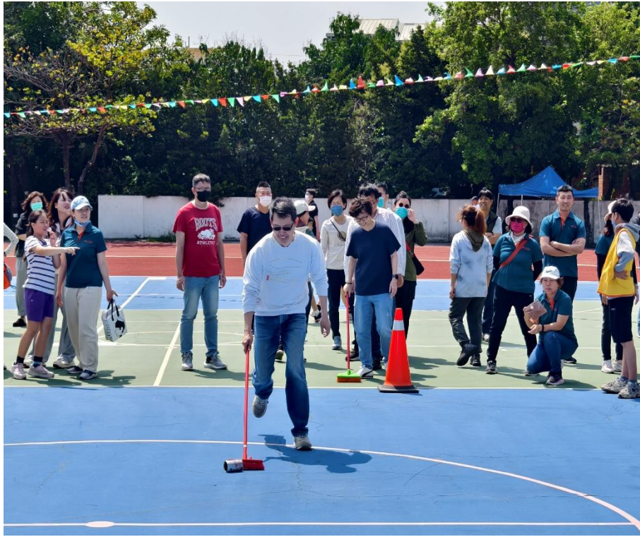
家長們熱烈參與趣味競賽：【防治登革熱-巡倒清刷】