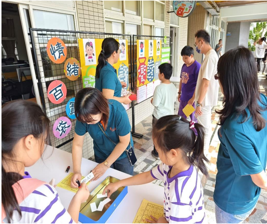
家長與學生一同參與「情緒百寶袋」闖關活動