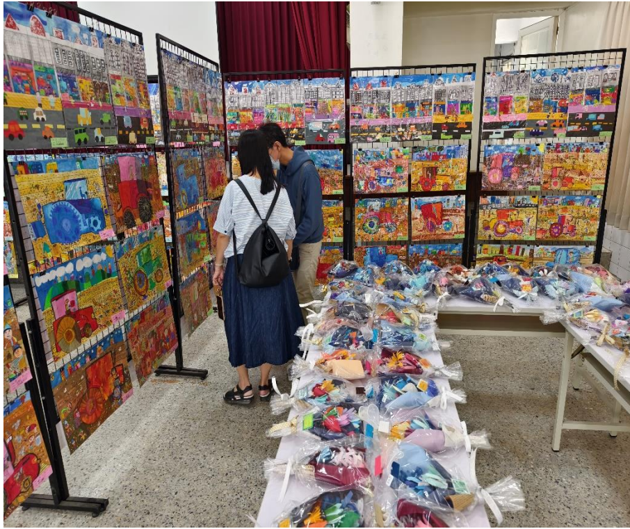
社區人士家長共同欣賞學生藝文特展美術作品