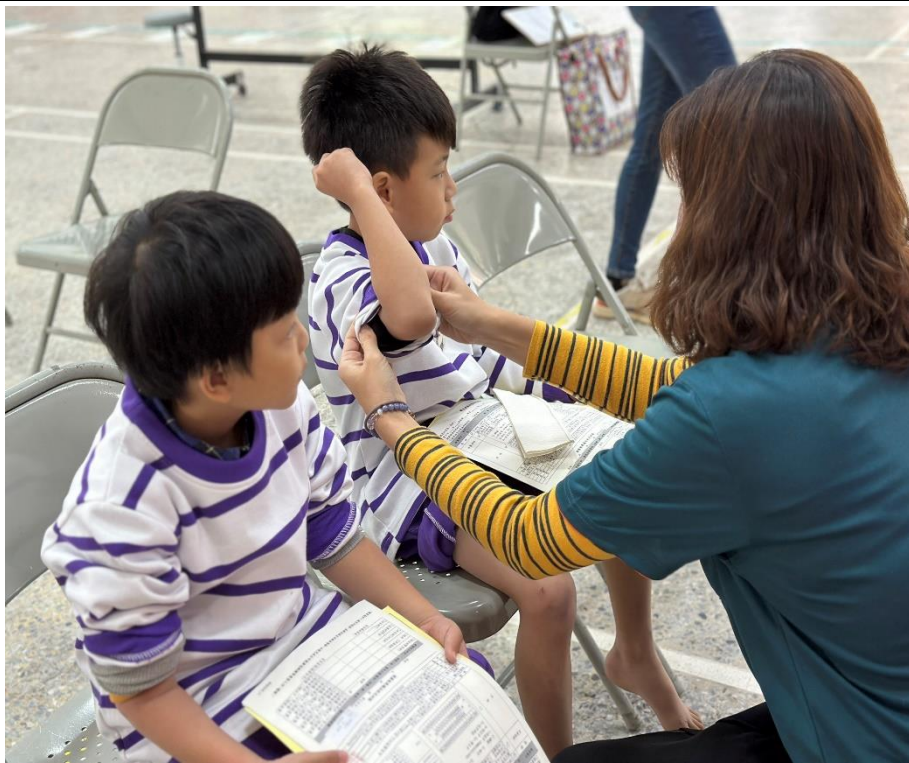
家長志工協助內兒科待檢的學生整理衣袖