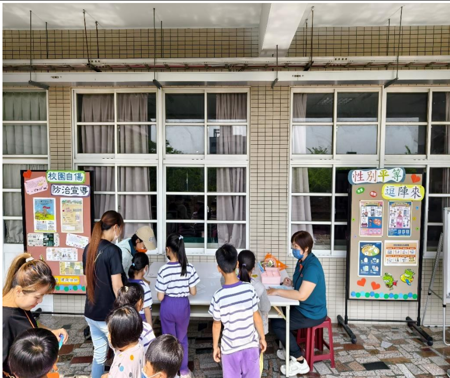
家長與學生一同參與「性別平等」闖關活動