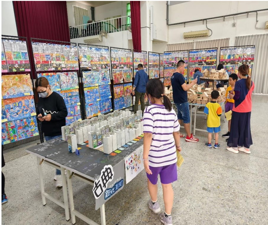
社區人士家長共同欣賞學生藝文特展美術作品