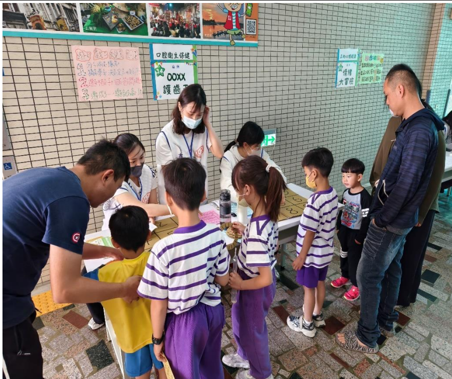
家長與學生一同參與「口腔保健」闖關活動