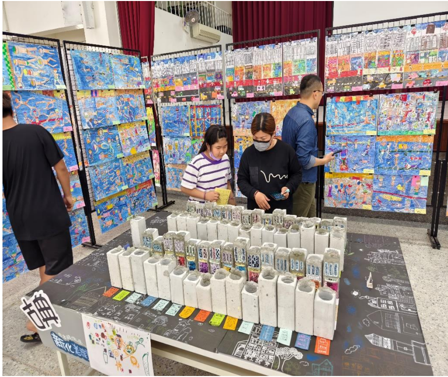
社區人士家長共同欣賞學生藝文特展美術作品