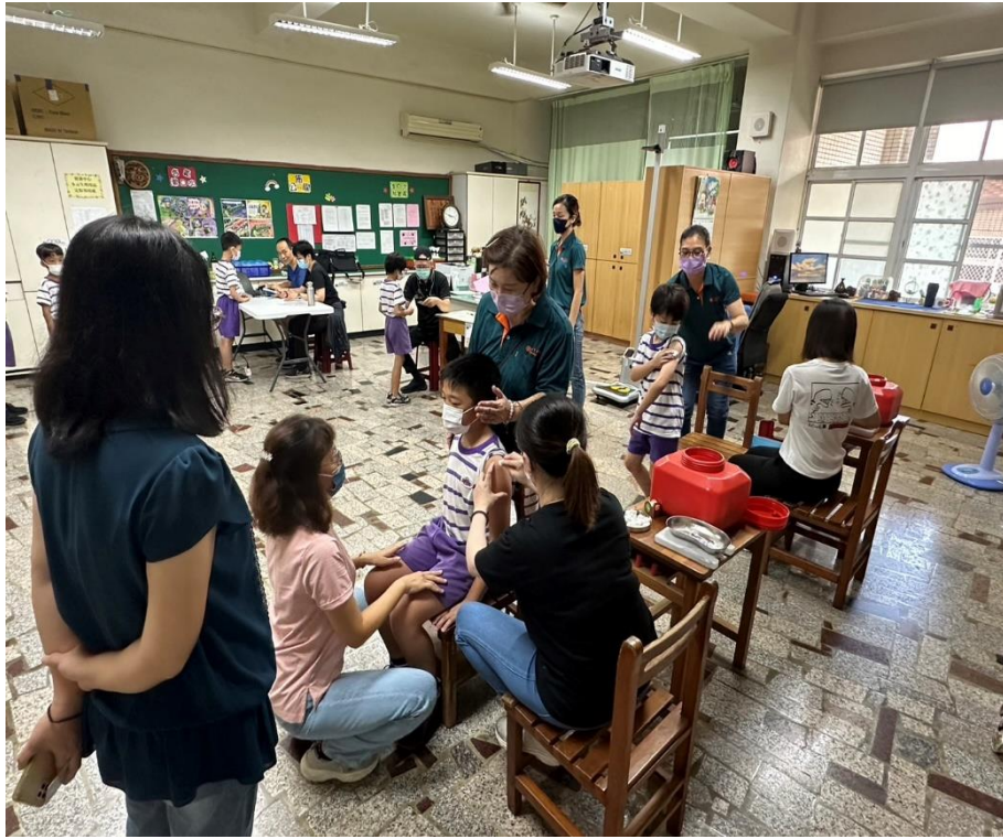
家長志工出穿著統一制服協助本校流感疫苗接種工作