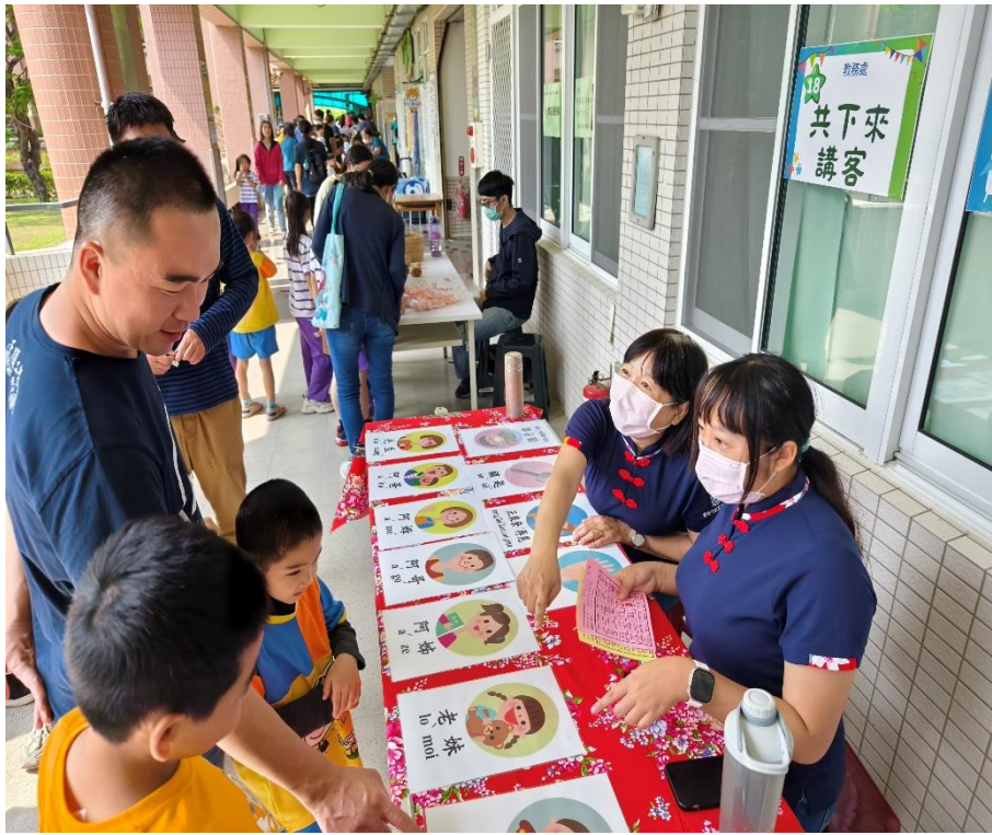
家長與學生一同參與「共下來講客」闖關活動