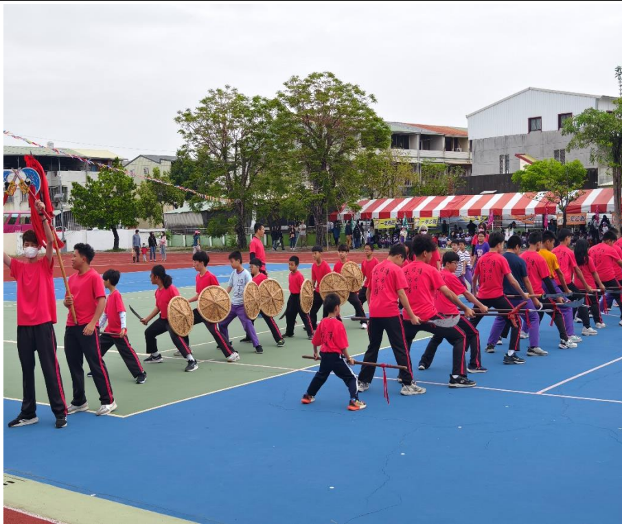
社區宋江陣團體精湛演出，一同歡慶校慶活動