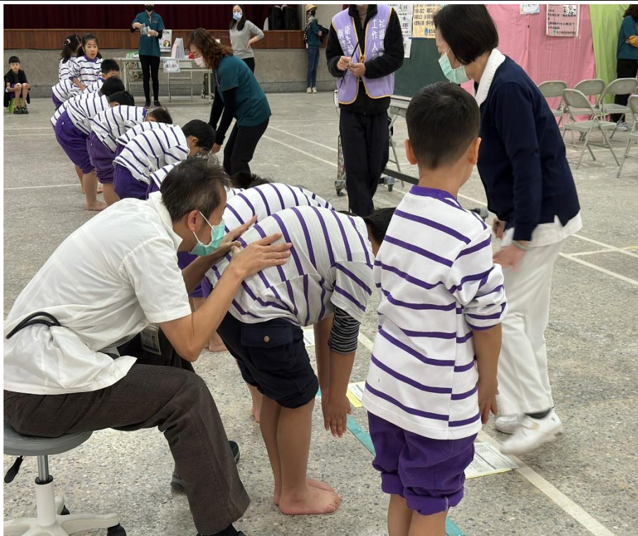
家長志工協助學生脊柱四肢檢查