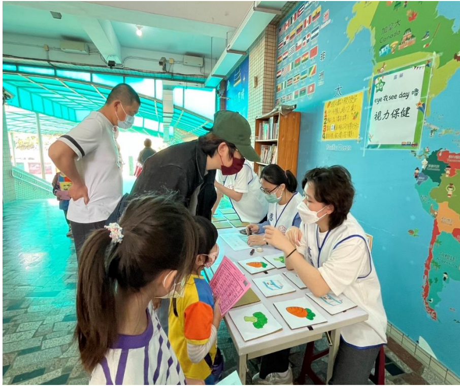
家長與學生一同參與「視力保健」闖關活動