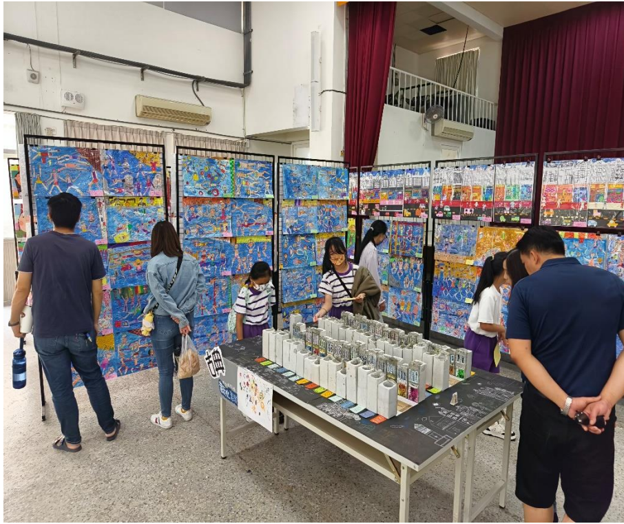
社區人士家長共同欣賞學生藝文特展美術作品