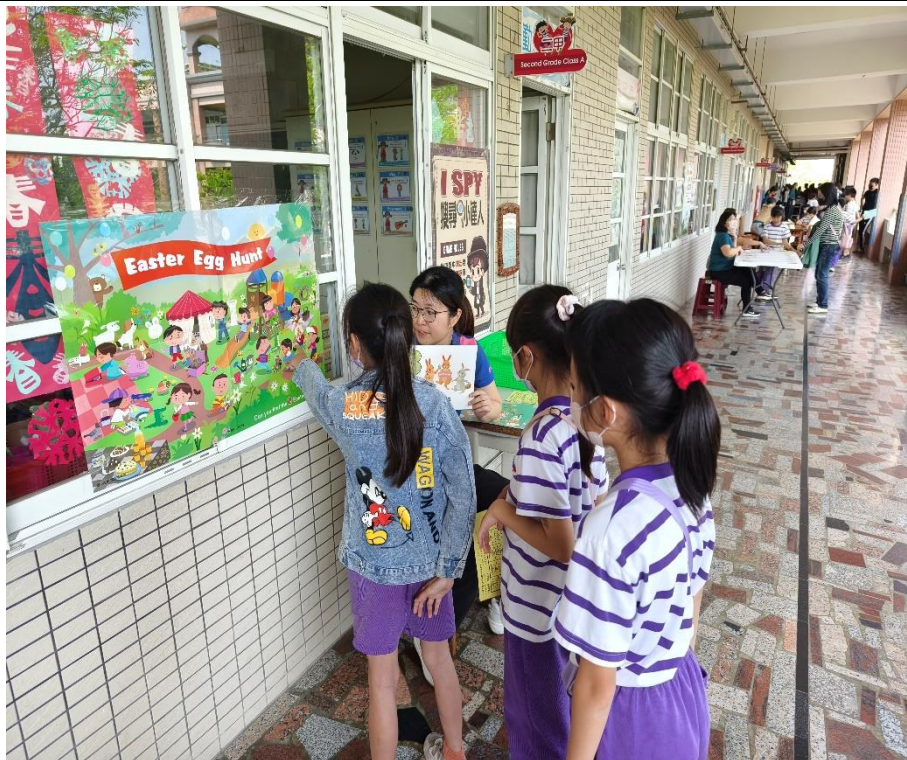
家長與學生一同參與「I SPY 小達人」闖關活動