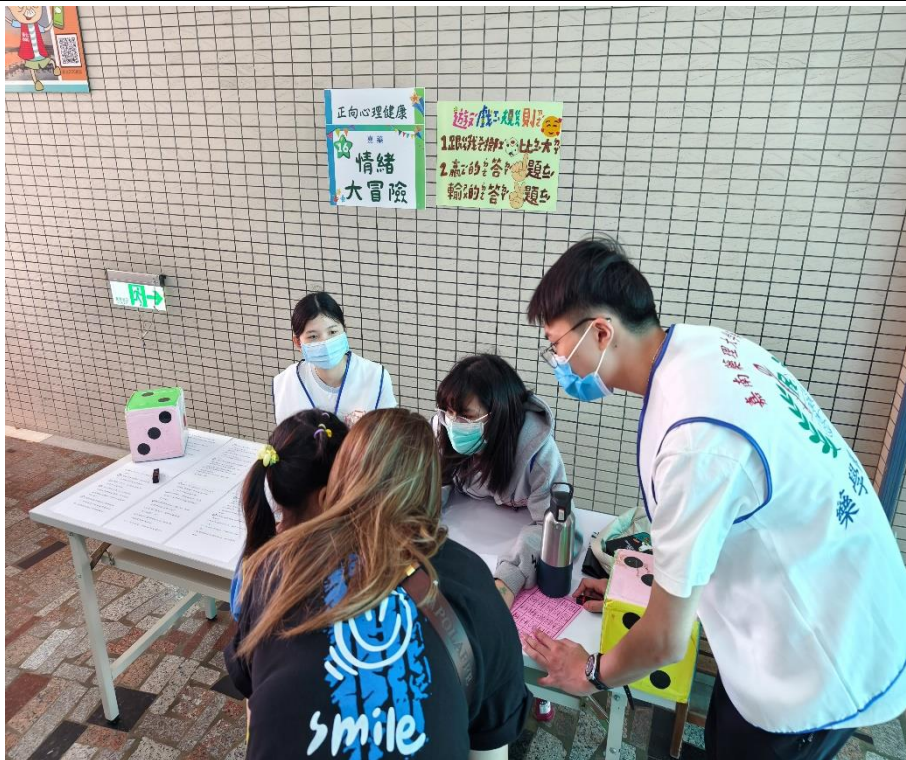
家長與學生一同參與「正向心理」闖關活動