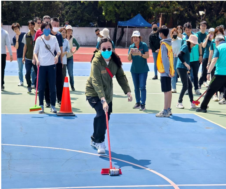
家長們熱烈參與趣味競賽：【防治登革熱-巡倒清刷】