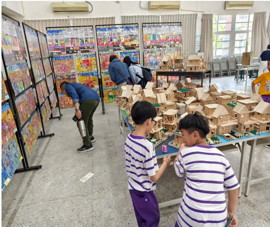
社區人士家長共同欣賞學生藝文特展美術作品