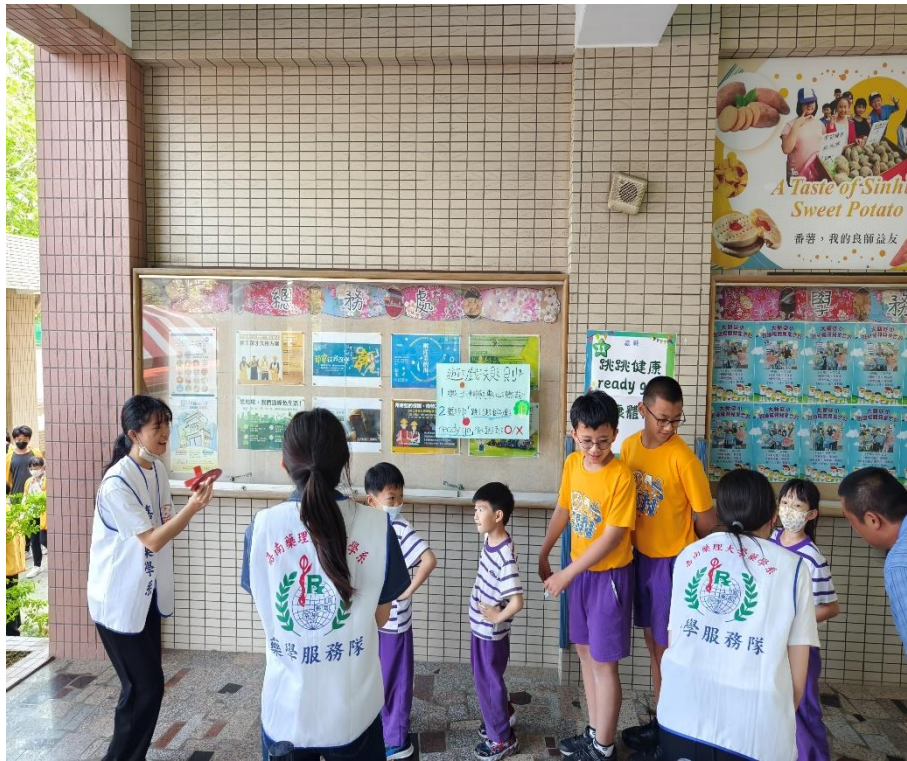
家長與學生一同參與「健康體位」闖關活動