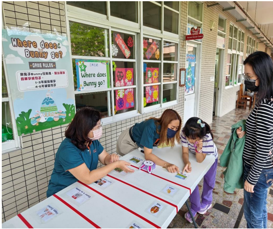
家長與學生一同參與「Where does Bunny go?」闖關活動