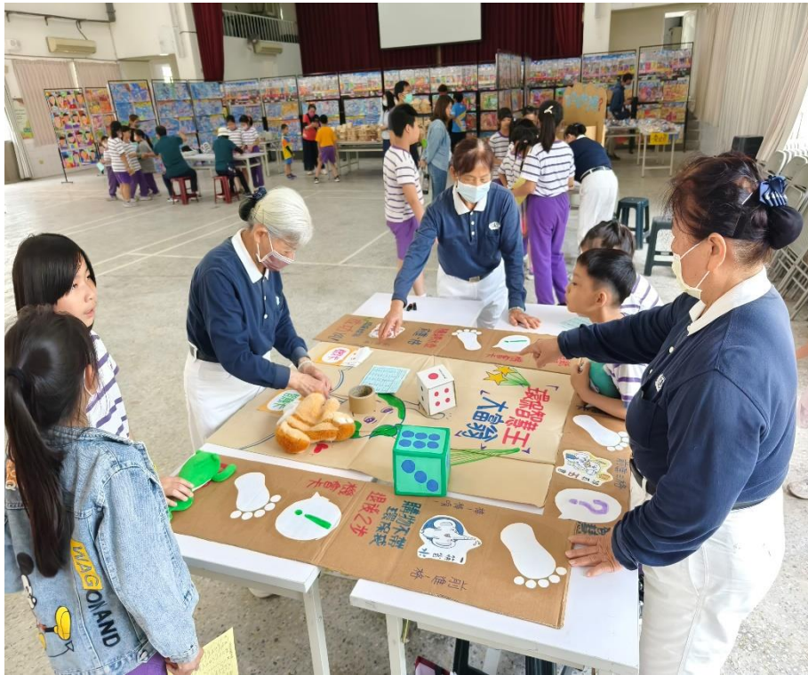
社區人士家長共同參與環保愛地球闖關活動