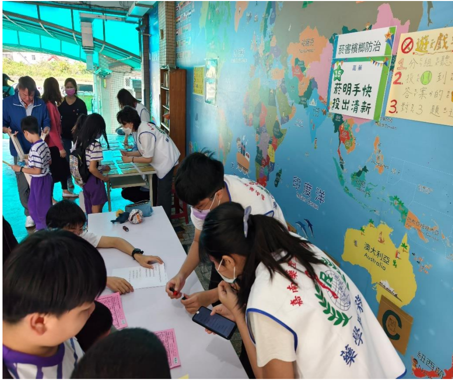
家長與學生一同參與「菸檳防治」闖關活動