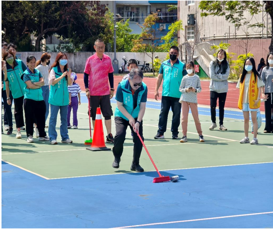
家長們熱烈參與趣味競賽：【防治登革熱-巡倒清刷】