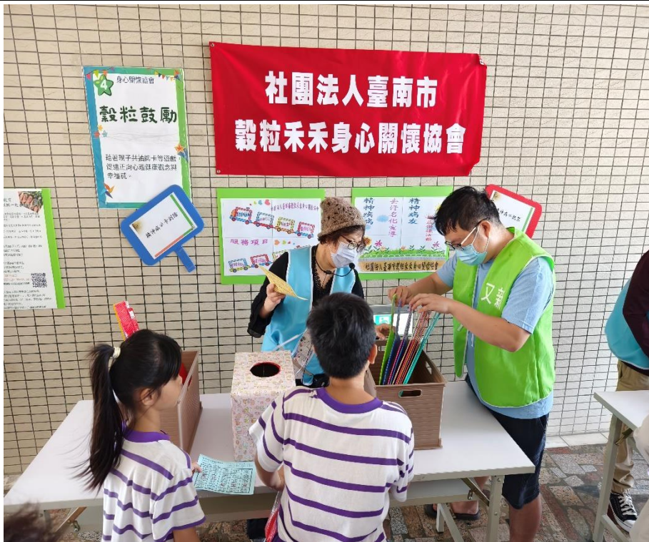
家長與學生一同參與「身心關懷協會」闖關活動