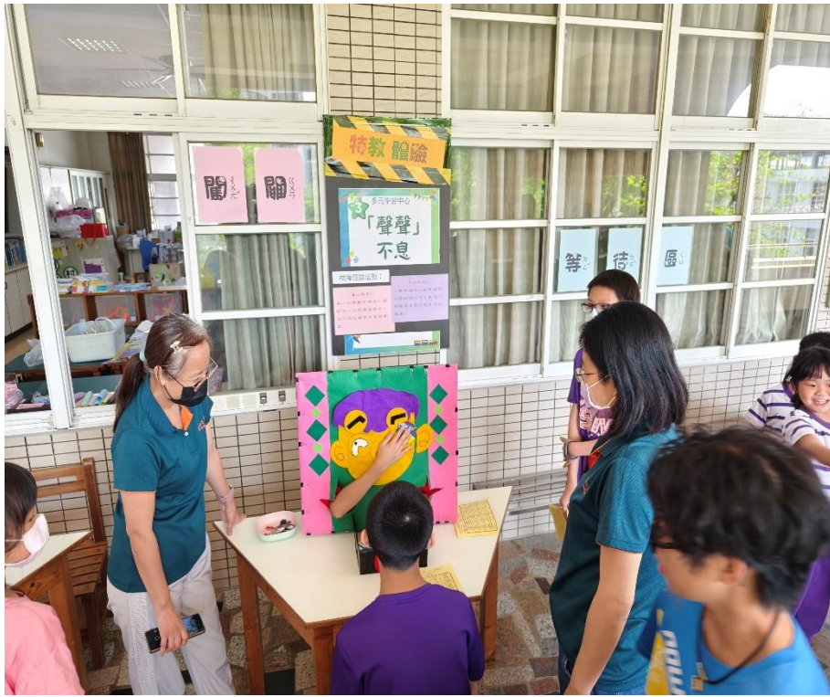
家長與學生一同參與「特教體驗」闖關活動