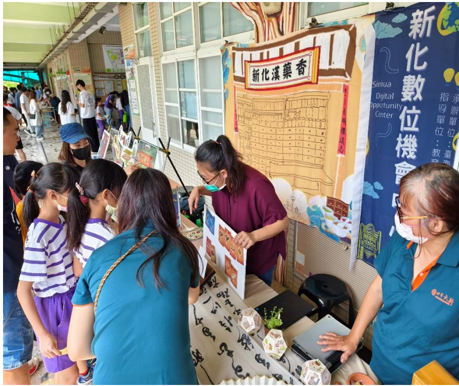
家長與學生一同參與「新化漢藥香」闖關活動