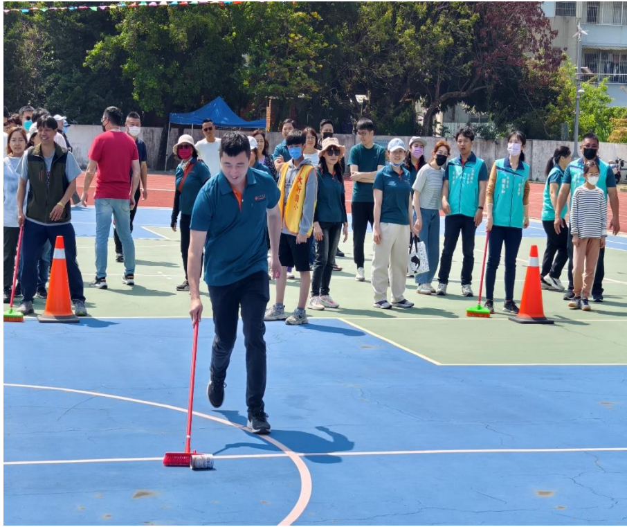
家長們熱烈參與趣味競賽：【防治登革熱-巡倒清刷】