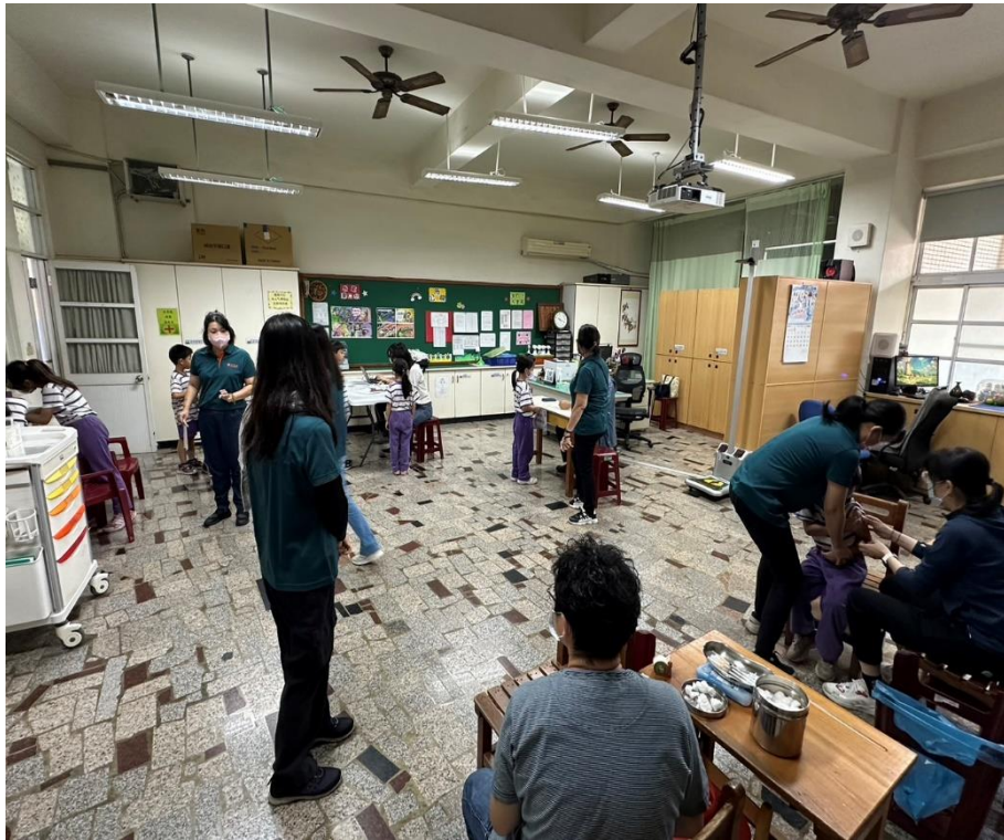
家長志工出穿著統一制服協助本校 covid-19 疫苗接種工作