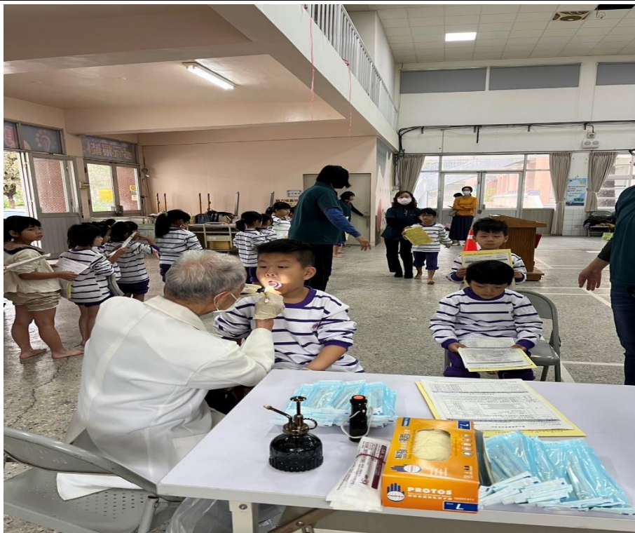
家長志工協助引導學生依序進行健康檢查