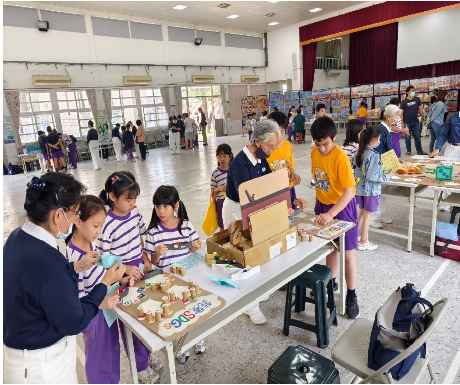
社區人士家長共同參與環保愛地球闖關活動