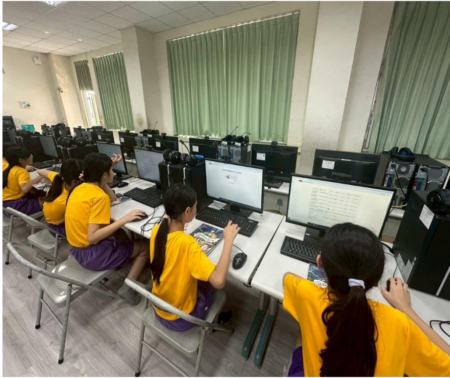
學生進行「友善校園人權環境評估線上問卷」