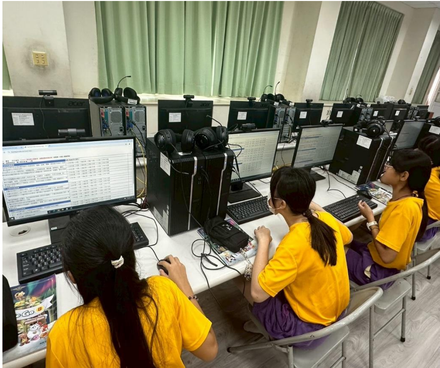
學生進行「友善校園生活評估線上問卷」