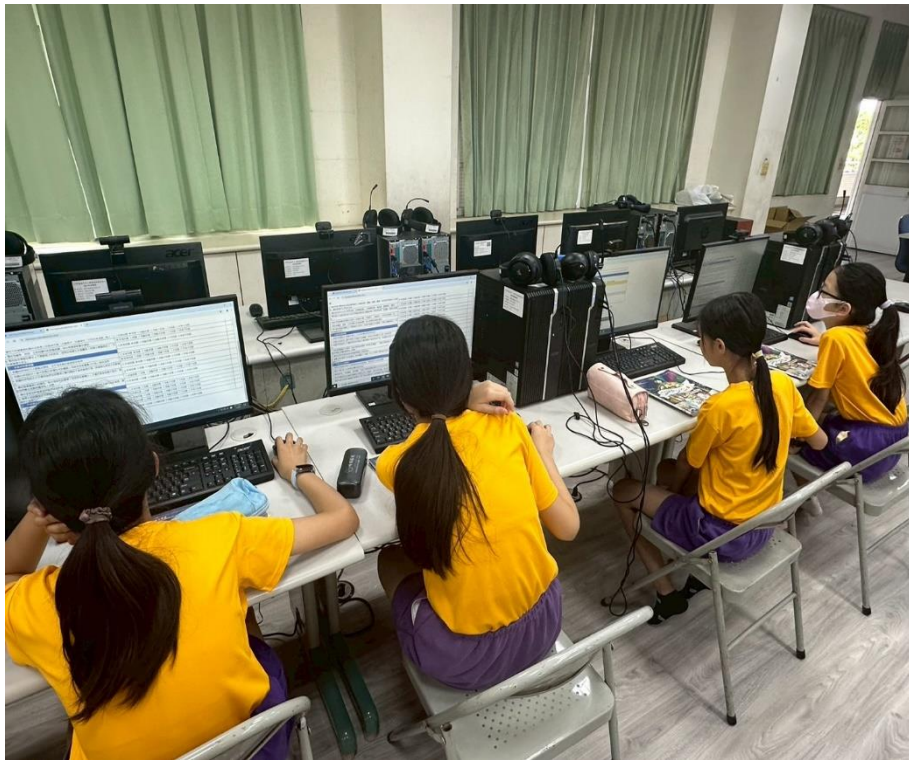
學生進行「友善校園生活評估線上問卷」