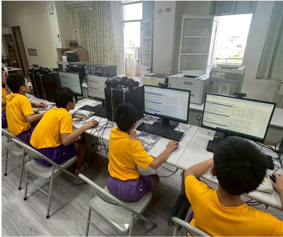
學生進行「友善校園生活評估線上問卷」