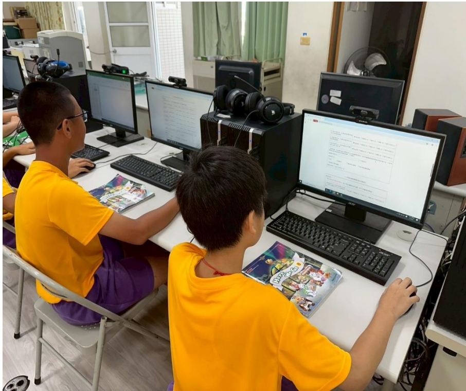
學生進行「友善校園人權環境評估線上問卷」