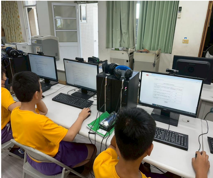
學生進行「友善校園人權環境評估線上問卷」