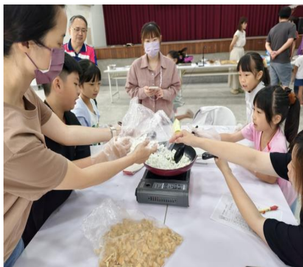
說明：分組動手做-放入小棉花糖