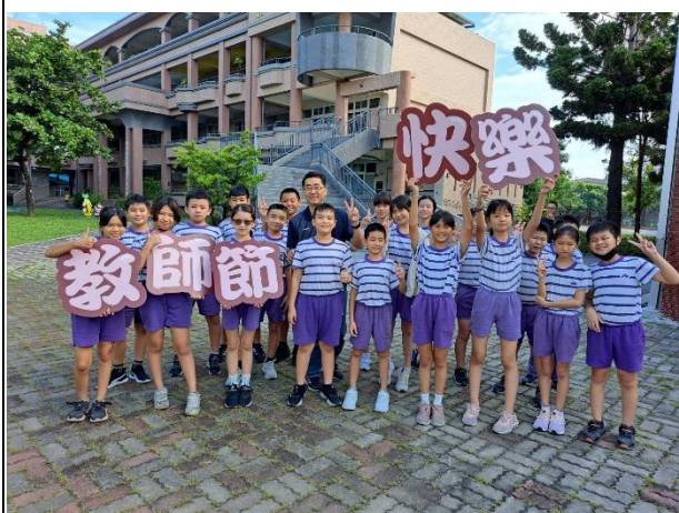
說明：六年甲班師生的合影留念