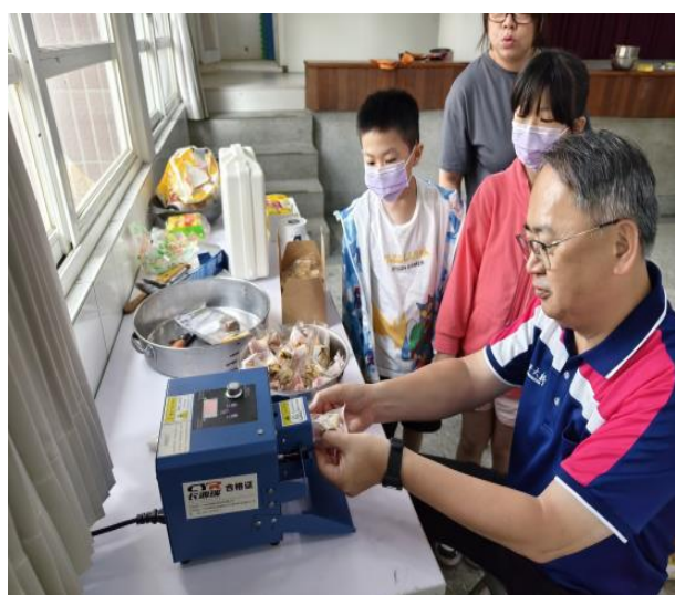
說明：校長協助包裝雪Q餅