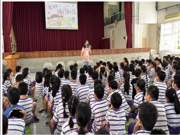
說明：學務主任介紹教師節奉茶活動的流程