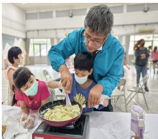
說明：父子攜手將棉花糖與奶油融化