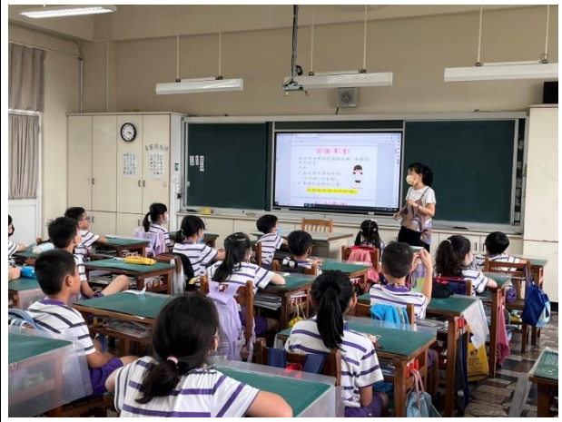
說明：中年級老師進行性平教育入班宣導