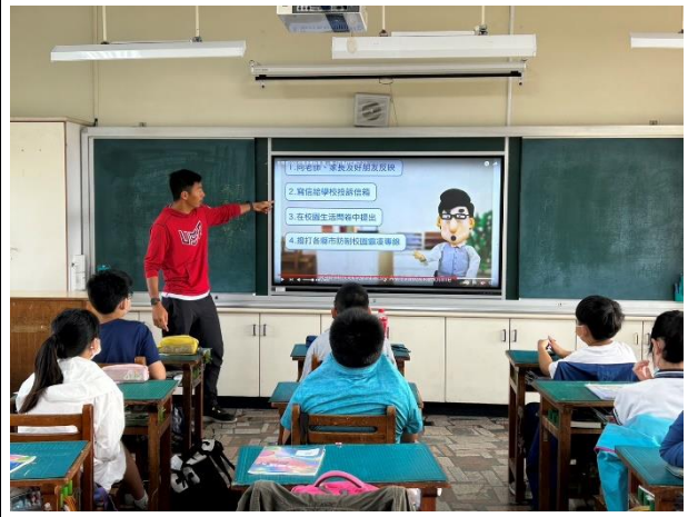
說明：遭遇霸凌時的處理方式