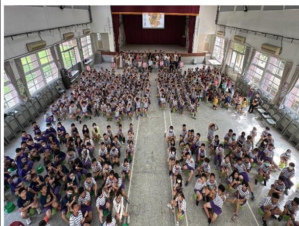
說明：百年樹人，奉茶敬師，老師~謝謝您！