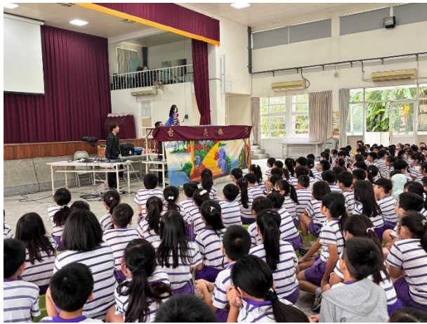
說明：其雄布袋戲到校進行反霸凌宣導