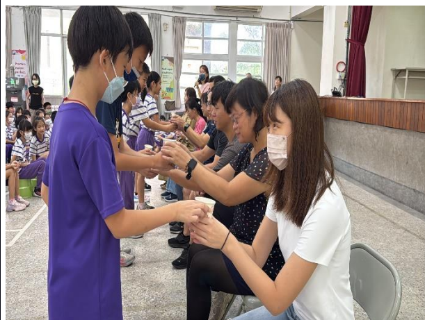
說明：學生向親愛的老師們奉茶致意