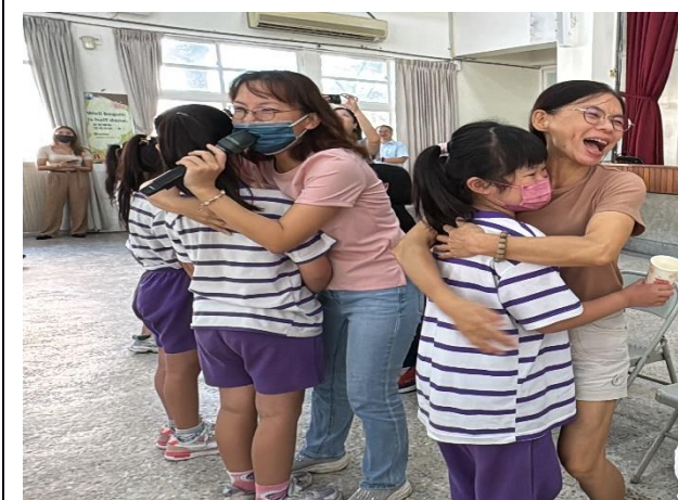
說明：給老師們一個大大的擁抱