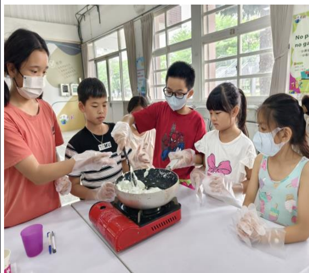
說明：孩子輪流學習炒棉花糖