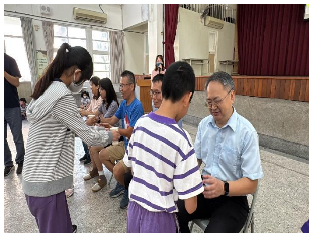
說明：學生向校長與行政老師們奉茶致意