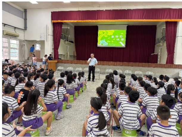
說明：校長介紹教師節奉茶活動的意義