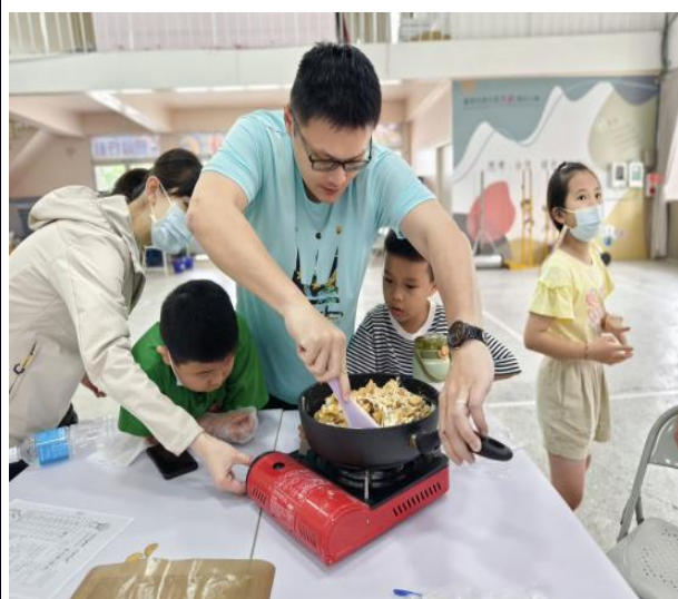
說明：親子合作翻炒雪Q餅