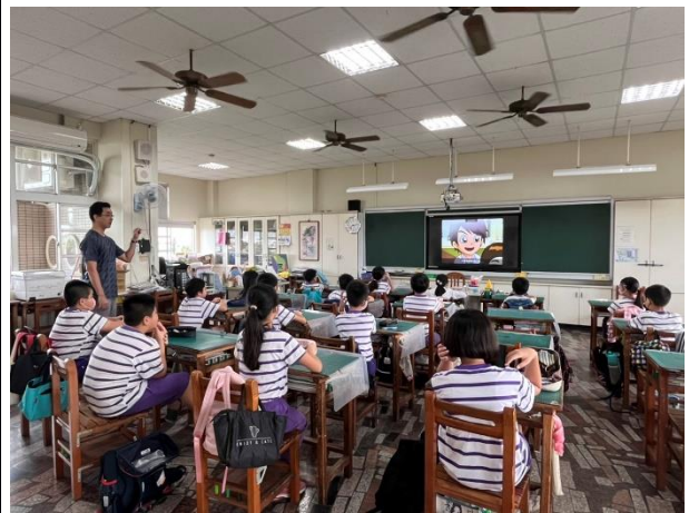
說明：高年級老師進行性平教育入班宣導