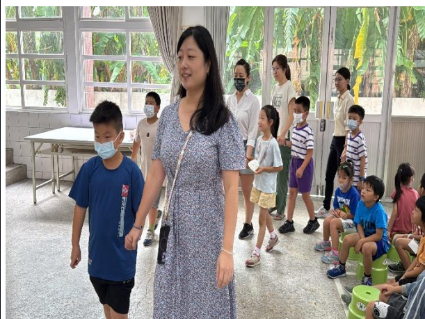
說明：牽起敬愛老師們的手