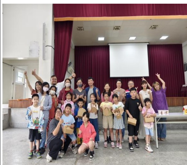
說明：親職教育活動圓滿成功!