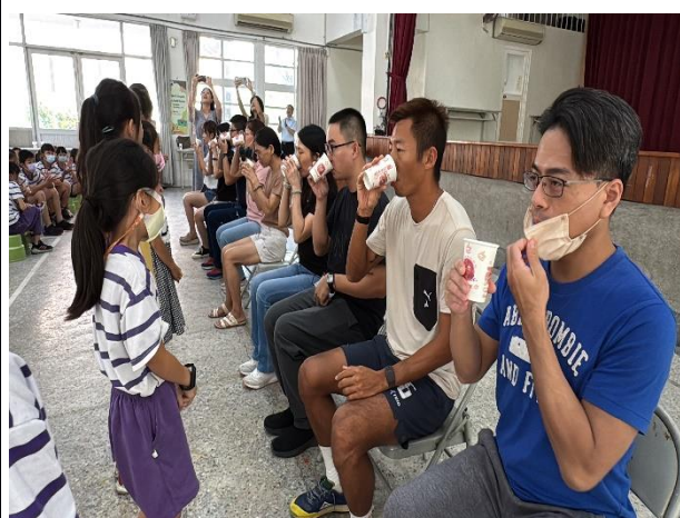
說明：老師們喝下學生滿滿的祝福心意