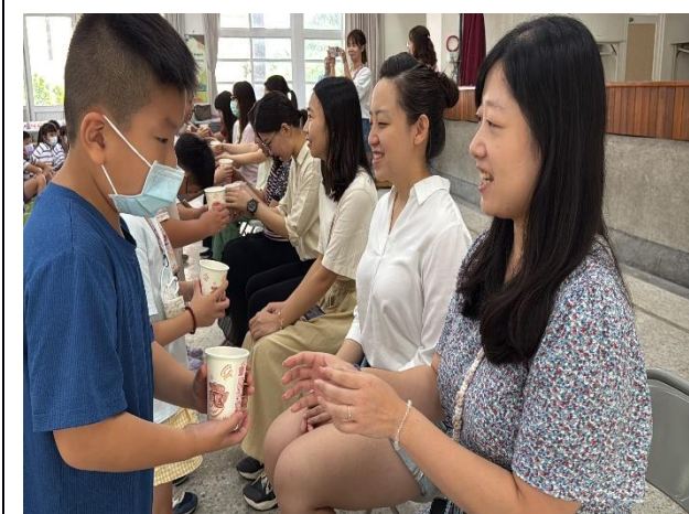
說明：學生向親愛的老師們奉茶致意