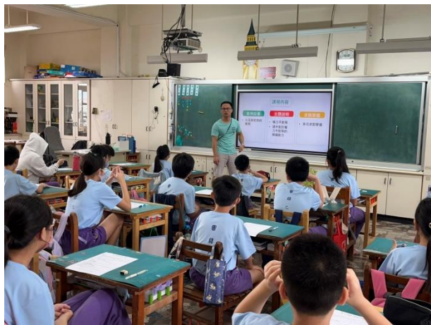
說明：高年級老師進行性平教育入班宣導