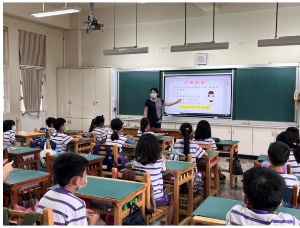
說明：中年級老師進行性平教育入班宣導