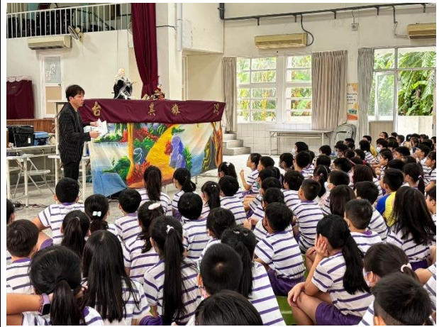
說明：透過布袋戲演出宣導反霸凌重要性