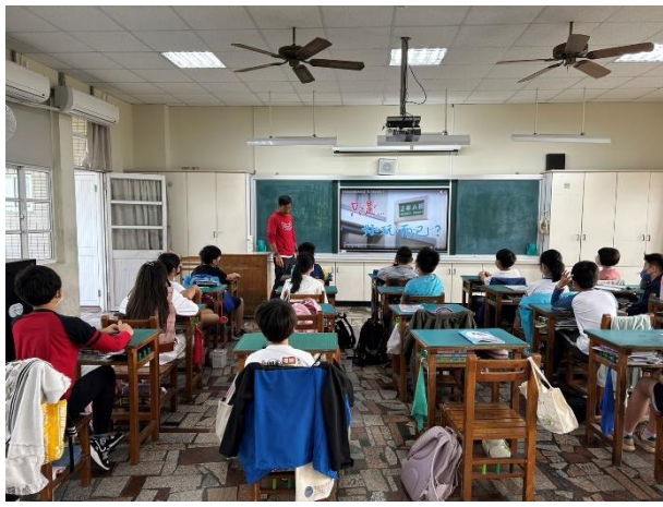
說明：老師進行課堂防治校園霸凌宣導