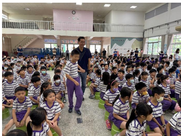
說明：牽起敬愛老師們的手