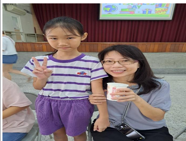
說明：向老師傳達我最真摯的敬意