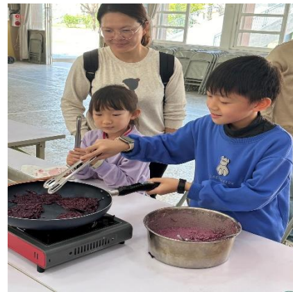
說明：我是地瓜煎餅小達人~