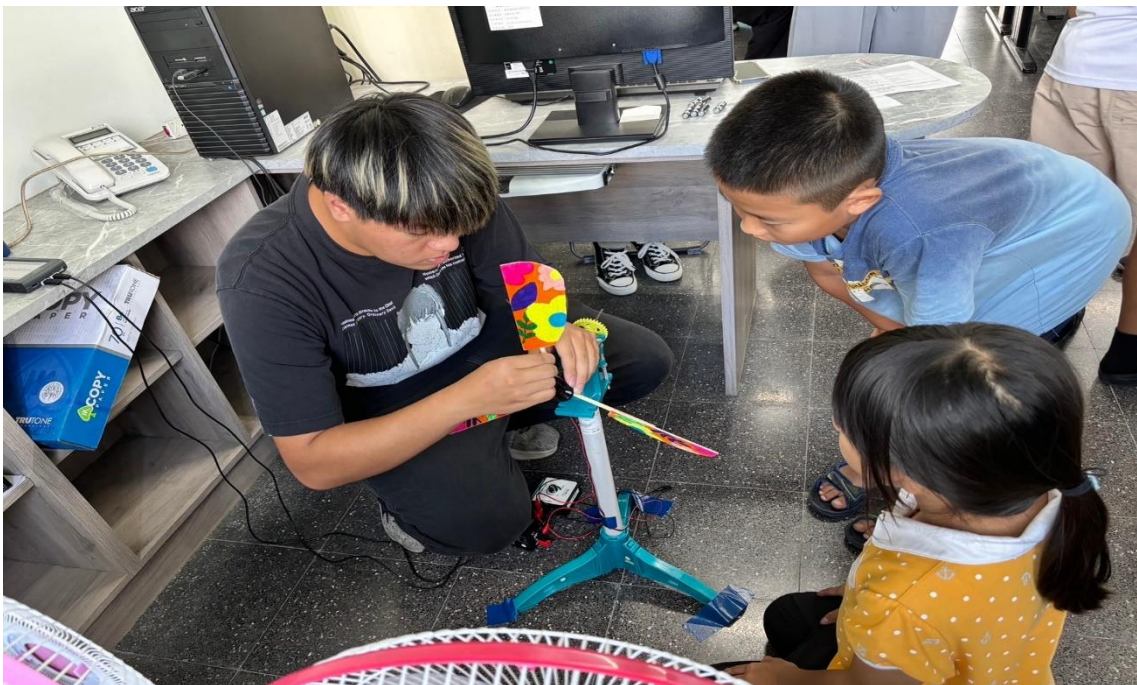
進行手繪風車的風力發電檢測