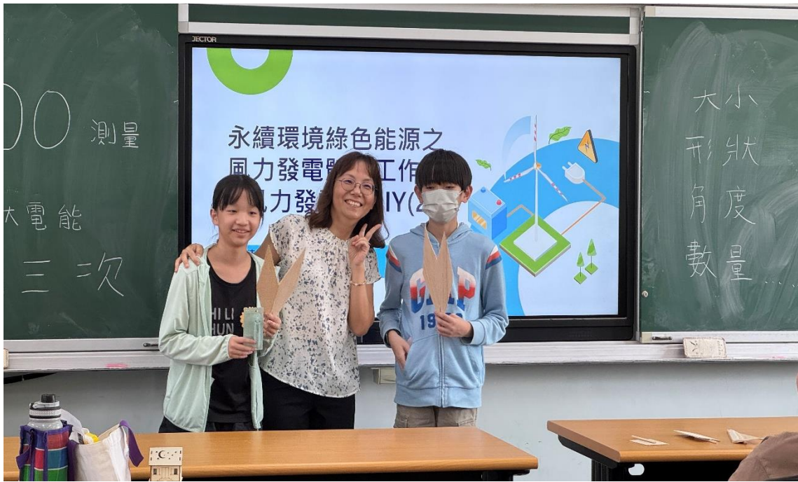
工作坊成員參加心得與作品分享