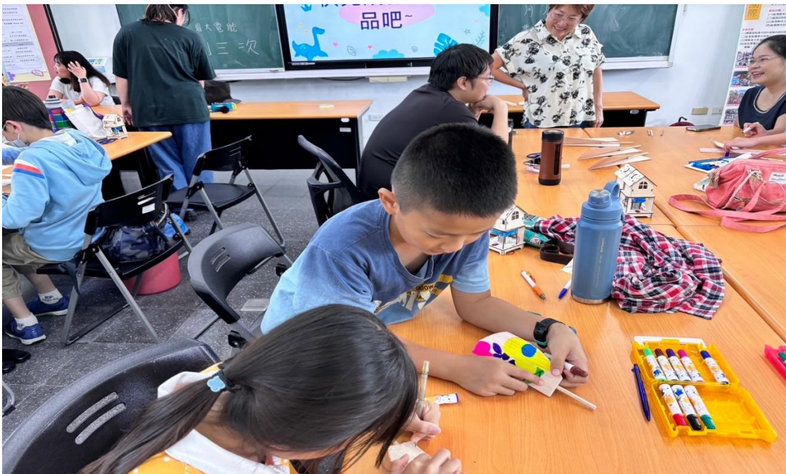
彩繪獨一無二的木製風車