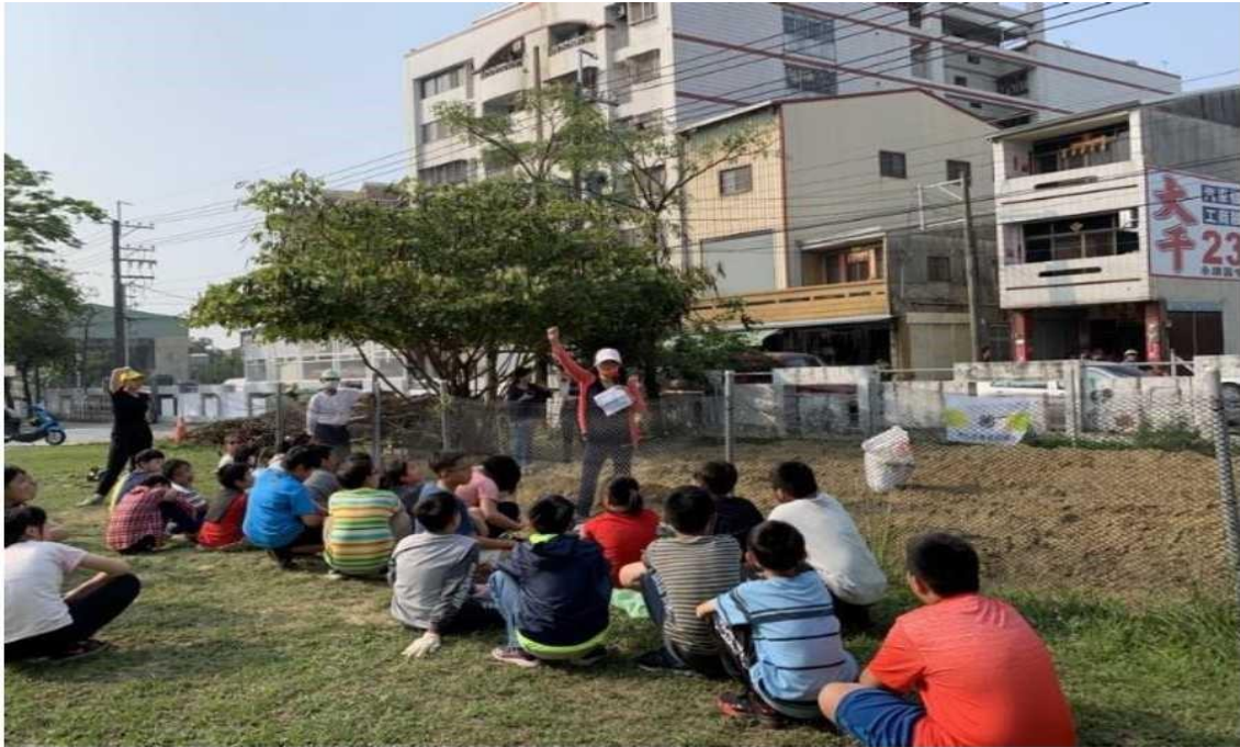
小朋友認真地聽講並學習