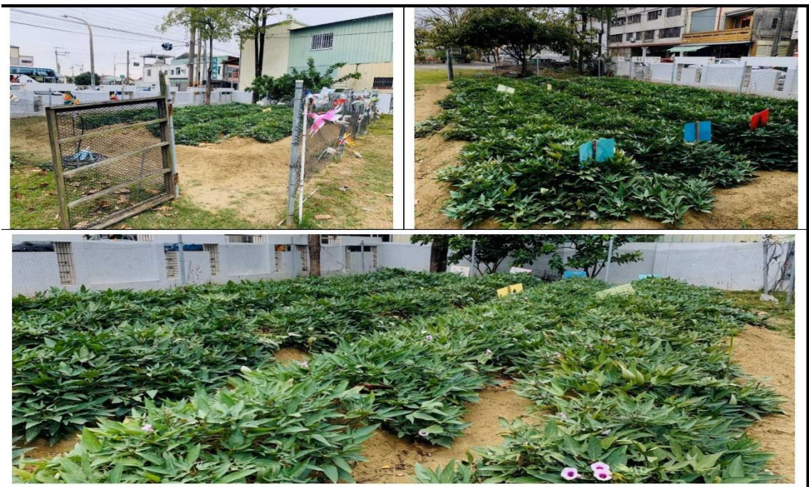
利用校園空地設置「大新農場」，茂盛的地瓜藤，預期今年的大豐收！