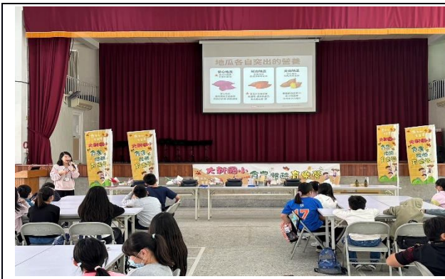
說明：認識自己所採收的地瓜