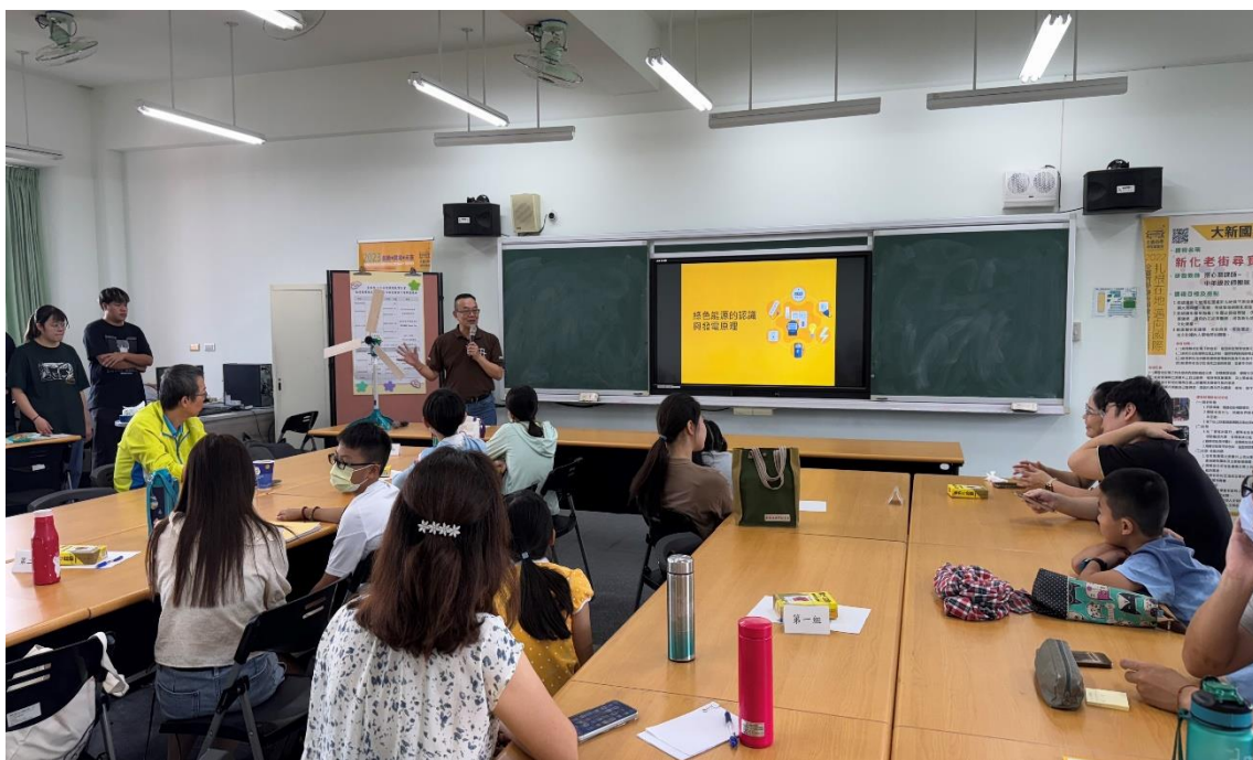
長榮大學教授介紹「綠色能源的認識與發電原理」