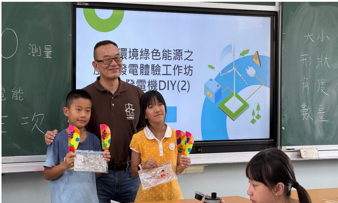
工作坊成員參加心得與作品分享