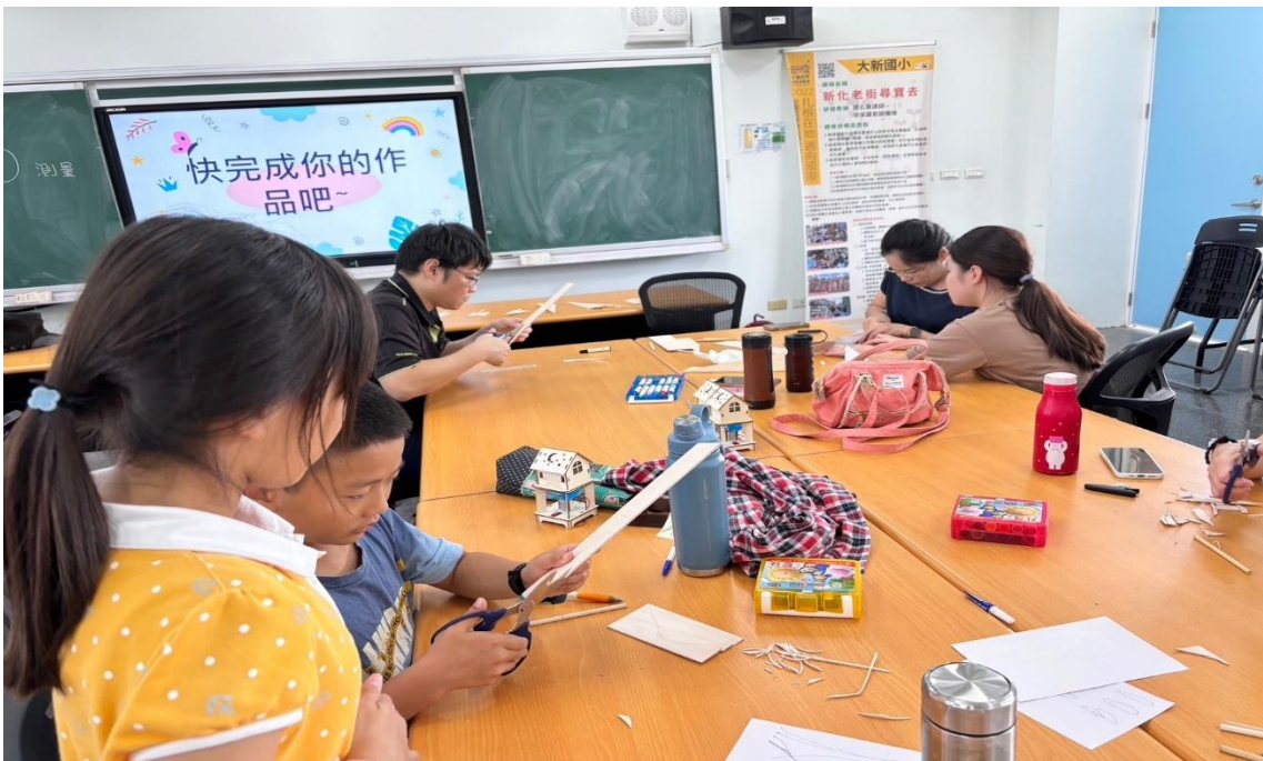
分工裁剪大小適宜的風車葉片