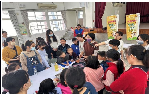
說明：聚精會神聆聽地瓜煎餅製作