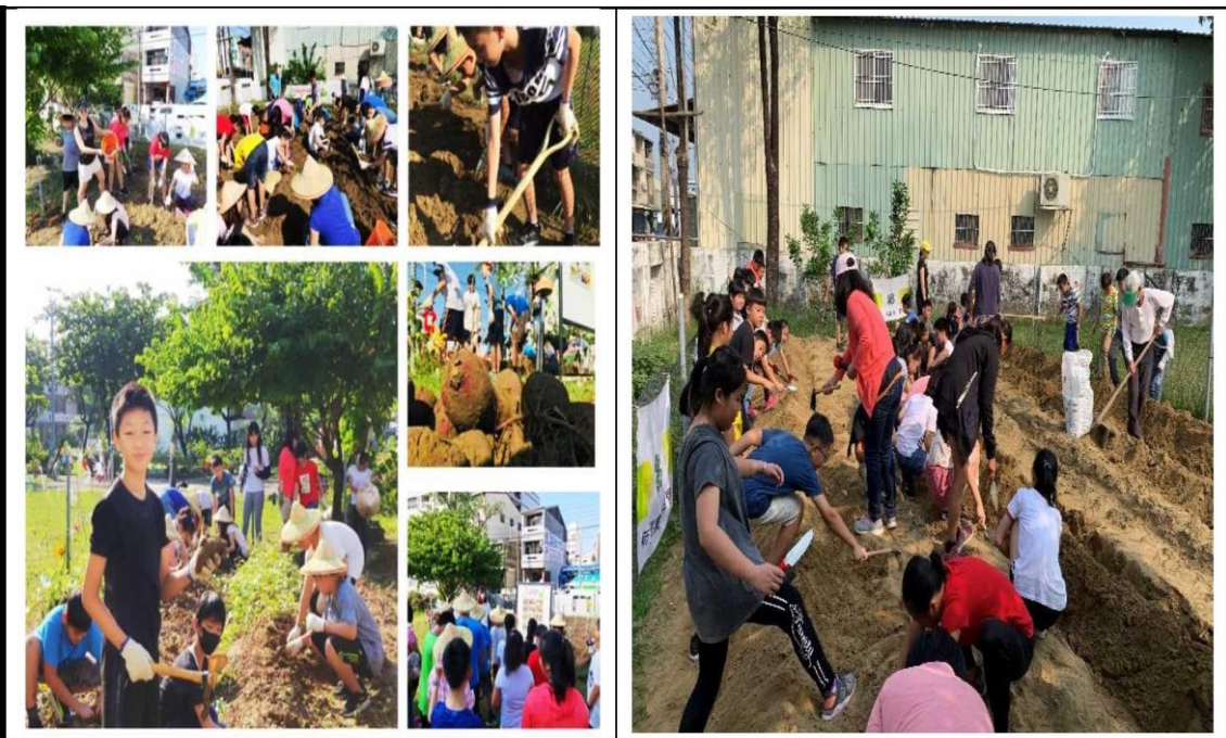
大家齊心協力整地與翻土