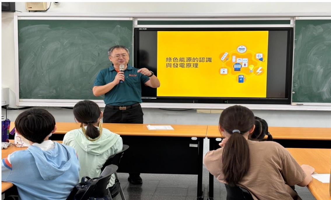
校長致詞-倡導永續能源發展目的與重要性