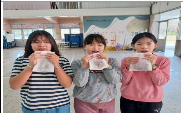
說明：自己手作的地瓜煎餅最好吃!