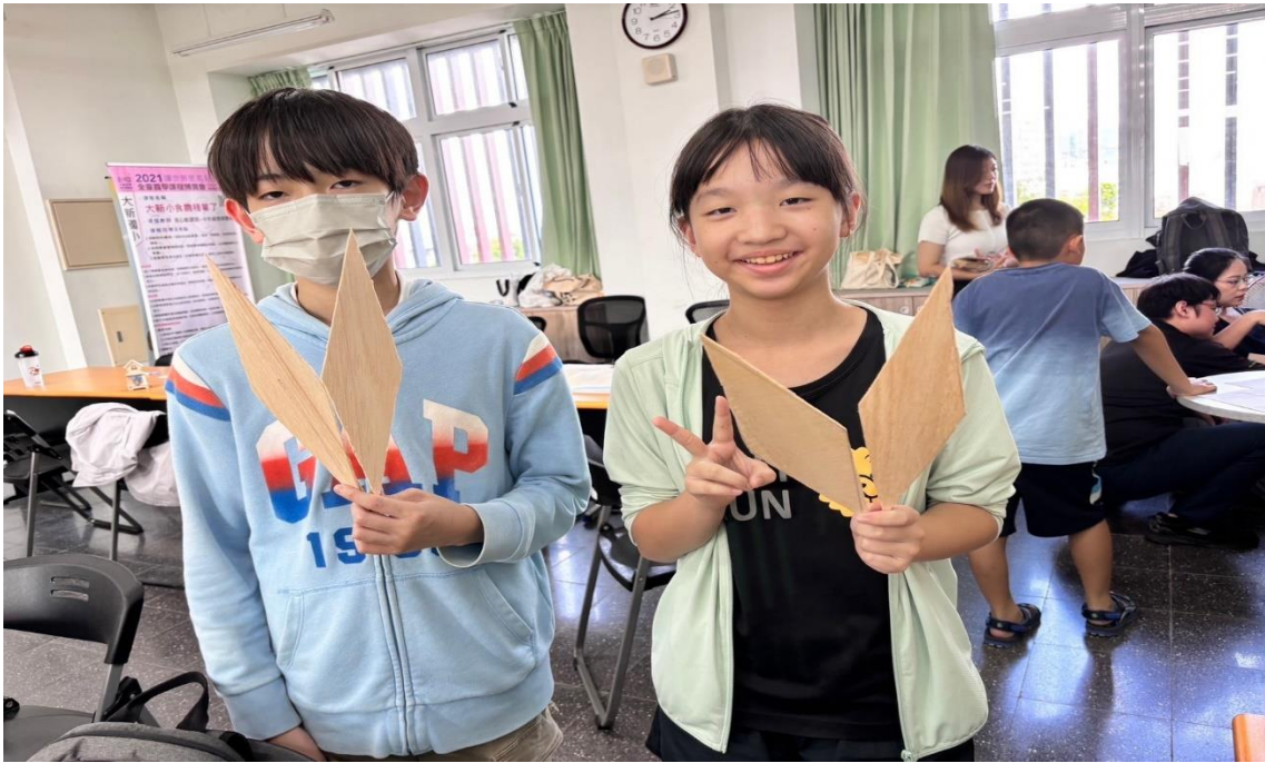
裁剪完成自己的風車葉片