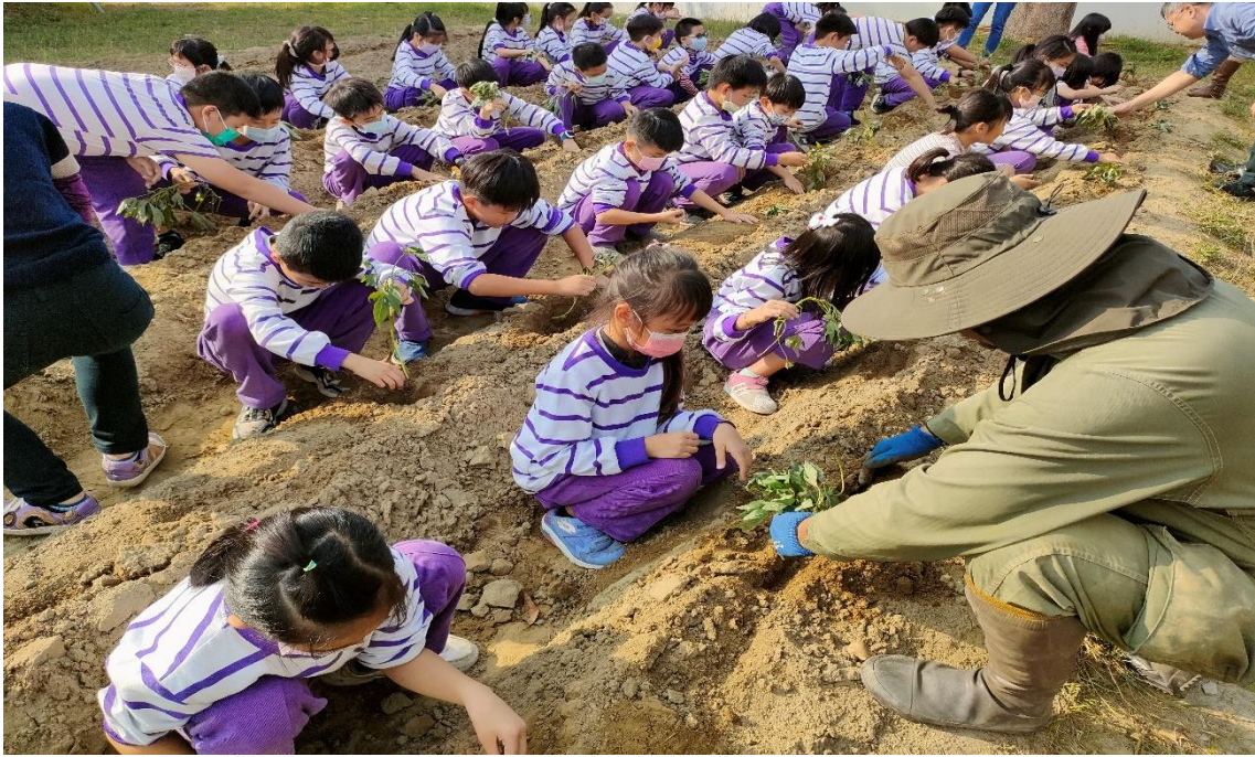
一起埋頭努力種植地瓜秧苗