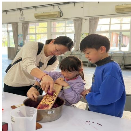
說明：全家分工合作學習刨地瓜