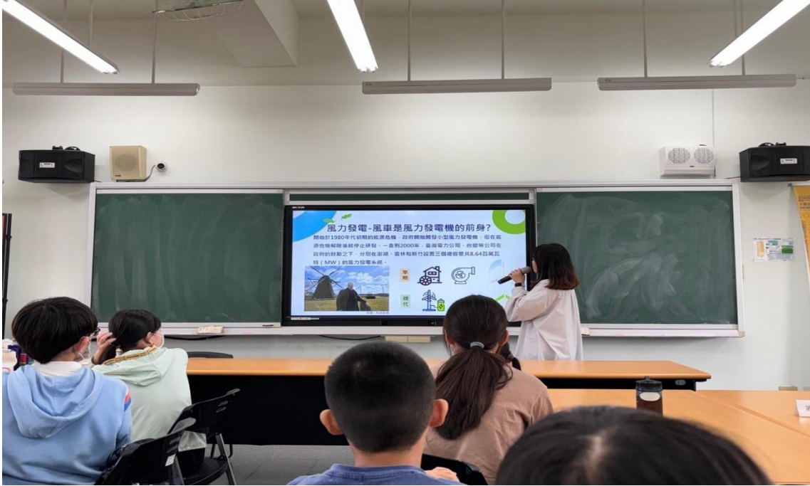
講師介紹風力發電與風車製作