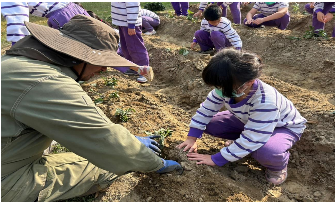
地瓜秧苗種植後，用土覆蓋並整理妥善