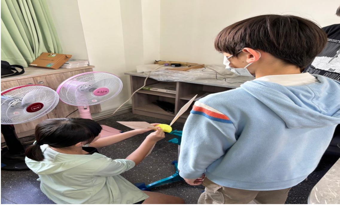
進行手作風車的風力發電檢測