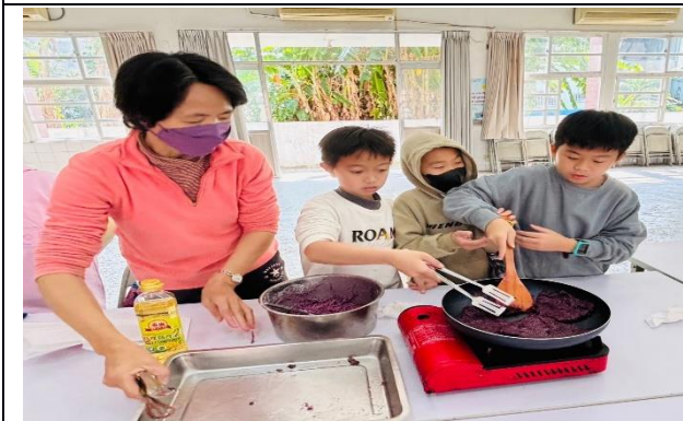
說明：分工合作煎地瓜餅