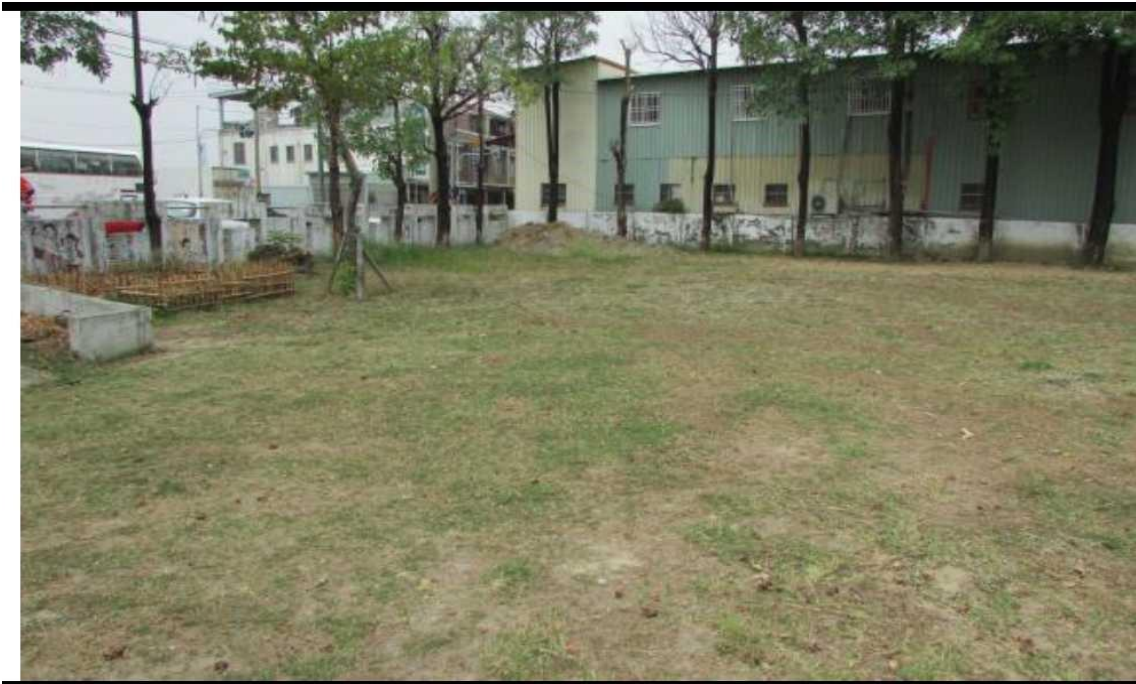
雜草叢生的閒置空地原貌

4-2-1 利用校園空地設置「大新農場」，結合新化農會與瓜瓜園資源，並依農務時序種植新化特產-地瓜，配合各年級課程進行教學與觀察。