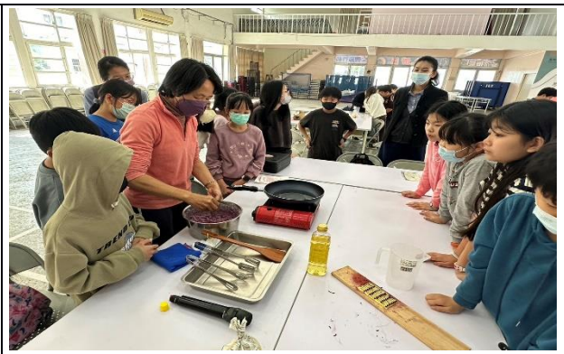
說明：製作地瓜煎餅示範說明