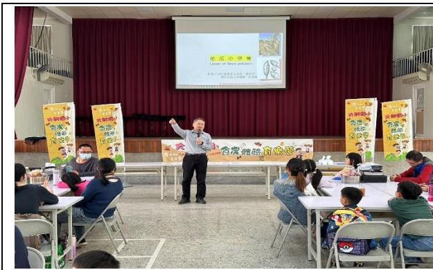
說明：地瓜小學堂開課囉！