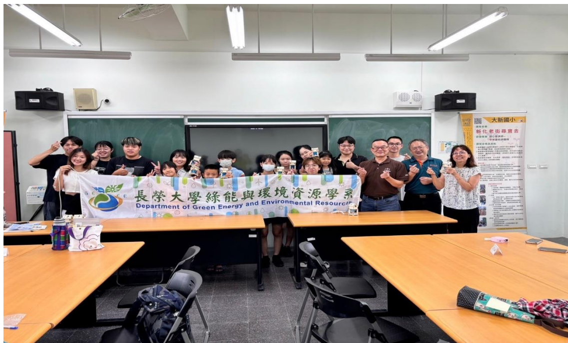
體驗工作坊共同合影留念