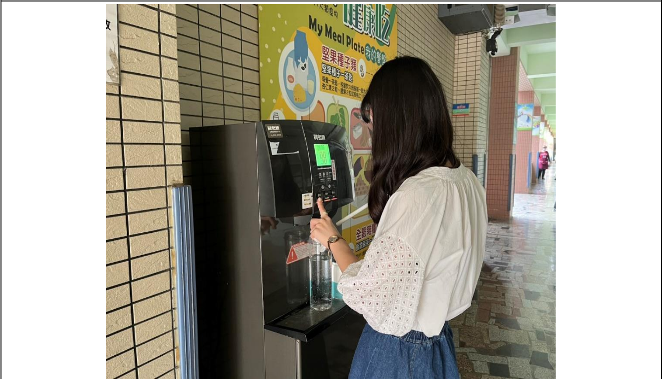
上課前先裝好白開水，隨時補充水分