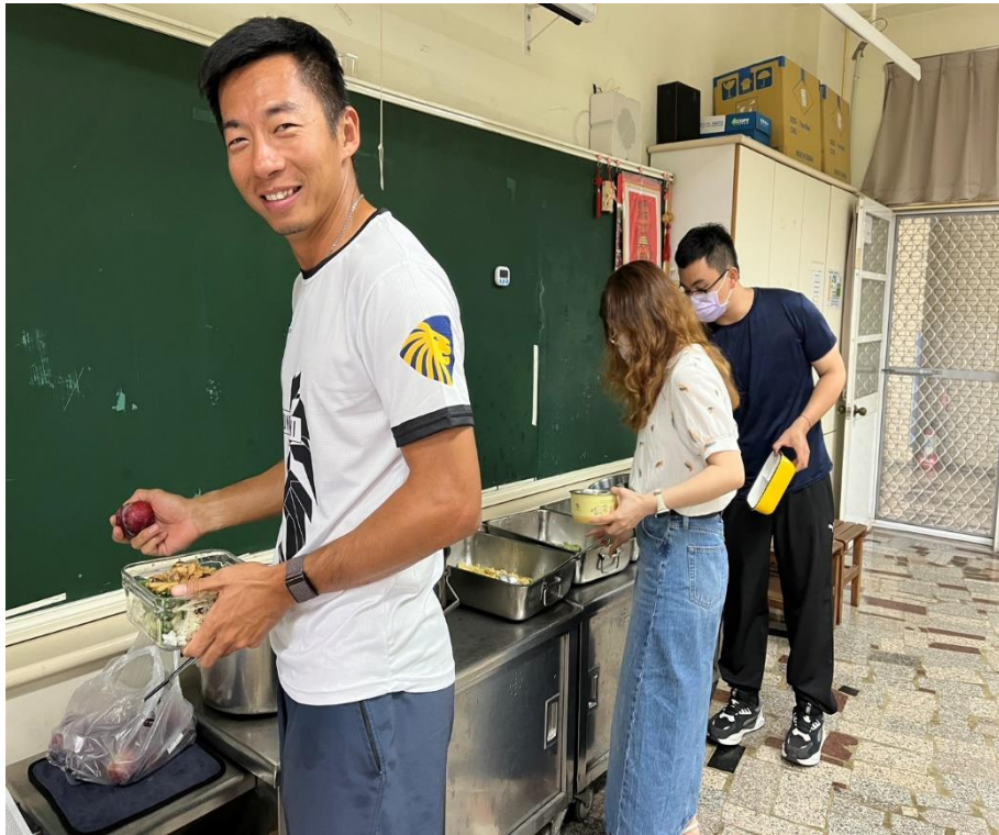
週四蔬食日-行政教職同仁開心用餐