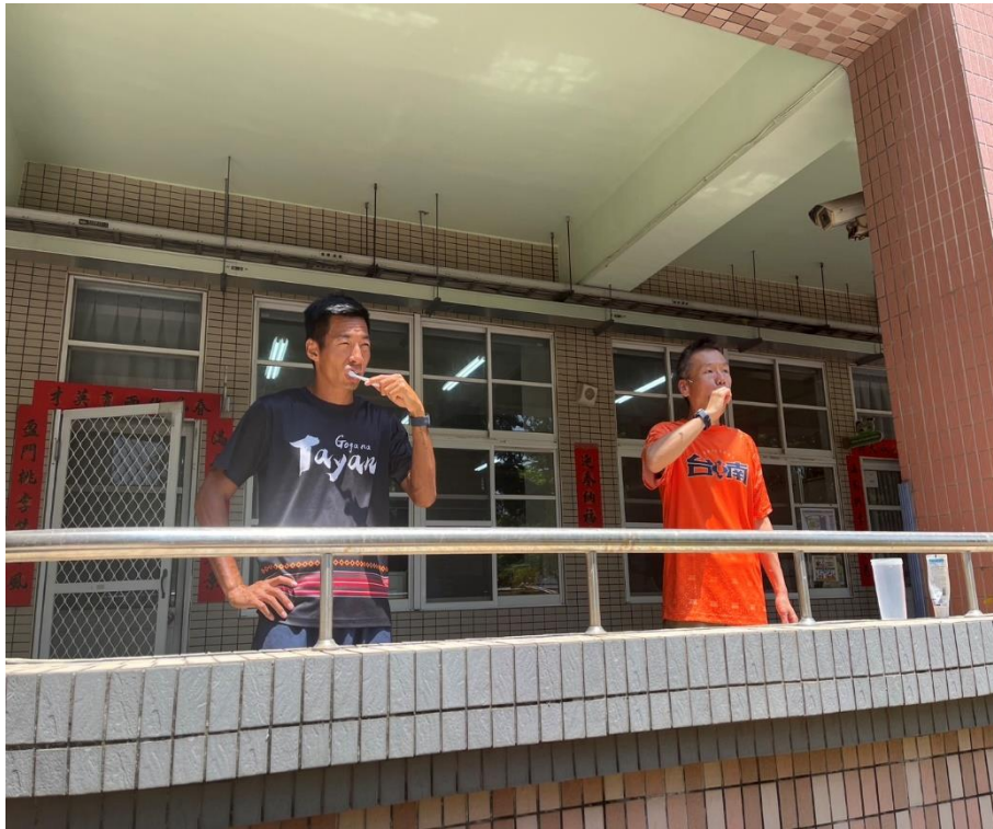
學務處老師餐後潔牙