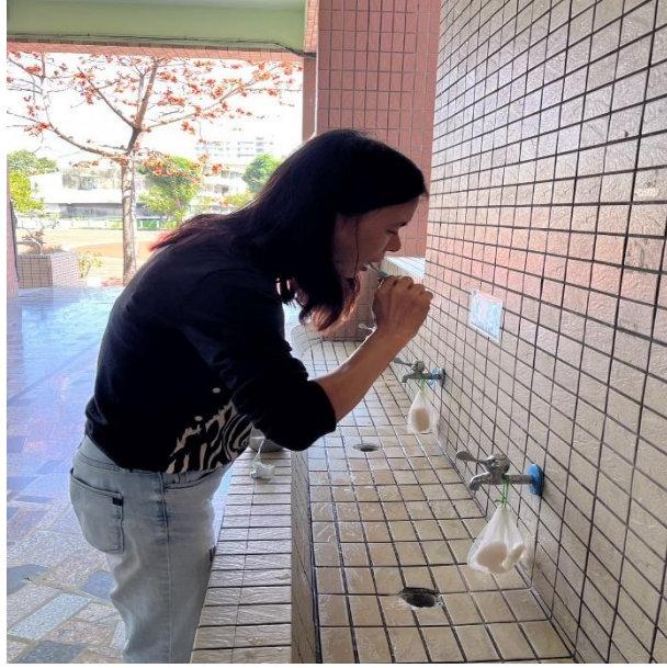
午秘老師餐後潔牙