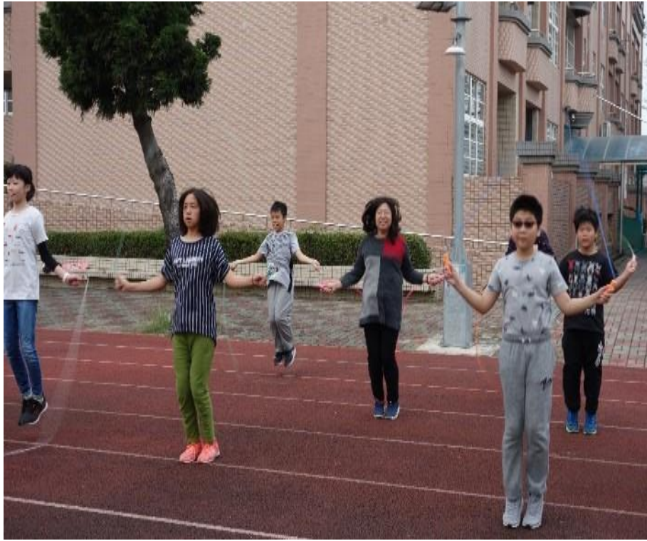
老師帶領全班學生一起跳繩健身