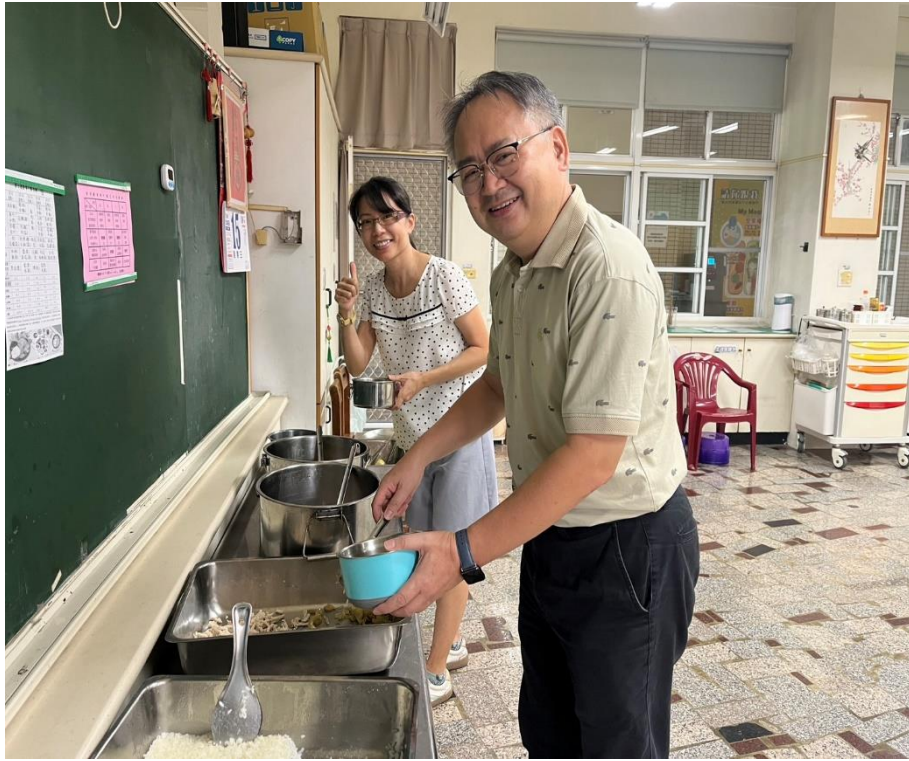
校長與主任盛用學校營養午餐