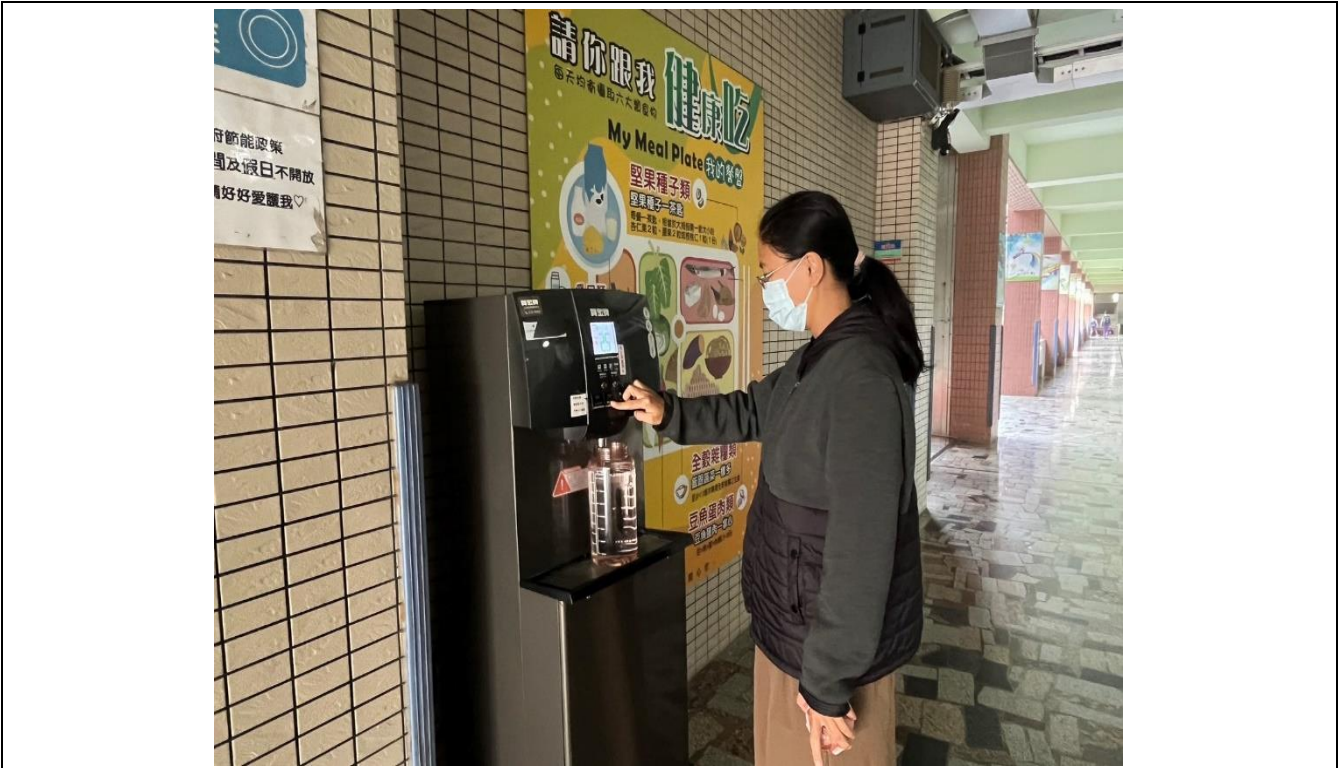
老師早上就先裝滿一大瓶白開水