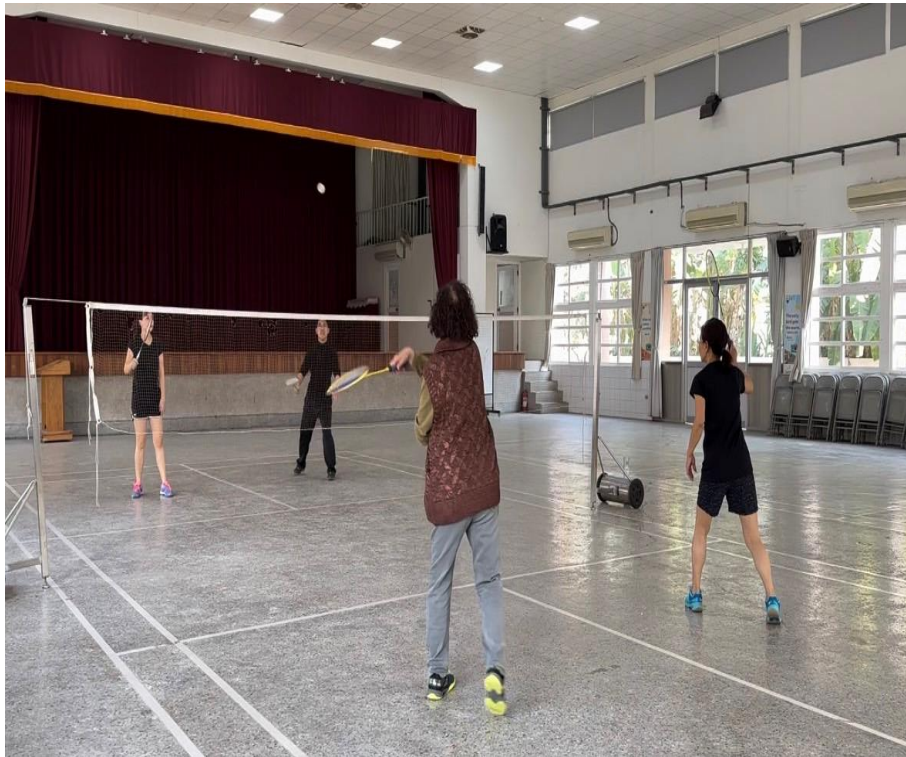
老師們下班後進行羽球交流