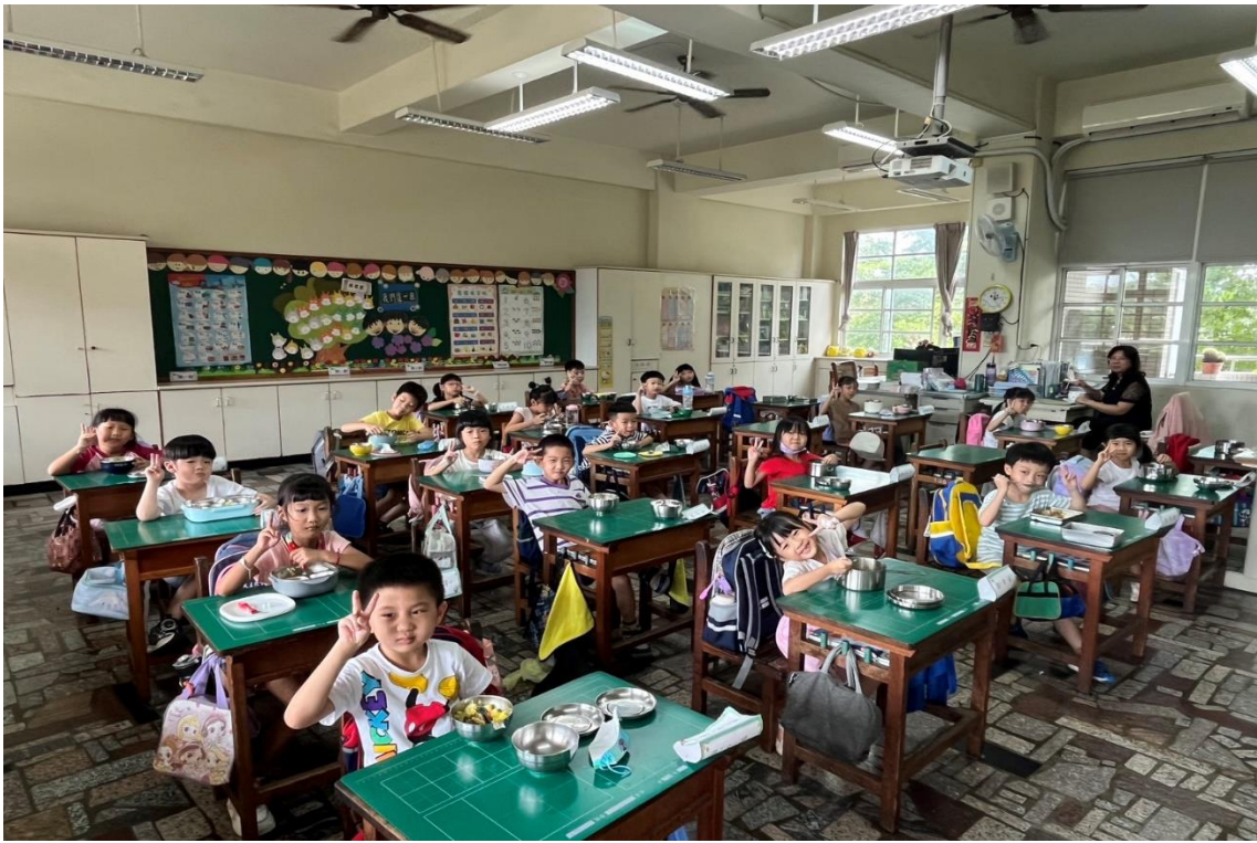
師生一起開心享用午餐