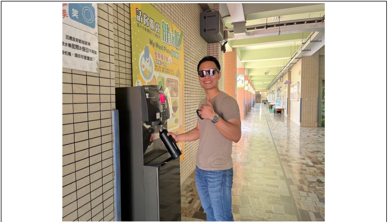
老師於晨間活動後裝白開水飲用