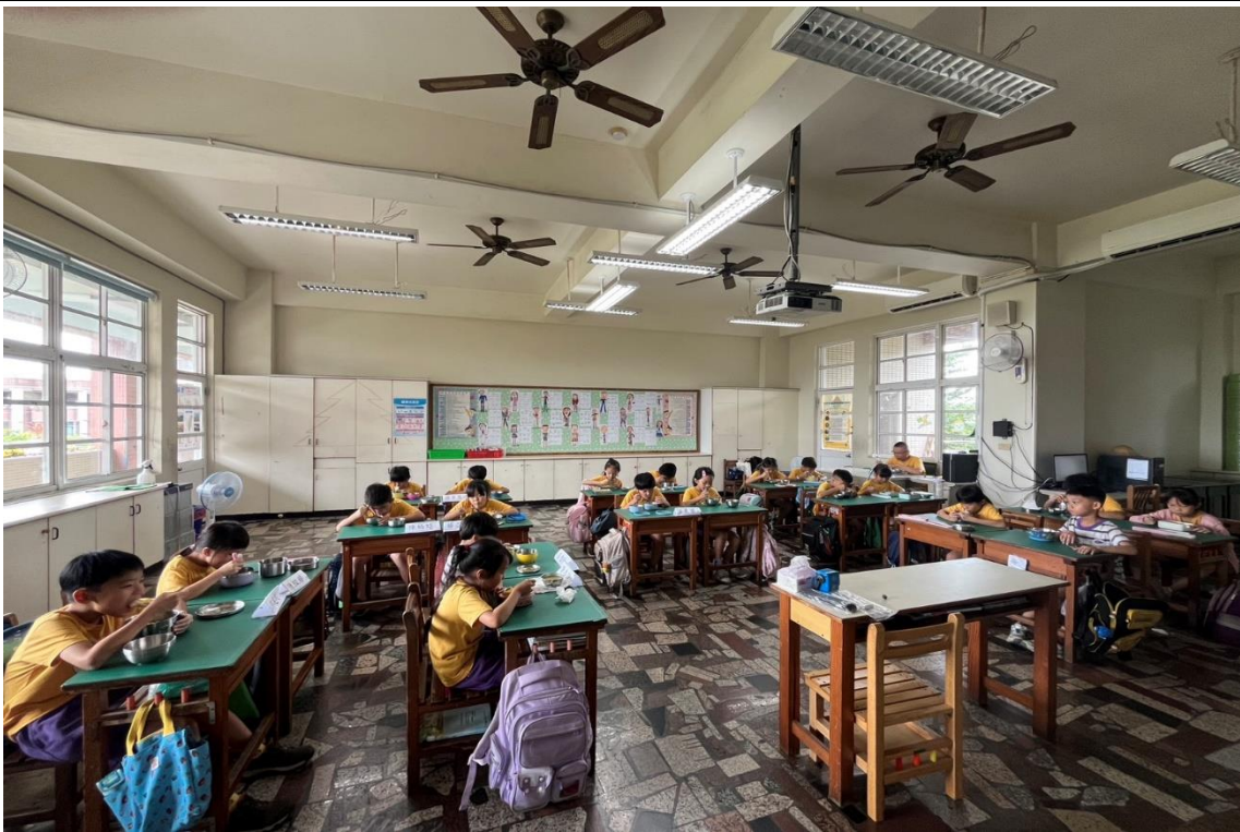
師生共享營養美味的營養午餐