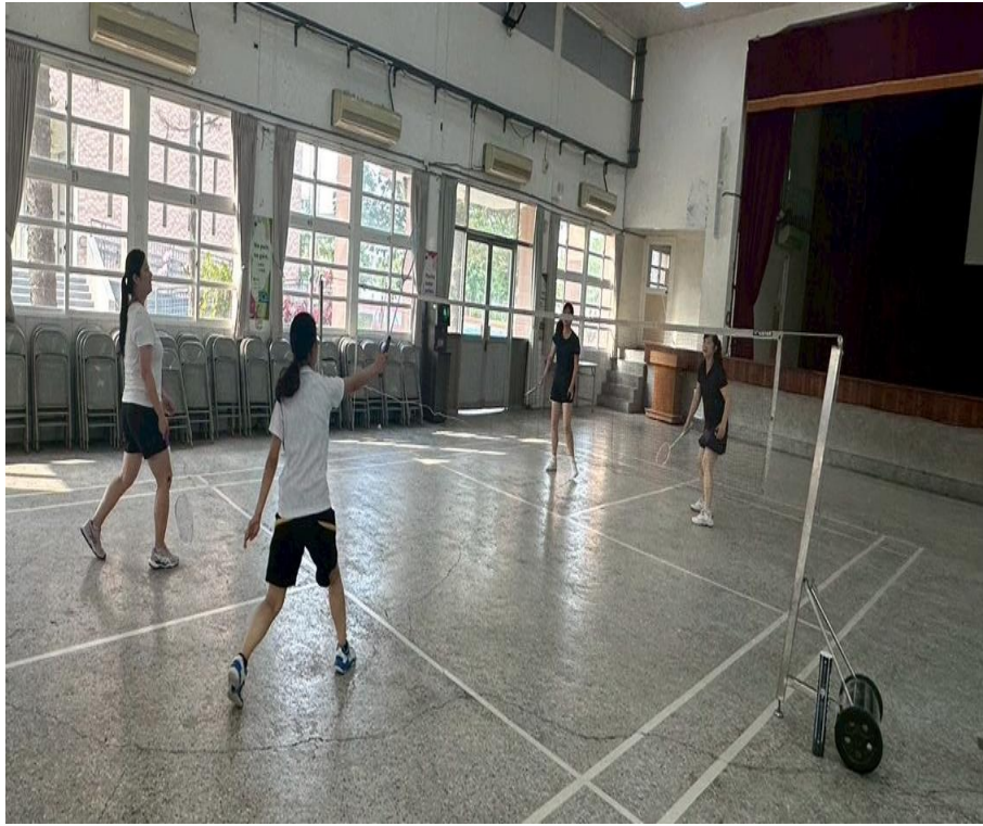
老師成立羽球社團