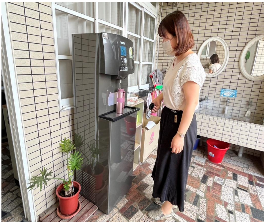
輔導室行政老師自備環保杯補充白開水