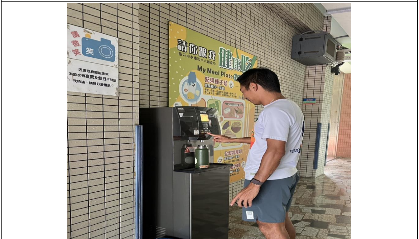
下課時間裝好白開水，適時補充水分