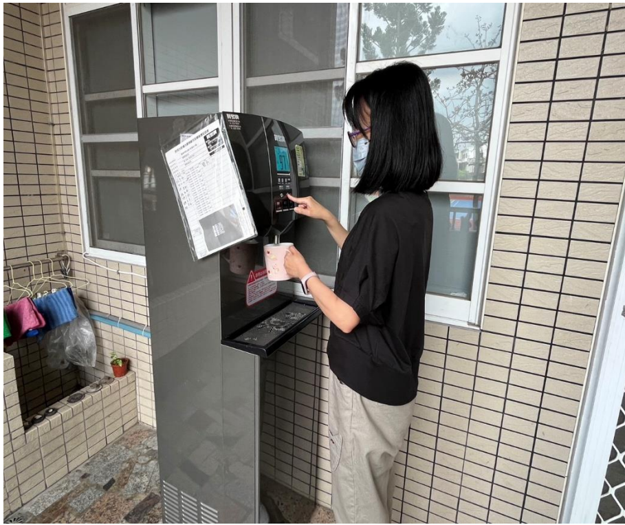
教務處行政老師自備馬克杯隨時補充水分