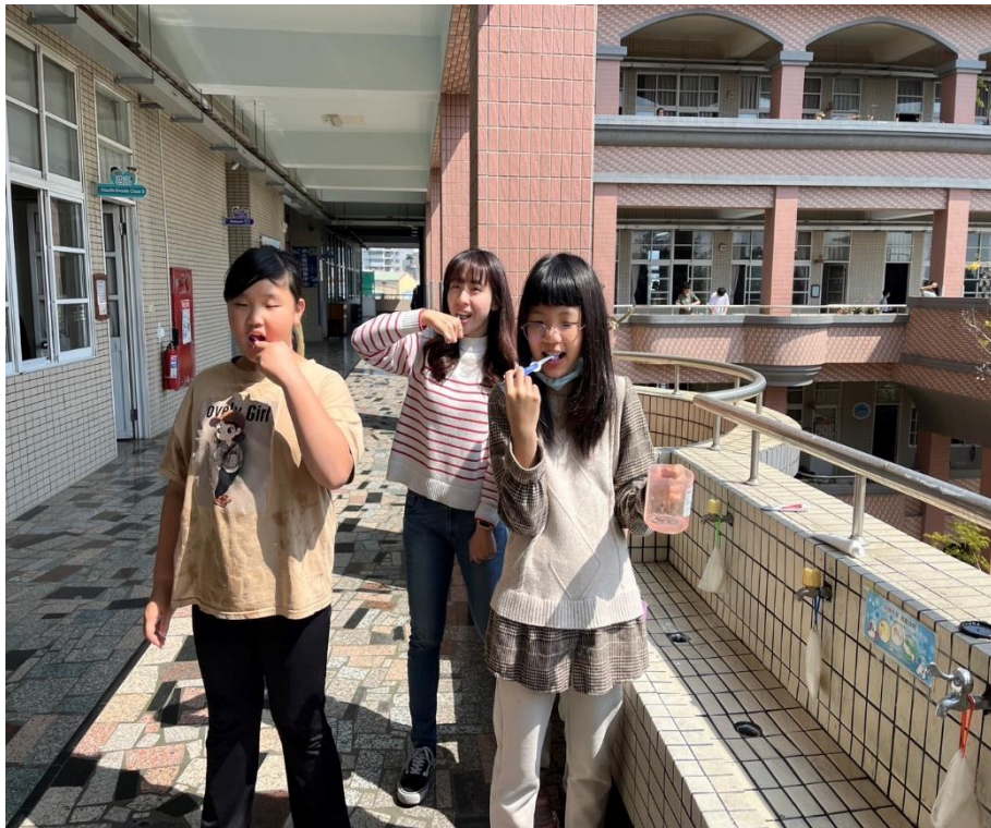
導師午餐後與學生一起潔牙