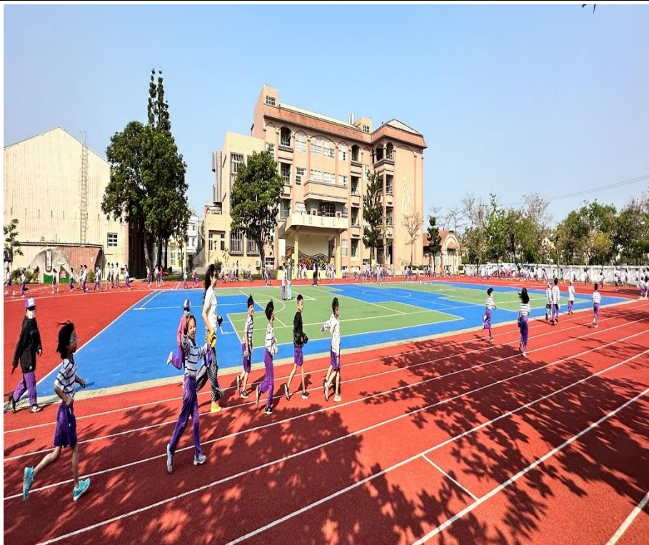
朝會後各班老師帶著學生一起慢跑健走