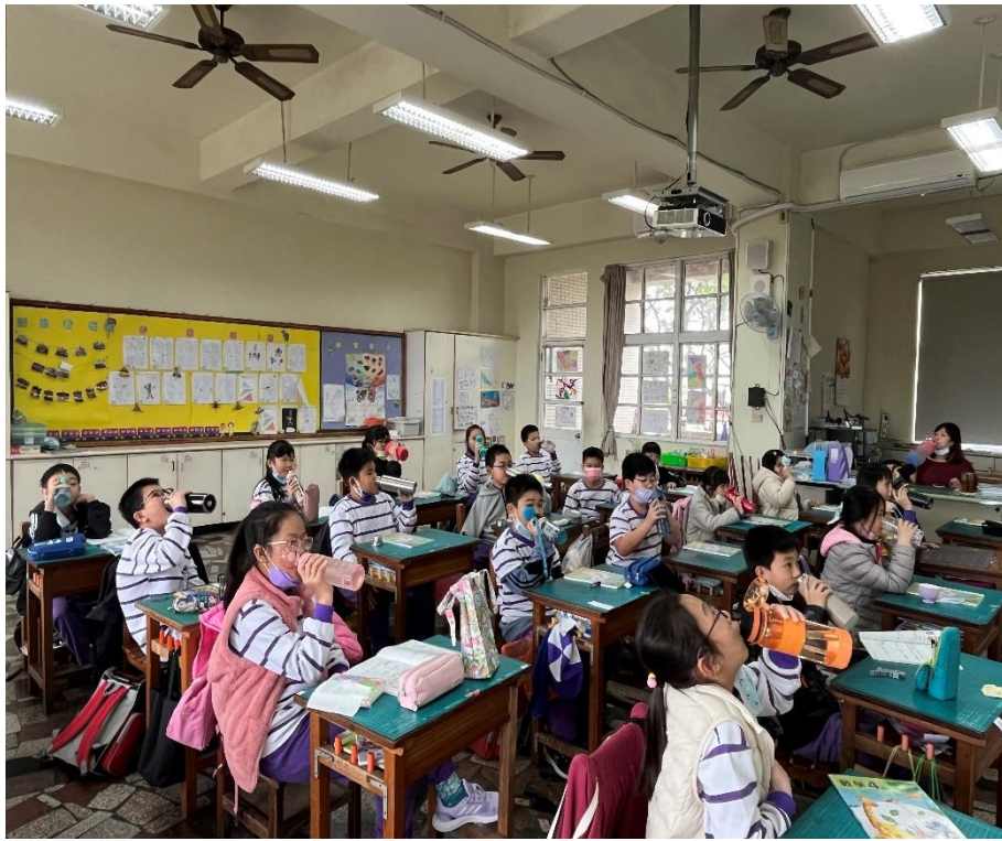
導師利用下課前帶著全班學童飲用白開水