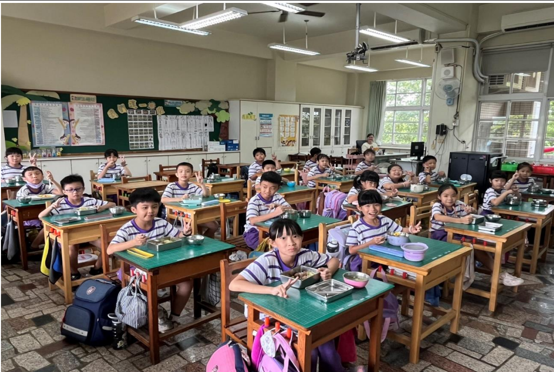
大家一起把蔬菜吃光光