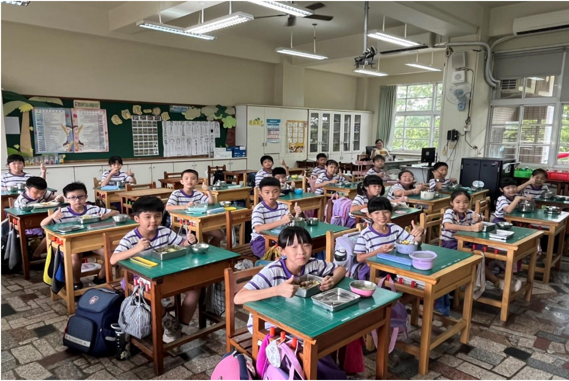
師生愉快的午餐時光