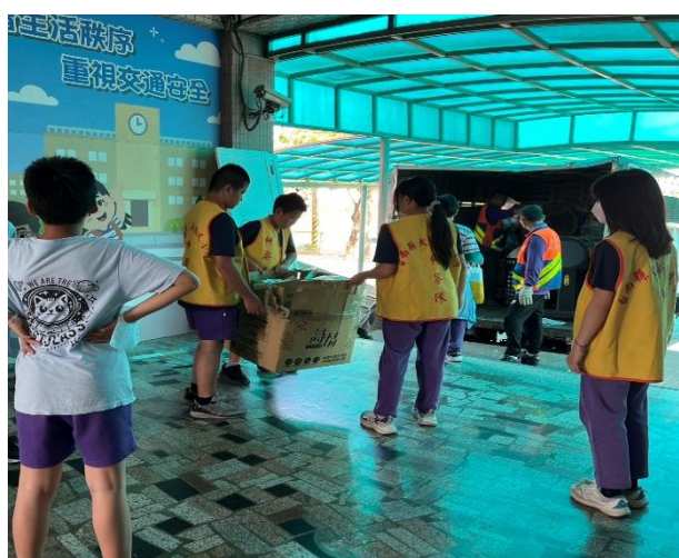
說明：六年乙班環保服務志工協助校園資源回收作業