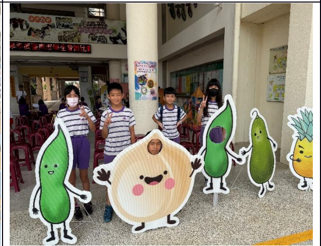
說明：113學年度參賽選手開心合照