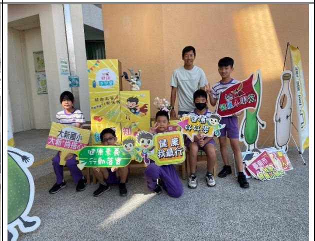
說明：114學年度參賽選手開心合照