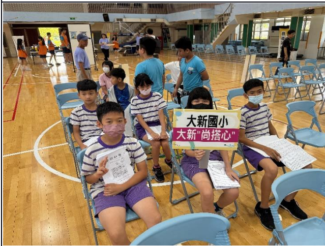
說明：113學年度參賽選手候位區等待