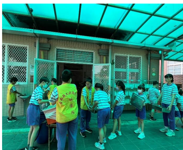
說明：六年丙班環保服務志工協助校園處理午餐剩食