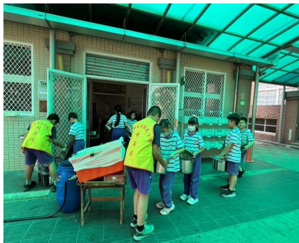
說明：六年乙班環保服務志工協助校園處理午餐剩食