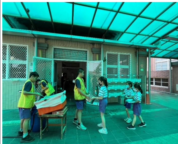
說明：六年乙班環保志工若發現班級剩食量過多時，會報告學務處老師