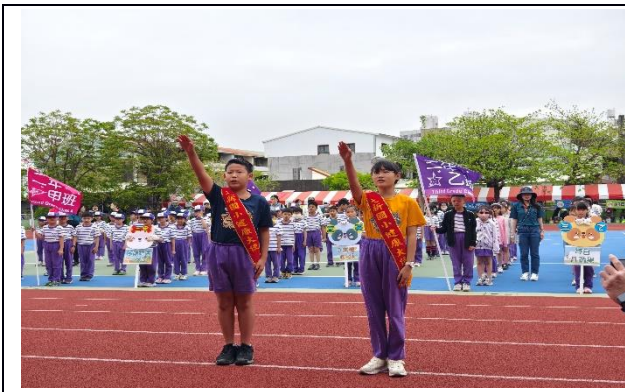
說明：113學年度校園健康大使代表宣誓