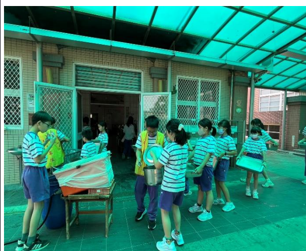
說明：六年丙班環保志工若發現班級剩食量過多時，會報告學務處老師