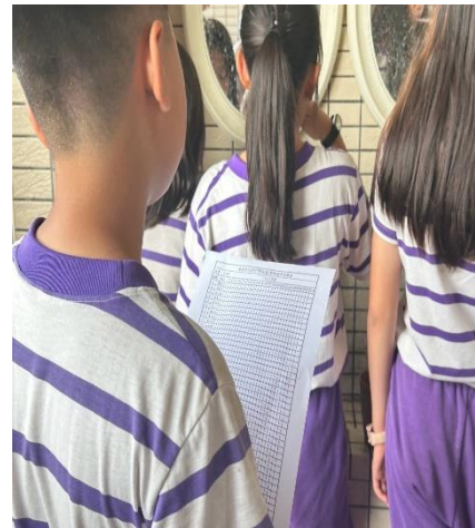
說明：高年級潔牙小天使每日完成班級餐後潔牙紀錄