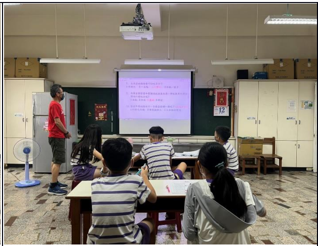
說明：113學年度選手集訓-題庫練習