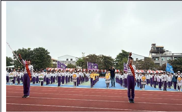
說明：114學年度校園健康大使代表宣誓