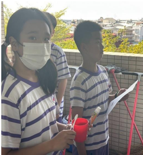
說明：高年級潔牙小天使每日用餐後觀察同學刷牙狀況