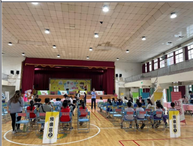
說明：114學年度參賽選手候位區等待