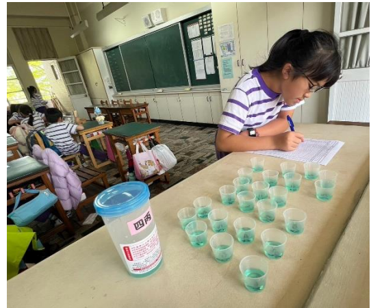
說明：潔牙小天使落實班級每週使用含氟漱口水，維護口腔健康