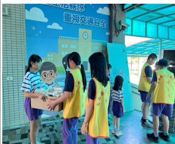
說明：六年乙班環保志工主動協助並指導中低年級學生整理回收用物