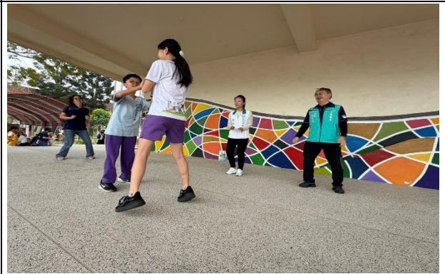
說明：114學年度健康大使跳健康操，校長、議員與學務主任一同參與