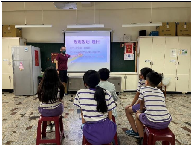
說明：113學年度選手集訓-規則說明