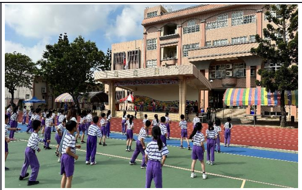
說明：113學年度健康大使跳健康操