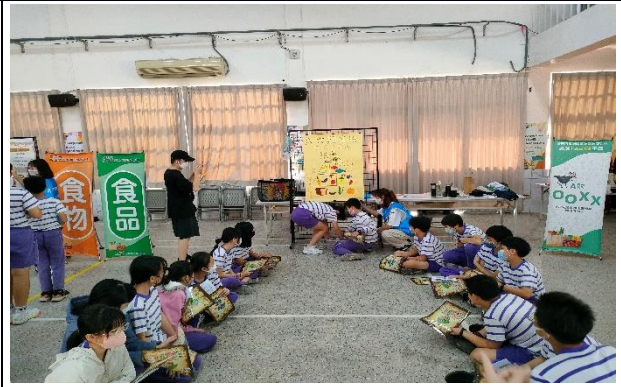
說明：闖關活動-六大類食物