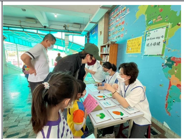
說明：「視力保健」闖關活動