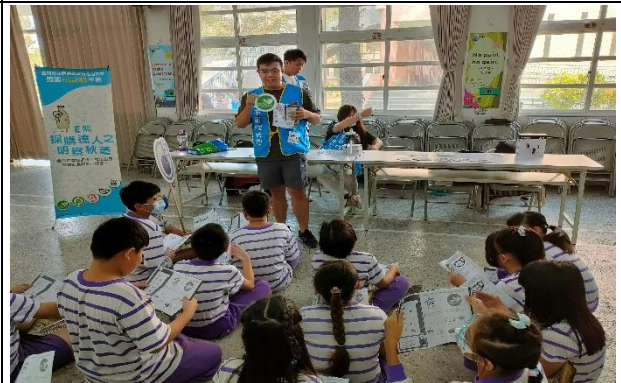
說明：闖關活動-我是採購小達人