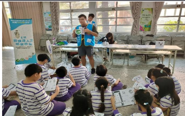
說明：闖關活動-我是採購小達人