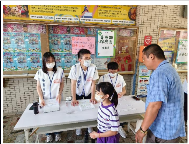
說明：「性教育」闖關活動