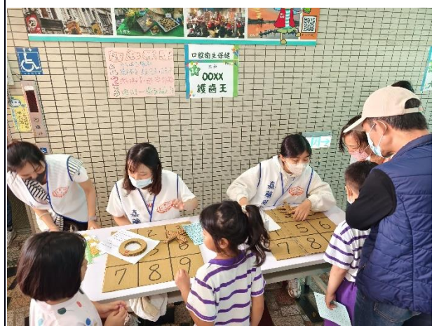
說明：「口腔保健」闖關活動