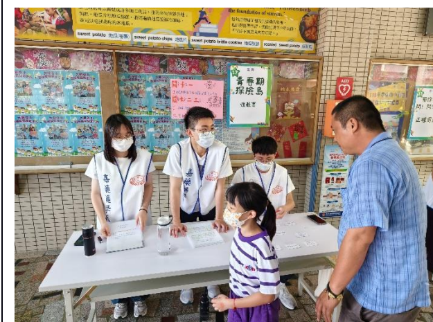
說明：「健康體位」闖關活動