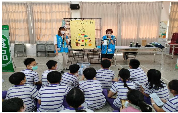
說明：闖關活動-六大類食物