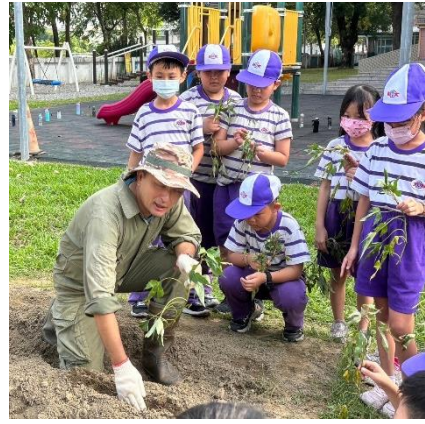
說明：插秧前注意事項說明