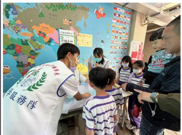
說明：「菸檳防治」闖關活動