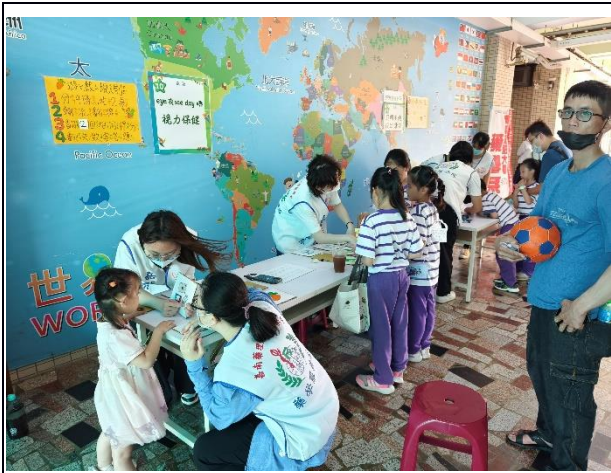
說明：「視力保健」闖關活動