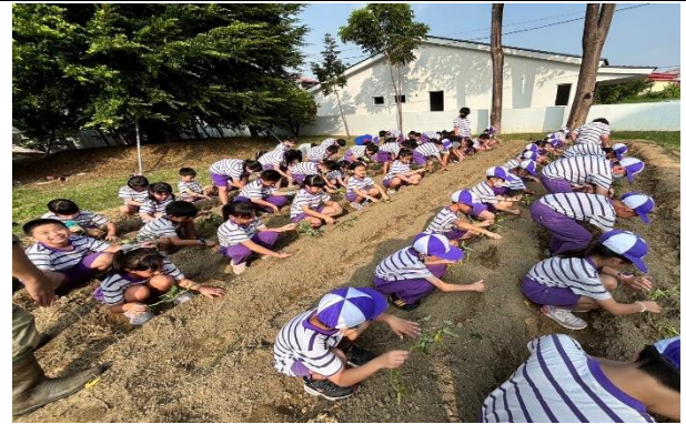
說明：認真且輕柔地將秧苗埋入田地