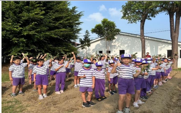
說明：我們準備好要插秧囉!