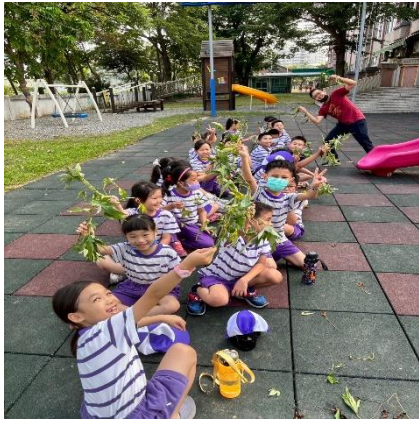
說明：拿到地瓜秧苗了!蓄勢待發~