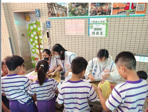
說明：「口腔保健」闖關活動