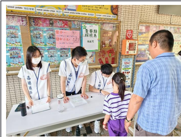
說明：「性教育」闖關活動