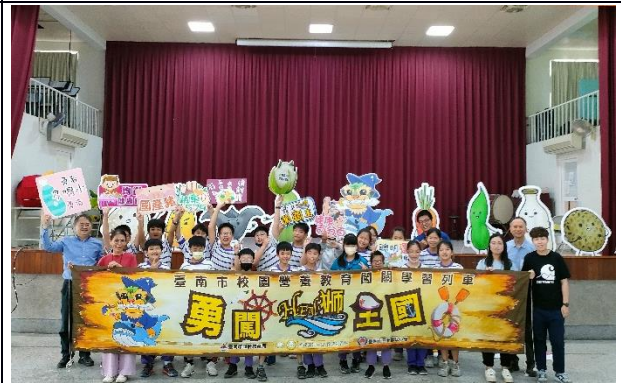
說明：學生會後開心地與關主們合照