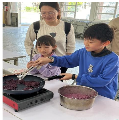
說明：我是地瓜煎餅小達人~