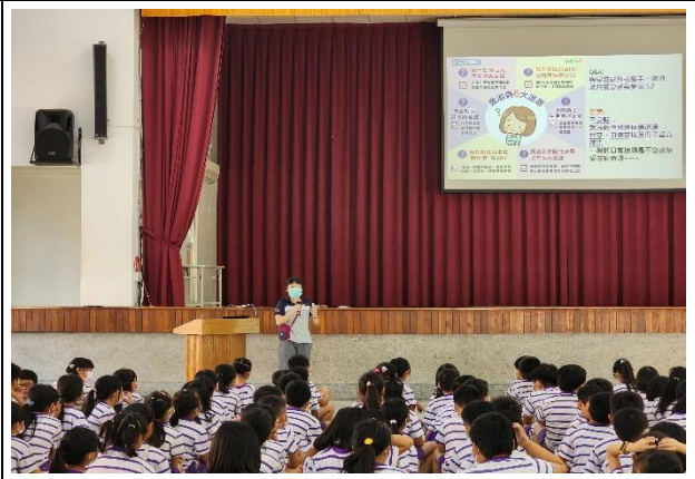
說明：愛滋病的迷思 Q&A2