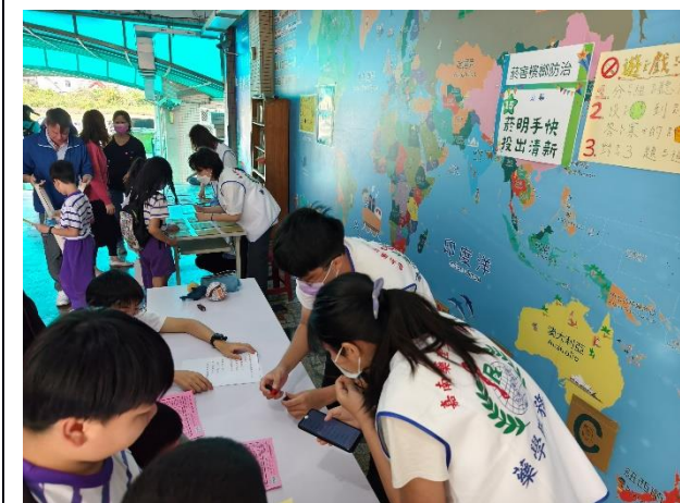
說明：「菸檳防治」闖關活動