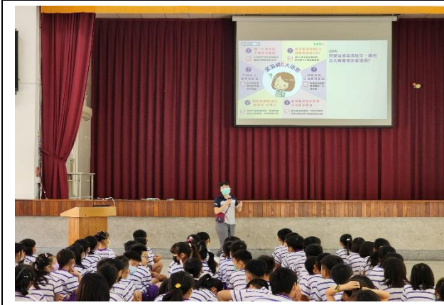
說明：愛滋病的迷思 Q&A1