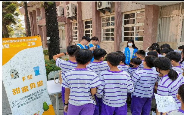
說明：闖關活動-甜蜜的負擔