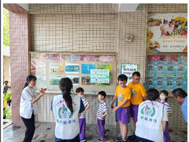
說明：「健康體位」闖關活動