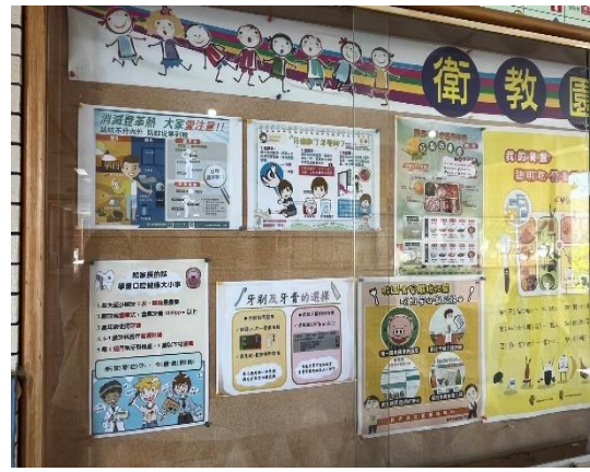
說明：穿堂布告欄-健康促進議題宣導