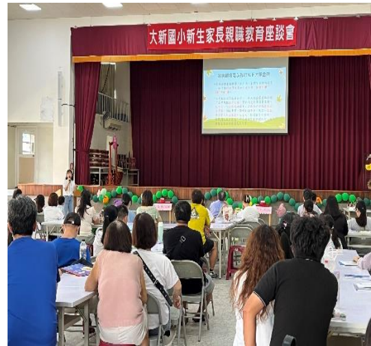
說明：迎新活動-進行窩溝封填宣導