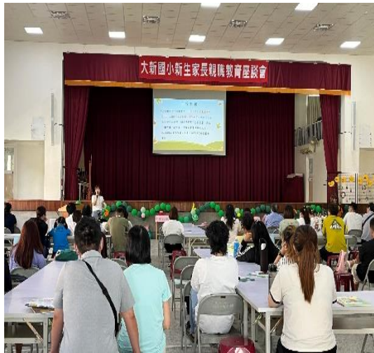
說明：迎新活動-進行口腔保健宣導