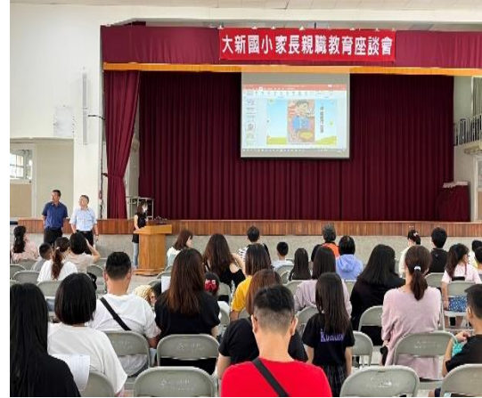
說明：迎新活動-進行健康體位宣導