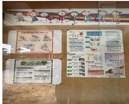
說明：穿堂布告欄-腸病毒防治宣導