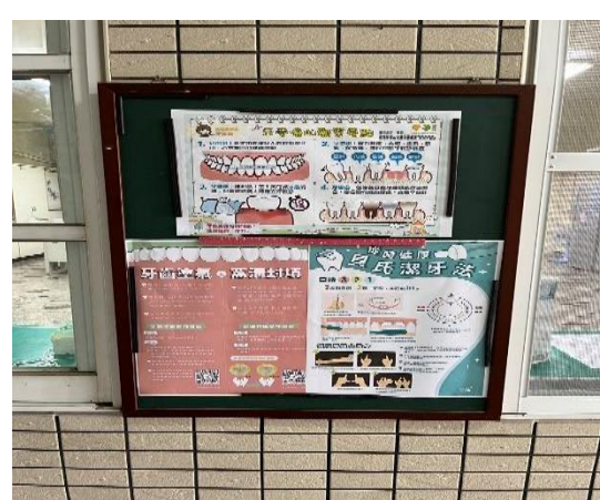
說明：健康中心布告欄-口腔保健宣導