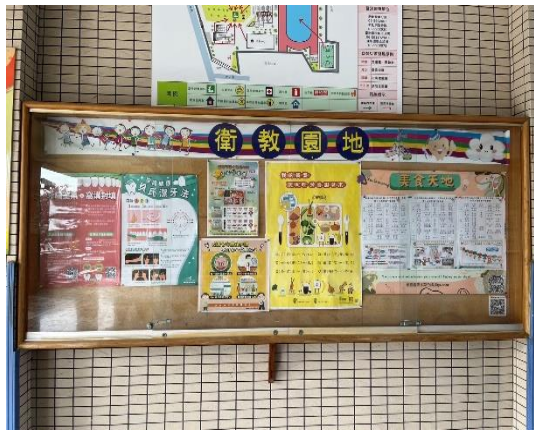
說明：穿堂布告欄-健康促進議題宣導