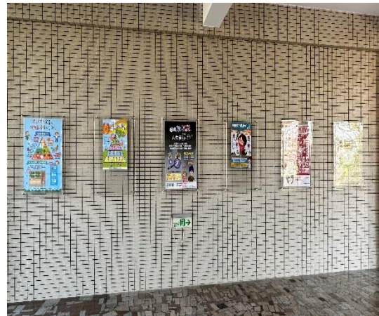
說明：穿堂布置-健康促進議題宣導