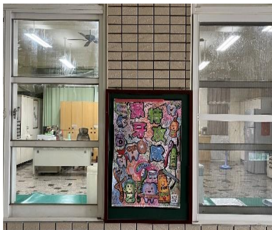
說明：健康中心布告欄-口腔保健宣導