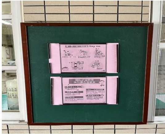
說明：健康中心布告欄-傳染病防治宣導