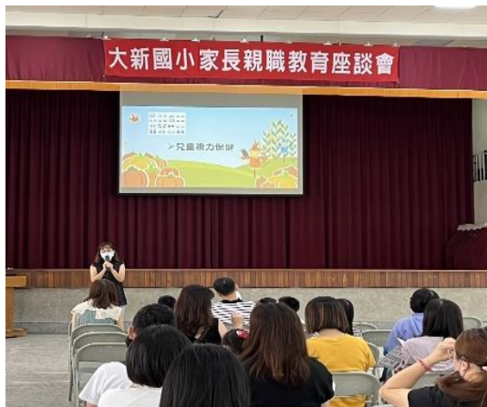
說明：迎新活動-進行視力保健宣導