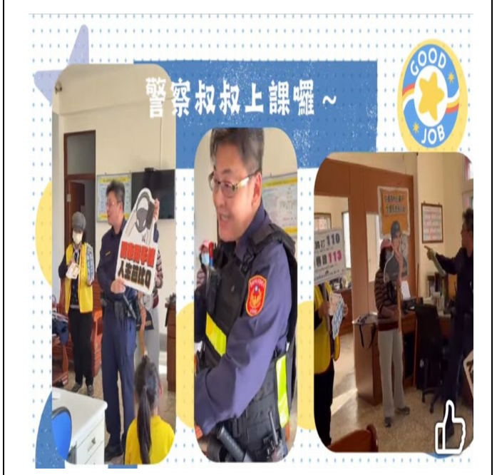
那拔派出所大冒險