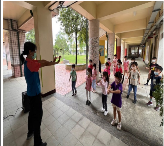
幼生參觀健康中心，護理師視力宣導