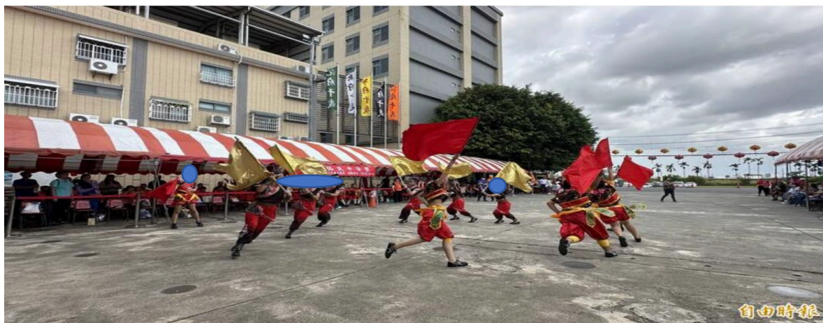
新化那拔國小創意藝陣演出。