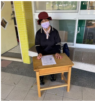
志工協助活動報到