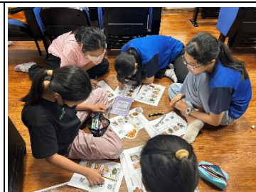
分組活動「濕地總鋪師」