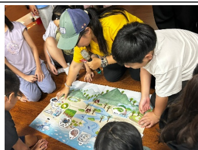
觀察濕地動植物地圖