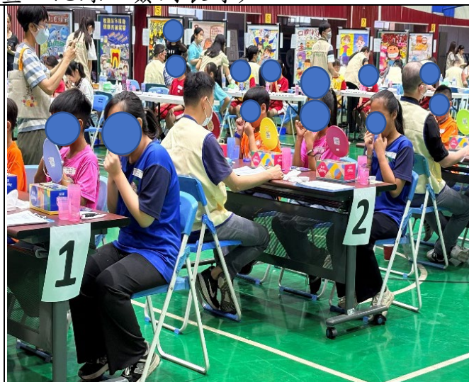
潔牙觀摩中~操作牙線