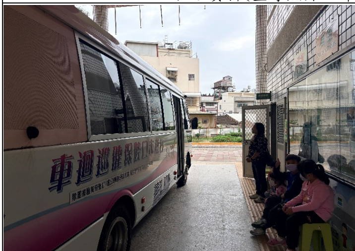
口腔保健巡迴車到校