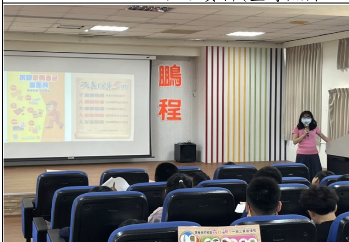
衛生局營養師介紹我的餐盤