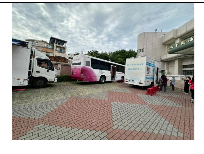
學校協助社區辦理行動醫院，提供里民健檢服務。