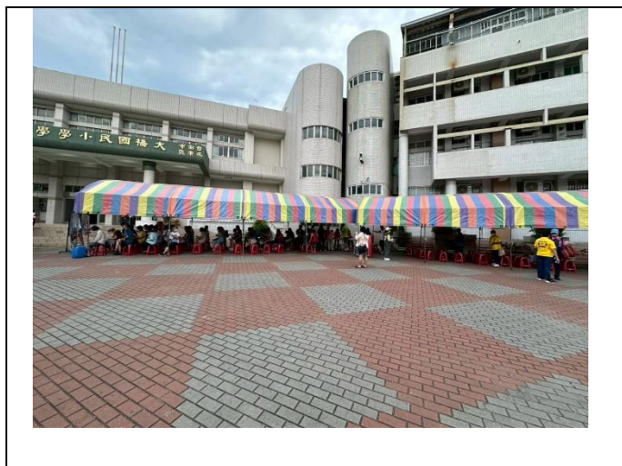
學校協助社區辦理行動醫院，提供里民健檢服務。