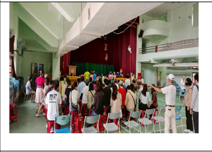
學校協助社區辦理行動醫院，提供里民健檢服務。