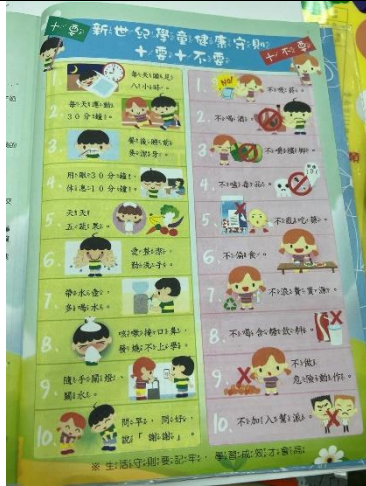
健康守則十藥十不要