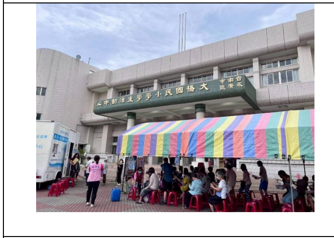
學校協助社區辦理行動醫院，提供里民健檢服務。