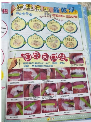
勤洗手及貝氏刷牙法