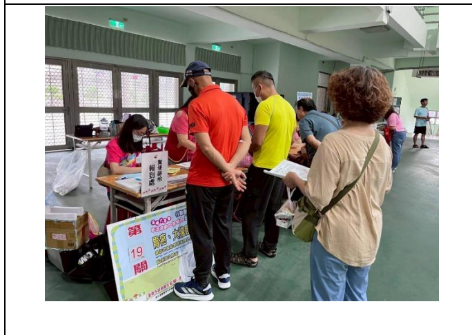
學校協助社區辦理行動醫院，提供里民健檢服務。