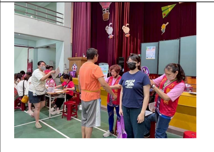
學校協助社區辦理行動醫院，提供里民健檢服務。