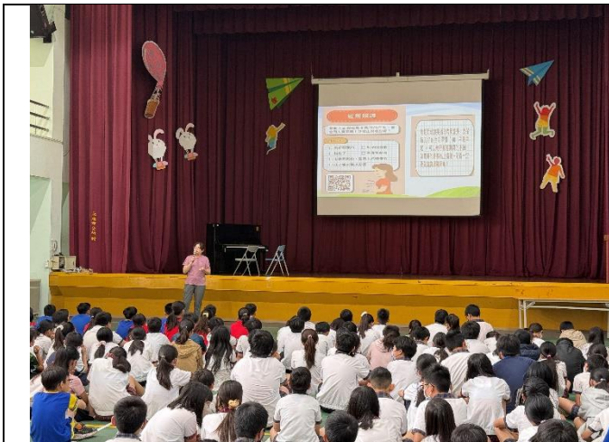
月經議題性別平等宣導。