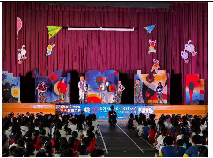
校長上台致詞與團員們互動。