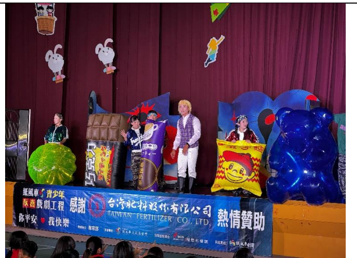
各式新興毒品樣貌宣導，吸睛效果十足。