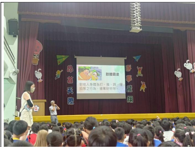
校長於開學典禮向全校師生介紹肢體霸凌。