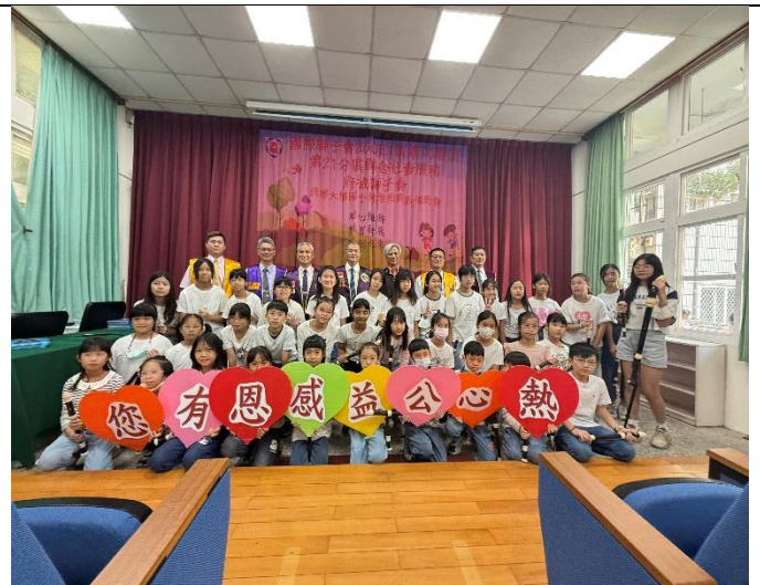
世界和平會關懷弱勢學生，聖誕心願卡。