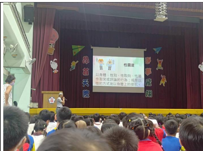
校長於開學典禮向全校師生介紹性霸凌。