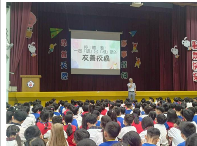
校長於開學典禮進行友善校園宣導。