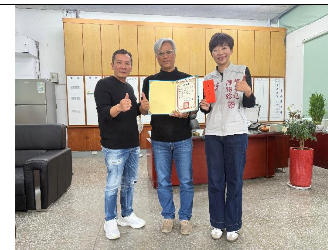
感謝陳怡珍議員為學校弱勢學生捐贈設備經費。