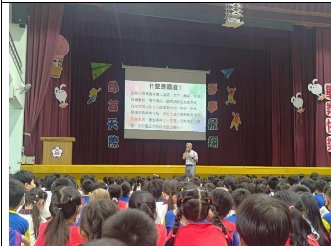
校長於開學典禮向全校師生進行霸凌宣導。