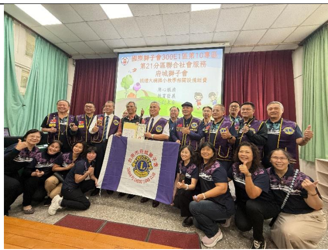
校長頒發感謝狀給府城獅子會大合影。