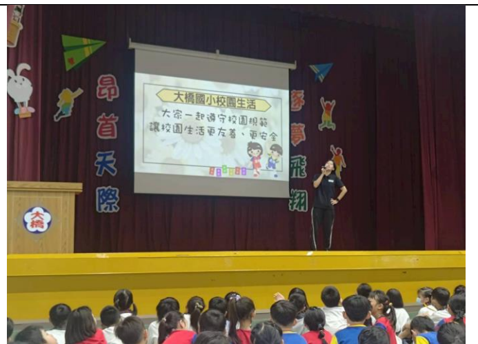
生教組呼籲全校同學一起遵守友善校園規範。