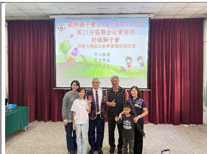
府城獅子會捐贈學校經費為學子增添設備。