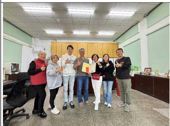
感謝林冠維議員補助弱勢學生生活獎助學金。