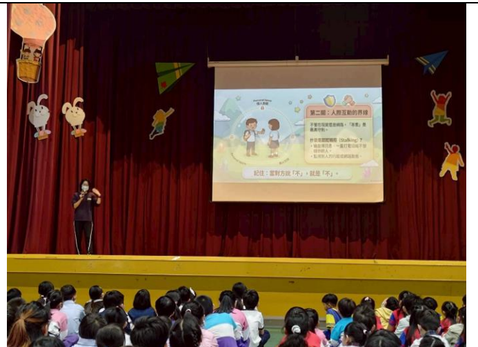
生教組長宣導人際互動之間的界線。