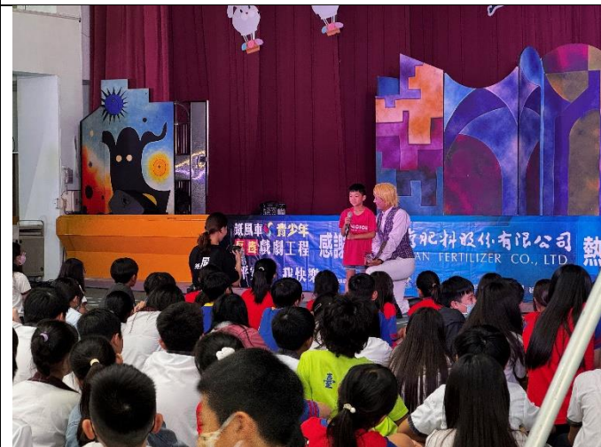
學生進行有獎徵答，與演員大方互動。