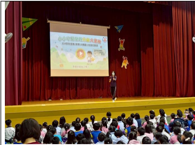
生教組長於開學初進行友善校園宣導。