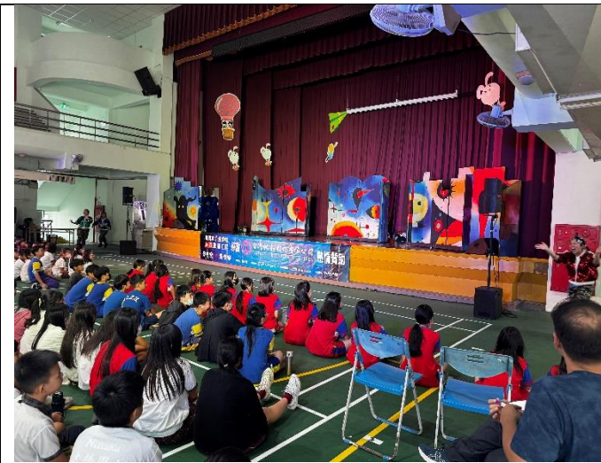
紙風車劇團到校進行毒品宣導。