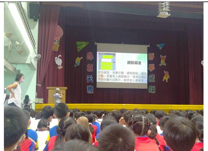
校長於開學典禮向全校師生介紹網路霸凌。