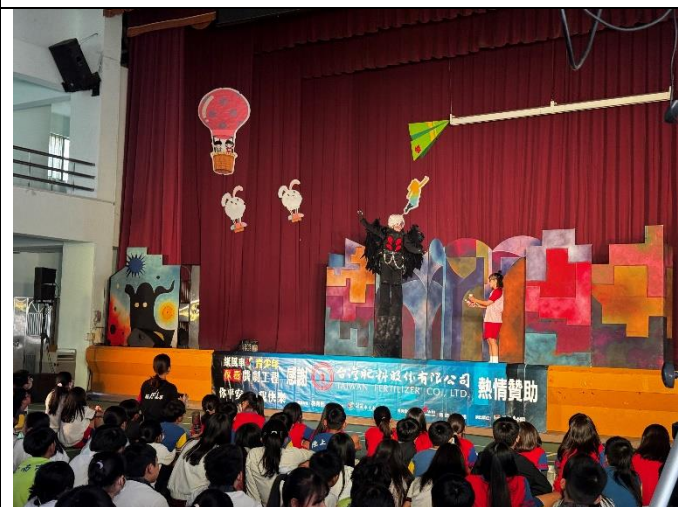
演出內容豐富精彩且有趣。