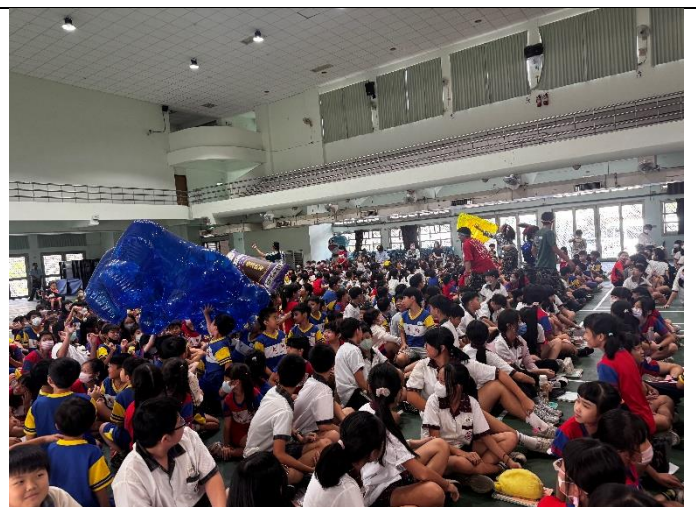
參與學生反應熱烈，現場氣氛活絡。