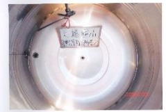
辦公室 RO 水塔 2 清洗後

作業時間：民國 114 年 7 月 23 日 永豐餘水池水塔清潔有限公司、安得富除蟲清潔商行 水質檢測合服務有限公司 服務電話：06-2656645