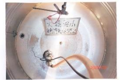
辦公室 RO 水塔 2 清洗前