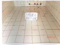
活動中心水塔清洗後

作業時間：民國 114 年 7 月 23 日 永豐餘水池水塔清潔有限公司、安得富除蟲清潔商行 水質檢測合服務有限公司 服務電話：06-2656645