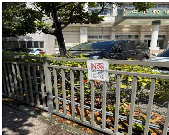
校園周邊張貼清楚顯眼的禁菸宣導標示。