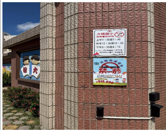
校園周邊張貼清楚顯眼的禁菸宣導標示。