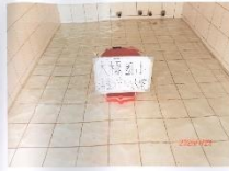
活動中心水塔清洗前