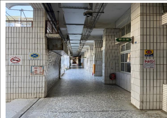
校園內走廊也隨處都有禁菸標示牌。