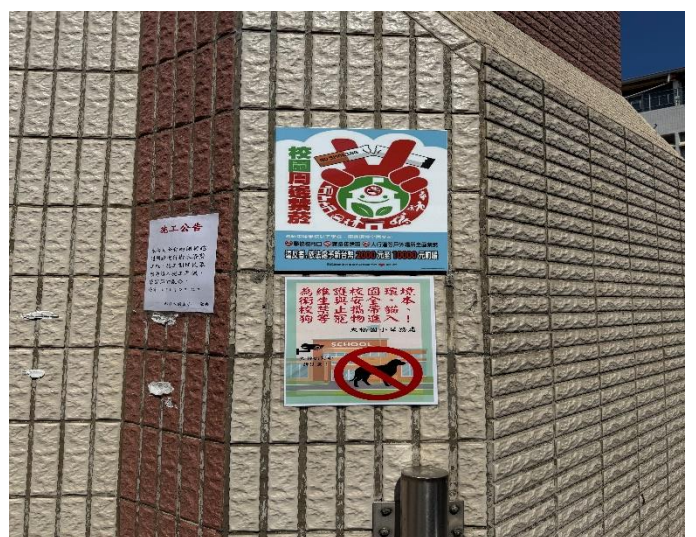
校園周邊張貼清楚顯眼的禁菸宣導標示。