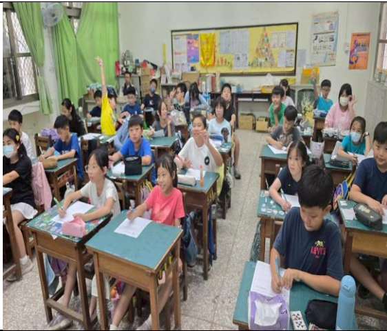
說明：全班同學認真學習並踴躍發表。