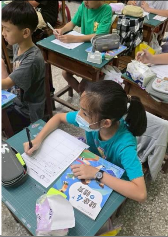
說明：學生能認真聽講並習寫學習單。