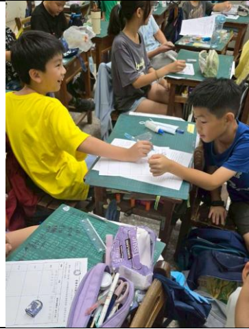
說明：學生互相討論學習單內容。