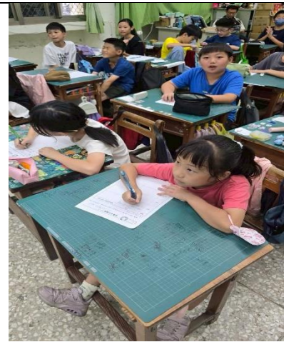
說明：學生能認真聽講並習寫學習單。