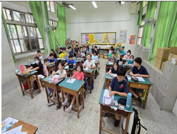
說明：學生能依照指令完成學習單。