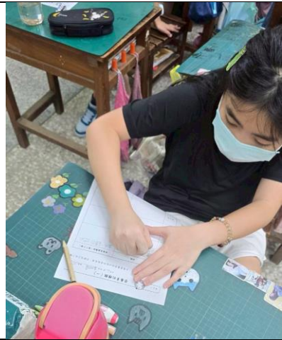
說明：學生能認真聽講並習寫學習單。