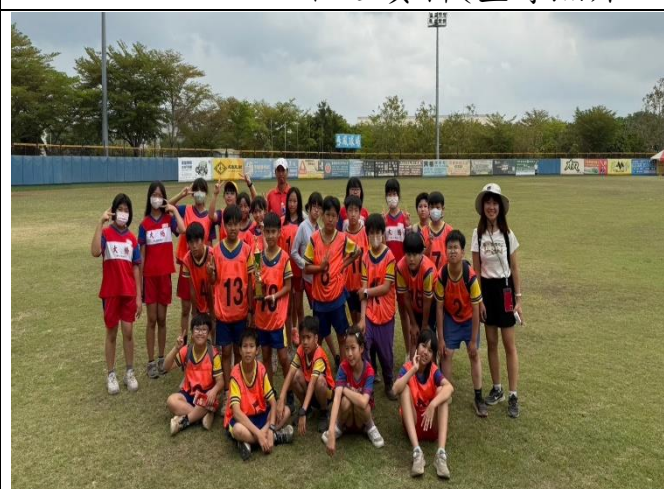
說明：503學生與帶隊老師在比賽現場合影。