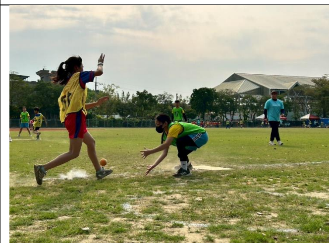
說明：學生認真跑壘精彩畫面。