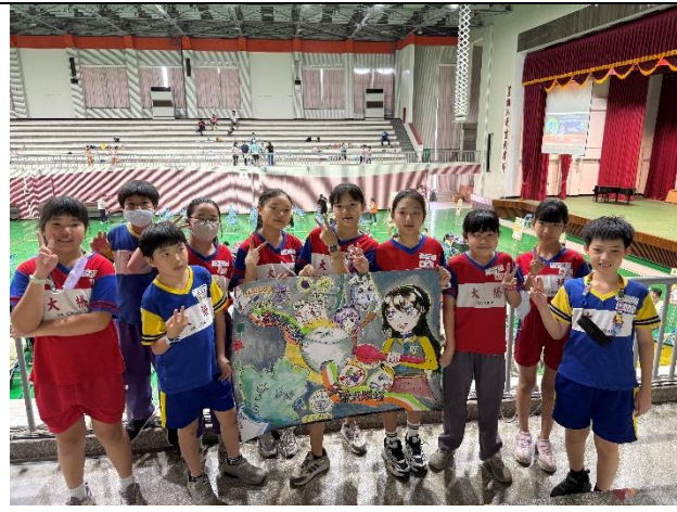
說明：學生與創作海報合影。