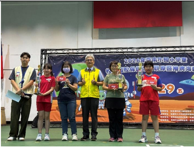
說明：學生代表上台領獎。