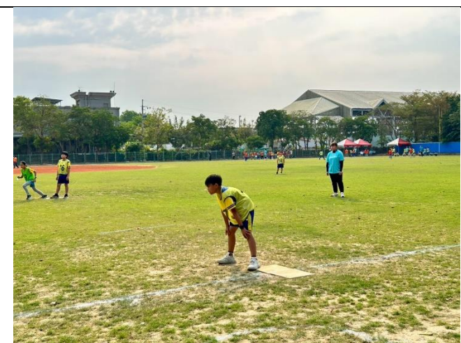
說明：學生展現運動家精神-勝不驕敗不餒。