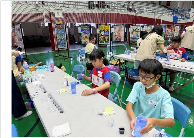
說明：學生使用牙菌斑顯示劑進行最後清潔程度評分。