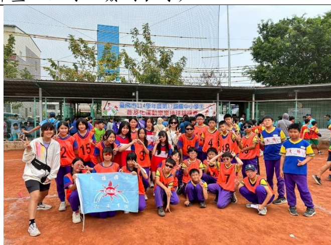
說明：601學生與帶隊老師在比賽現場合影。