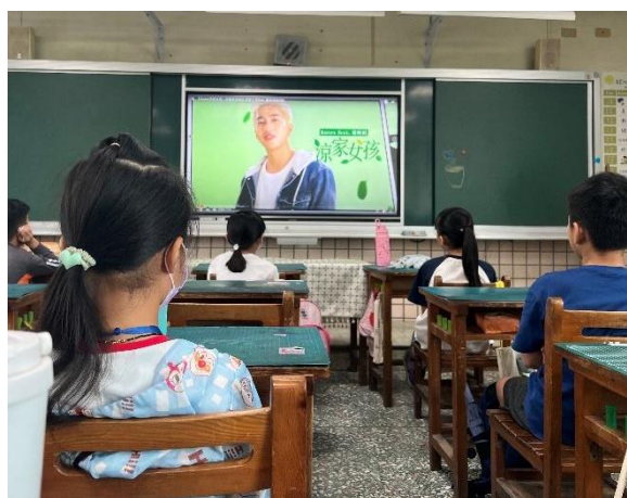
學生觀看由男性代言生理用品廣告