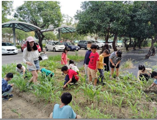
說明：透過小組合作，進行食農耕作活動。