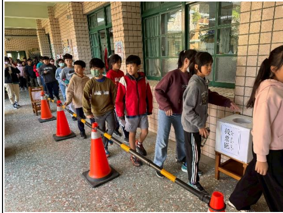
說明：每個人都投下神聖的一票