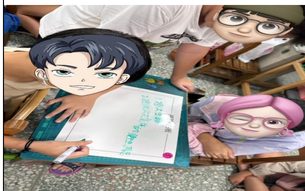
小組設計月經平等標語

學校建議回饋：整體教案兼具創意與深度，展現素養導向與性別友善教育的核心精神。課程透過任務導向與情境模擬方式，不僅提升學習動機，也促進性別同理心的養成。課程內容由淺入深，從認識月經與身體變化出發，延伸至生理用品使用、自我照顧，乃至月經貧窮與平權議題，系統性地建構學生的知識與態度。