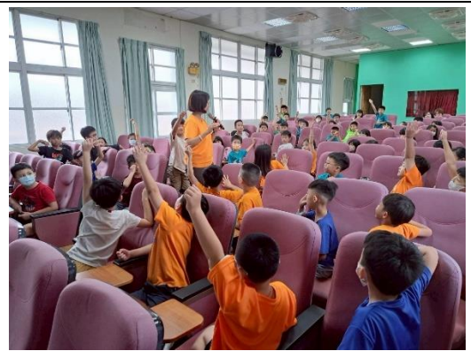
說明：積極參與課堂活動，踴躍發表。