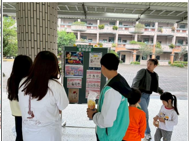
說明：西勢國小運動會海報宣導