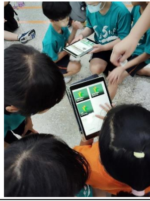
說明：小組討論-學習到如何辨識三章一Q農產品標誌，提升對健康飲食的認識。