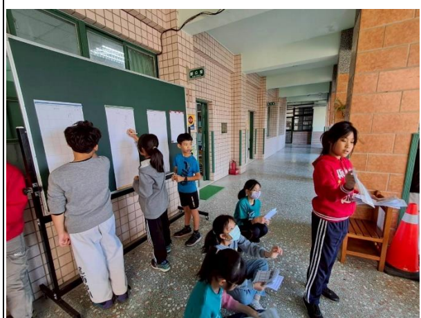
說明：嚴謹的對待每一張選票