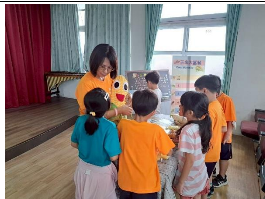
說明：主動踴躍請問老師。