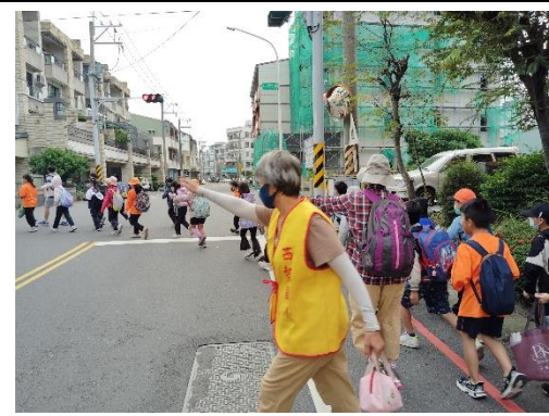
說明：交通維護孩子健走步行至農場，守護孩子安全、陪伴孩子闖關