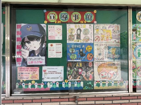
說明：多元生理用品標示-布告欄