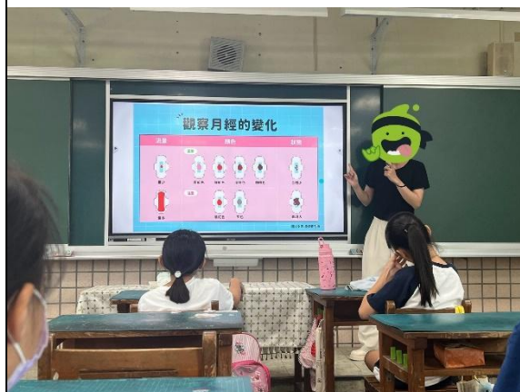
教師說明月經的顏色、流量及狀態會反映身體健康