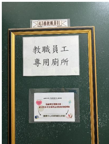
說明：多元生理用品領取標示