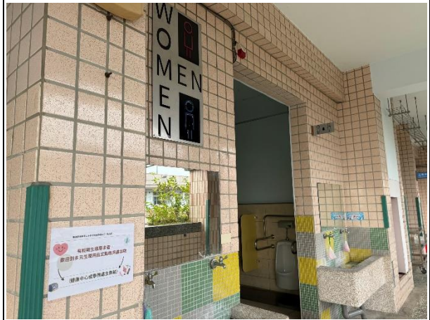
說明：多元生理用品領取標示-學生廁所