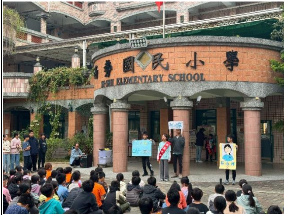
說明：六甲市模範生候選人自我推薦