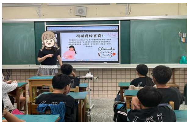
教師說明何謂月經貧窮