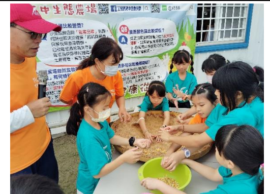
說明：融入團體活動，化身小小農夫走進在地阿中農場。