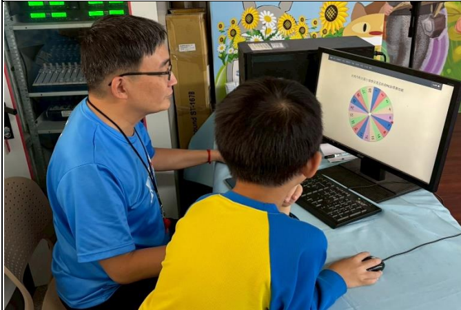
說明：新光國小第1屆健促盃跳繩錦標賽-抽籤1