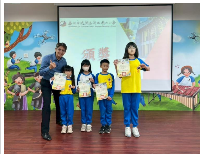
說明：新光國小第1屆健促盃跳繩錦標賽-頒獎1