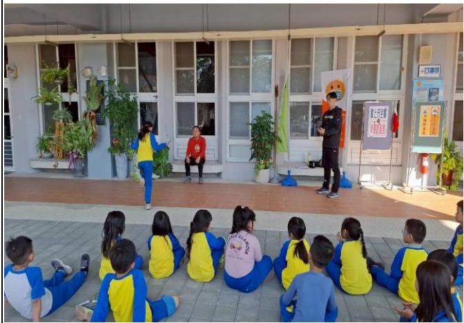
說明：新光國小第1屆健促盃跳繩錦標賽-決賽1