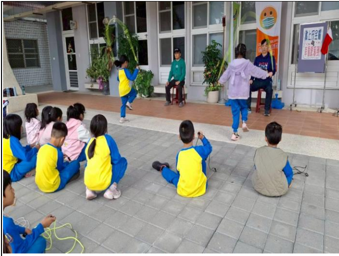
說明：新光國小第1屆健促盃跳繩錦標賽-預賽1