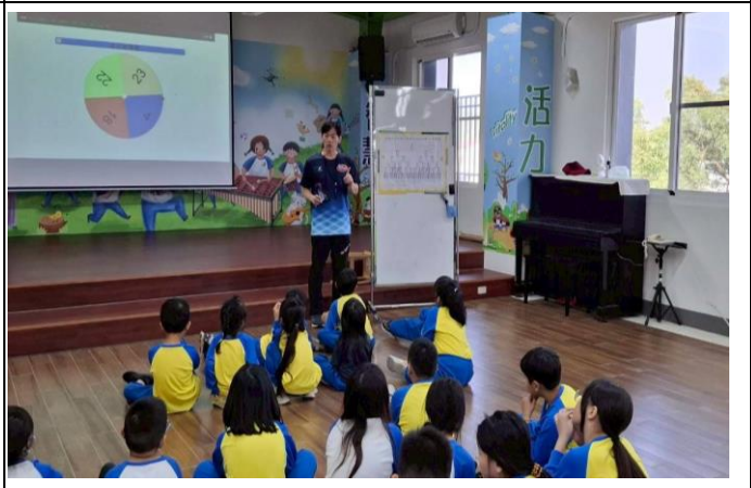
說明：新光國小第1屆健促盃跳繩錦標賽-抽籤1