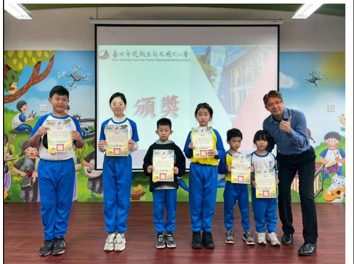
說明：新光國小第1屆健促盃跳繩錦標賽-頒獎2