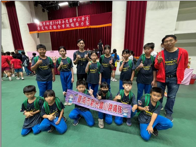
說明：參加健康促進系列活動-臺南市114學年度中小學普及化運動-跳繩接力賽1