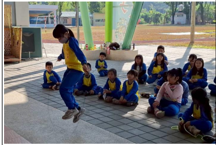
說明：新光國小第1屆健促盃跳繩錦標賽-決賽2