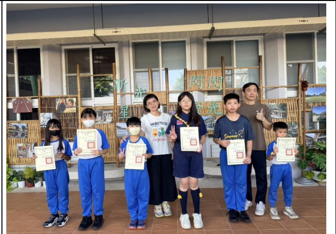
說明：參加臺南市114學年度中小學普及化運動-跳繩接力賽榮獲「優勝」，由主任公開頒發獎狀