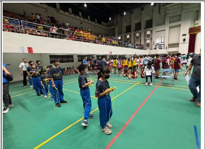
說明：參加健康促進系列活動-臺南市114學年度中小學普及化運動-跳繩接力賽1