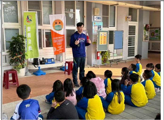
說明：新光國小第1屆健促盃跳繩錦標賽-預賽2