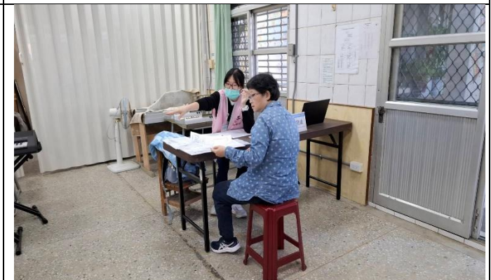
說明：提供辦理教職員健康檢查的醫療院所資訊