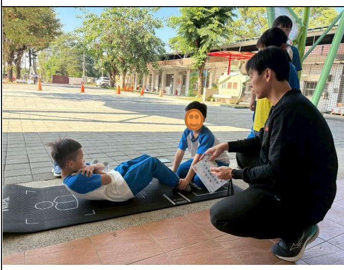
說明：辦理全校學生健康體適能活動1