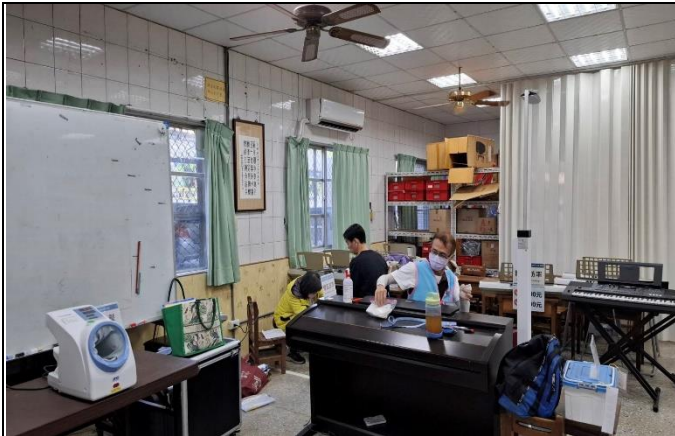
說明：辦理校內教職員健康檢查1