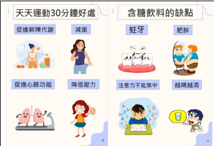
說明：印製新光國小健康榮譽護照集點本供學生使用2