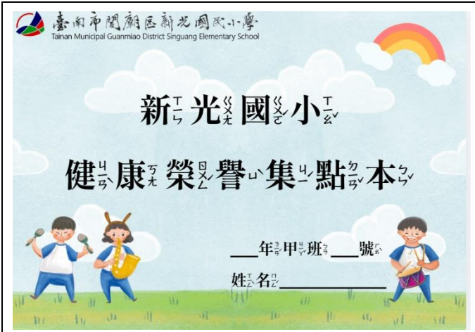
說明：印製新光國小健康榮譽護照集點本供學生使用1