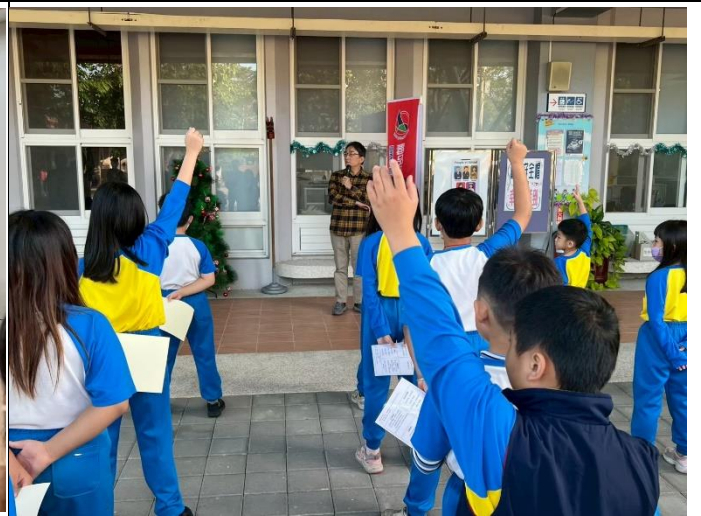
說明：總務主任於學生朝會說明當日會有醫療院所入校辦理教職員生健康檢查的注意事項