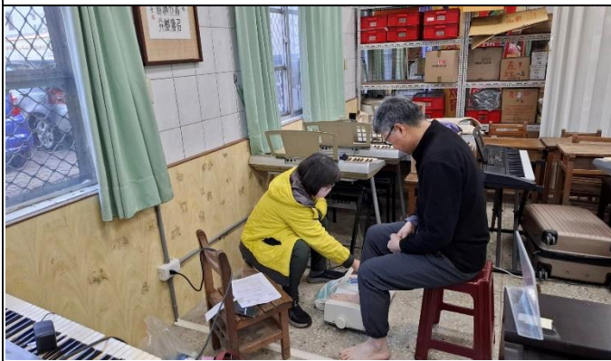
說明：辦理校內教職員健康檢查3