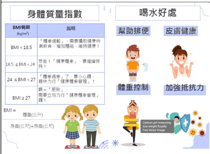
說明：印製新光國小健康榮譽護照集點本供學生使用3