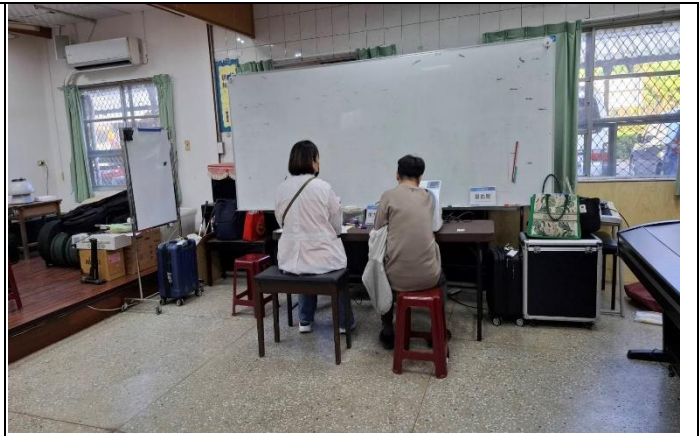
說明：辦理校內教職員健康檢查3