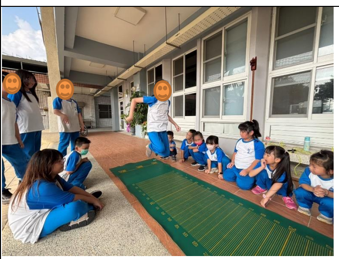
說明：辦理全校學生健康體適能活動2