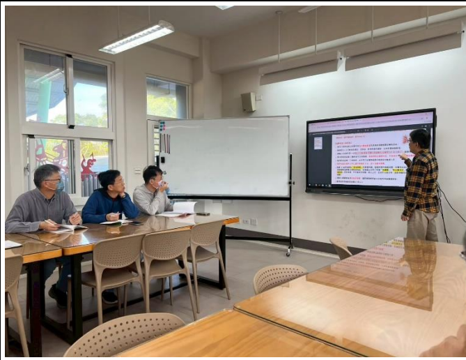
說明：總務主任於教師晨會說明教職員生到校協助健康檢查的醫療院所資訊