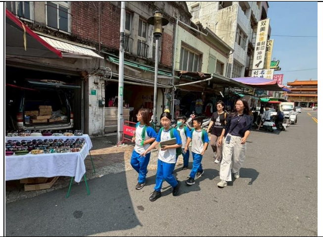
說明：由主任及老師帶隊前往社區公有市場