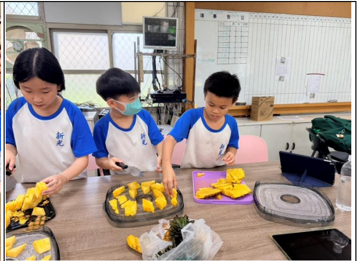
說明：鳳梨削皮及切塊1