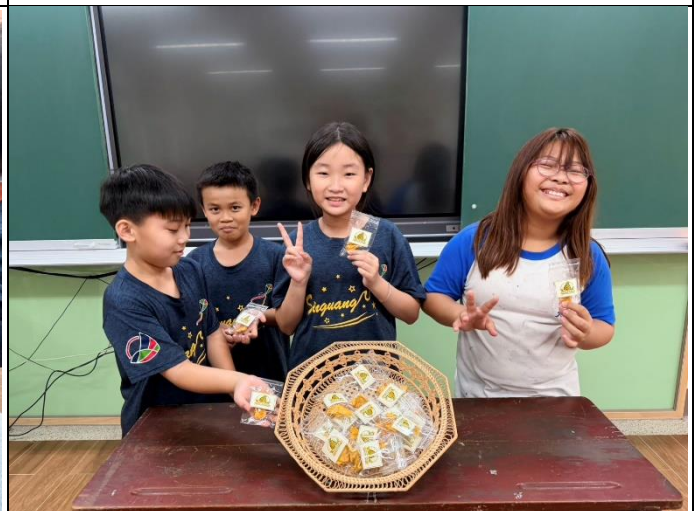
說明：大功告成，準備與師長們分享