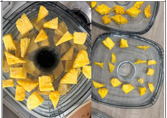
說明：放入果乾製造機&果乾完成了