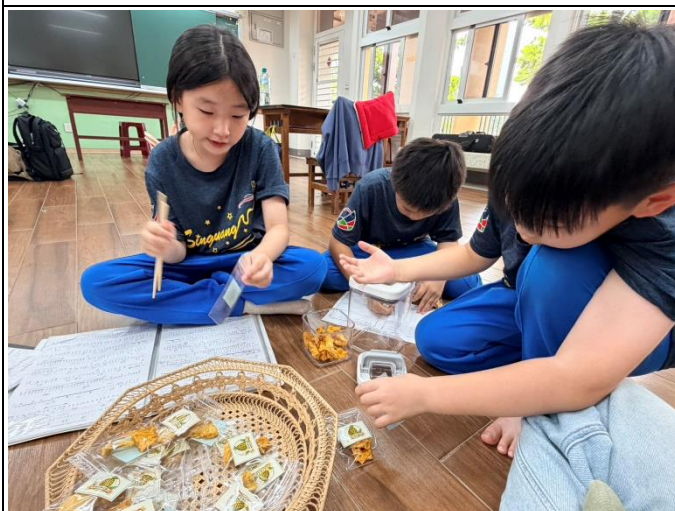
說明：LOGO 設計及果乾包裝