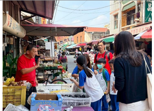
說明：向老闆購買鳳梨帶回學校