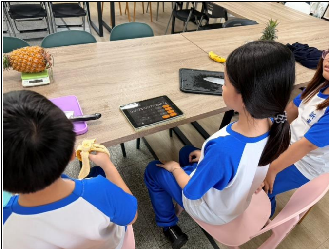
說明：利用電子稱記錄鳳梨重量