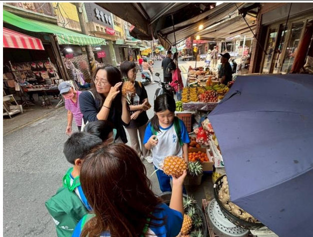
說明：透過彈指之間辨別鳳梨的種類