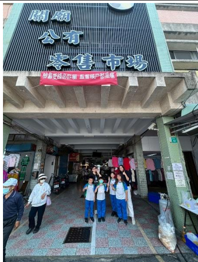
說明：走進關廟公有零售市場調查在地水果鳳梨