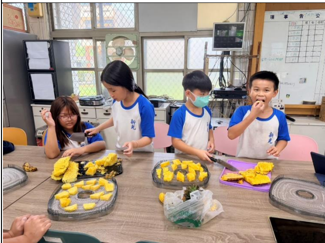
說明：鳳梨削皮及切塊2