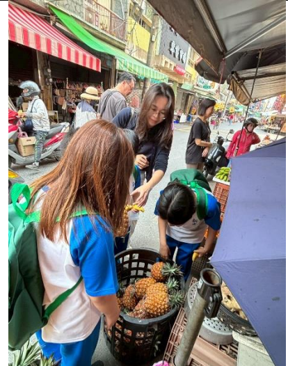
說明：挑撰關廟在地水果-鳳梨