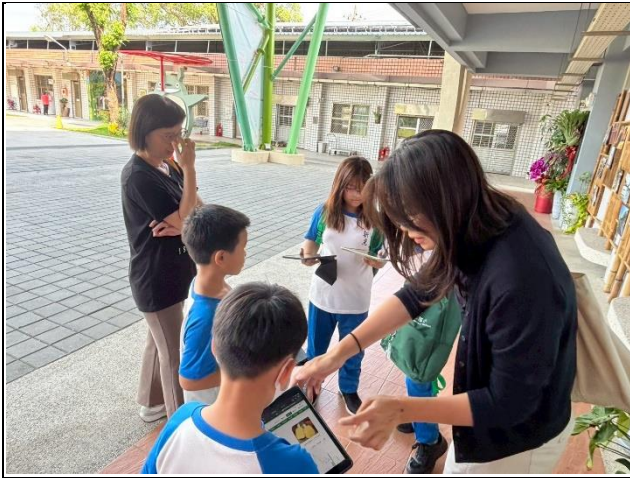
說明：在地水果鳳梨踏查前的小組討論