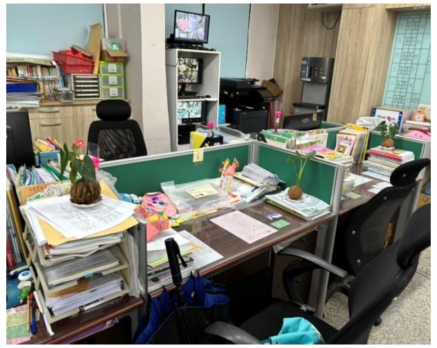
說明：辦公室內綠色植栽