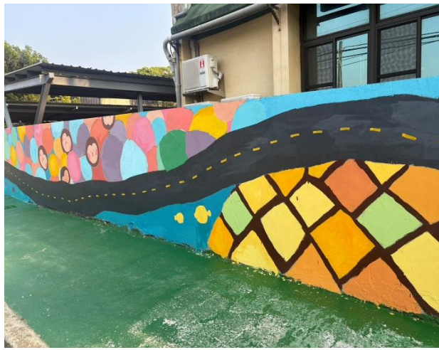
說明：校園圍牆彩繪完成美輪美奐