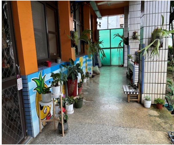
說明：校長室前走廊綠色植栽