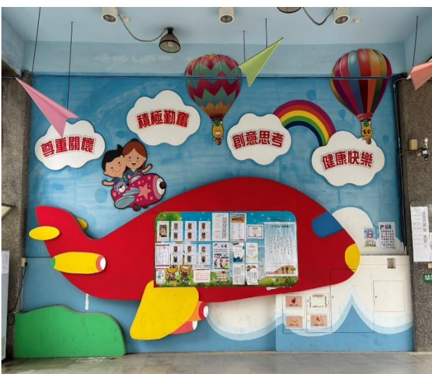
說明：生動活潑的校園藝術情境