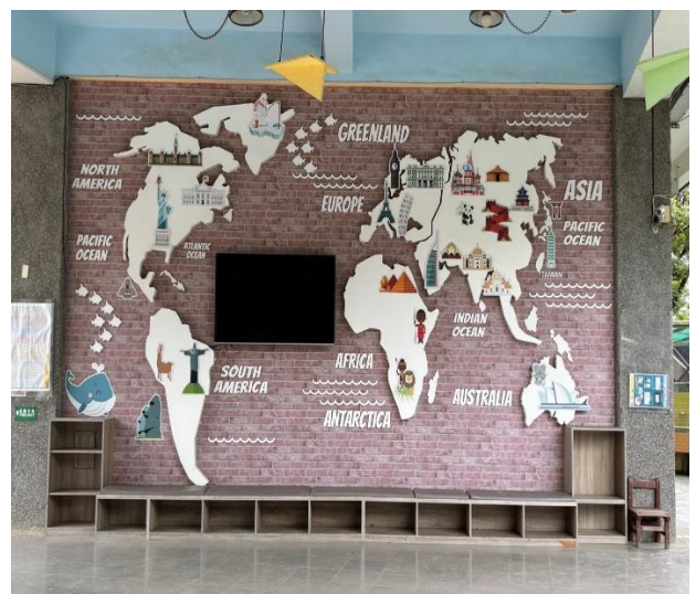
說明：生動活潑的校園藝術情境