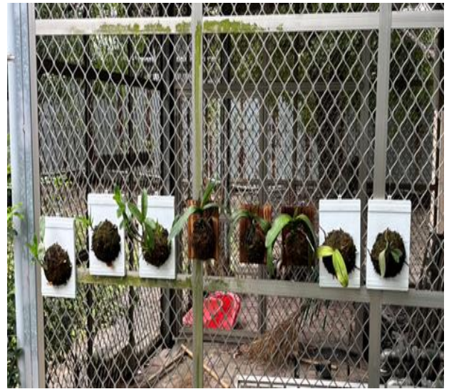
說明：校園裡的蘭花植栽