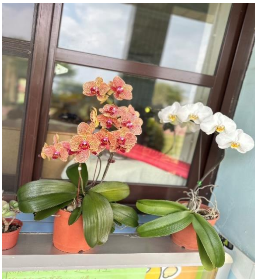
說明：教室前窗台的蘭花