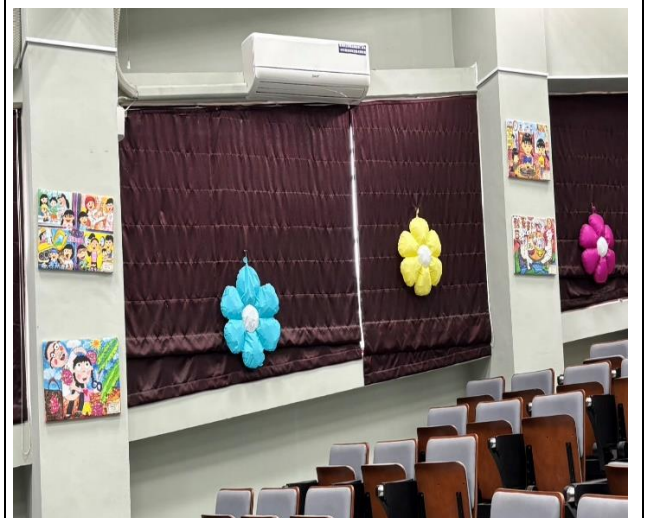
說明：學生得獎作品做成壁畫展示～多功能教室