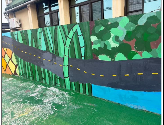
說明：校園圍牆彩繪完成美輪美奐