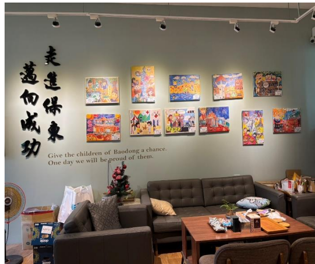
說明：學生得獎作品做成壁畫展示～校長室