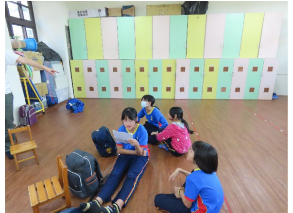
說明：學生們認真背稿。