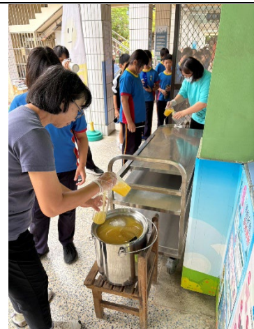
說明：鳳梨冰茶全校分享-2