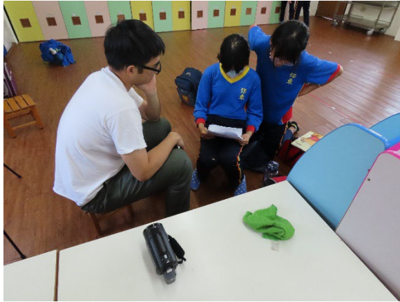
說明：學生擬訂鳳梨冰茶的介紹講稿。