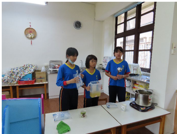
說明：學生進行鳳梨冰茶影片拍攝。