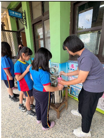
說明：鳳梨冰茶全校分享-1