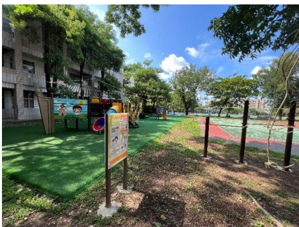
各式遊戲設施、學生下課可做體能訓練