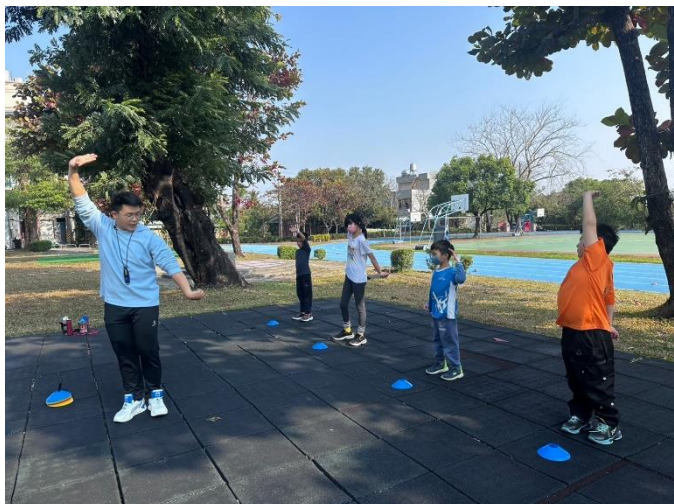
課後才藝班 -武術班