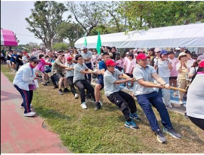
辦理校慶社區人士與教職員工拔河比賽