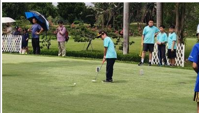
暑期才藝班 -高爾夫球營隊