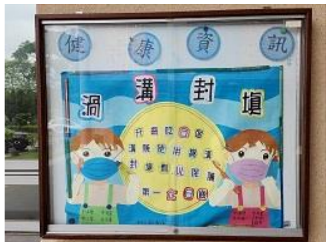
張貼健促相關議題海報