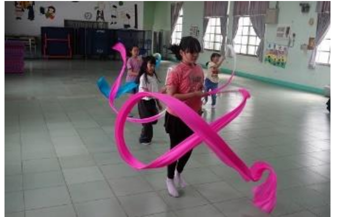
課後才藝班 肢體律動社團