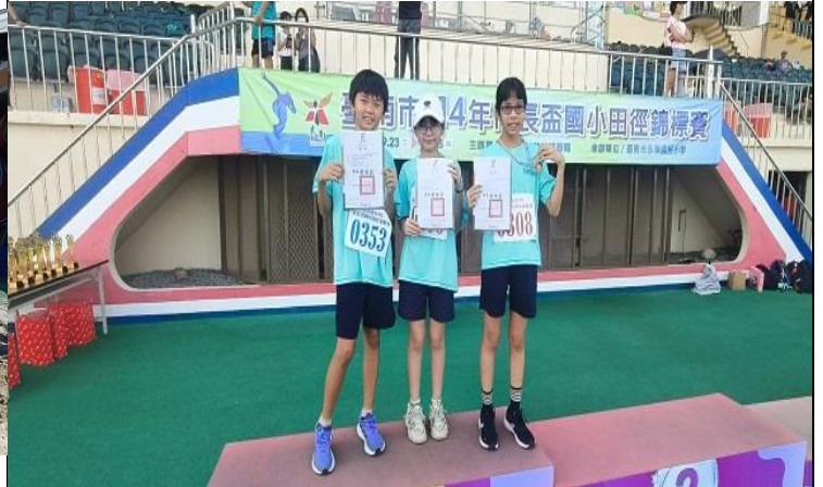
學生參加114年市長盃國小田徑錦標賽跳遠