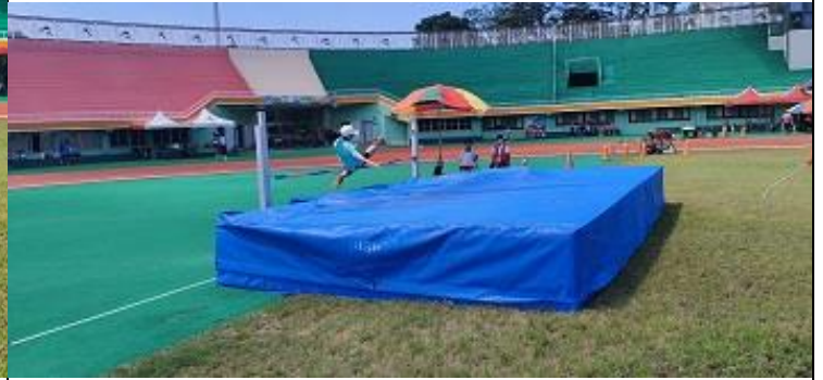
學生參加114年市長盃國小田徑錦標賽跳高