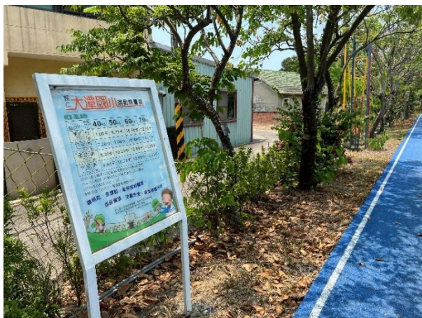
操場張貼運動熱量估算表、看我跑了消耗多少熱量