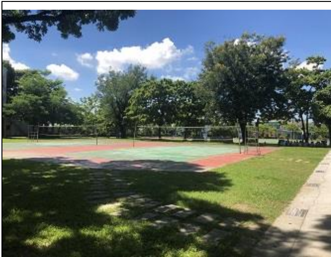
綠意盎然的校園，可舒緩疲勞眼睛