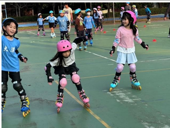
課後才藝班 -直排輪社