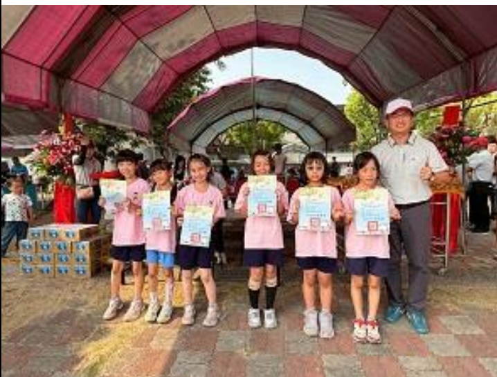
辦理校慶田徑比賽