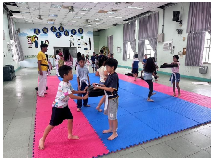
課後才藝班 -跆拳道社