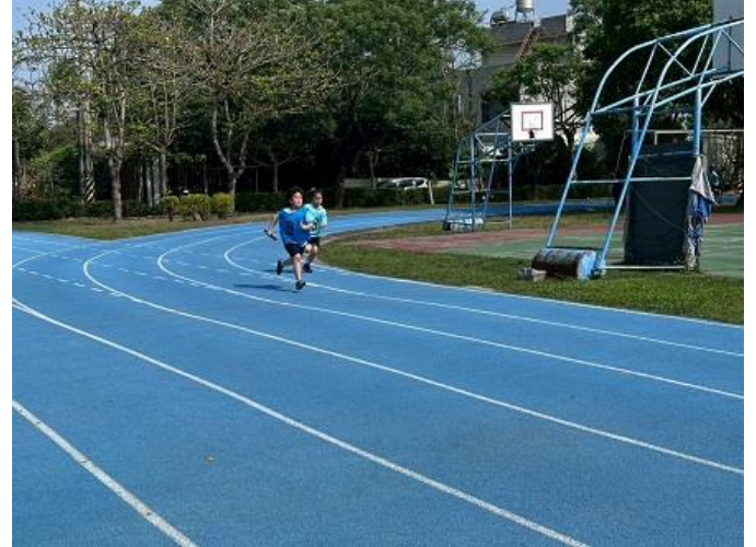
辦理校慶學生接力比賽