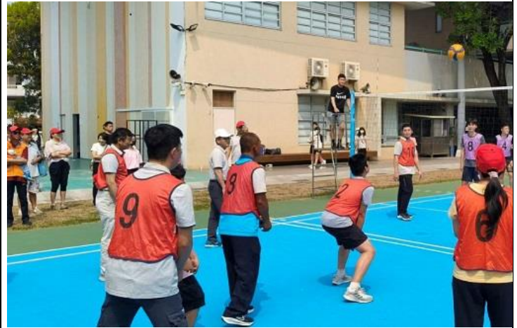
辦理社區議長杯排球比賽