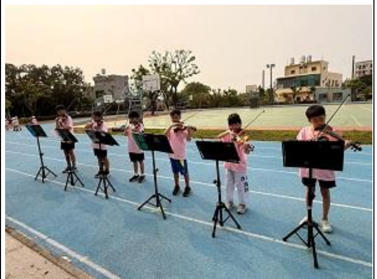
辦理親子園遊會及才藝表演活動