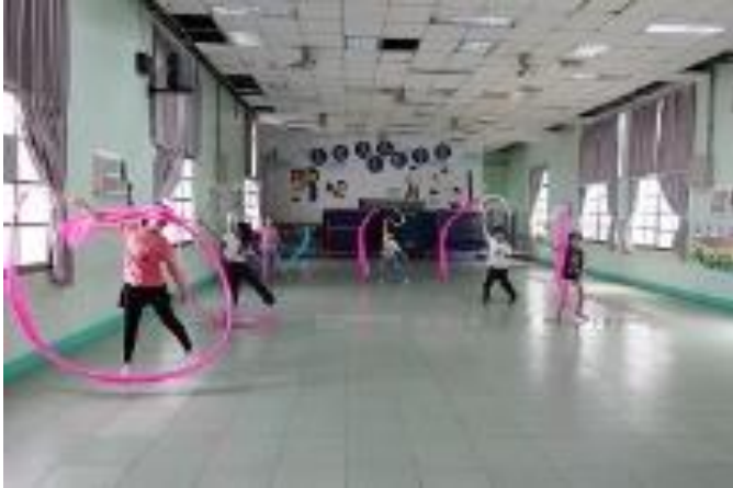
課後才藝班 肢體律動社團