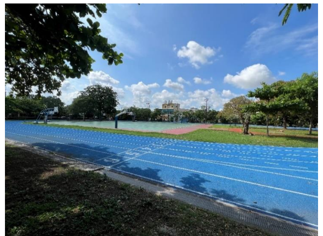
各類運動場-籃球場及操場、學生運動好場所