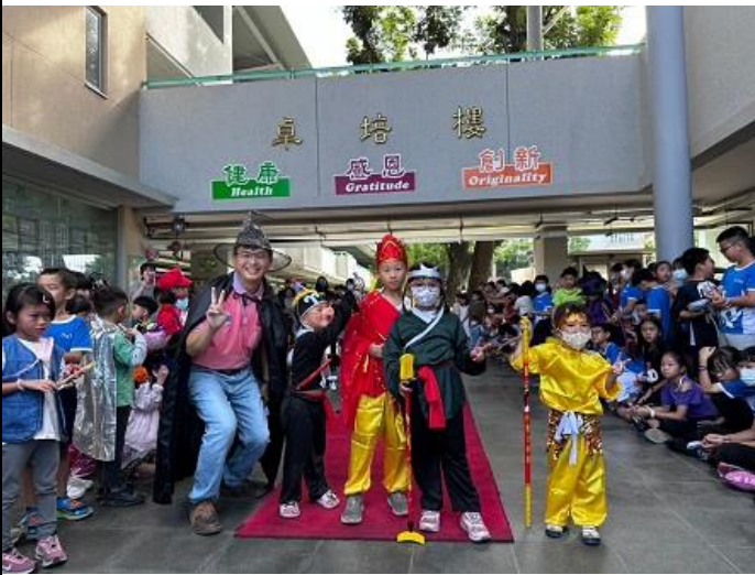
辦理萬聖節化妝走秀活動