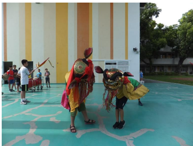
舞獅社團暑期訓練