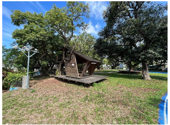
生態公園及水池，學生下課好去處