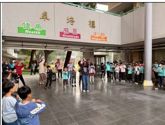
聖誕節學生上台表演