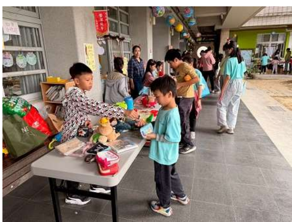
聖誕節園遊會學生擺攤