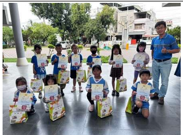
萬聖節走秀學生獎勵