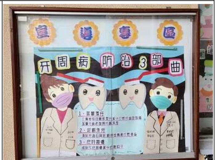
校園口腔保健情境布置