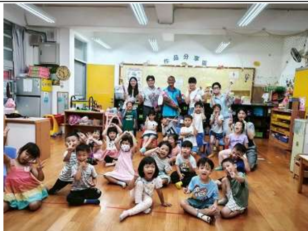
家長會長及校長母親節贈送全校師生康乃馨