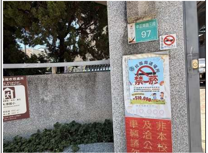
校園禁菸促進健康情境布置