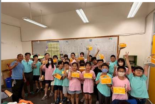
兒童節家長會長及校長發放蛋糕