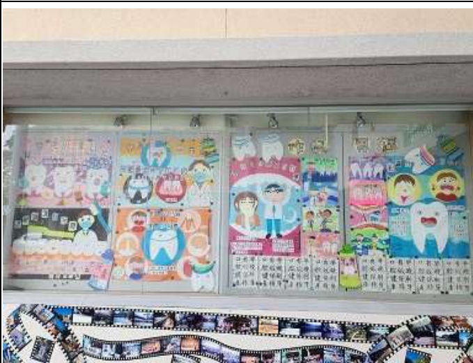
校園口腔保健情境布置