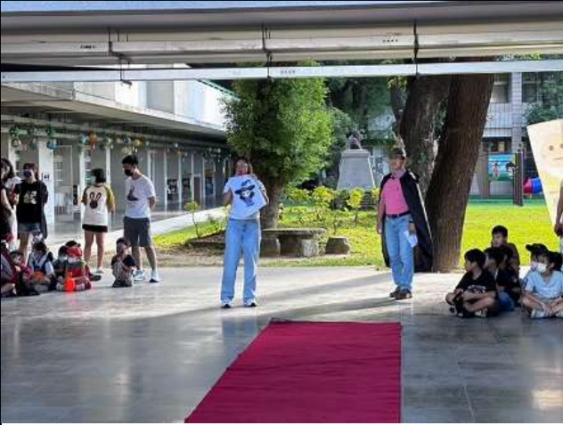
外師介紹萬聖節常用英文單字