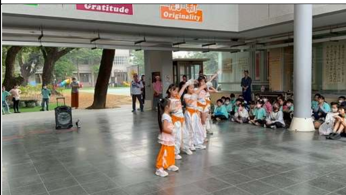
聖誕節園遊會學生舞蹈表演