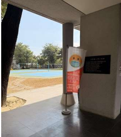
校園空氣品質旗幟警示