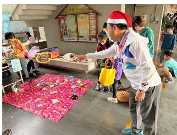
聖誕節園遊會學生擺攤(套圈圈遊戲)