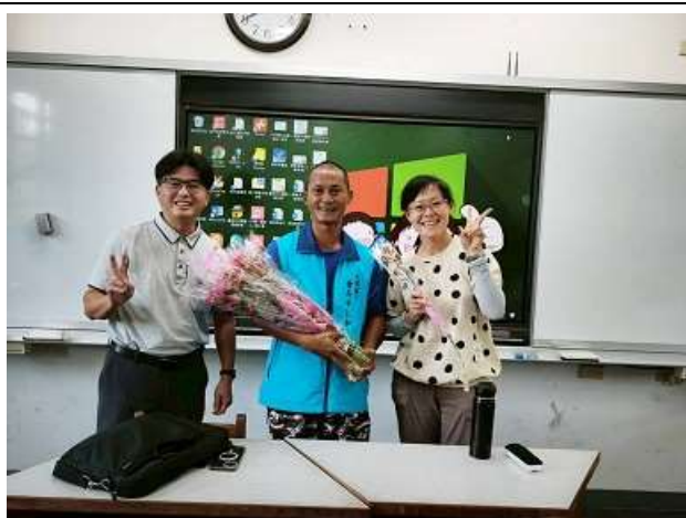
家長會長及校長母親節贈送全校師生康乃馨