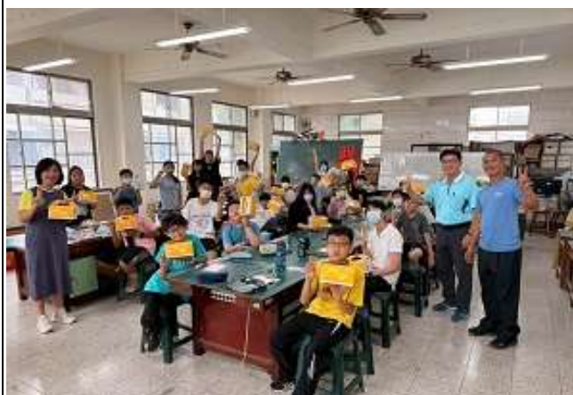
兒童節家長會長及校長發放蛋糕