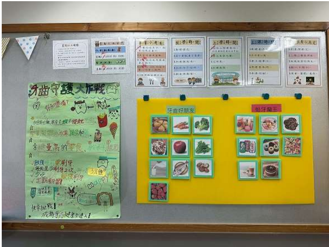
班級教室口腔保健情境布置