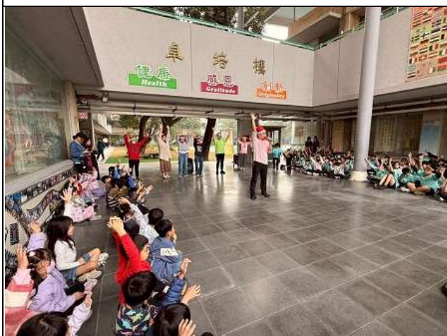
聖誕節中洲教會帶動唱