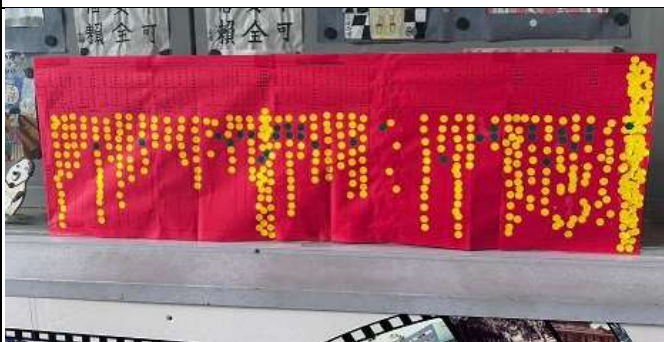
萬聖節走秀全校師生投票