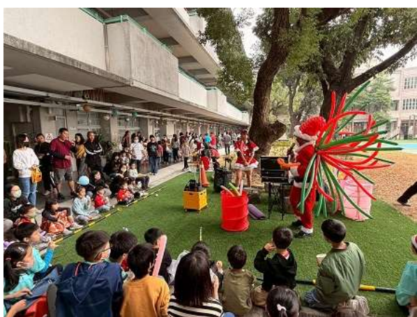
聖誕節園遊會氣球裝置表演