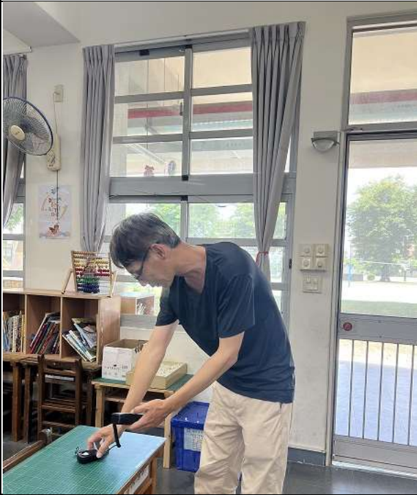
每學期測量教室課桌椅亮度