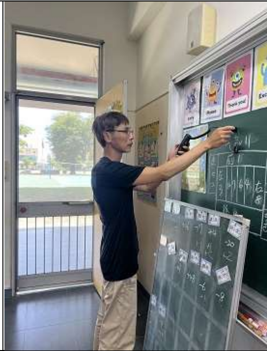
每學期測量教室黑板亮度