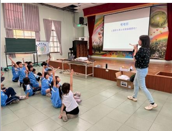
營養師講解水果顏色