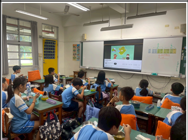
4年級觀賞影片情形