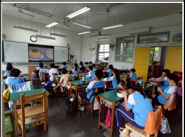
5年級觀賞影片情形