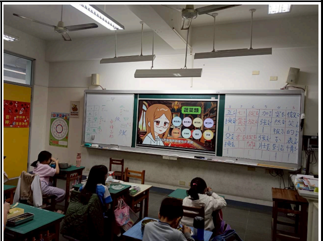
2年級觀賞影片情形