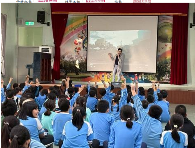
歸仁分局交通分隊警員解說交通安全注意事項