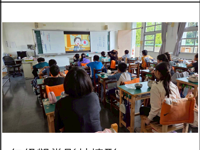
4年級觀賞影片情形