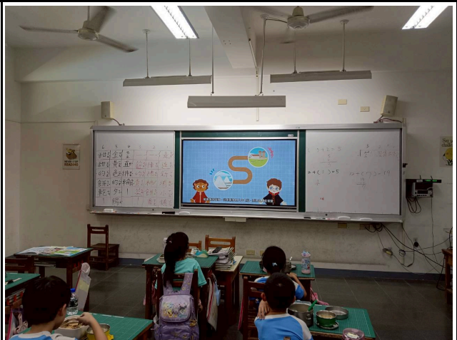
2年級觀賞影片情形