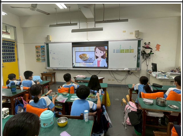
4年級觀賞影片情形