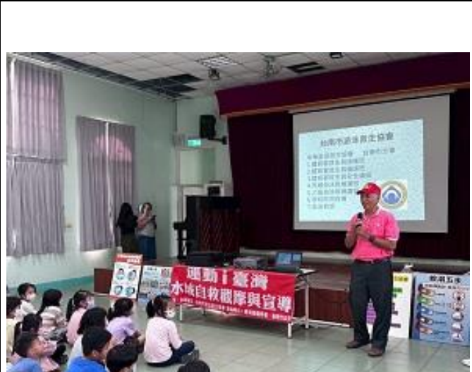
台南市游泳救生協會到校宣導