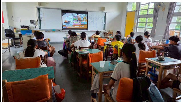
4年級觀賞影片情形