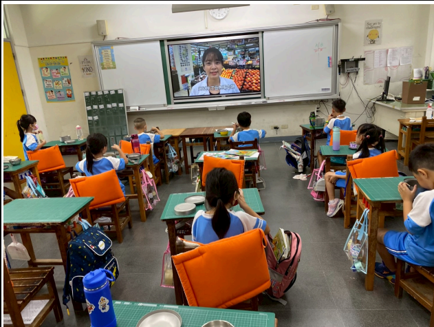
1年級觀賞影片情形