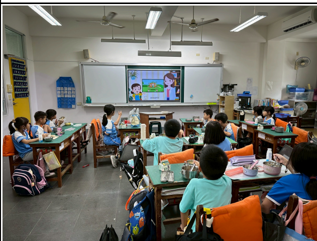
3年級觀賞影片情形