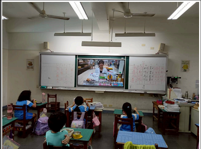
2年級觀賞影片情形