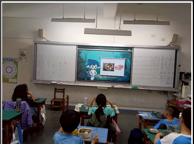
2年級觀賞影片情形