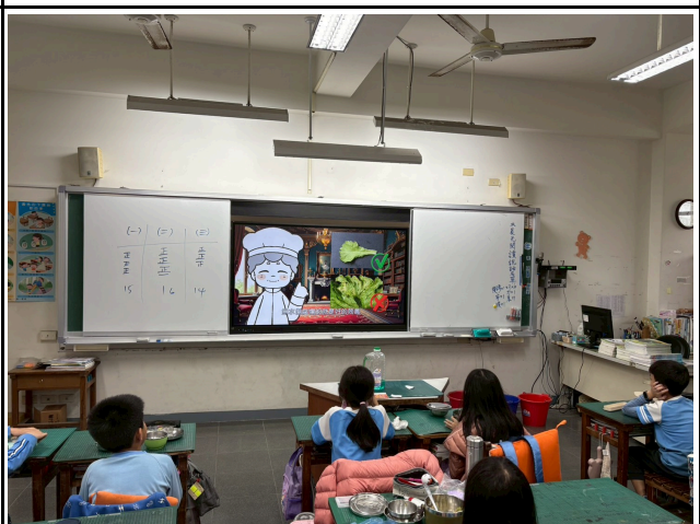
4年級觀賞影片情形