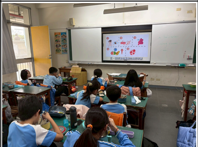
4年級觀賞影片情形