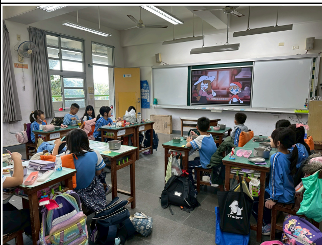
3年級觀賞影片情形