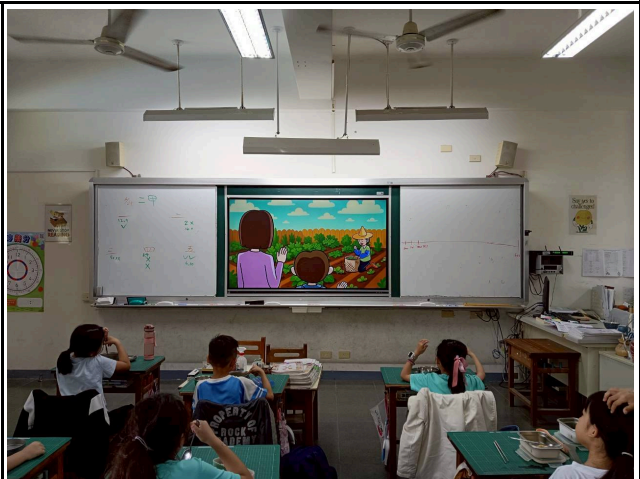
2年級觀賞影片情形