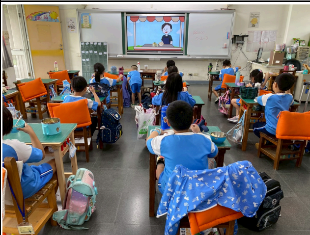
1年級觀賞影片情形