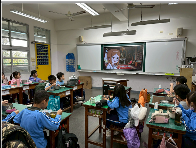
3年級觀賞影片情形