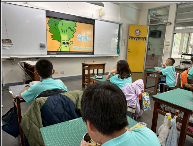
3年級觀賞影片情形