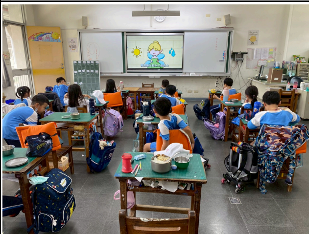
1年級觀賞影片情形