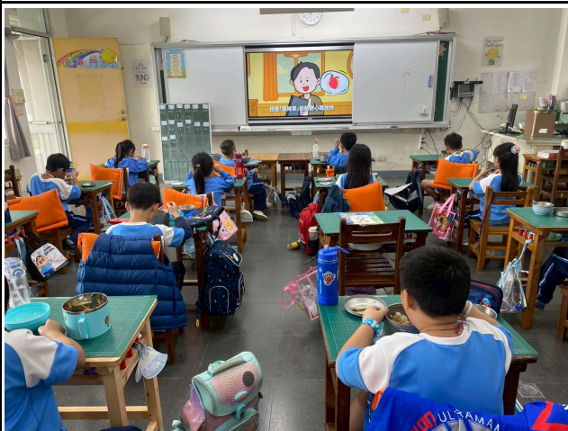
1年級觀賞影片情形