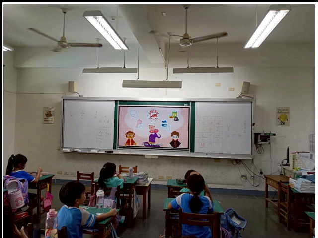
2年級觀賞影片情形