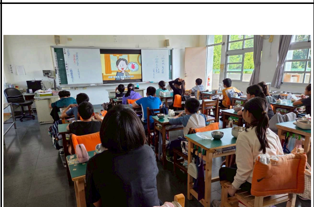
4年級觀賞影片情形