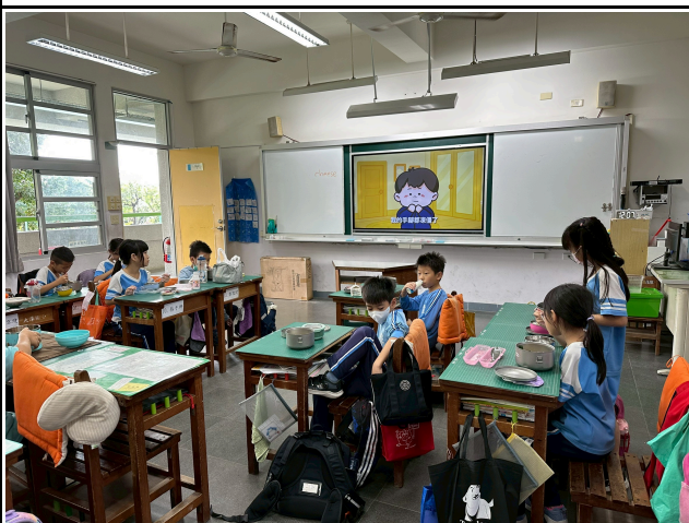
3年級觀賞影片情形