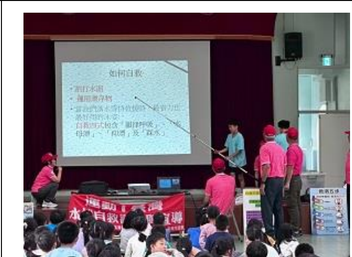
台南市游泳救生協會到校宣導