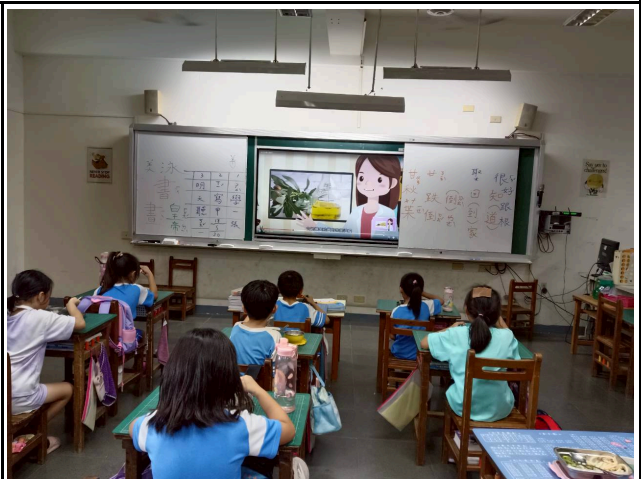
2年級觀賞影片情形