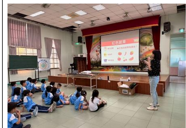
營養師講解各顏色水果