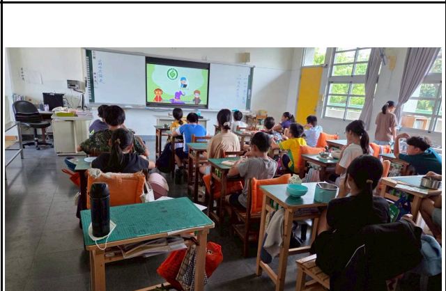
4年級觀賞影片情形