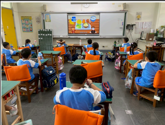
1年級觀賞影片情形