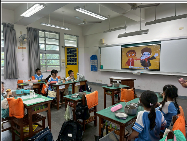
3年級觀賞影片情形