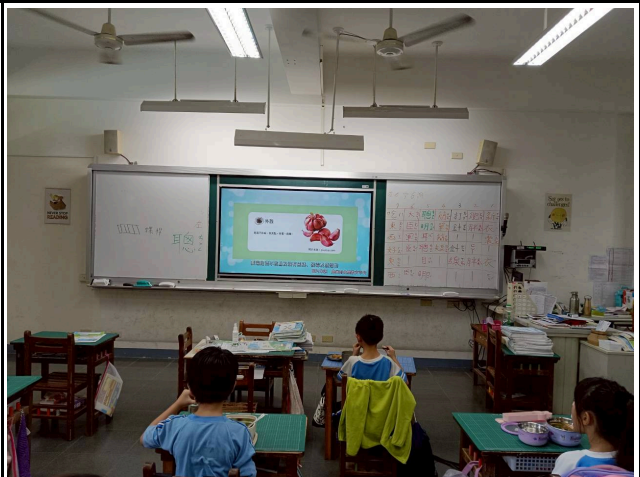
2年級觀賞影片情形