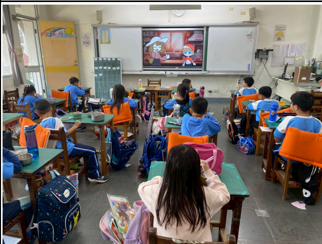
1年級觀賞影片情形