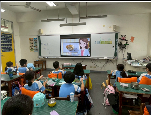
1年級觀賞影片情形