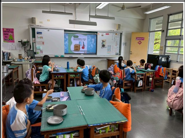
4年級觀賞影片情形