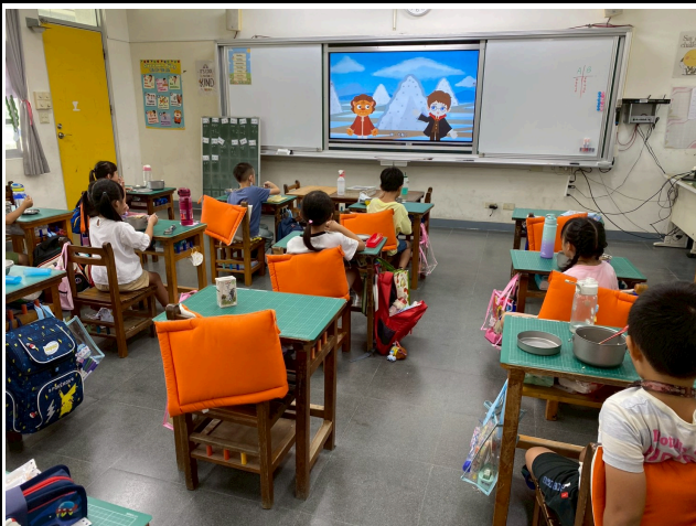
1年級觀賞影片情形