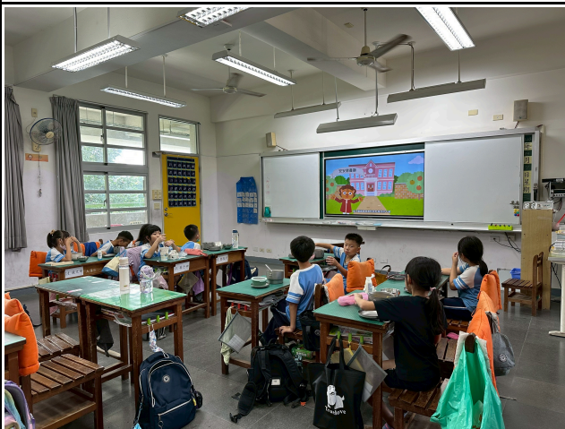
3年級觀賞影片情形