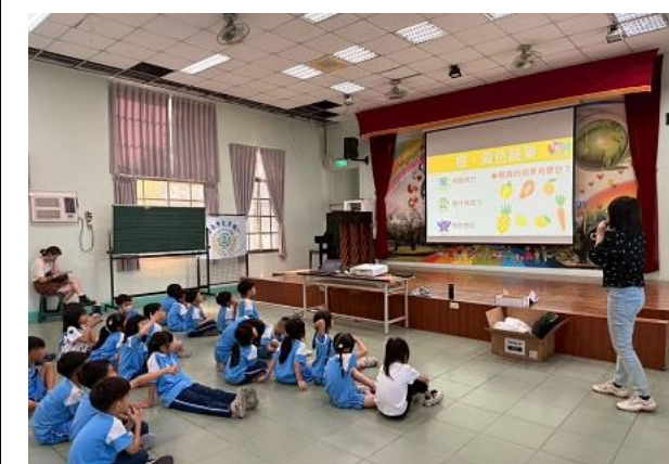
營養師講解各顏色水果