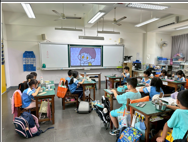
3年級觀賞影片情形