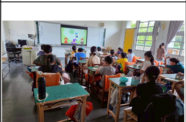
4年級觀賞影片情形