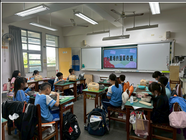
3年級觀賞影片情形