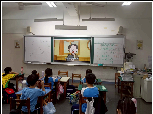
2年級觀賞影片情形