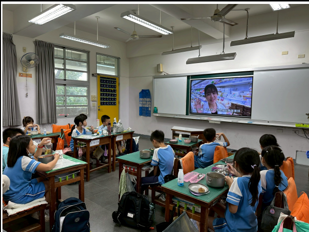
3年級觀賞影片情形