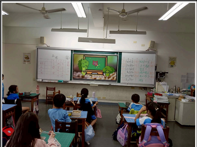
2年級觀賞影片情形