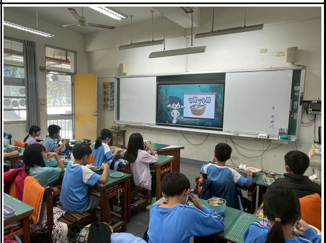
4年級觀賞影片情形