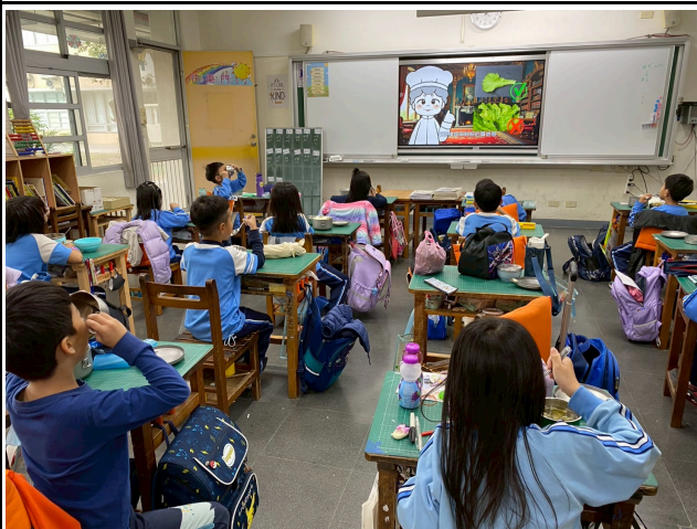
1年級觀賞影片情形