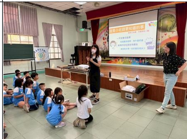
營養師講解水果每日攝取量