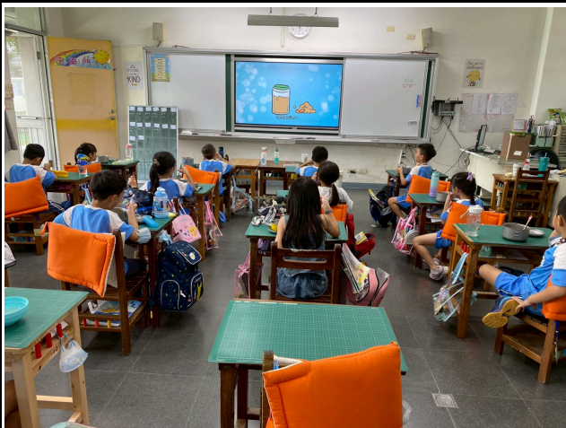
1年級觀賞影片情形