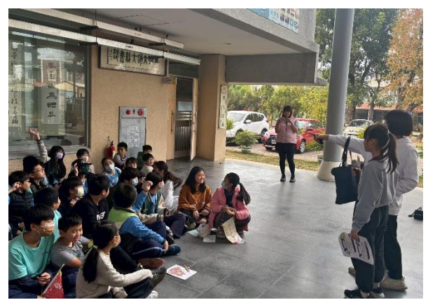
說明：透過有獎徵答加強學生對於健康飲食印象