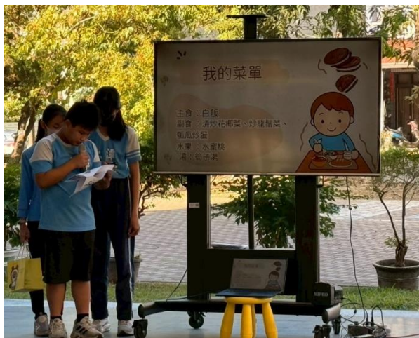
說明： 學生設計並分享符合健康飲食的菜單內容