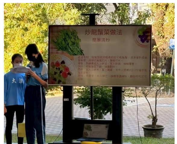
說明： 學生分享龍鬚菜的營養價值以及料理方式