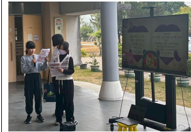
說明：學生分享白米飯的另一種料理方式