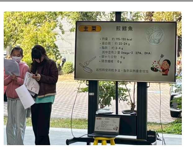
說明：鱈魚烹調方式注意不可放太多油