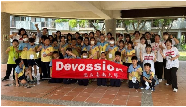
臺南大學 Devossion 營隊，著重在戶外進行多元學習