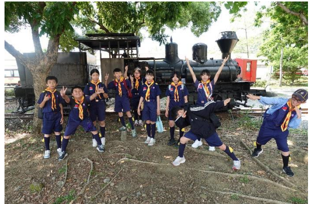
童軍教育，讓孩子在大自然中學習