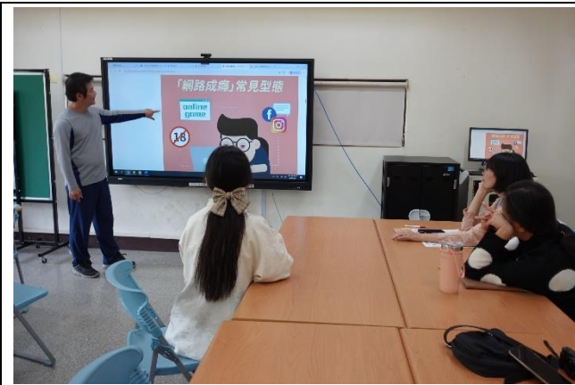
社群小組進行「防治網路成癮研習」