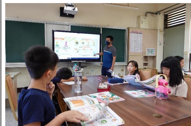
餐前 5 分鐘專書教學