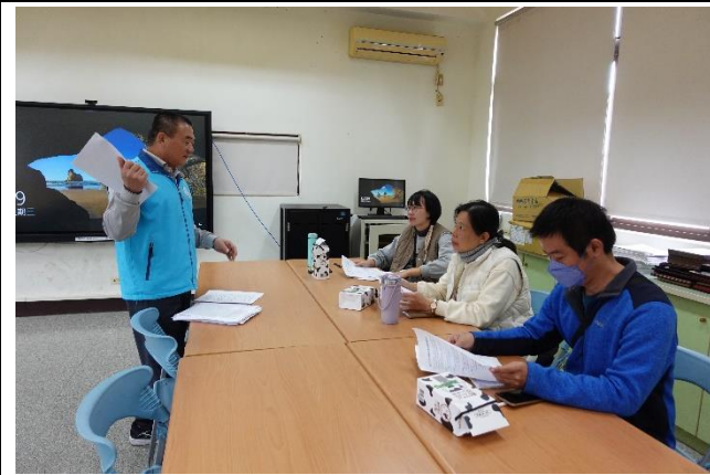
健康上網課程教案實作工作坊研習 融入健體教案與教學工具討論