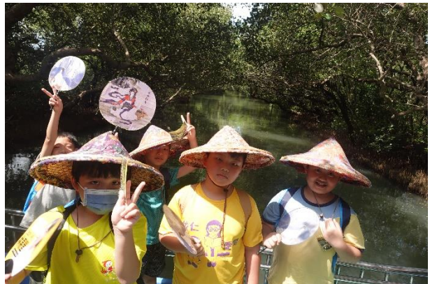
戶外教育的地點以室外景點為主