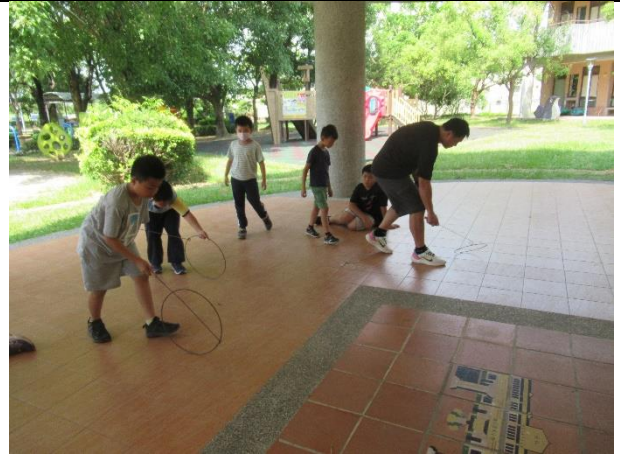
所有的運動器材都能自由取用，落實下課教室淨空