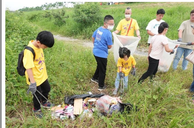
二仁溪河川巡守隊，愛護家鄉環境