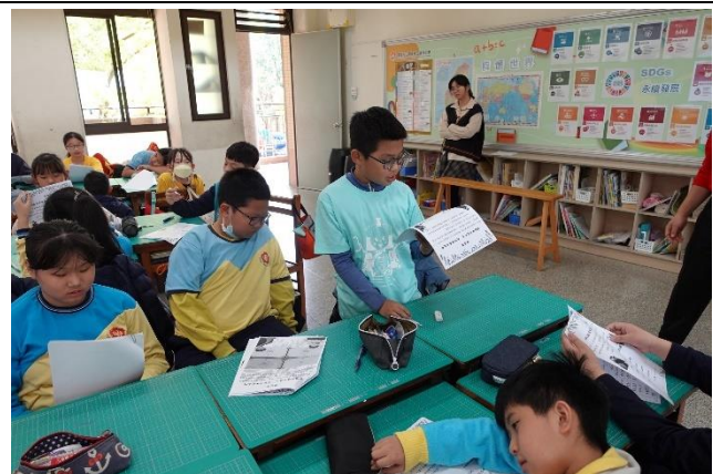
公開觀課，學生習寫學習單與分享