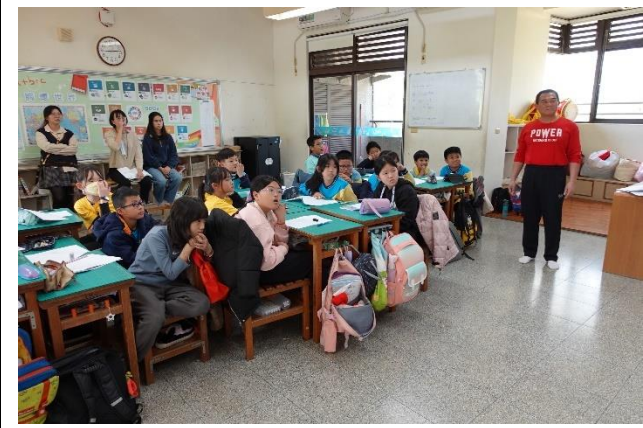
網路不沉迷，公開觀課