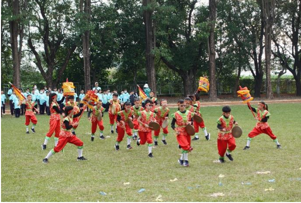
走出教室，三到六年級都進行跳鼓教學