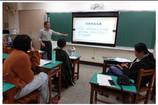
網路不沉迷，社群小組共同備課