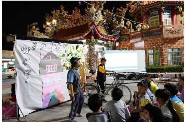
廟口說故事，戶外也能進行閱讀活動