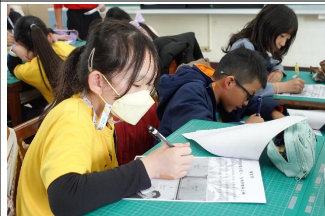
公開觀課，學生習寫學習單