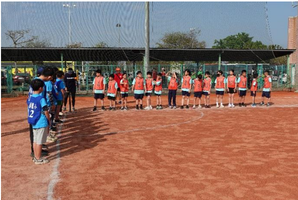
參加臺南市樂樂棒球比賽