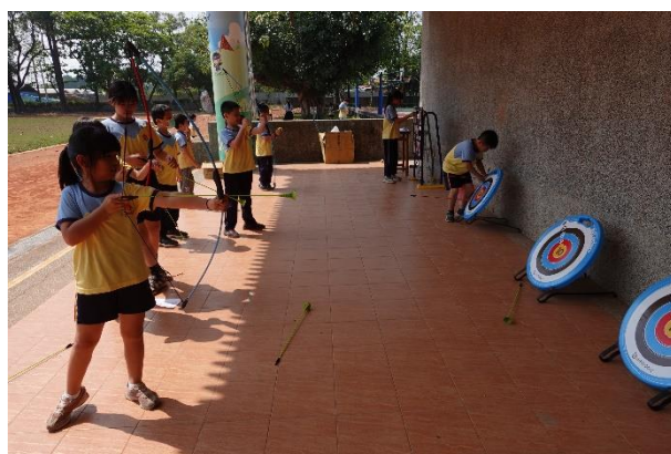
每年都有多元學習課程，10 種有趣的闖關活動