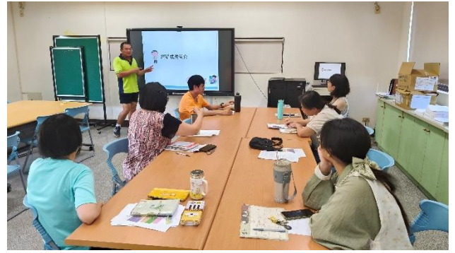
全校教師進行「網路成癮研習」