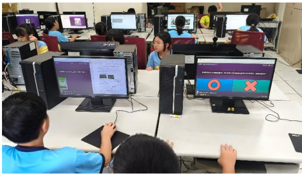
餐前 5 分鐘主題小測驗