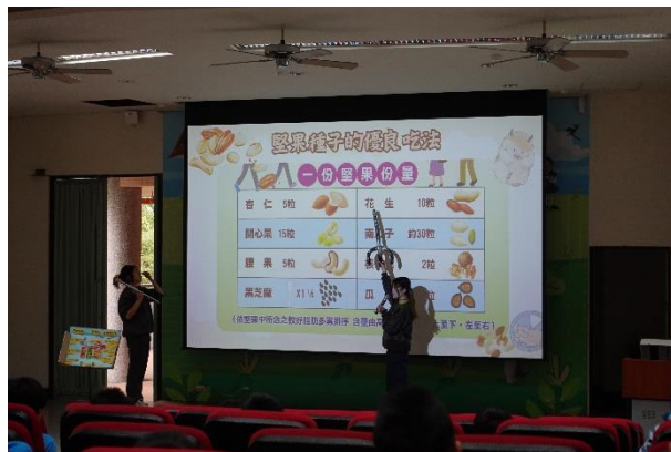
中華醫事科大到校進行均衡營養宣導