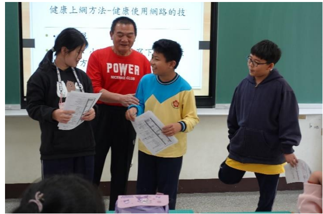
網路不沉迷，公開觀課的學生小組上台分享