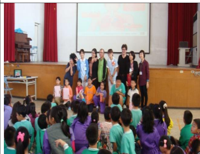
中華醫事科技大學反毒宣導