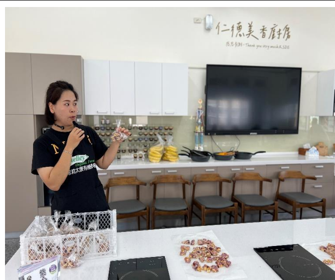
農會老師對採收後的南瓜進行烹調教學