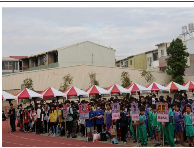
學校運動會搭配主題宣導