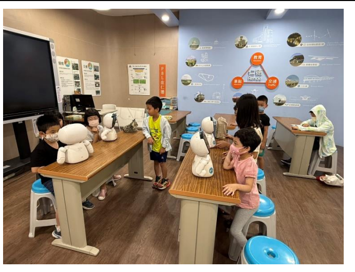
辦理性別意識成長教育親子讀書會