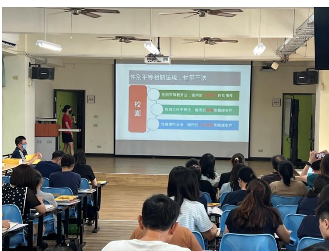
辦理研習-教師及家長參與了解性平課程