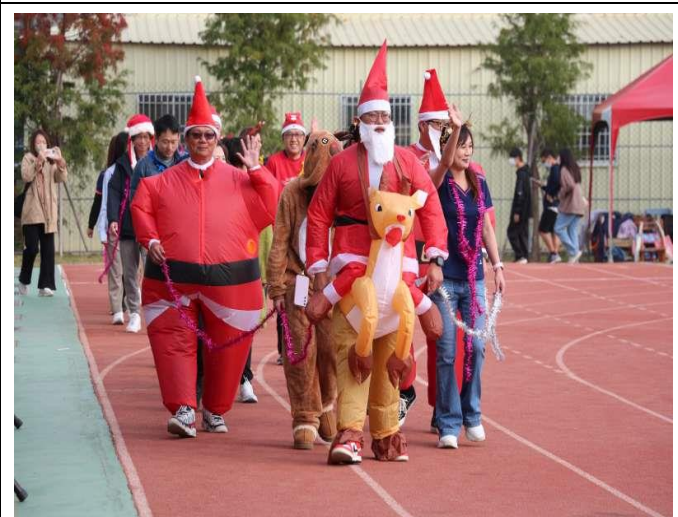
支持學校的 家長會 變裝進場-活潑可愛