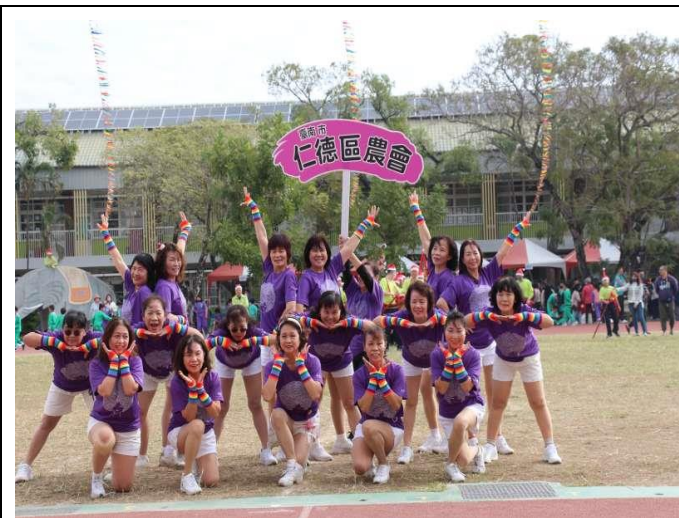
農會編舞入校表演-動起來