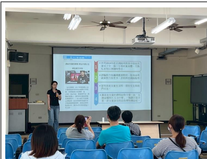
透過親職座談說明性剝削議題(研習)