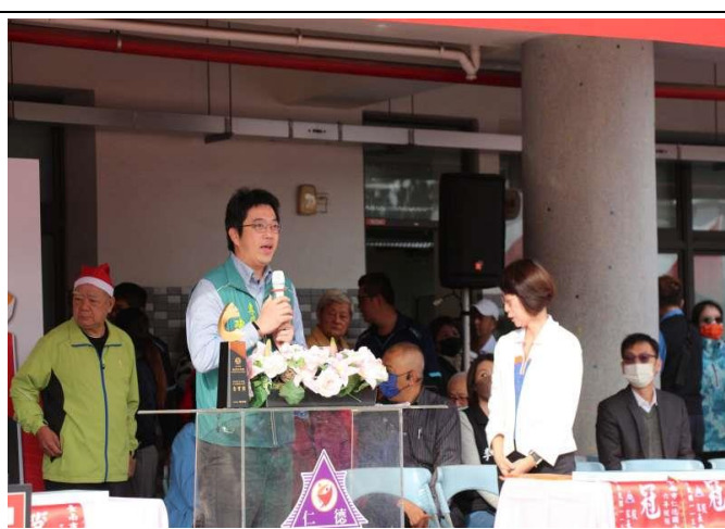
教育局秘書室主任致詞