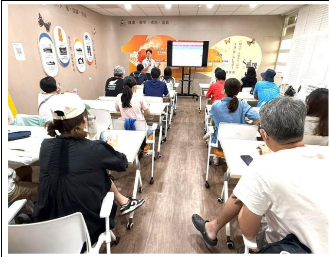
辦理性別意識成長教育親子讀書會