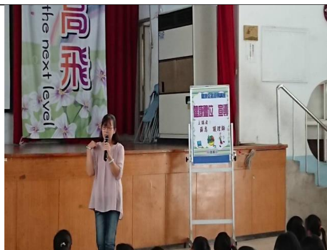
仁德區衛生所健康體位宣導