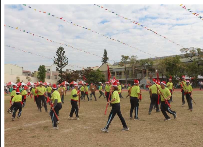
社區廟宇特色宋江陣體力活