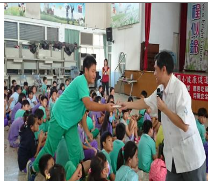
結合當地藥局藥劑師辦理衛教宣導