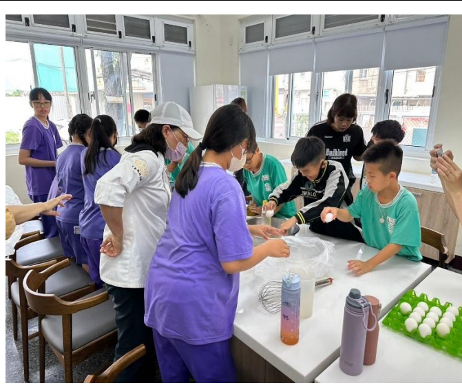
採收後的南瓜進行烹調