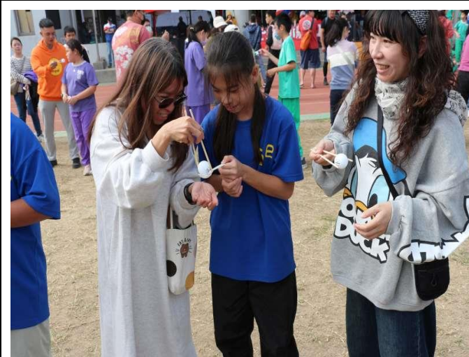
家長一起參與趣味競賽