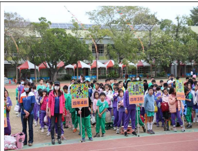
學校運動會搭配主題宣導