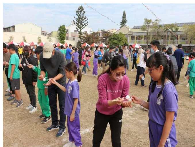
家長一起參與趣味競賽