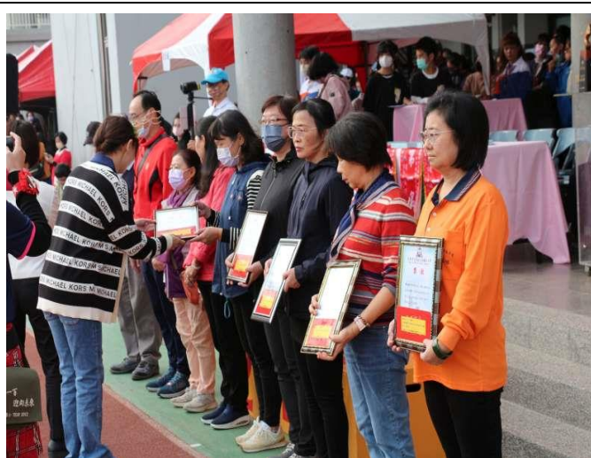
會長頒獎給績優 志工 -感謝為學校服務