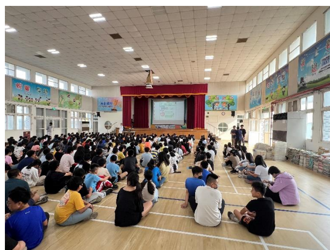
結合當地診所辦理衛教宣導