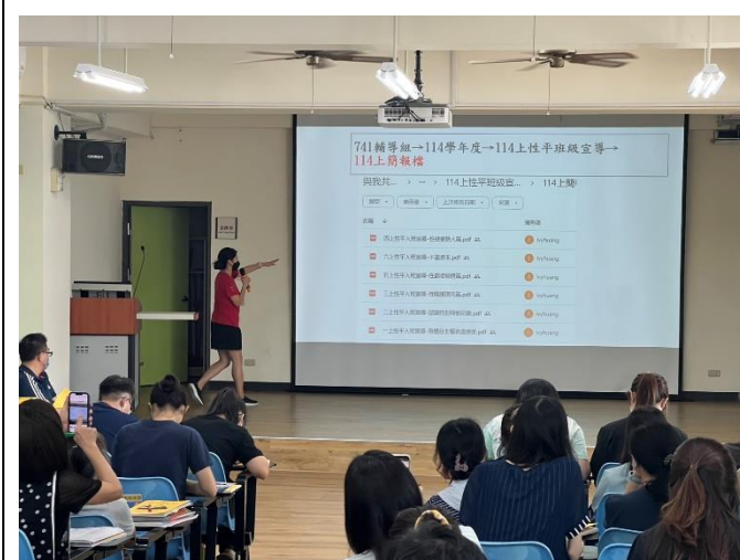
辦理研習-教師及家長參與了解性平課程