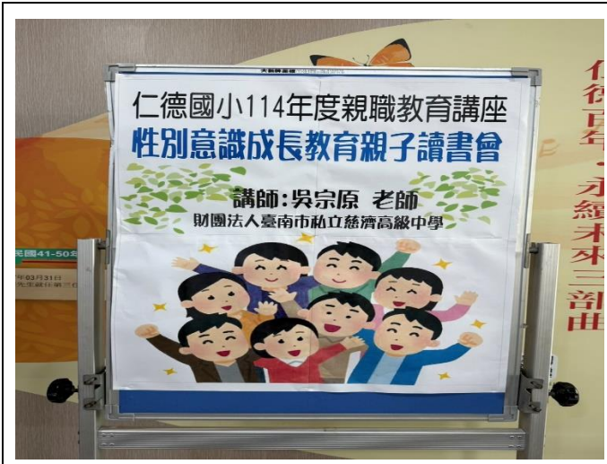
辦理性別意識成長教育親子讀書會