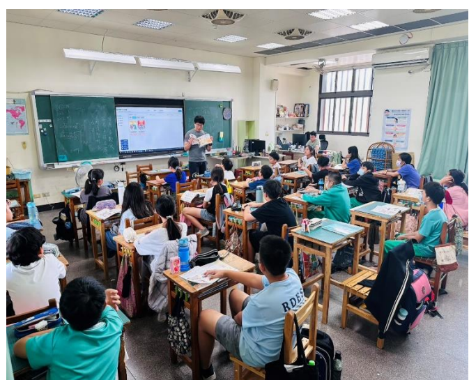
入班健康飲食宣導-天天五蔬果