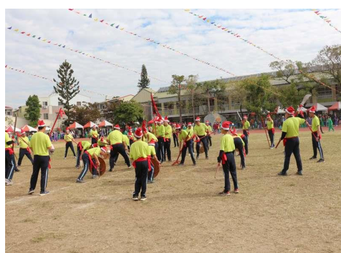
社區廟宇特色宋江陣體力活