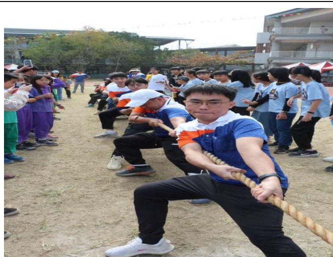
老師們最佳示範-拔河競賽