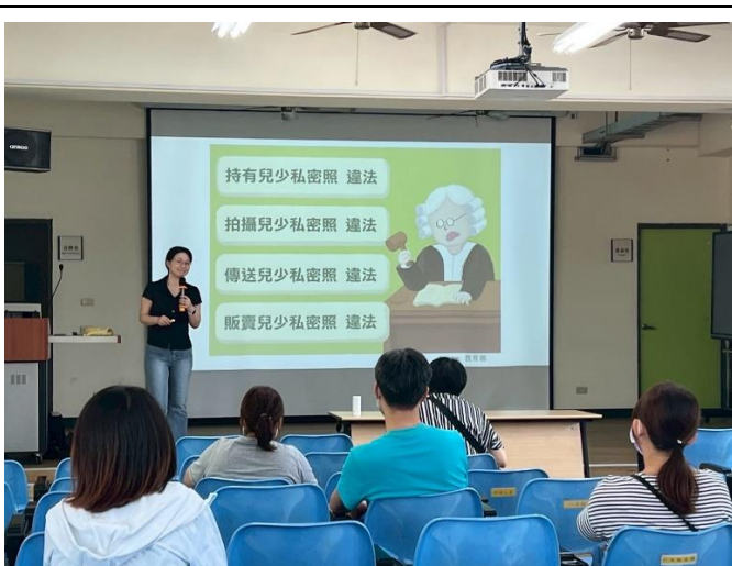
透過親職座談說明性剝削議題(研習)