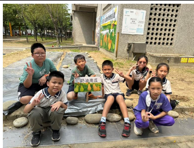
學生實地感受種植南瓜樂趣