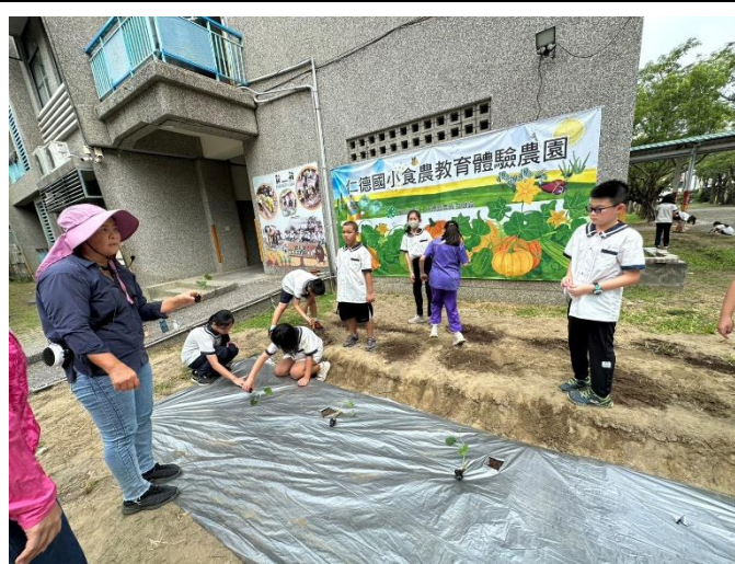
學生實地感受種植南瓜樂趣