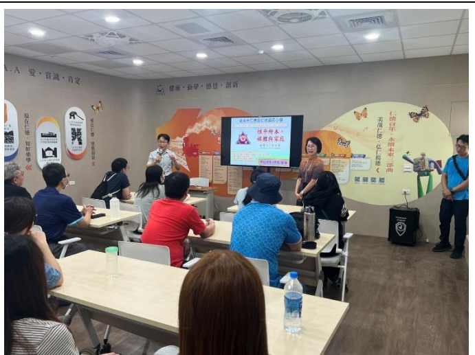
辦理性別意識成長教育親子讀書會