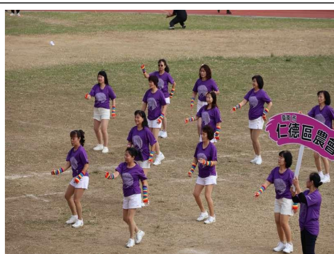
農會編舞入校表演-動起來