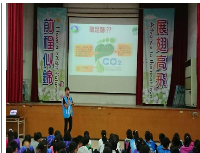
嘉南藥理大學低碳飲食宣導