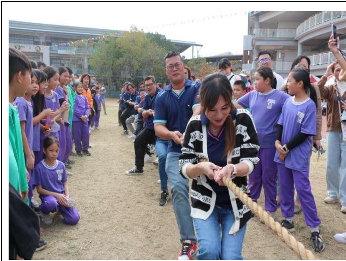
家長會最佳示範-一起拔河囉