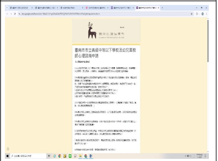
提供教職員工個別諮商訊息