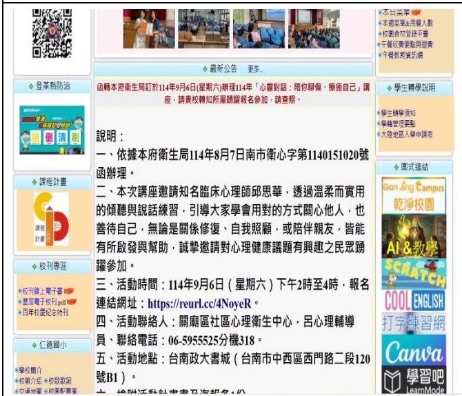
學校首頁置放相關心理療傷資訊