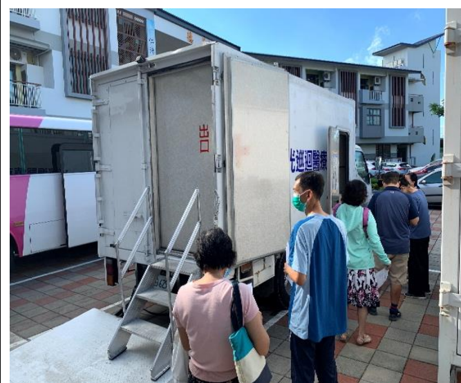
配合教育局政策教師健康檢查服務