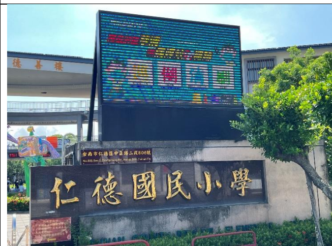
學校電子看板提醒民眾登革熱事宜