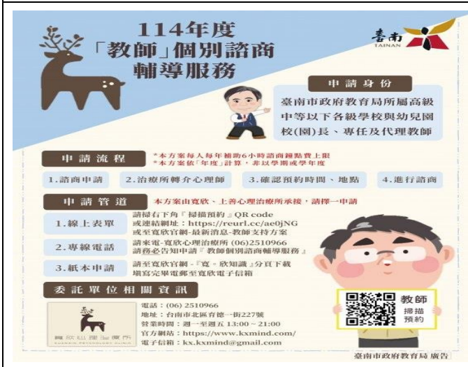
提供教職員工個別諮商訊息