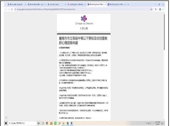
提供教職員工個別諮商訊息