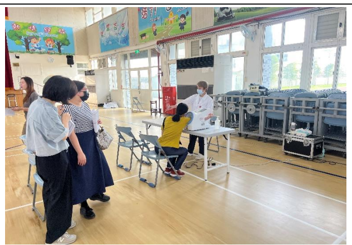
配合教育局政策教師健康檢查服務