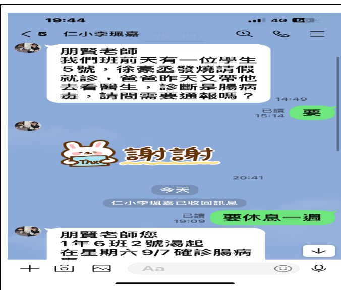
與老師 Line 協助學生腸病毒相關事