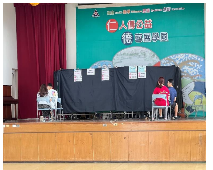
配合教育局政策教師健康檢查服務