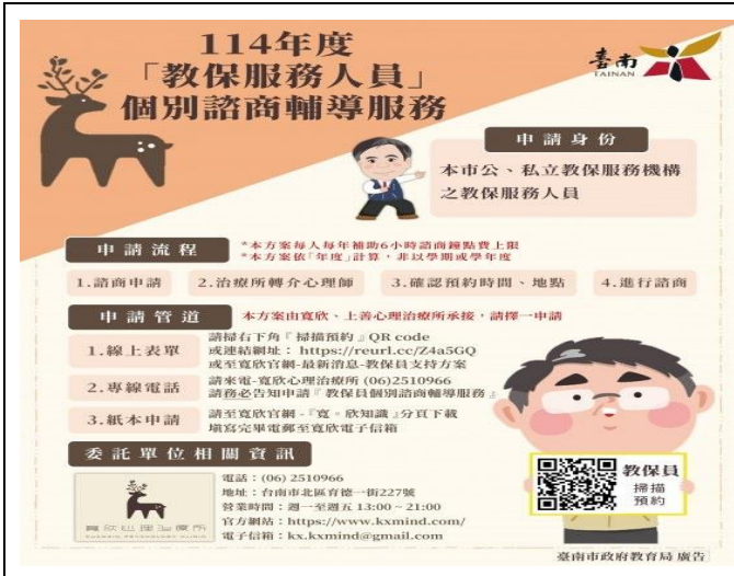
提供教職員工個別諮商訊息