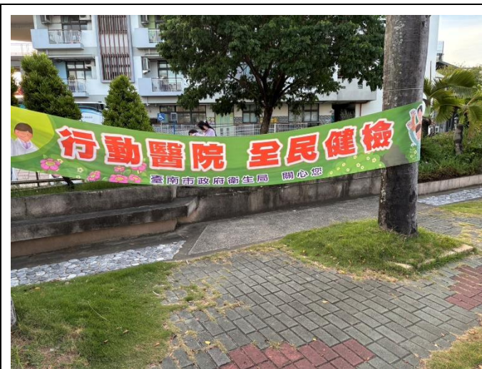
結合當地衛生所辦理全民健檢