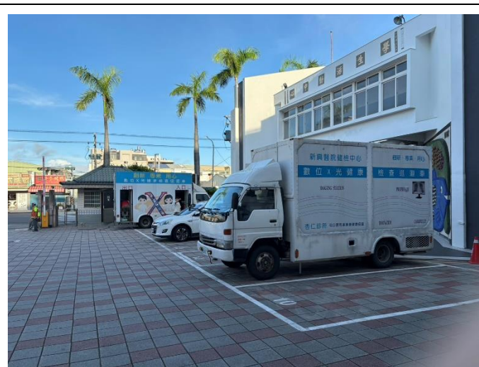
健檢專車到校服務