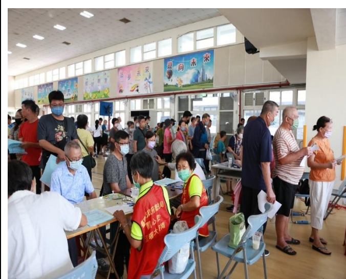
配合衛生所提供民眾到校建檢服務