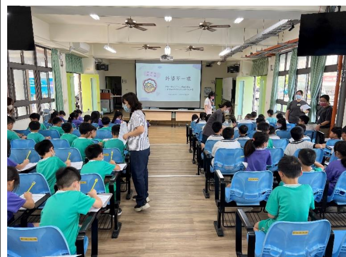
結合當地衛生所辦理衛教宣導