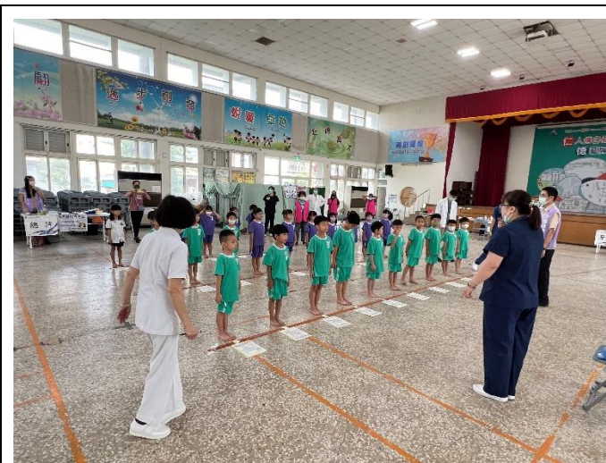
配合局端政策學生 健康檢查