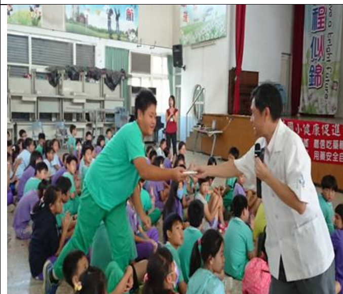
結合當地藥局藥劑師辦理衛教宣導