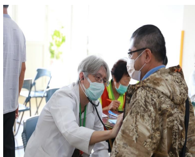
配合衛生所提供民眾到校建檢服務