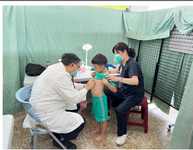
配合局端政策學生 健康檢查