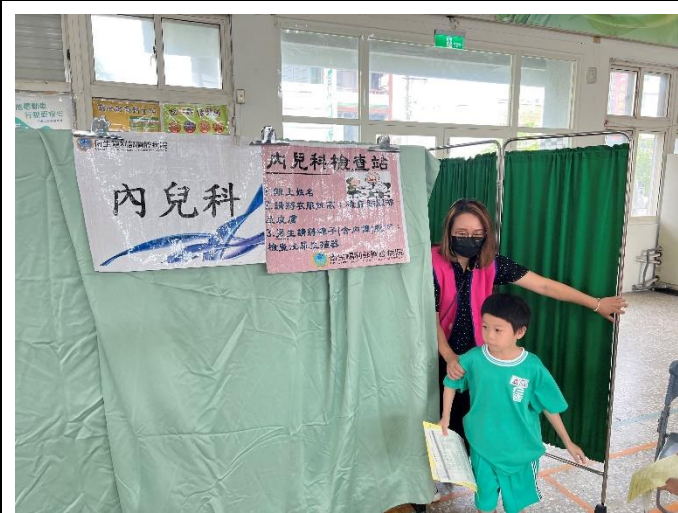
配合局端政策學生 健康檢查