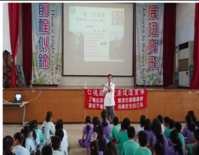
結合當地藥局藥劑師辦理衛教宣導