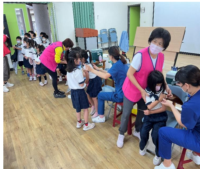
配合局端政策 流感 疫苗施打