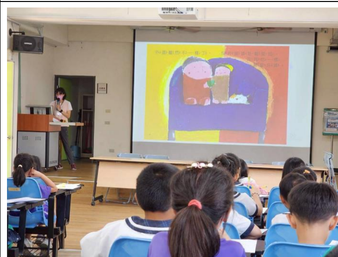
結合當地衛生所辦理衛教宣導