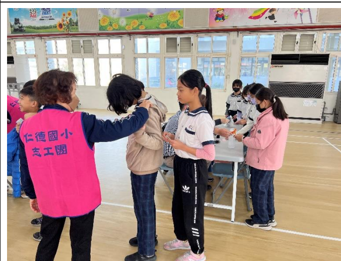
配合局端政策 Covid-19 疫苗施打