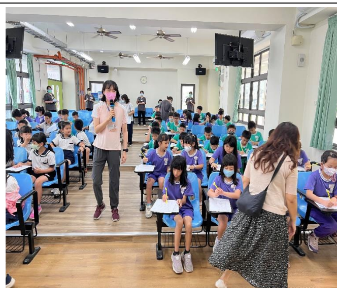
結合衛生所辦理(腸病毒登革熱)宣導