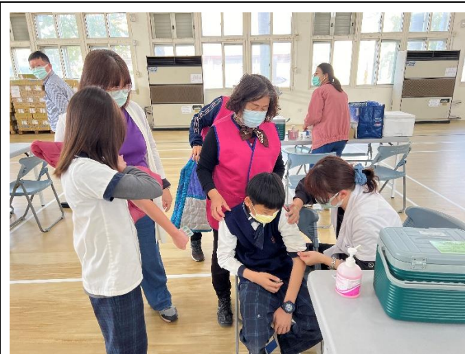
配合局端政策 Covid-19 疫苗施打