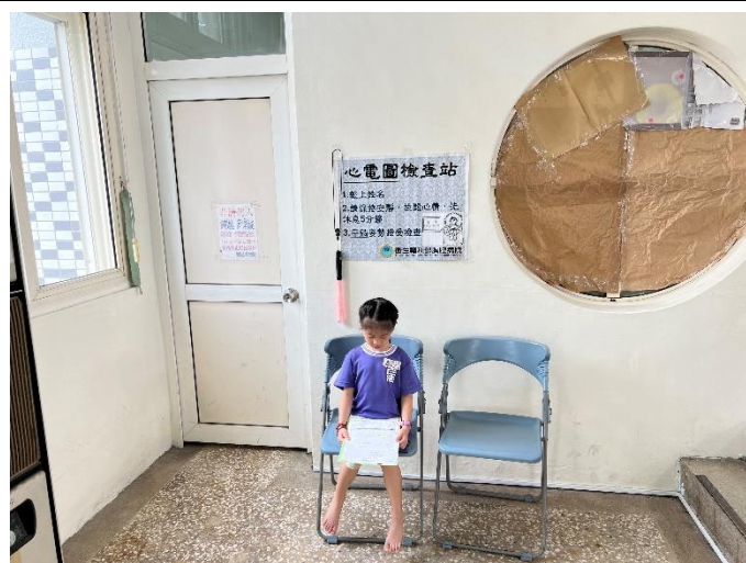
配合局端政策學生 健康檢查