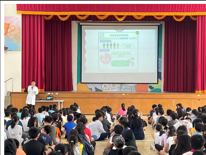
結合當地診所醫師辦理衛教宣導