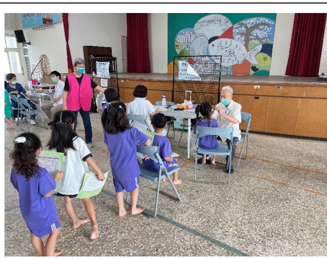
配合局端政策學生 健康檢查