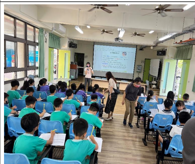
結合衛生所辦理(腸病毒登革熱)宣導