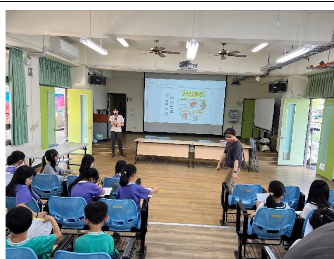
結合衛生所辦理(腸病毒登革熱)宣導