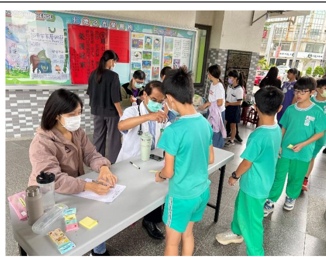
配合局端政策 流感 疫苗施打