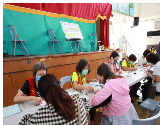
配合衛生所提供民眾到校建檢服務