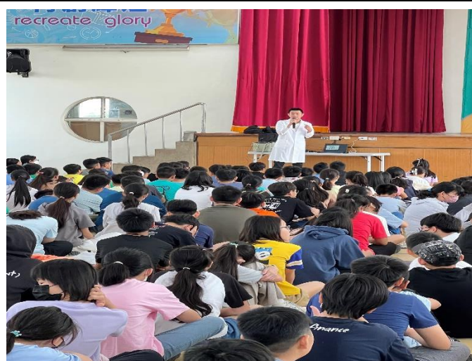
結合當地診所辦理衛教宣導