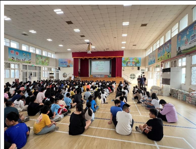
結合當地診所辦理衛教宣導