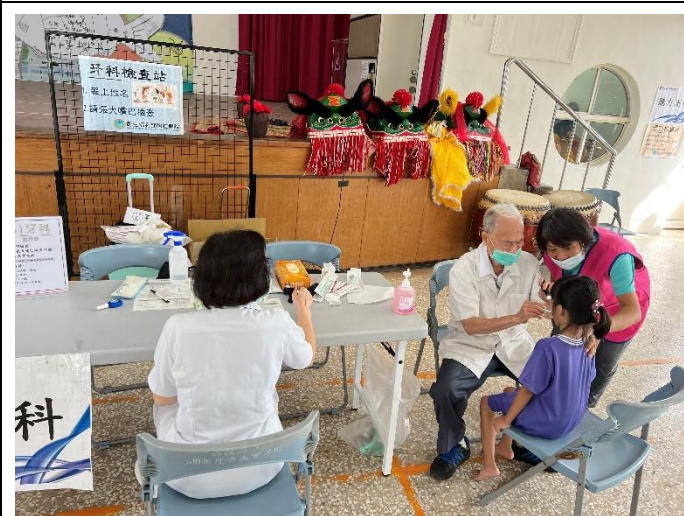
配合局端政策學生 健康檢查