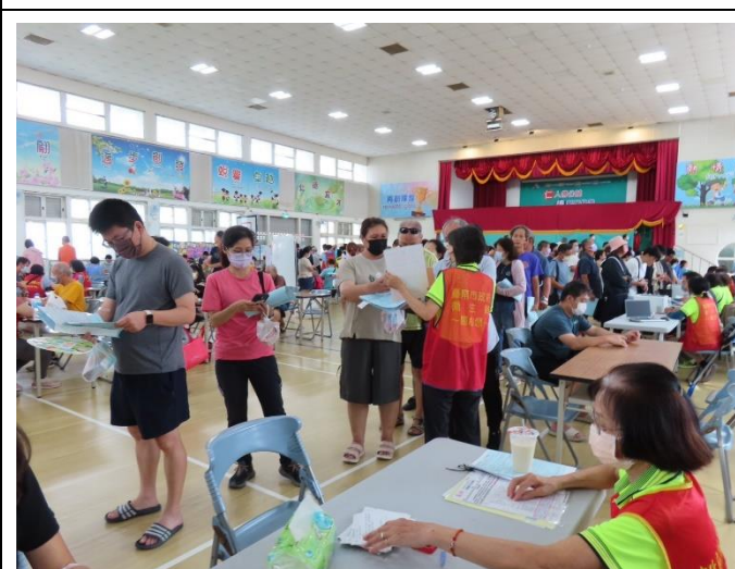
配合衛生所提供民眾到校建檢服務