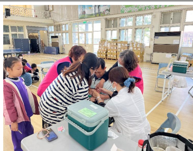
配合局端政策 Covid-19 疫苗施打