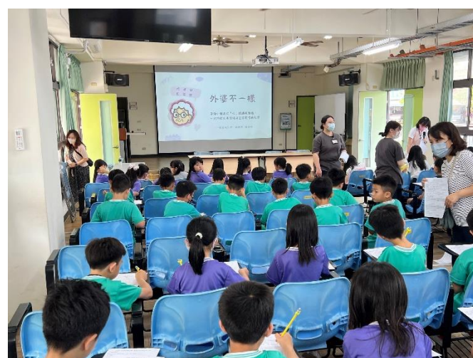
結合當地衛生所辦理衛教宣導