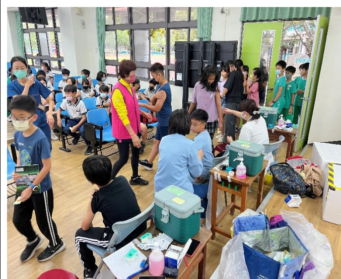
配合局端政策 流感 疫苗施打