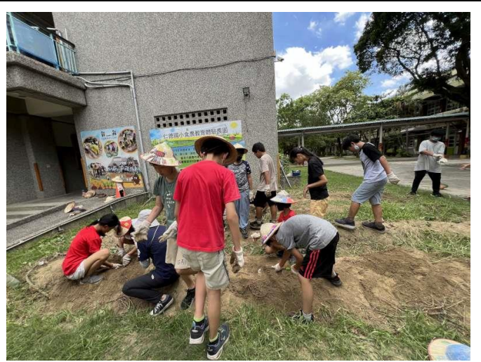
學生實地採收番薯