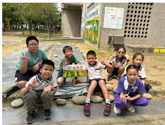
學生實地感受種植南瓜樂趣