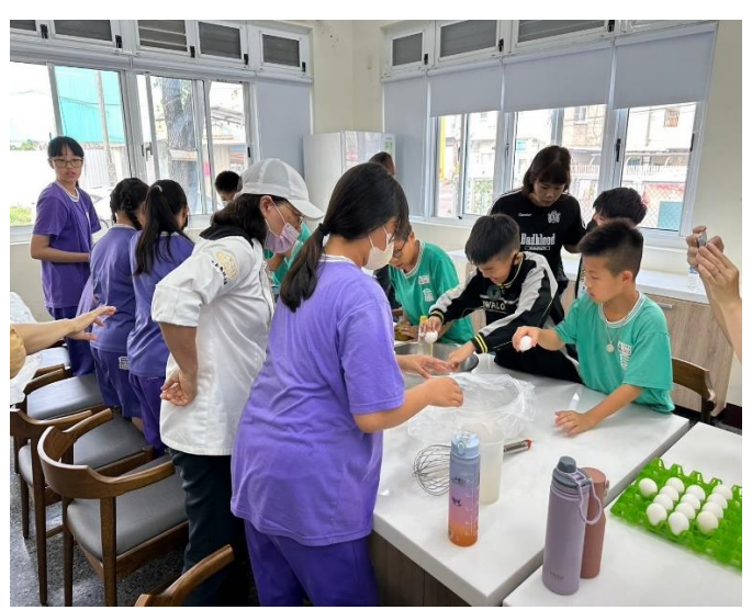
採收後的番薯進行烹調