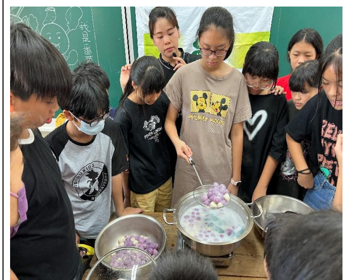
採收後的番薯進行烹調