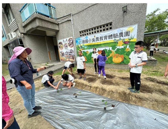
學生實地感受種植南瓜樂趣