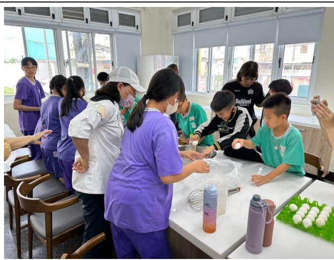
採收後的南瓜進行烹調