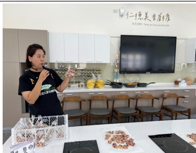
農會老師對採收後的南瓜進行烹調教學