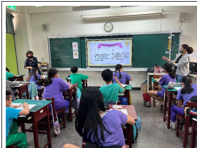
農會派人入班講解說明