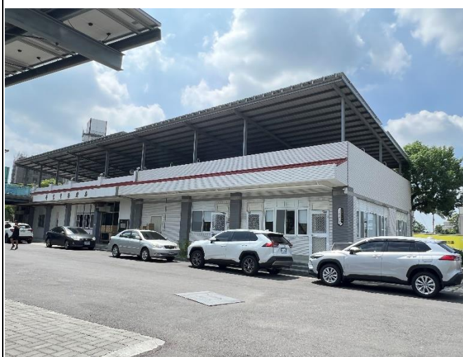
太陽光電午餐廚房