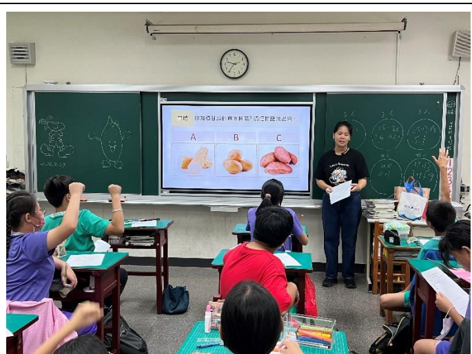
農會派人入班講解說明