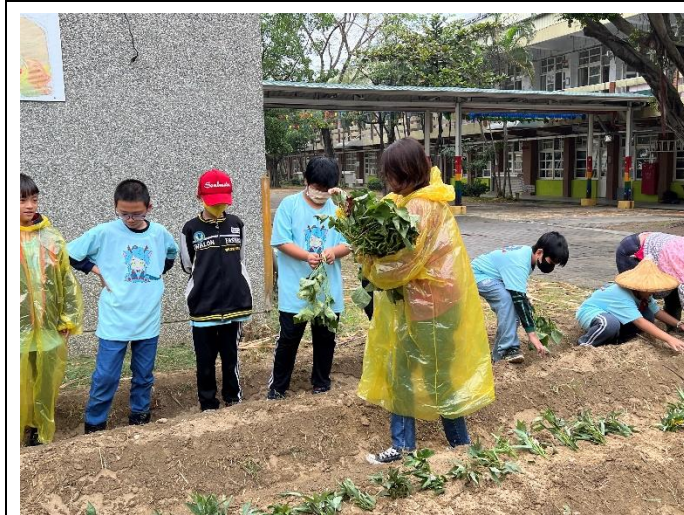
學生實地感受種植番薯樂趣