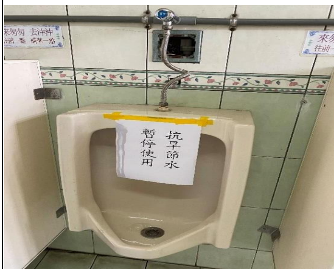
缺水時期，縮減小便斗的使用以節約用水