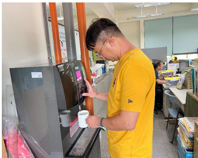
老師飲水機裝飲用水