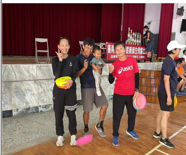
老師飛盤比賽合影