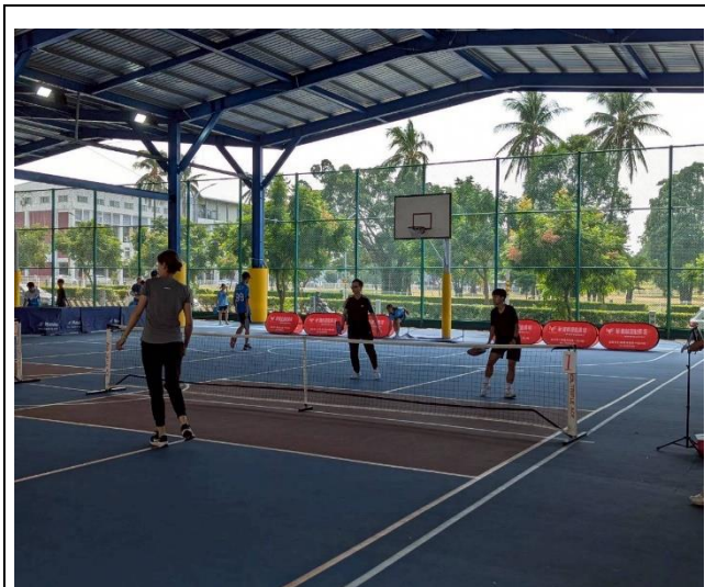
老師匹克球比賽過程