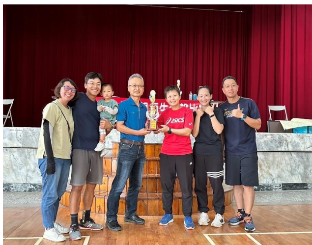
老師飛盤比賽團體獲獎