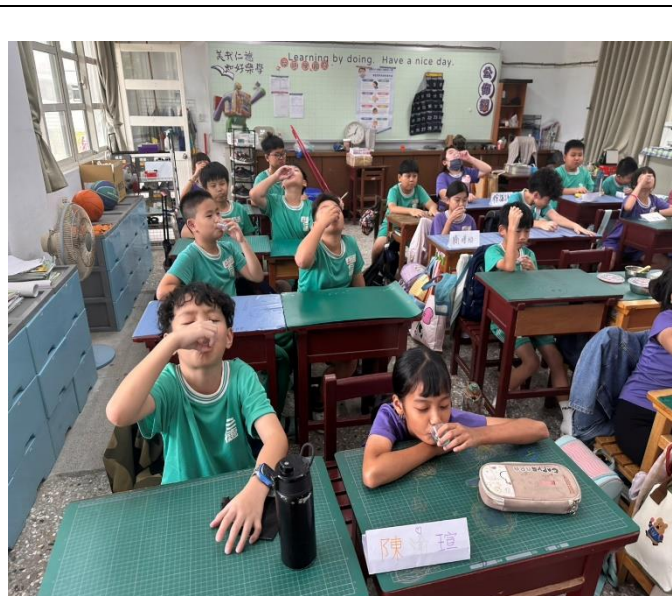
學生確實做到含氟漱口水-保護牙齒