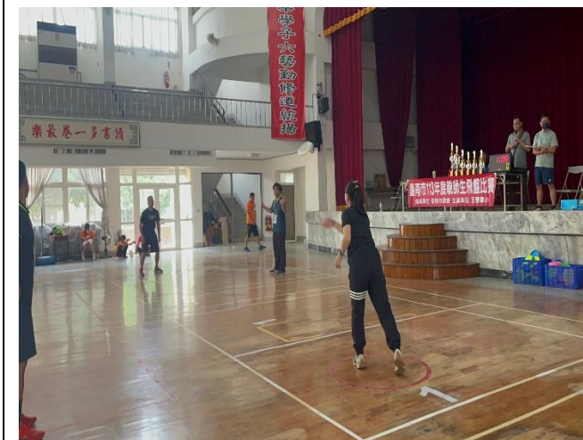
老師飛盤比賽過程