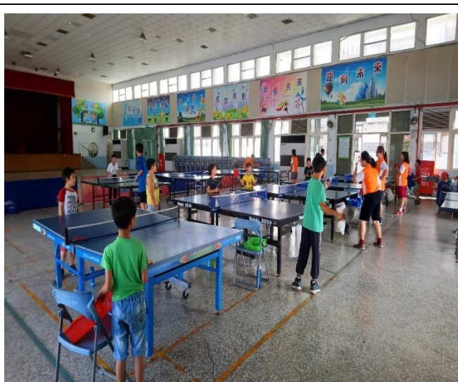
老師們一起加入桌球運動的行列