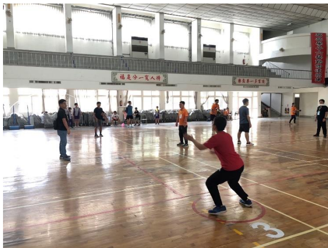
老師飛盤比賽過程