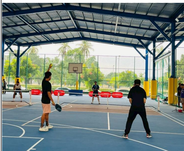
老師匹克球比賽過程