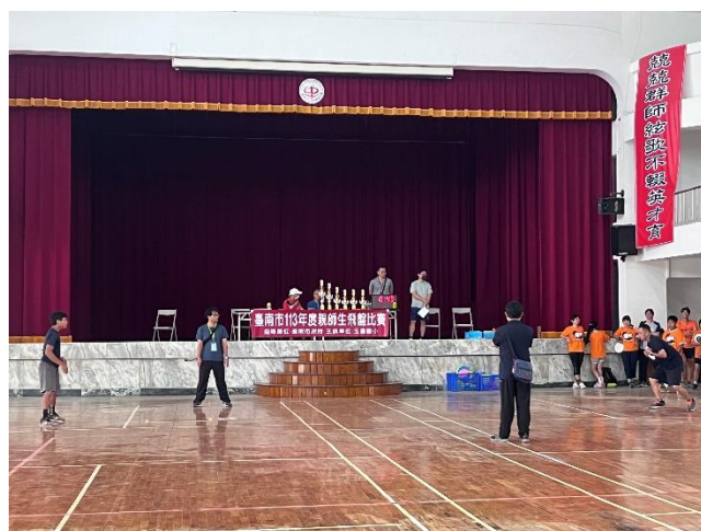
老師飛盤比賽過程