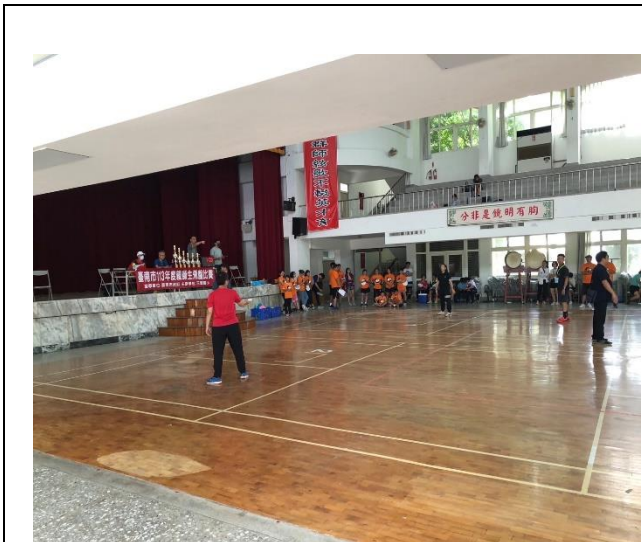
老師飛盤比賽過程