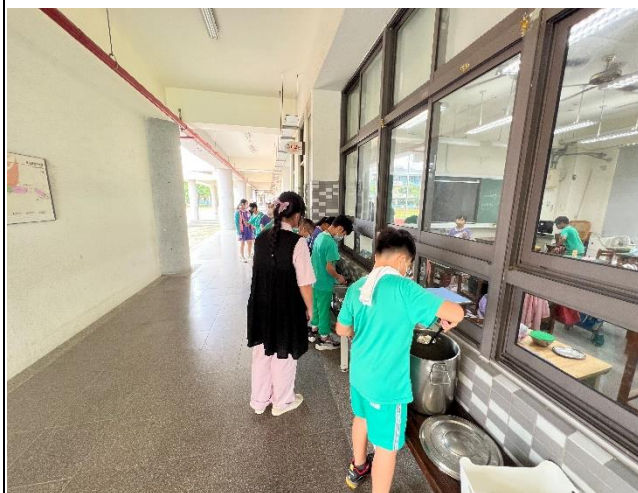
老師指導學生依序打飯菜