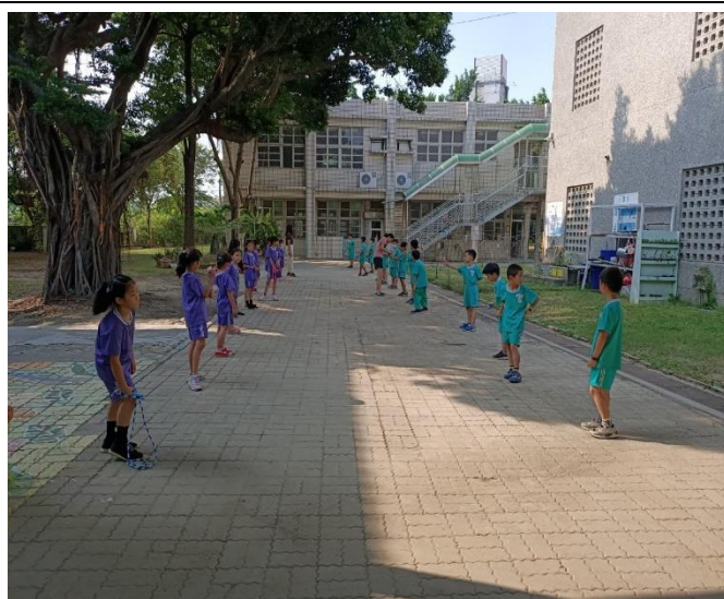
老師親自示範跳繩教學