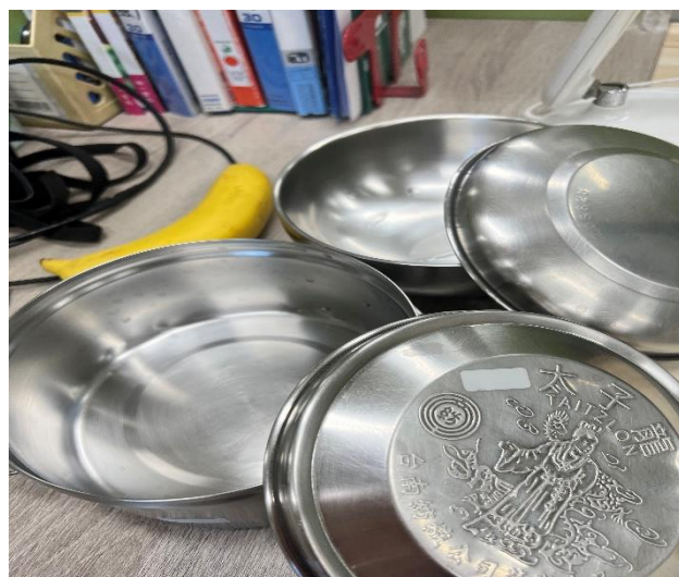
老師將成的食物吃完