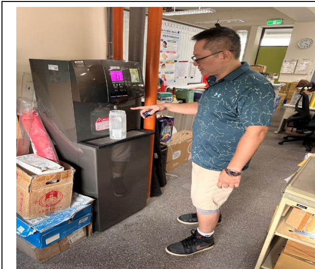
老師飲水機裝飲用水