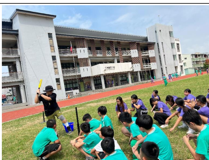
體育老師示範樂樂棒擊球姿勢