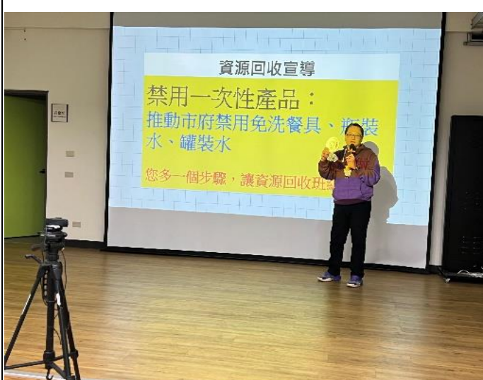
於學生朝會透過 Meet 向全校師生宣導