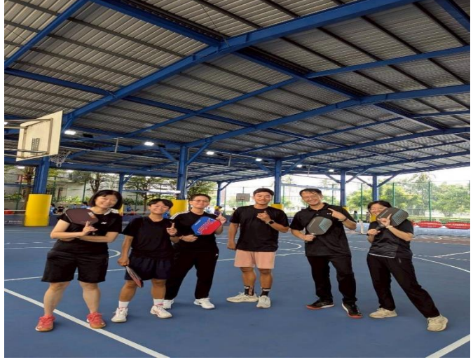
老師匹克球賽後合影