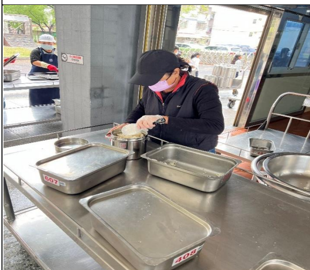
提供盛裝剩餘白飯，食物不浪費