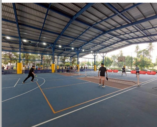
老師匹克球比賽過程