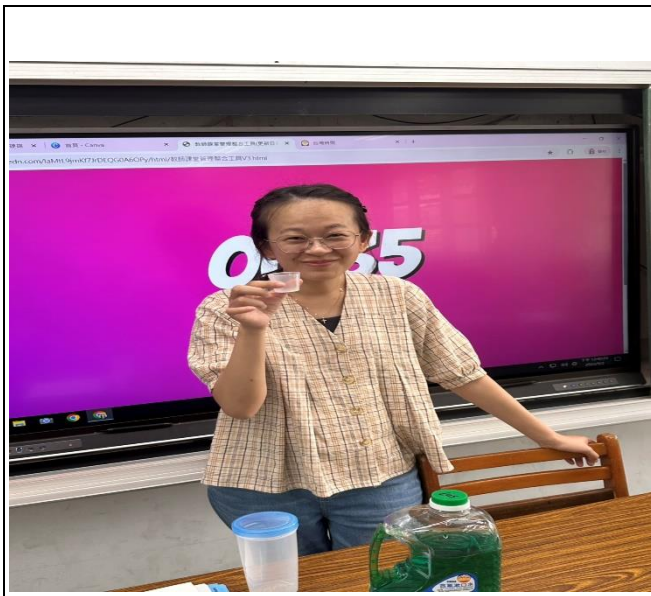
老師推行含氟漱口水