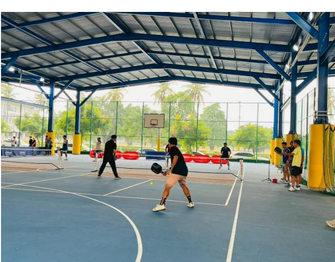
老師匹克球比賽過程