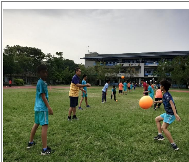
體育課示範教學並與孩子一同練習