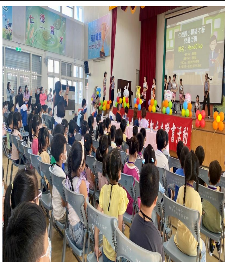
辦理新生暨親職教育講座-宣導健促議題