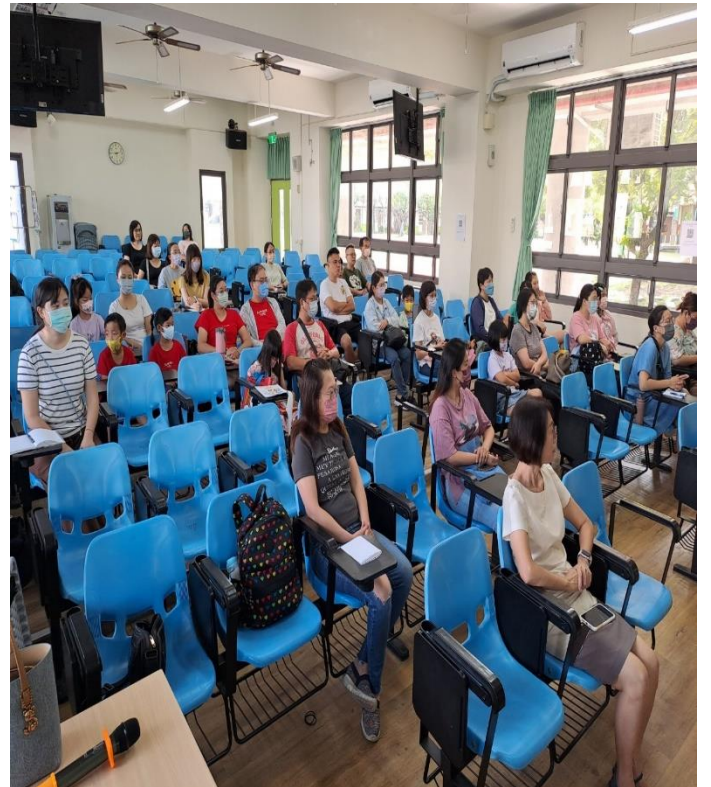
辦理親職教育講座-性別平等