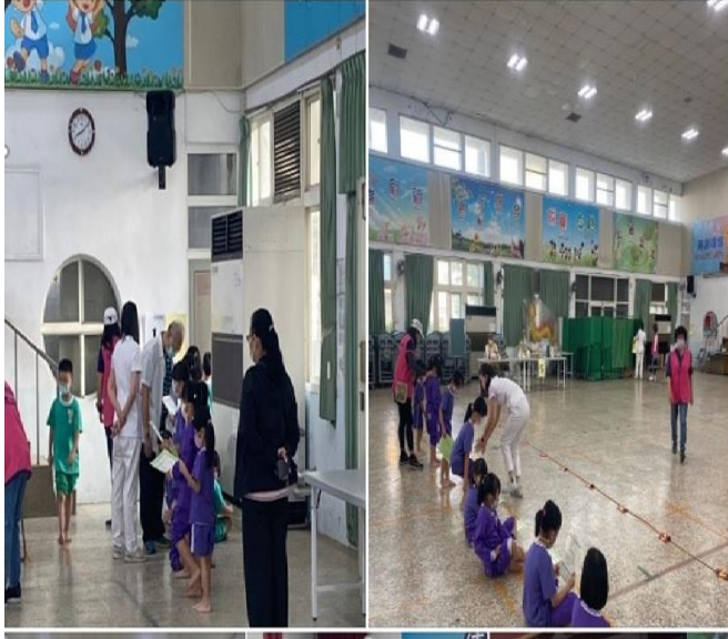
臉書發佈健康檢查資訊

醫院到校進行一、四年級健康檢查(市府招標)。 感謝保健中心護理師、學務處衛生組與班級導師密切合作與安排。 感謝總務處協助場地布置。 感謝輔導室與志工團協助的大哥大姐引導學生動線與秩序。(有聽力、四肢、牙科、家醫科、內診、心電圖)..... 查看更多