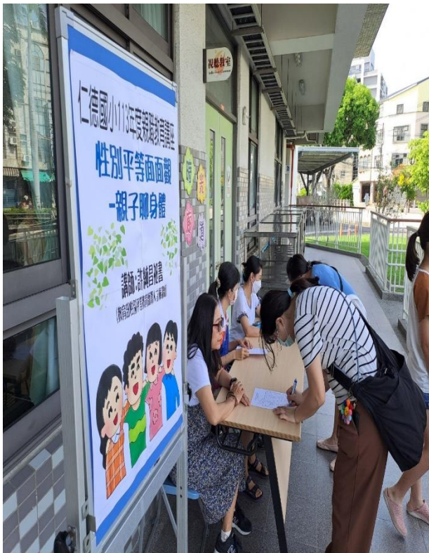
辦理親職教育講座-性別平等