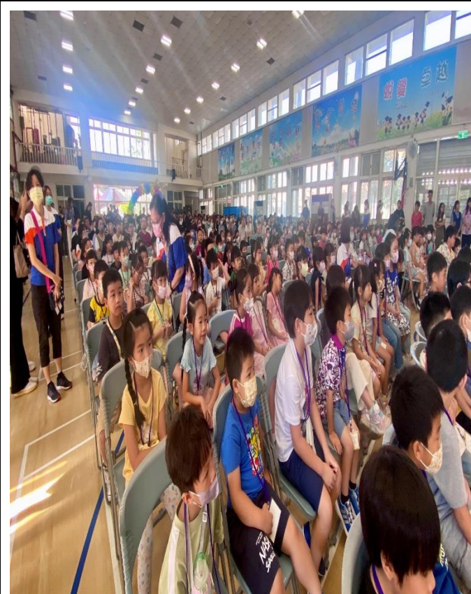
辦理新生暨親職教育講座-宣導健促議題