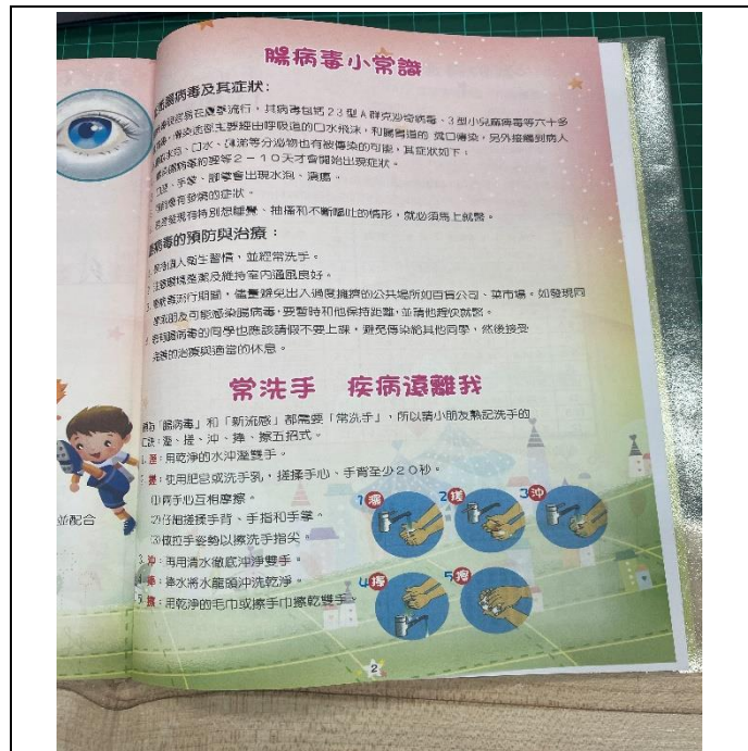
說明：聯絡簿健康資訊