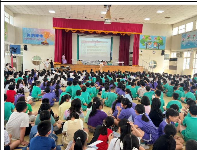
學校朝會向師生宣導愛滋相關議題