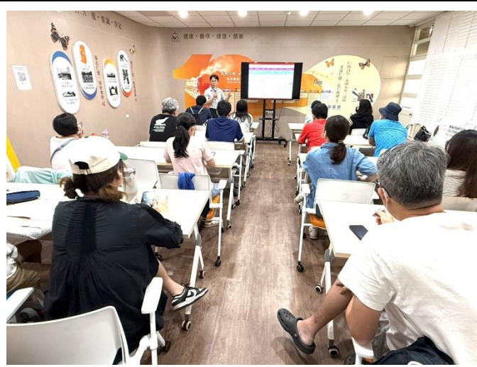
辦理家長性別課程宣導(性別繪本)