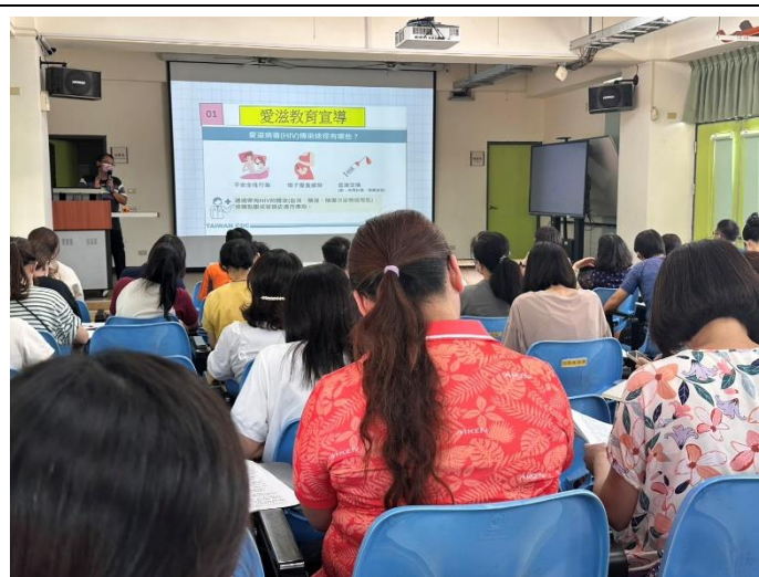
教師會議宣導愛滋相關議題