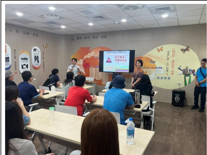
辦理家長性別課程宣導(性別繪本)