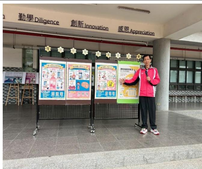
學校朝會宣導性平及性剝削議題