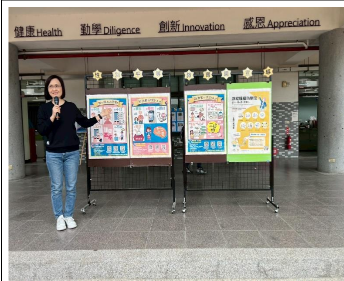
學校朝會宣導性平及性剝削議題