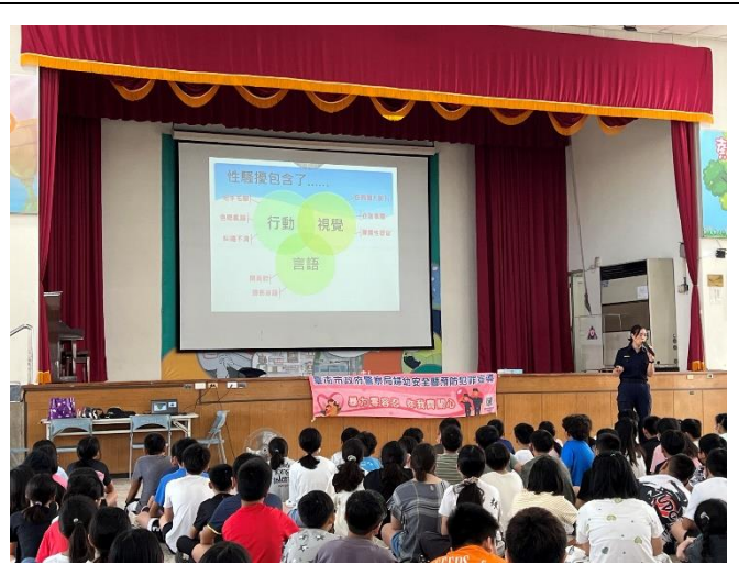
邀請警官入校宣導性別意識議題