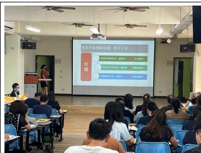
向全校老師宣導性平三法等議題