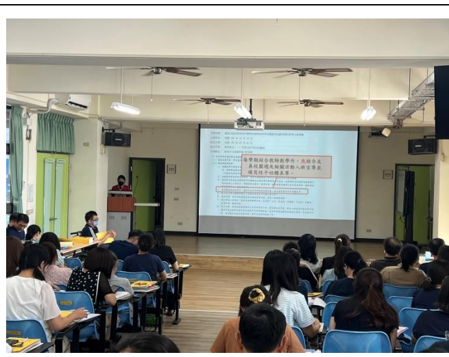
向全校老師宣導性平三法等議題