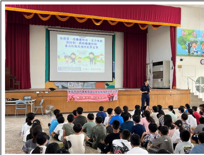
邀請警官入校宣導性別意識議題