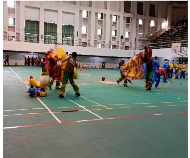
鼓勵參加校隊-客家獅