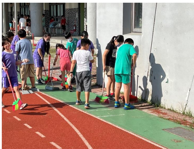
中年級清淨家園，營造乾淨的環境