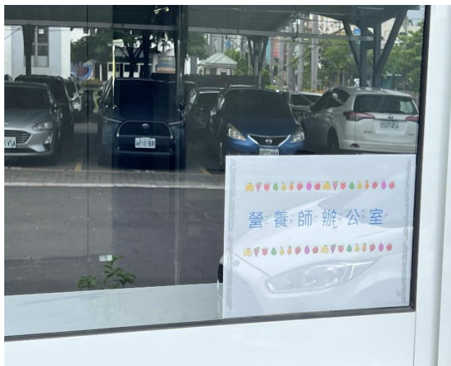
午餐中央廚房引進營養師