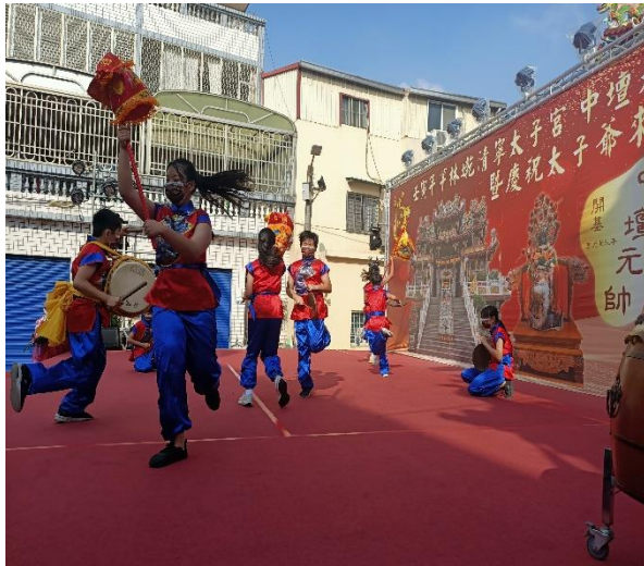
鼓勵參加校隊-跳鼓陣