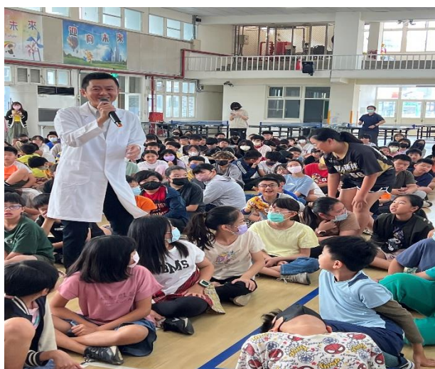
醫師入校進行營養教育及青春期宣導