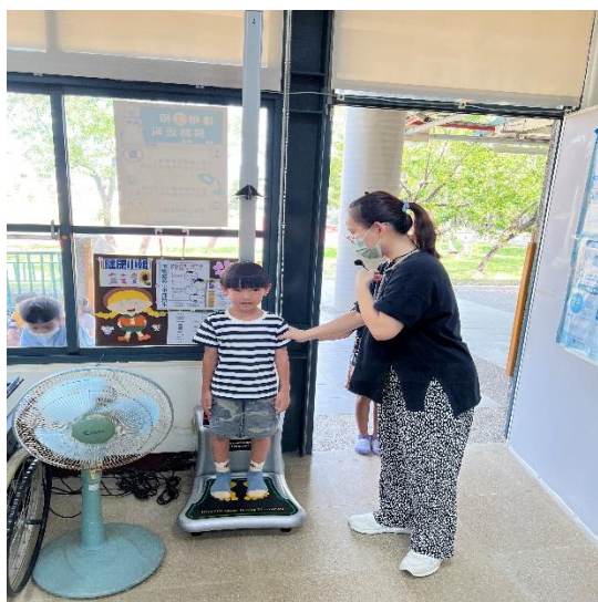
測量學生身高、體重