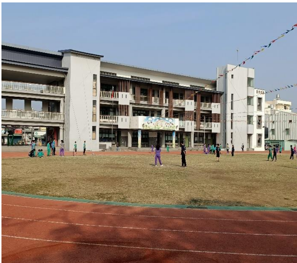
辦理健促活動-樂樂棒球比賽