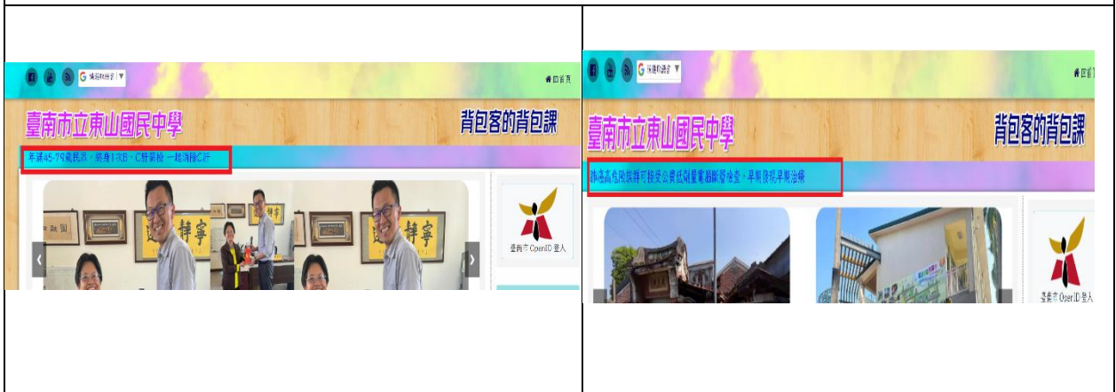
學校網站跑馬燈傳遞施打流感疫苗、肝炎篩檢及低劑量肺部電腦斷層篩檢