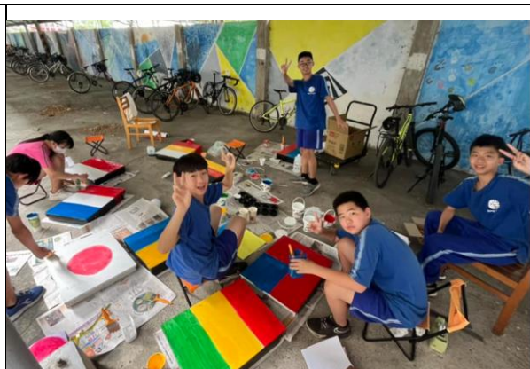
在美術課程上讓孩子進行美感體驗