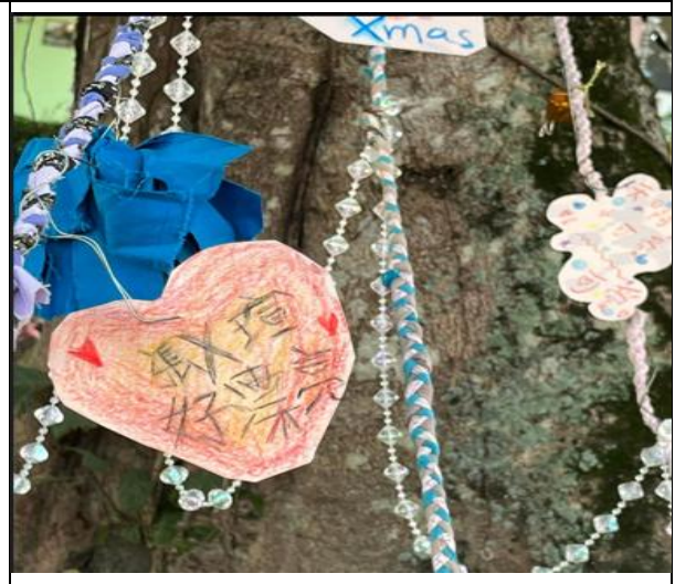
聖誕節美學社校園情境佈置進行感恩謝卡活動