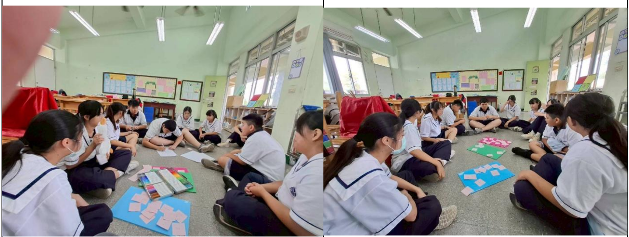
學生探討主題過程互動