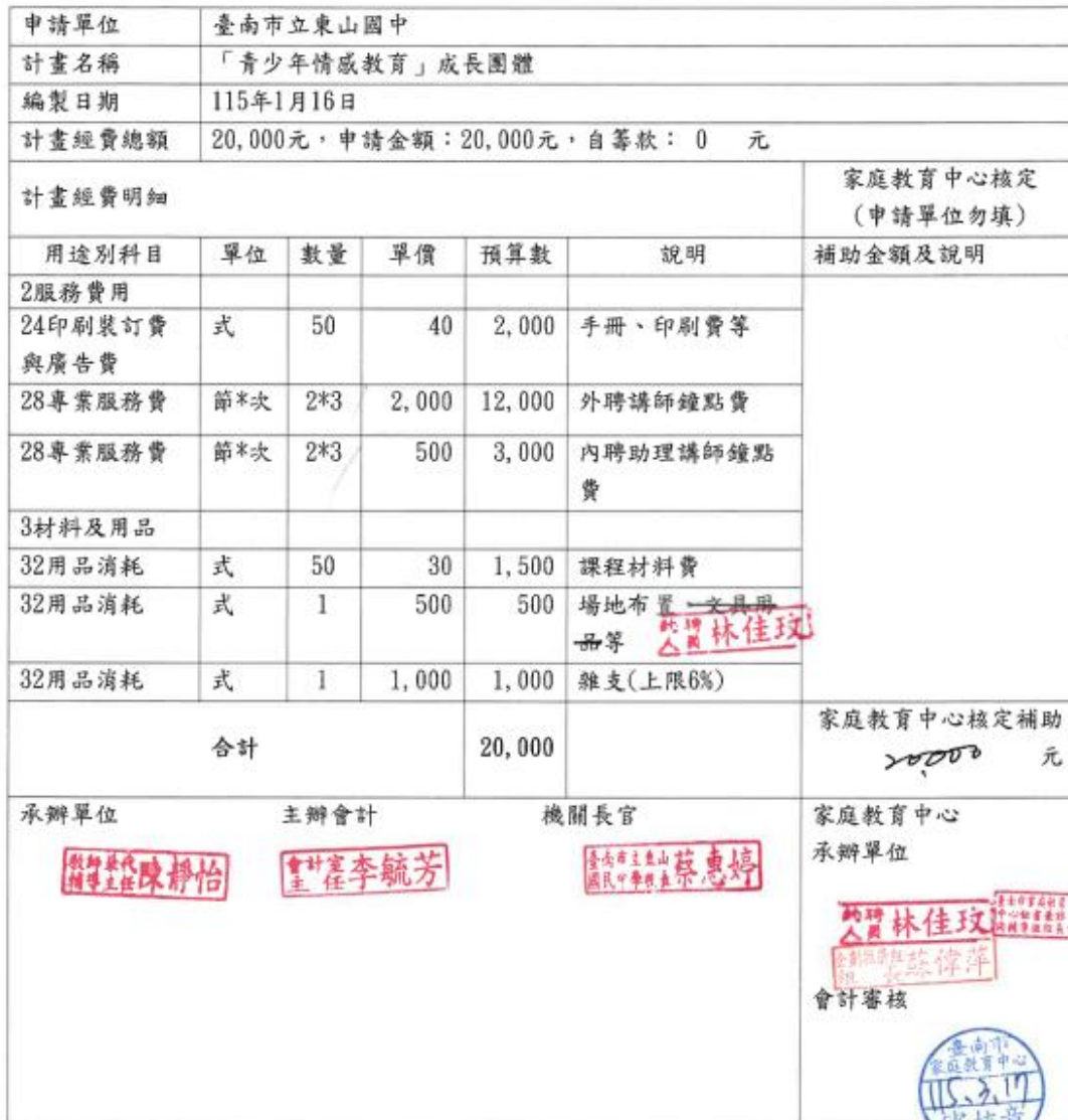
臺南市家庭教育中心補助或委辦經費概算表