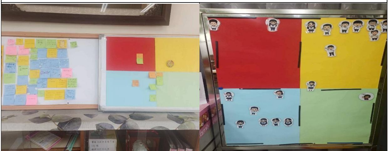
位於校長室與班級教室之情緒覺察色卡表