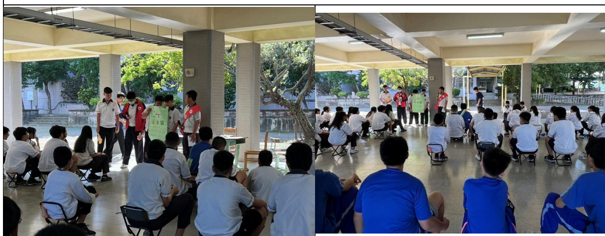
各班政見發表與助選員宣傳