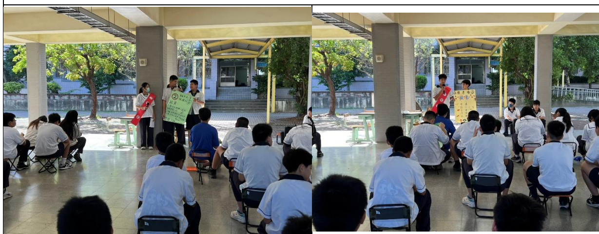
各班政見發表與助選員宣傳