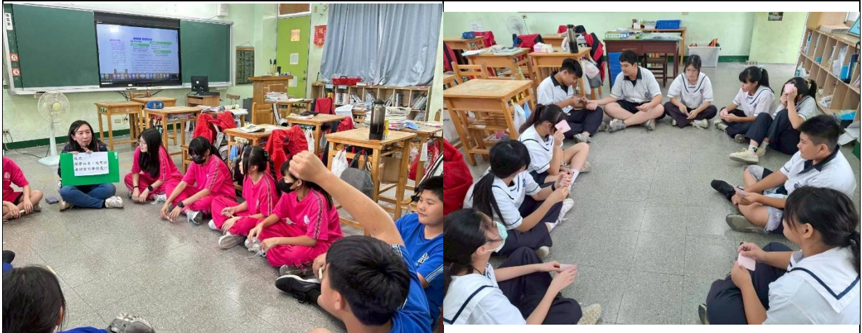
透過班會課，教師與學生探討主題