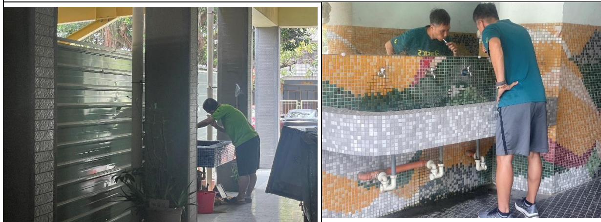
教職員飯後進行潔牙活動