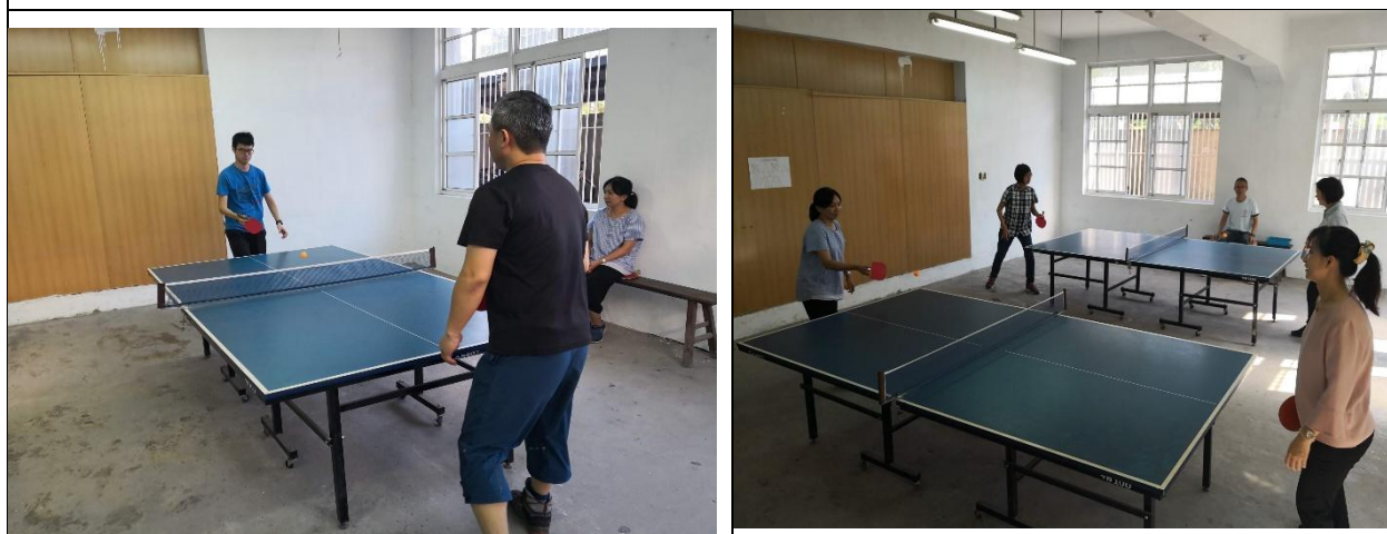
教職員桌球比賽男女循環賽