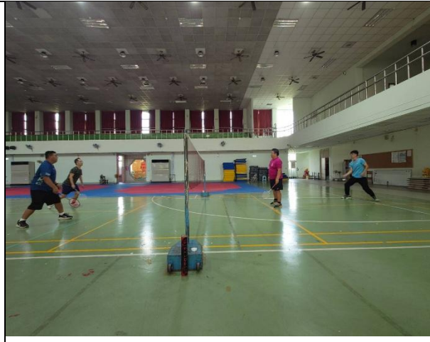
課餘教職員利用下午時間進行羽球運動