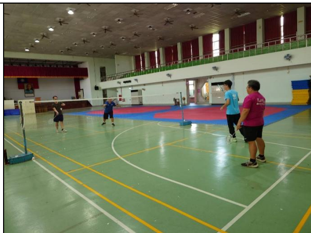
課餘教職員利用下午進行羽球運動