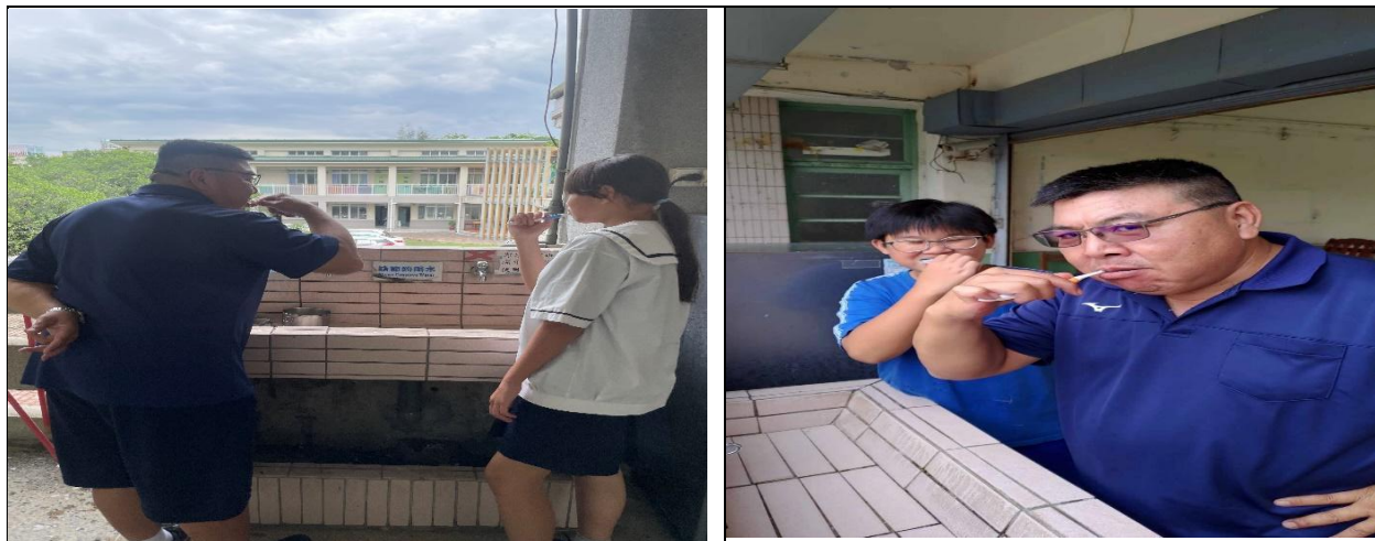
師生飯後進行潔牙活動