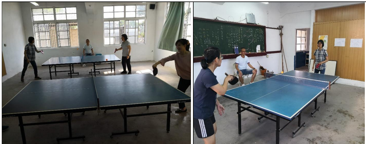
教職員桌球比賽男女循環賽