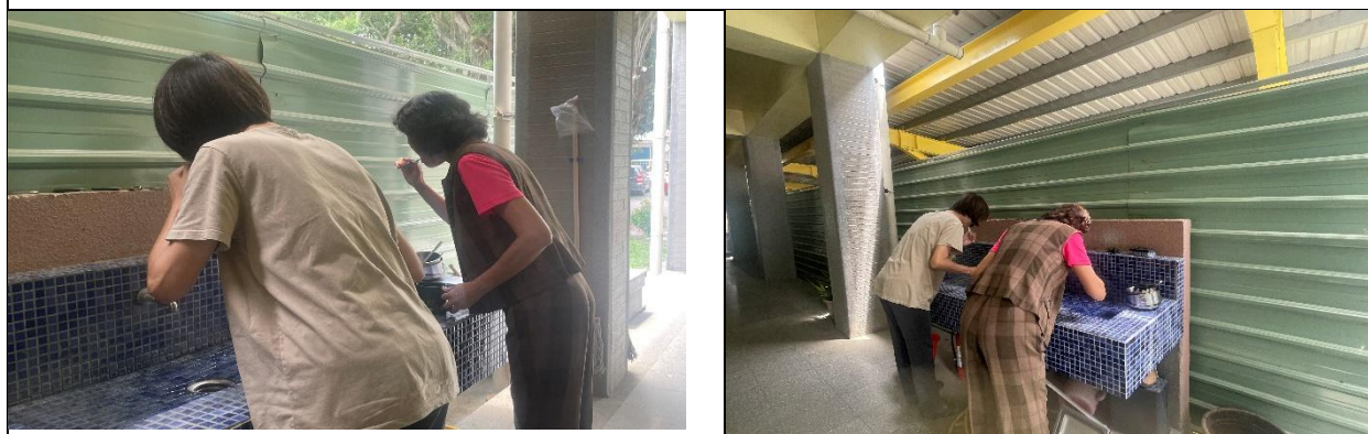
教職員飯後進行潔牙活動