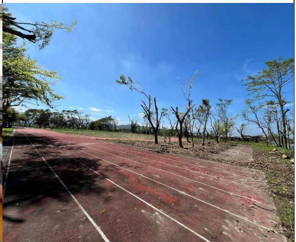
地震災後心理陪伴—愛與希望藝術相陪