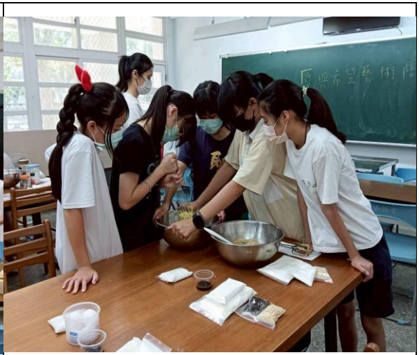
地震災後心理陪伴—愛與希望藝術相陪