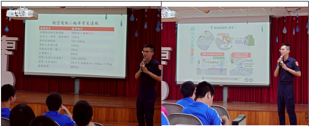
警察單位入校宣導