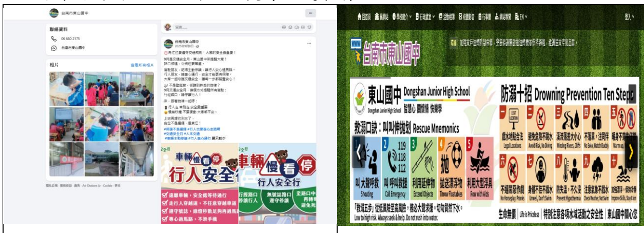
學校網頁交通安全宣導