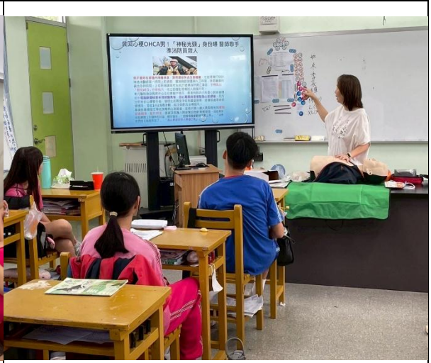
急救教育及護理師指導