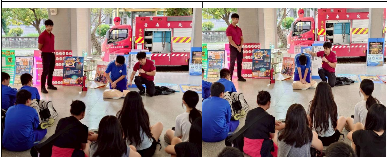
CPR與基本急救知識宣導與實際演練