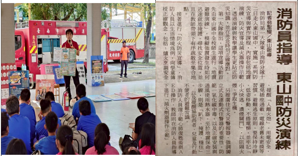
消防隊入校宣導及防災演練